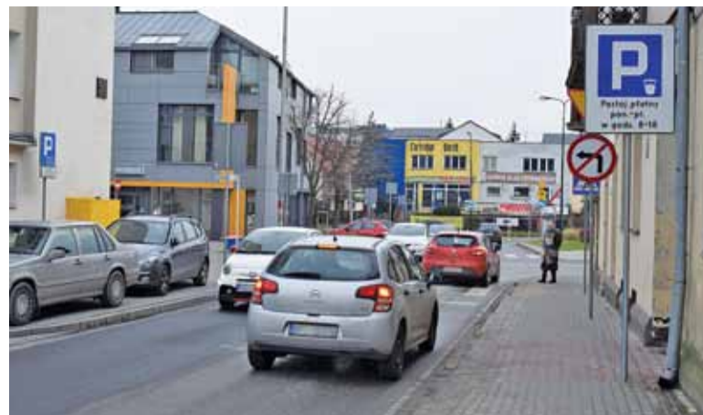
Postawienie znaku w przestrzeni przeładowanej znakami, może spowodować, że go nie zauważymy