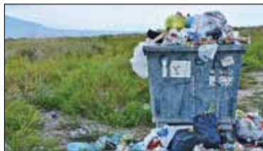
|| Lesznowola - Rewolucja śmieciowa