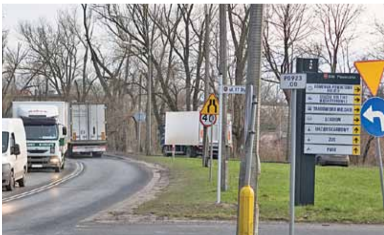
Aż trzy błędne kierunki (ZUS, PWiK, US) pokazuje tablica przy DK79 u wylotu ul. 17 stycznia.