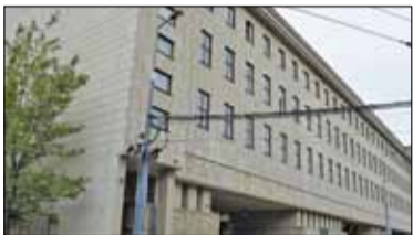
|| Konstancin-Jeziorna - Posiedzi ćwierć wieku

PIASECZNO || GÓRA KALWARIA || KONSTANCIN-JEZIORNA || LESZNOWOLA || PRAŻMÓW || TARCZYN