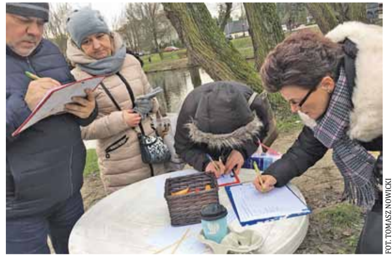
Zdjęcie z sobotniej zbiórki podpisów