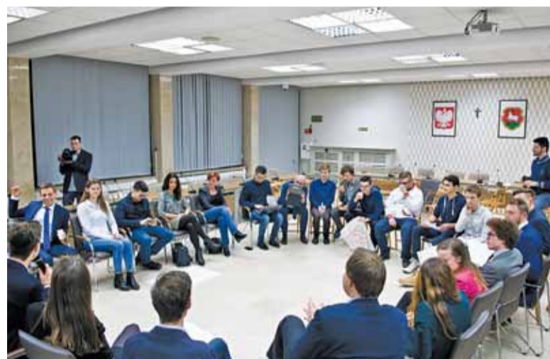
Efekty pracy w grupach tematycznych opiniowali wszyscy uczestnicy debaty

– Zgadzam się absolutnie, że młodzieżowe rady powinny mieć możliwość podejmowania inicjatyw uchwałodaw-