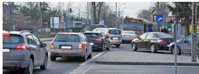
Skrzyżowanie wymaga wzmożonej uwagi i cierpliwości