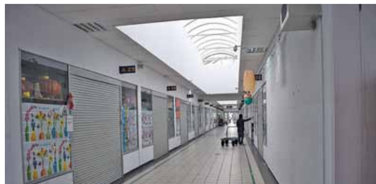
Wólka Kosowska świeci dzisiaj pustkami