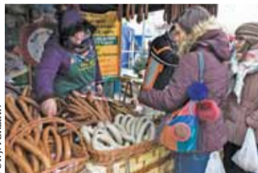
Swojskie wędliny na świąteczny stół cieszyły się dużą popularnością

Jak co roku, w okolicach Mikołajek, na piaseczyńskim Rynku pojawiły się kramy świątecznego kiermaszu, a na nich wszystko, co niezbędne na święta – od swojskich wędlin, przez lokalne