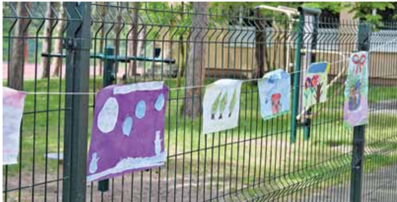
Prace dzieci z Linina, prezentowane z okazji Dnia Otwartego w Ośrodku w maju 2017 roku