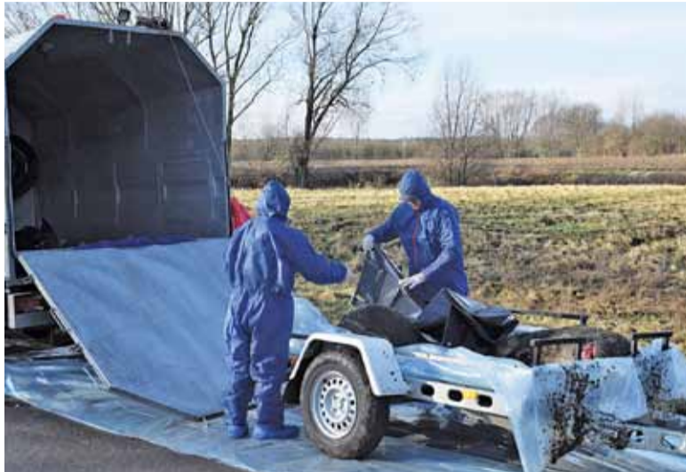
Wszystko odbyło się z zachowaniem wszelkich środków ostrożności