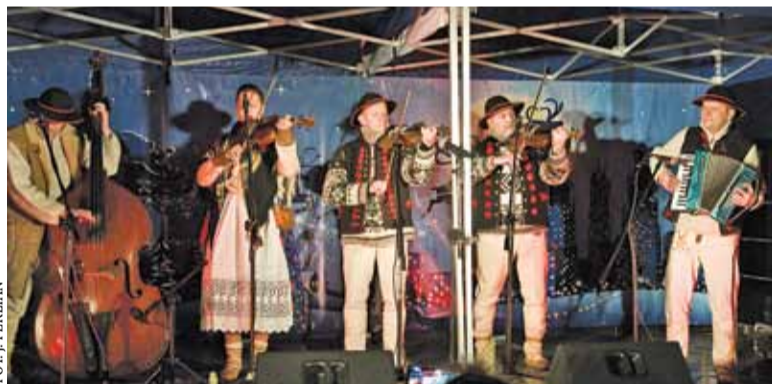
Wystąpiła Kapela Górska Beskid

miody i wina, aż po różnego rodzaju dekoracje i oryginalne, rękodzielnicze upominki pod choinkę. Najmłodszy mogli też upiec i ozdobić swoje własne pierniki, zrobić oryginalną kartkę świąteczną lub zmierzyć się wraz z rodzicami z zadaniami gry miejskiej. Punktem kulminacyjnym było oczywiście odpalenie