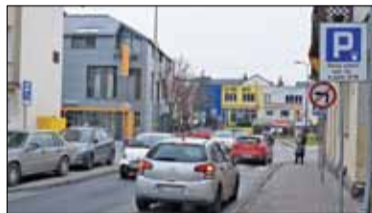
|| Piaseczno - Gdzie jest strefa?