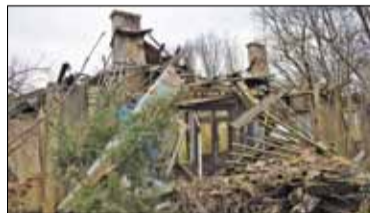
|| Konstancin-Jeziorna - Dworu już nie ma