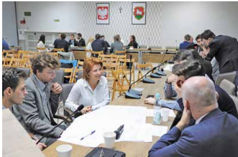
Dyskusje w grupach bywały burzliwe