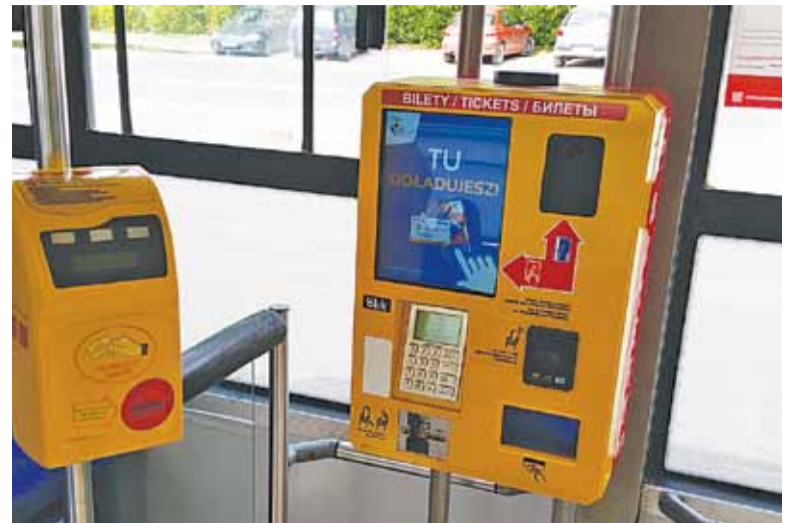
Za bilet tylko kartą