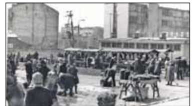
|| Historia - Piaseczno w aktach IPN