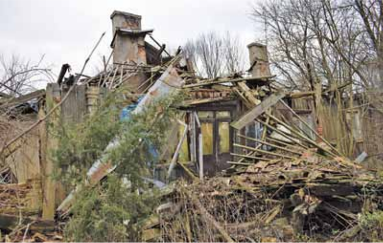
Modrzewiowy dwór w Turowicach zakończył swój żywot. Zostały po nim trzy kominy i front