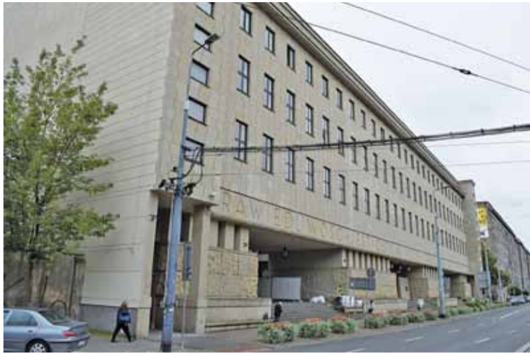
Sąd Okręgowy skazał „Bukaciaka” na 25 lat więzienia

Zaczął 20 lat temu. Najpierw były kradzieże, włamania, rozboje i narkotyki. Później przeszedł w zabójstwa i porwania dla okupu, a także ułatwianie uprawiania prostytucji (tzn. pobierał pieniądze od prostytutek na drodze nr 50 koło Kołbieli za ochronę). Stał przed sądem ponieważ prokuratura zarzuciła mu popełnienie 22 przestępstw. „Bukaciak” współpracował. Ujawniał śledczym nieznanne im fakty, przy-