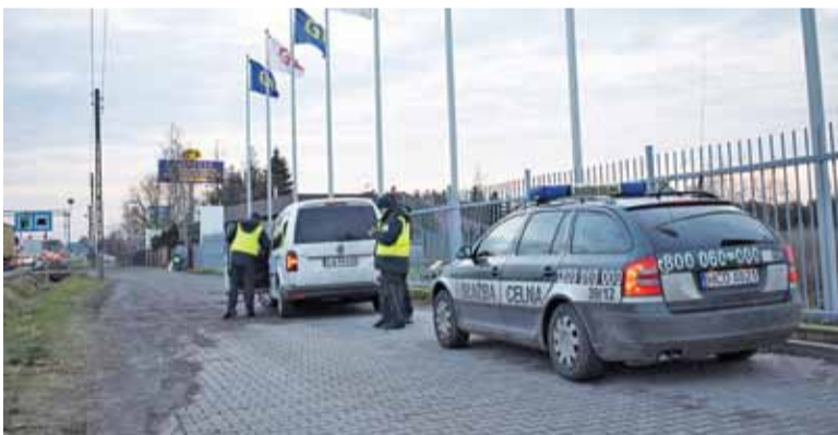
Służba celno-skarbowa stoi w Wólce 24 godziny na dobę, od początku miesiąca