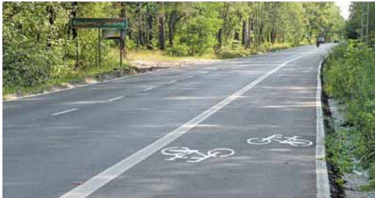
5 milionów złotych zostanie przeznaczonych na ścieżki rowerowe

Ustalone dochody wynoszą w zaokrągleniu 135 milionów zł, wydatki zaś zaplanowano na kwotę 140,5 miliona zł. Różnica między dochodami i wydatkami stanowi planowany deficyt