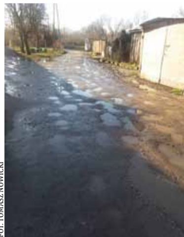
Dziur na ulicy Słowiczej nie udało się wyeliminować

Niewykluczone, że niedługo na ulicy Słowiczej pojawi się asfalt, o co apeluje radny.