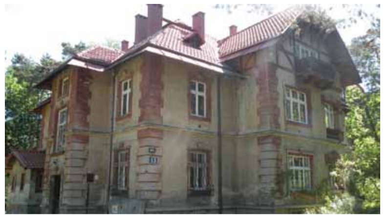
Samorząd wyremontuje konstancińskie wille