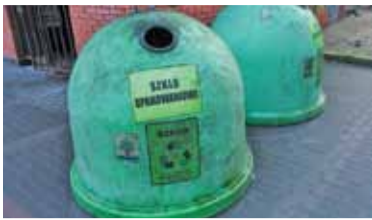
Za śmieci zapłacimy więcej