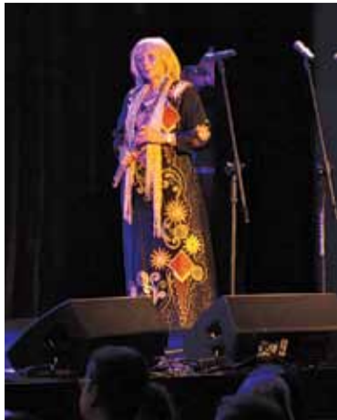
Na koncercie wystąpiła również mama artystki

– Dzisiejszy koncert jest wyjątkowy dla nas, pracowników, i dla państwa również będzie. Artystka, która dzisiaj wystąpi, jest lubiana przez nas, można powiedzieć nawet, że kochana. Otworzyła nam sezon artystyczny w 2017 roku, zgodziła się jeszcze raz dla nas zagrać, ale dzisiaj przygotowała niespodziankę. Wystąpi ze swoją rodziną – zapowiedziała artystkę Dyrektor