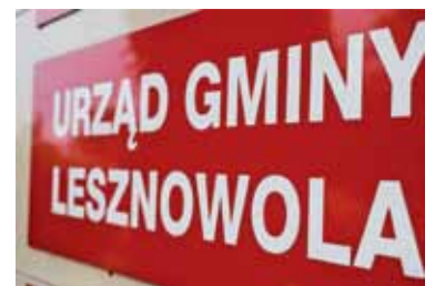
Sąd uznał, że Stowarzyszenie Kwiryta naruszyło dobra osobiste gminy

Sąd oddalił jednak powództwo gminy w punkcie dotyczącym nakazania pozwanemu Stowarzyszeniu zaniechania dalszych działań zagrażających dobrom osobistym powodowej gminy. Stwierdził że nie może zakazywać publikacji, ale wyraził nadzieję, że orzeczenie,