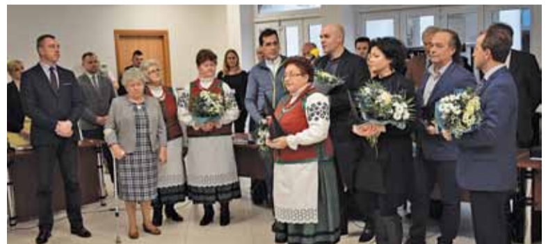
Zaangażowani w odkrywanie Wisły otrzymali Nagrody Powiatu Piaseczyńskiego