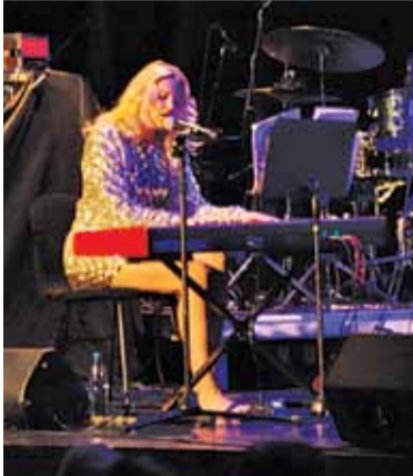
Maria Sadowska w Hugonówce

Wokalistka zaśpiewała autorskie pastorałki z wydanej kilka lat temu płyty.