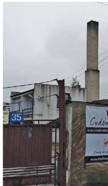
Co tam jest palone?

Gmina Lesznowola informuje, że pracownik Referatu Ochrony Środowiska i Rolnictwa po zgłoszeniach telefonicznych mieszkańców przeprowadził kontrolę posesji w zakresie spalania materiału grzewczego w piecu węglowym w dniach 7 listopada 2014 r., 14 grudnia 2016 r., 20 lutego 2017 r. i 4 grudnia 2017 r. Wszystkie kontrole były niezapowiedziane. We wszystkich dniach kontrola wykazała, że w piecu węglowym spalany jest wę-