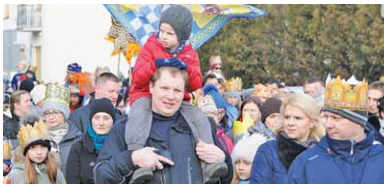
Najmłodszy zawsze mogą liczyć na najlepszą „miejscówkę”