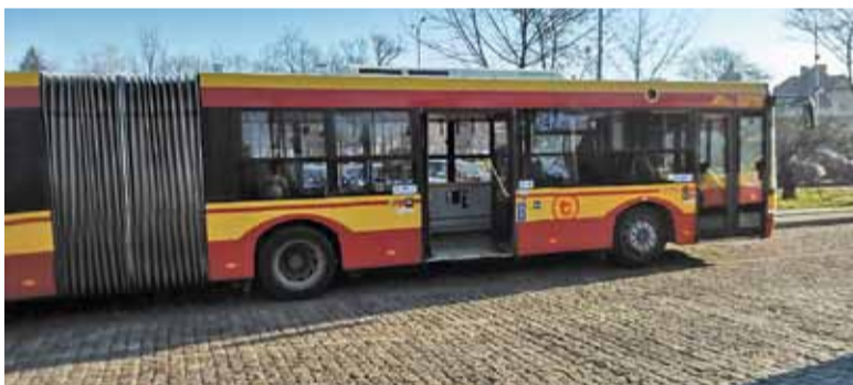
Pętla w Wilanowie, gdzie zatrzymuje się 742