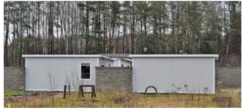
Schronisko formalnie jest jeszcze placem budowy