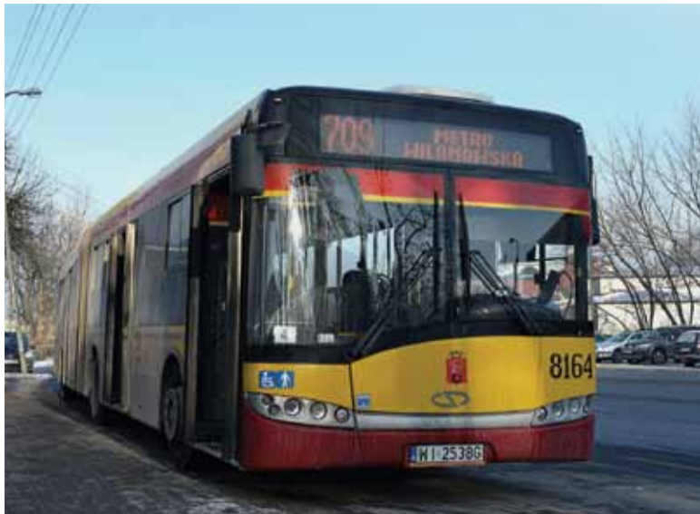
ZTM nie planuje poszerzenia I strefy o gminy „kolejowe”, a taką jest Piaseczno