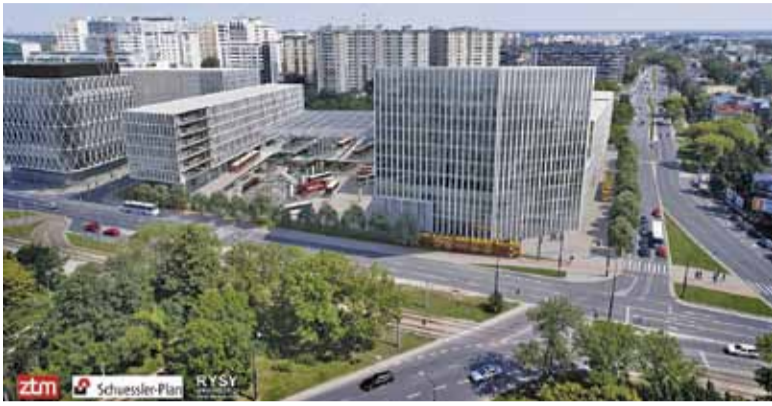
Koncepcja maksymalna przewiduje ogromną powierzchnię biurową