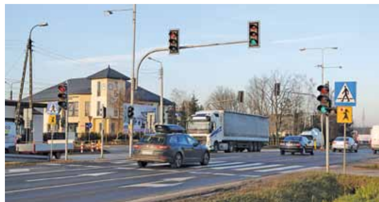
Jeden z budynków szkoły bezpośrednio sąsiaduje z „awaryjnym” skrzyżowaniem

03.01.2018 Piaseczno, ul. Pod Bateriami – otrzymaliśmy zgłoszenie do błakającej się młodej suki z cieżką w typie owczarka niemieckiego. Suka została odwieziona do schroniska na Paluchu.