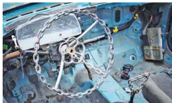
Przeróbki niektórych wraków wchodzą już na poziom sztuki

Zawodnicy przy przerabianiu swoich samochodów nie zapomnieli o WOŚP