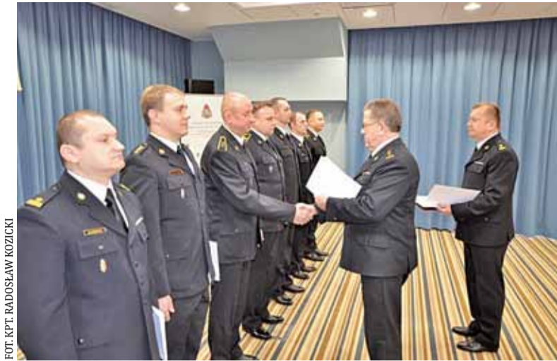
Komendant główny PSP wręcza nagrody strażakom