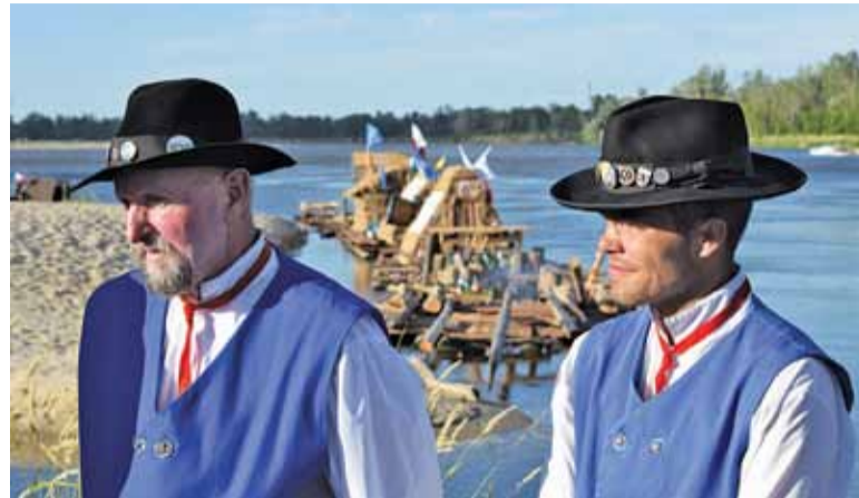
Ulanowscy flisacy w Gassach