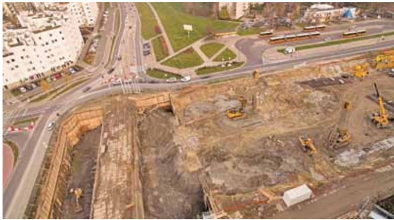
Drogowcy odkopali tunel metra