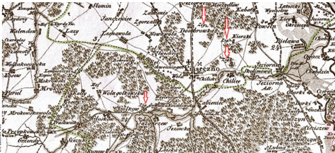
Mapa okolic Piaseczna z zaznaczonymi cegielniami