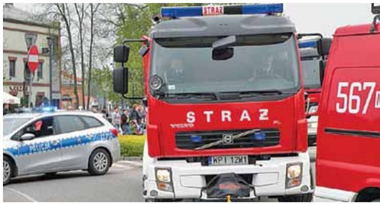
Straż pożarna czuwa nad bezpieczeństwem mieszkańców