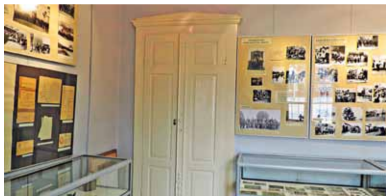
Szafa ścienna w starej plebanii