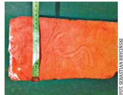
Cegła z tajemniczym napisem

zapakowane i tymczasowo złożone w magazynie gminy. Zostaną wyeksponowane w nowej plebanii. Została też zachowana szafa ścienna, wykuta z ościeżnicą (ilustracja nr 2). Miejmy na-