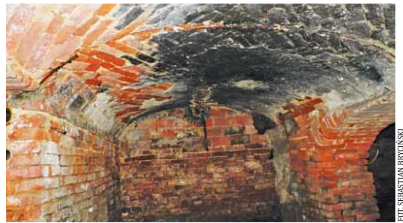
Zdjęcie piwnic pod plebanią

Zwiedzając dzisiejszy plac budowy, zesłaliśmy do piwnic plebanii i to, co zobaczyliśmy, bardzo nas zaskoczyło. Po-