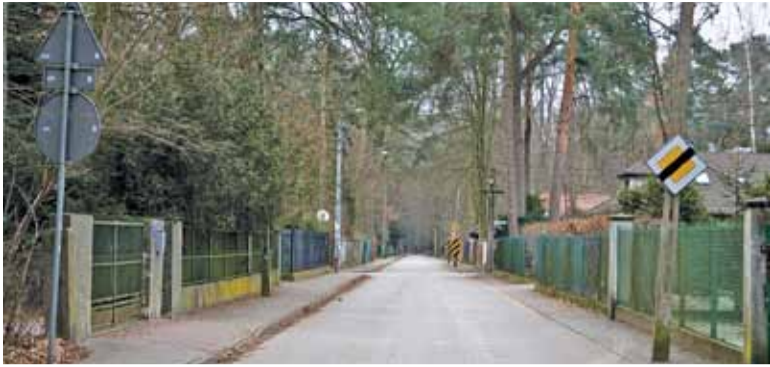
Jedyny znak znoszący pierwszeństwo w ul. Modrzewiowej pojawił się po interwencji mieszkańca