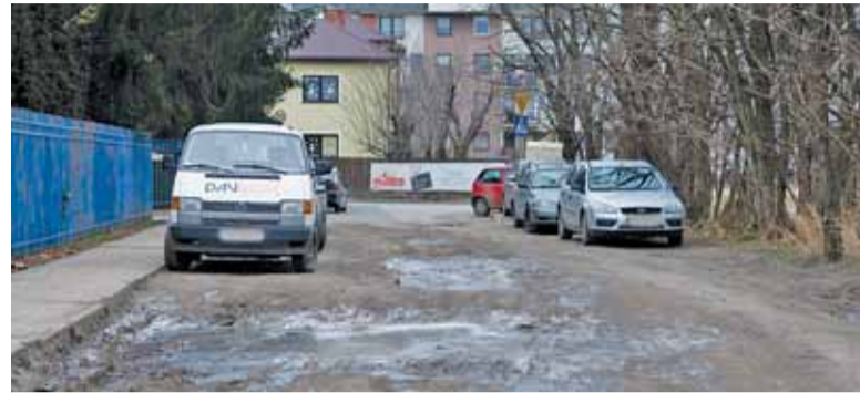
W niektórych miejscach dziury mają po kilkanaście centymetrów głębokości