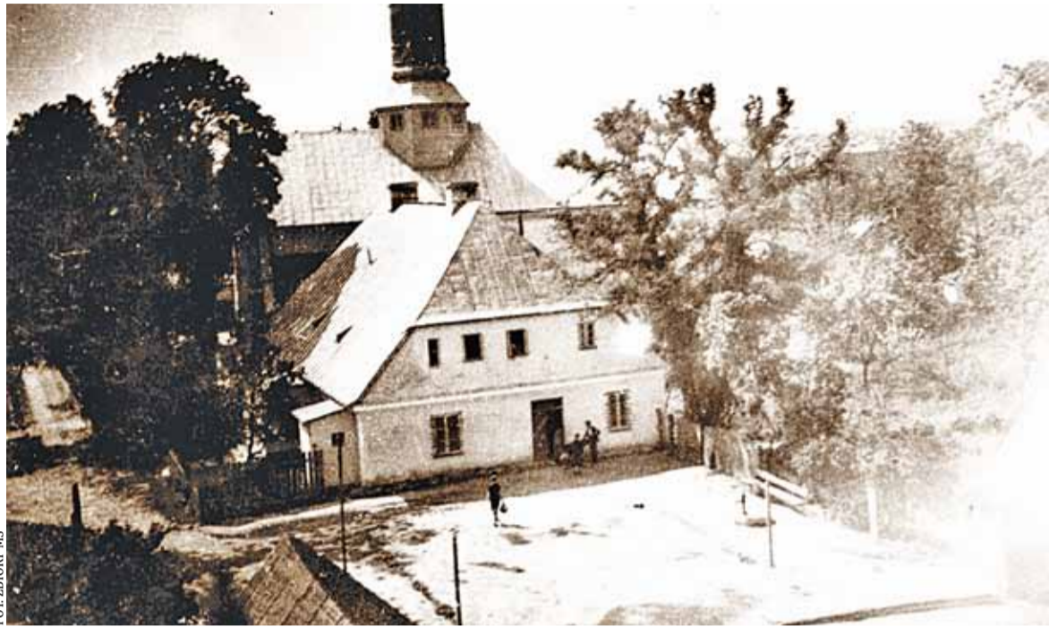
Widok na plebanie i kościół

Poszukiwacze sygnatur na ceglach, porcelanie i kaflach piecowych, czyli ogólnie rzecz ujmując na wszystkim co jest zrobione z gliny i wypalane w piecach w odpowiedniej temperaturze, w grudniu 2017 r. otrzymali nie lada jaką informację: w czasie przebudowy starej plebanii w Piasecznie znaleziono interesujące cegły z sygnaturą „S”. Cegły są doskonale zachowane i sugerują swoim wyglądem, wagą i wielkością, że mogły być użyte ponownie, czyli pochodzą z rozbiórki starszej budowli. Dzięki temu, że obecne władze gminy są zainteresowane tego typu znaleziskami, będziemy mogli wkrótce dowiedzieć się więcej na temat znalezionej cegły.