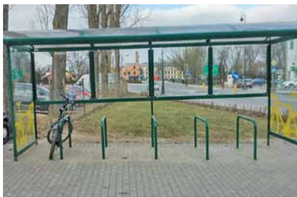
Rowerzyści będą zachwyceni

– Lepiej późno niż wcale, zawsze jest pogoda na rower (to ubranie jest niedostosowane), sporo osób jest zainteresowanych przesiadkami z roweru do autobusu – pisał w grudniu radny Tomasz Nowicki.