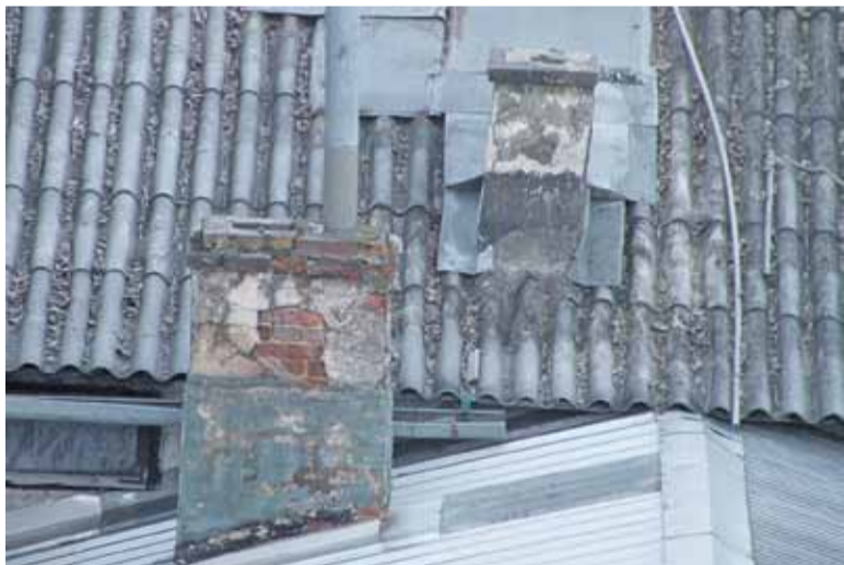
Straż Miejska sprawdziła, czym palimy w piecach