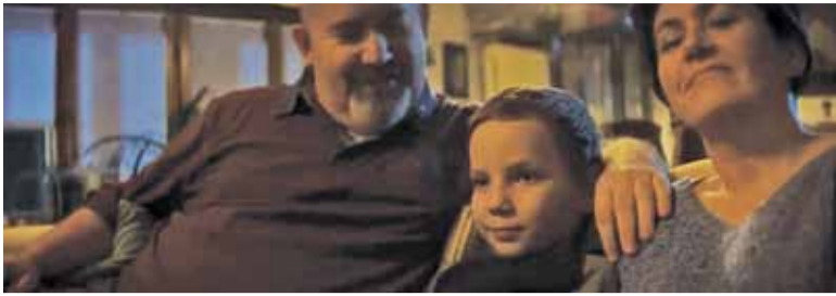
Bohater powiatowego filmu znajduje bezpieczny dom