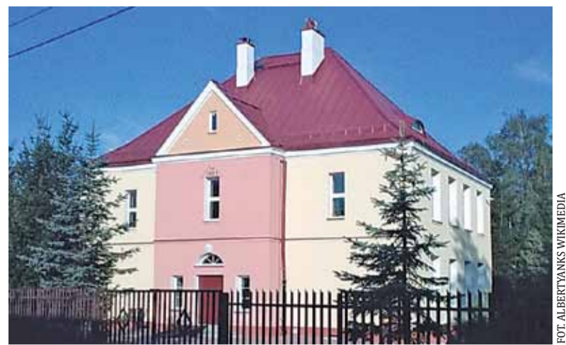
Budynek Szkoły Podstawowej Nr 5 w Konstancinie