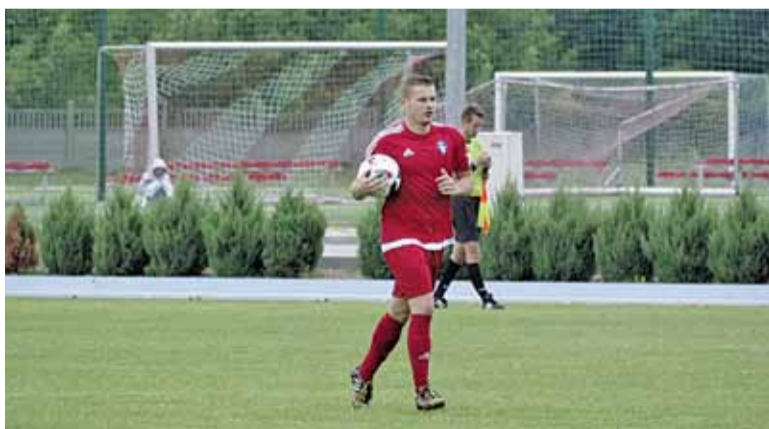
Gracze Piaseczna zaprezentują się na murawie już w ten piątek