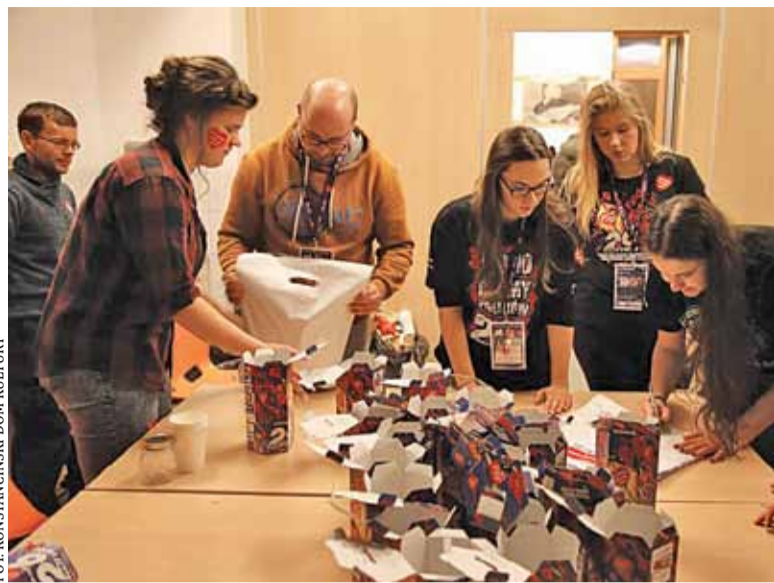
Wolontariusze z Konstancina-Jeziorny