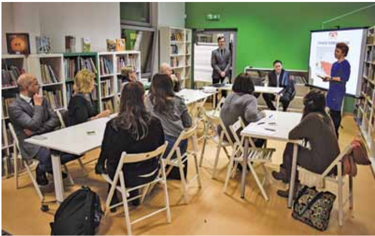
Debata w Zalesiu pokazała jak wiele lokalnych symboli ma Piaseczno