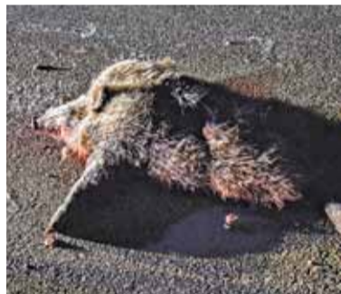
Martwy dzik na ciemnej drodze to zagrożenie dla ruchu

– Zatrzymaliśmy się, ale powiat nie chciał podpisać umowy gdzie dawaliśmy czas reakcji 1h, włączając w to zabezpieczenie miejsca zdarzenia, dezynfekcję i przekazanie do utylizacji. W zasadzie więc nie powinniśmy tutaj