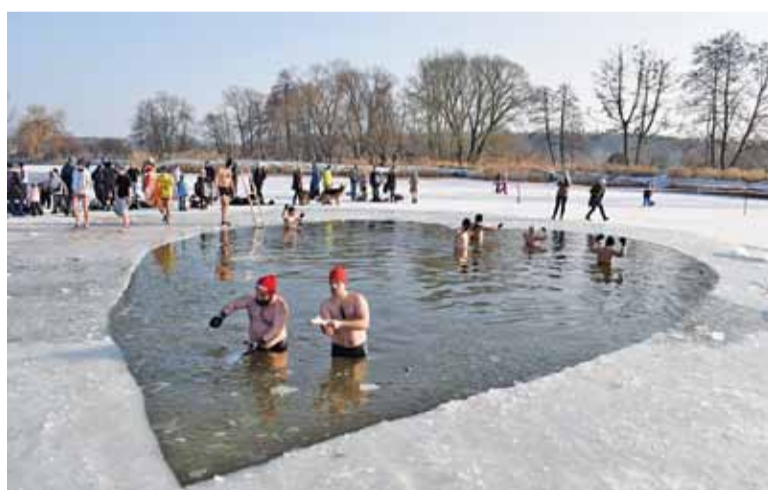
Podczas Lodowatej niedzieli w zeszłym roku zebrano ponad 45 tys. zł

Lodowata niedziela ma mu pomóc zebrać środki.