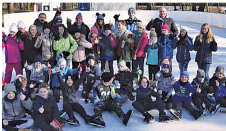
Uczestnicy eliminacji w Parku Zdrojowym