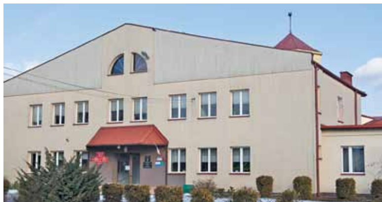
Budynek szkoły powiększy się o drugie piętro