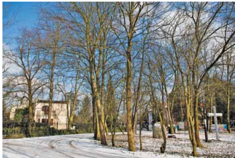
Trzy dorodne lipy usytuowane przy budynku najprawdopodobniej by uschły

wejście w teren prywatny ze względu na zieleni i miejsca pamięci, znajdujące się na skwerku, ale też wymogi techniczne dotyczące szerokości łuku drogi – wyjaśnił Naczelnik Wydziału