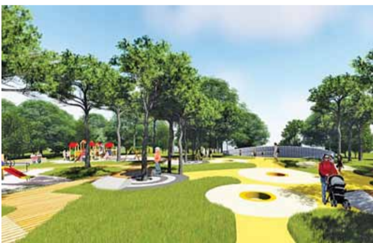
Zmian w Parku Kultury w Powsinie ciąg dalszy