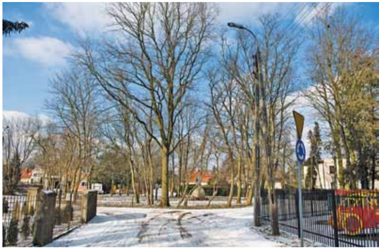
Przy rondzie po prawej stronie zlokalizowane jest również przedszkole