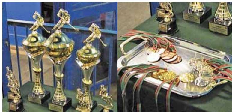
Na najlepszych czekały puchary

Hokeiści stoczyli wiele zaciętych pojedynków, pełnych ciekawych akcji i ostrych starć. Ostatecznie najlepszą ekipą okazały się Orły Grodzisk Mazowiecki, tuż za którymi uplasowali się gracze