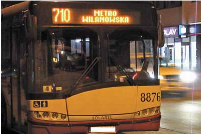
Autobusy linii 710 jeżdżą, jak chcą