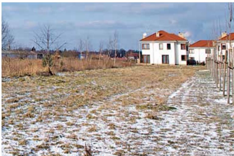
Stacja sieci Play miałyby stanąć na działce między zabudowaniami