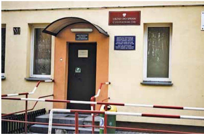
Zeszłoroczny konflikt w Lininie rozpoczął się od incydentu w szkole