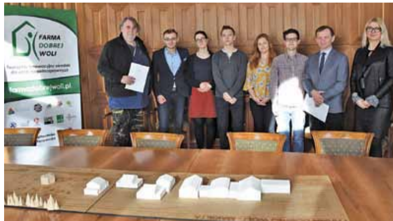
Podpisanie porozumienia to kolejny krok do powstania Farmy Dobrej Woli

– Członkowie zespołu projektowego Farmy Dobrej Woli wykorzystują technologię domów inteligentnych w połączeniu z ideą projektowania uniwersalnego oraz ekologicznego w celu powołania do życia ośrodka, w którym osoby z niepełnosprawnościami znaj-