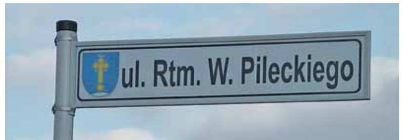
Ulicę 16 Stycznia zastąpiła ulica Rotmistrza Witolda Pileckiego