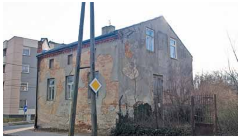
O losach niszczonego budynku prawdopodobnie zdecyduje sąd