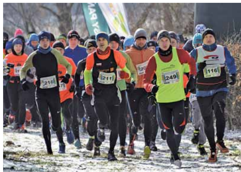
Mimo -10 st. Celsjusza na biegu pojawiło się ponad 600 zawodników