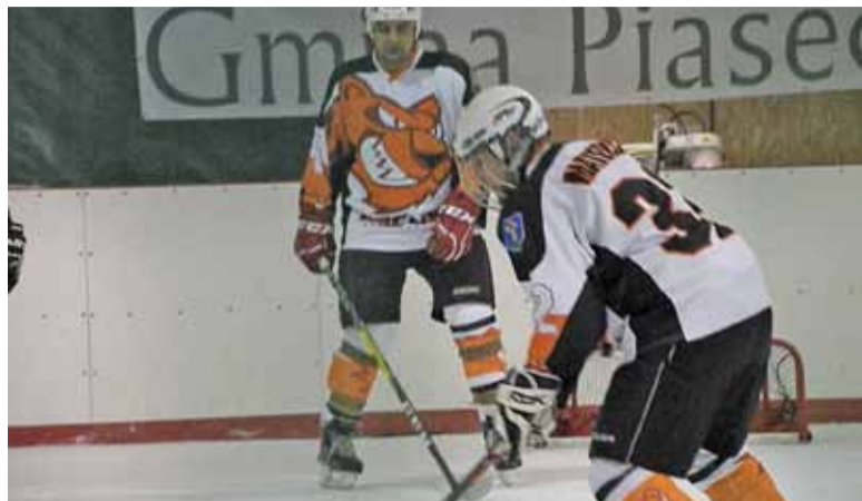
Kocury Góra Kalwaria w akcji