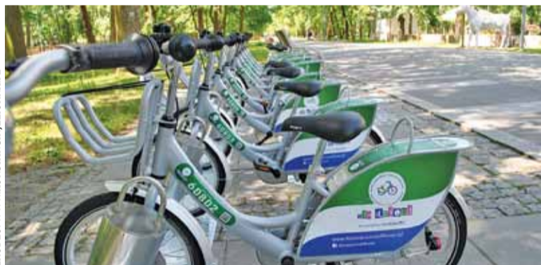
Stacja KRM w Parku Zdrojowym