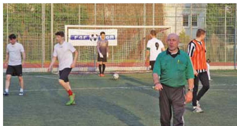
Rozgrywki wystartują na początku kwietnia