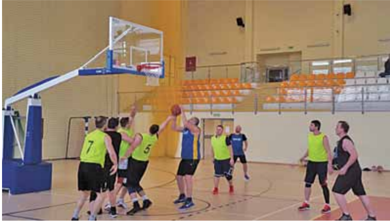
W turnieju mogli wystąpić wyłącznie amatorzy