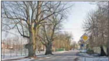
|| Prażmów – Droga kosztem drzew s. 3

PIASECZNO || GÓRA KALWARIA || KONSTANCIN-JEZIORNA || LESZNOWOLA || PRAŻMÓW || TARCZYN