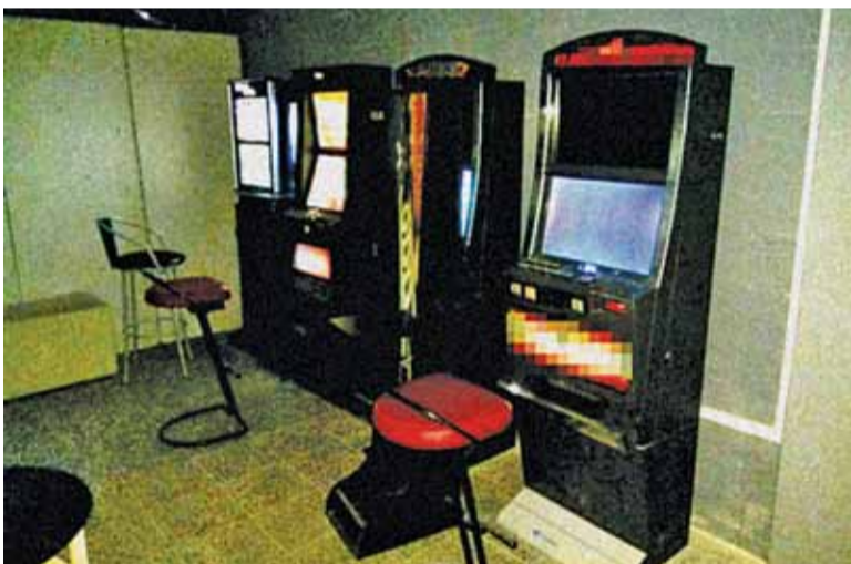
Automaty zabezpieczone przez policję