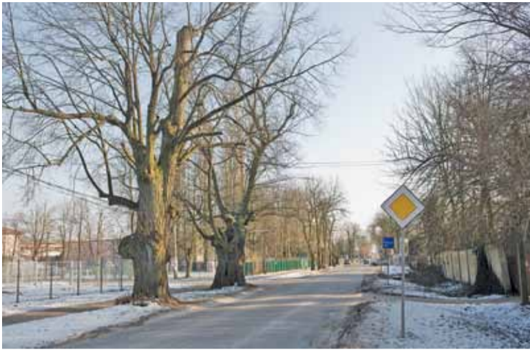
Obie lipy w sąsiedztwie posterunku policji mają tabliczki „pomnik przyrody”