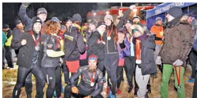
1. Biegacze i samorządowcy złożyli też kwiaty pod krzyżem upamiętniającym poległych 2. Organizatorzy zadbałi o dodatkowe utrudnienia dla biegaczy 3. Mimo trudnych warunków humory dopisywały