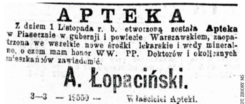
Reklama piaseczyńskiej apteki z Kuriera Warszawskiego z 1876 r.

Lis alias Bzura. Niektórzy zowią Mzura, ale to własne jego nazwisko Lis, dlatego że przodkowie tej rodziny przedtem nosili liszkę za herb, a gdy ruszyli za znac-