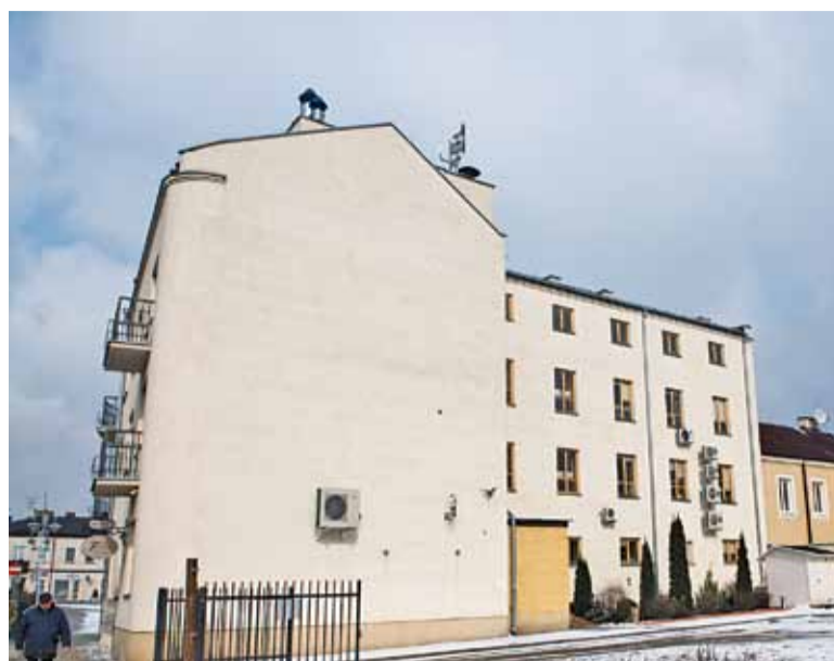
Wyobraźnia artysty może zamienić tę pustą ścianę w dzieło sztuki