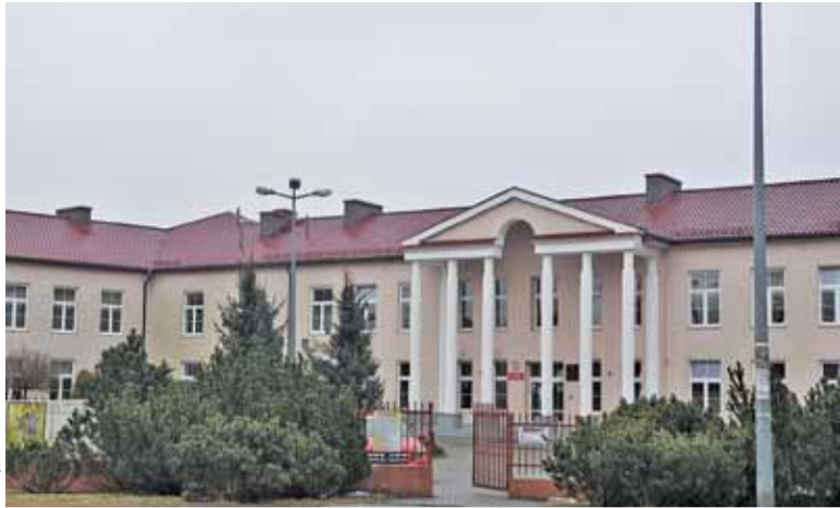
Agnieszka Malarczyk była dyrektorem Gimnazjum nr 2 przez ponad 2,5 roku