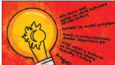
|| Góra Kalwaria – Wspólnie działamy, Górę zmieniamy s. 7