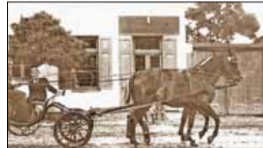
|| Historia – Mzura, czyli Lis s. 9