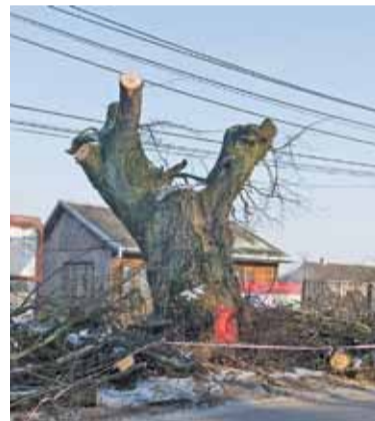
W przypadku większych drzew wycinka to kilkustopniowy proces

Tymczasem tabliczki z napisem „pomnik przyrody” widnieją na czterech lipach wzdłuż drogi. Postanowiliśmy całą sytuację wyjaśnić w MZDW, które jako zarządca drogi oraz inwestor powinien najlepiej orientować się w sytuacji. Prawo dopuszcza wycinkę