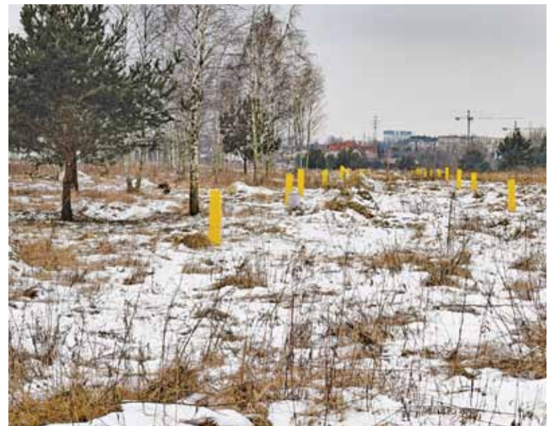
Przygotowane działki pod zabudowę w okolicy Lasu Kabackiego