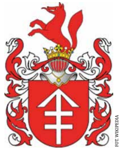
Herb rodu Mzura (Lis)