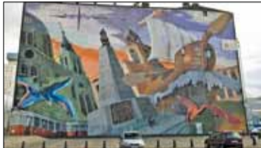
|| Piaseczno – Zamalują Przystanek Kultura? s. 5