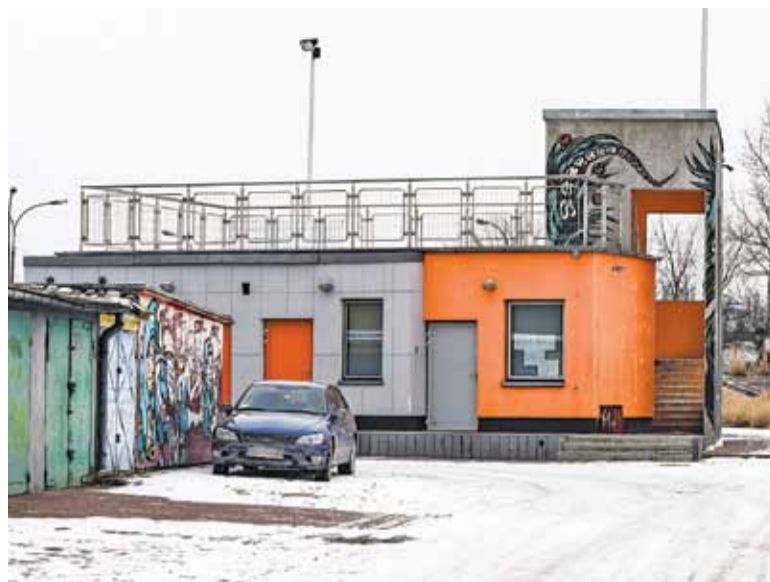
Wysypisko prezimuje na skateparku