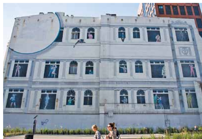
Niekiedy mural udaje „prawdziwą” elewację budynku, jak ten w Łodzi