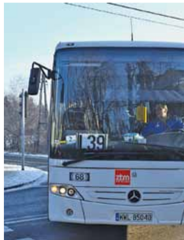
Nowe L-ki miały być niskopodłogowe i niebieskie

Dlatego ZTM w przetargu określił parametry techniczne autobusów. Nasze przyszłe L-ki m.in. miały być co