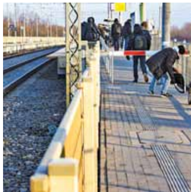
Na pierwszy rzut oka szlaban wygląda absurdalnie, jednak tylko tak można zapewnić pasażerom bezpieczeństwo

Sytuacja na pierwszy rzut oka wygląda komicznie. Pasażerowie, dość tłumnie, nadciągają na peron z obydwu stron Krasickiego. Nadjeżdżający pociąg włącza czujnik, rogatki się zamykają co