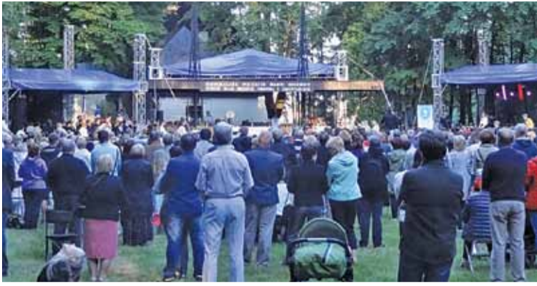
W 2016 r. w Górze Kalwarii pojawiły się tłumy osób dziękujących za kanonizację św. Stanisława Papczyńskiego