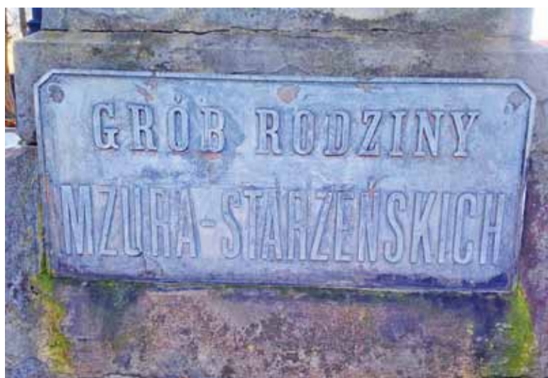
Tablica z grobu rodzinnego Starzeńskich w Piasecznie

napisz do autorki m.szturowska@przekladpiaseczyński.pl