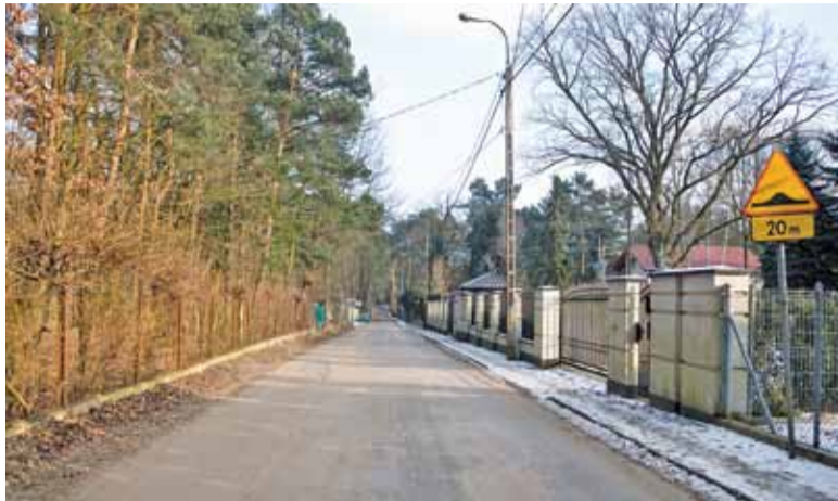
Nowy asfalt pojawi się na całej długości drogi