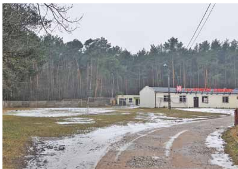
Nowa, sztuczna murawa ułatwi czteroczną grę zawodnikom