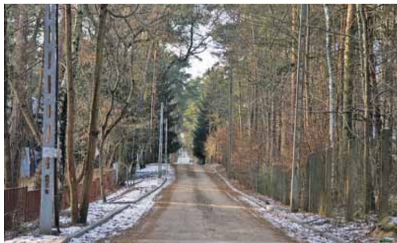
Powodem przerwania prac były między innymi słupy uniemożliwiające poszerzenie

z Wydziału Infrastruktury i Transportu Publicznego. Zapewnił, że gmina zabezpieczyła środki na dokończenie zadania