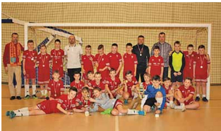
Młodzi zawodnicy Korony z pucharem