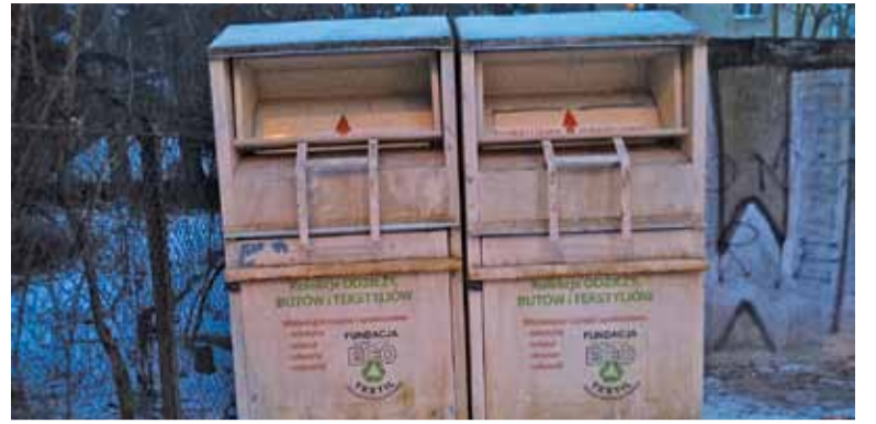
Ciężko byłoby samemu wyjąć portfel z takiego pojemnika