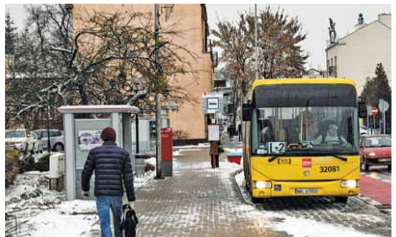
Darmowe przejazdy L-kami zapewnia Karta Mieszkańca