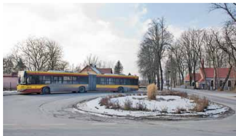
Obecna pętla linii 728 w Złotokłosie miałyby być zwykłym przystankiem