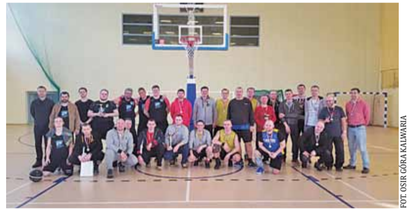
Wspólne zdjęcie uczestników turnieju

W mistrzostwach wzięły udział cztery drużyny: Słoneczna Kalifornia, Amatorzy, Estrella oraz Care Bears. Poza Estrellą, w całości reprezentującą Grójca, drużyny składały się z zawodników