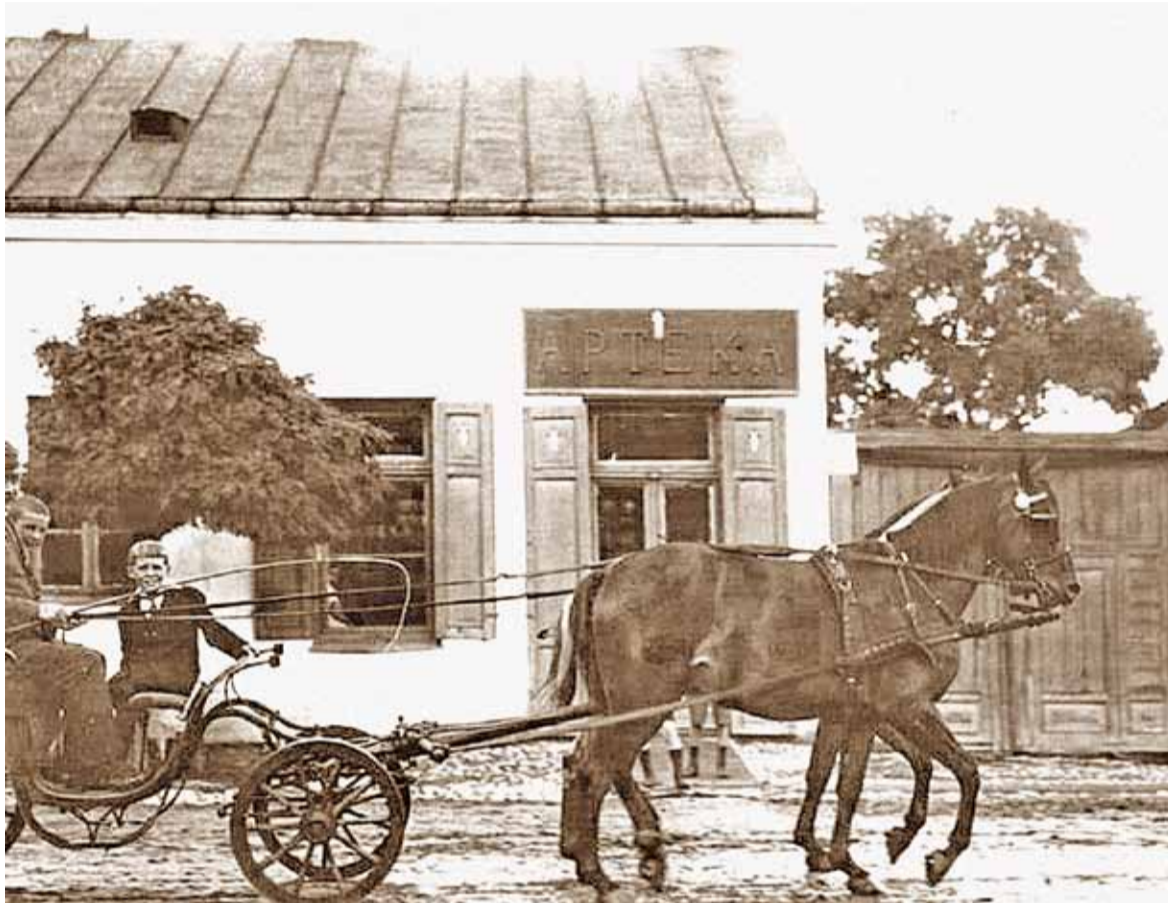
Apteka przy ulicy Puławskiej, zdjęcie sprzed II wojny światowej

Die informacje zainspirowały mnie do napisania wspomnień o piaseczyńskich aptekach, których dziś jest dużo, na każdym kroku widać aptekarskie szyldy. Pierwsza informacja to ta, że Piaseczno ma przejściowe, jak się w końcu okazało, trudności z dyżurni nocnymi aptek. To z kolei zachęciło mnie do sprawdzenia, jak to drzewiej bywało. Druga informacja jest w zasadzie zbiorem wiadomości, do których docierałam przez lata, a które w sposób dość tajemniczy ułożyły się w pewną całość, choć są fragmentaryczne i wymagają dalszych badań.