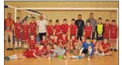
|| Sport – Dalej Korona! s. 13