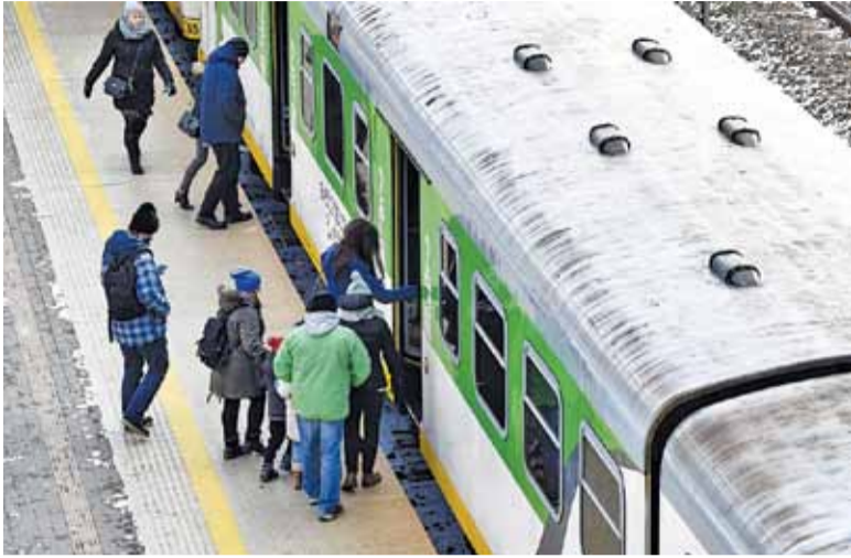
Karta Metropolitalna rozwiązuje problem wspólnego biletu na kolej