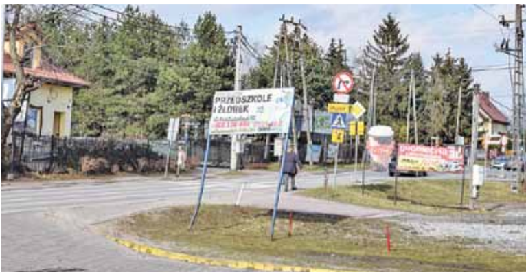
Przestrzeń naszej gminy można śmiało nazwać tandetną