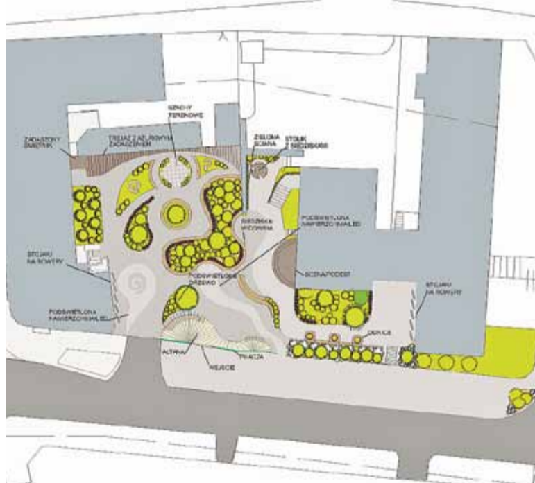
Schemat nowego skweru