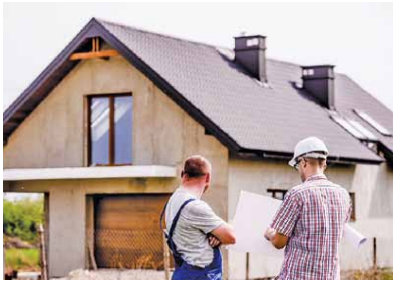
Ponad połowa ankietyowanych przedsiębiorców zatrudnia cudzoziemców