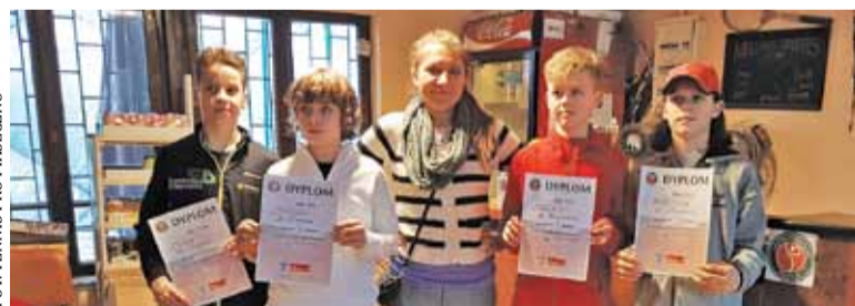
Finaliści turnieju deblowego

W dniach 24-27 marca na kortach Spójni Dolnej odbyły się Mistrzostwa Województwa do lat 12 w tenisie ziemnym. Na turnieju pojawiło się 42 najlepszych tenisistów i 24 najlepsze tenisistki z całego Mazowsza (między innymi zawodnicy sekcji tenisa warszawskiej Legii). Duży sukces odnieśli reprezentanci piaseczyńskiego klubu tenisowego Tennis Pro Piaseczno.