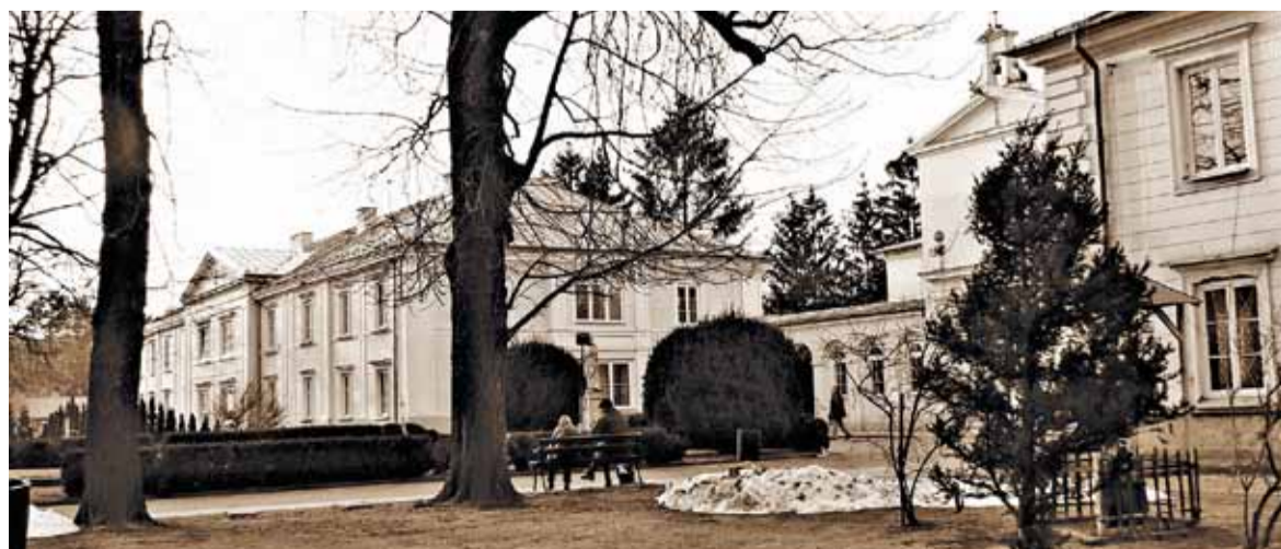
Budynek z terenu Domu Opieki