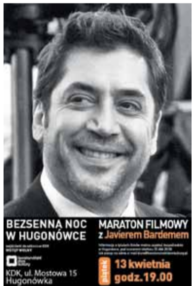
BEZSENSA NOC W HUGONÓWCE MARATON FILMOWY z Javierem Bardemem 13 kwietnia godz. 19.00 KDK, ul. Mostowa 15 Hugonówka

W piątek, 13 kwietnia o godz. 19.00 w Hugonówce przy ul. Mostowej 15 odbędzie się Bezsenna Noc w Hugonówce. Tym razem podczas maratonu filmowego zostaną wyświetlone trzy filmy z Javierem Bardemem w roli głównej. Bardem jest pierwszym hiszpańskim aktorem, który został nominowany do Oscara. Trzykrotnie miał szansę na tę prestiżową nagrodę. Otrzymał statuetkę w 2007 roku za rolę w filmie „To nie jest kraj dla starych ludzi” braci Coen, gdzie wcielił się w Antona Chigurha, jednego z najmroczniejszych czarnych charakterów w historii kina. Informacje o tytułach filmów, mail: biuro@konstancinskidomkultury.pl lub tel. 22 484 20 20. Wstęp wolny.