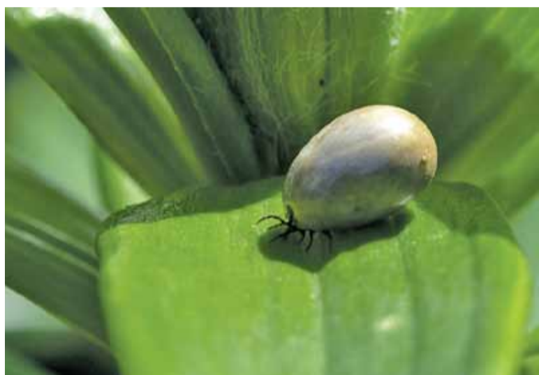
Wybierając się na wiosenne spacerki pamiętajmy o odpowiednim ubraniu

Ugryzienie małego pajęczaka jest niebezpieczne dla ludzi ze względu na przenoszone choroby. Na razie naukowcom udało się opracować tylko szczepionkę na odkleszczowe zapalenie mózgu. Borelioza wciąż zbiera swoje żniwo. Niekiedy zakażony organizm stosunkowo łatwo poradzi sobie z chorobą, której przebieg będzie przypominał zwykłą infekcję. Niestety czasami choroba rozwija się długo w ukryciu i daje osobie znać nawet dopiero po kilku latach od ugryzienia. Pacjent nie skojarzy objawów z tym, że jakiś czas temu na jego skórze pojawił się mały „krwiopijca”, a nawet może nie zauważył ukąszenia. Niestety często również lekarze długo szukają przyczyny dolegliwości ze strony układu nerwowego, objawów