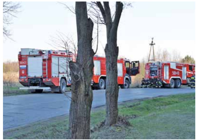
Góra Kalwaria otrzyma dofinansowanie do zakupu ciężkiego wozu strażackiego

Wszystkim policjantom zaangażowanym w tej sprawie oraz mężczyźnie, który odnalazł obcokrajowca nad Wisłą serdecznie dziękujemy. „Pomagamy i chronimy” to nie tylko hasło; tą zasadą kierujemy się w naszej codziennej służbie.