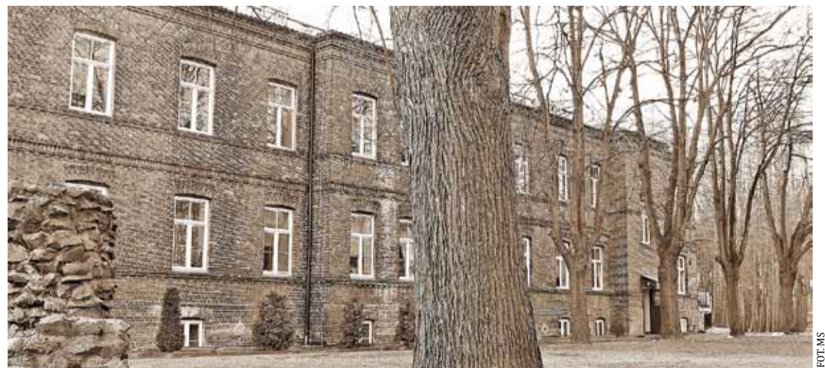
Budynek z terenu Domu Opieki

ników i w suterrenach kuchni. Prawy pawilon, mniejszy od lewego i lokujący w sobie płec żeńską, składa się z kilku sal, między którymi sala paralityków wyróżnia się obszernością i żelaznymi