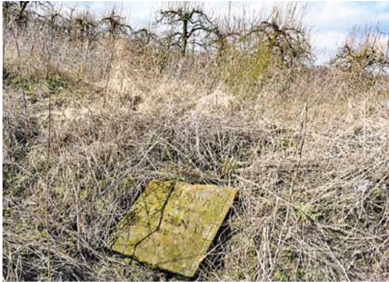
Stan żydowskiego cmentarza w Tarczynie to wstyd dla całego miasta