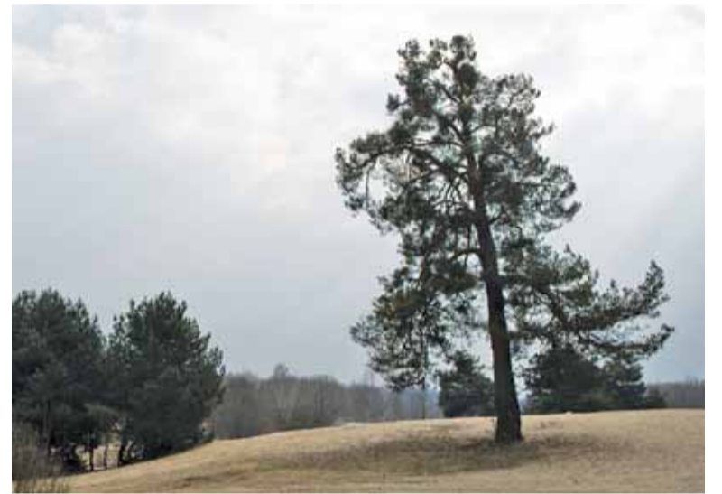
Stara sosna dla mieszkańców jest nieodłącznym elementem krajobrazu Górek Szymona

na, będąca symbolem Górek Szymona, jest cała porośnięta jemiolą, co rokuje rychły jej koniec. Myślę, że usunięcie jemioli przyczyniłoby się do uratowania wiekowej sosny tak charakterystycznej dla Zalesia.