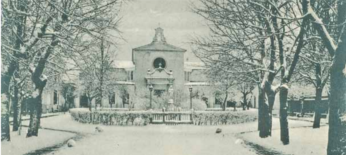
Aleja morwowa wiodąca do schroniska