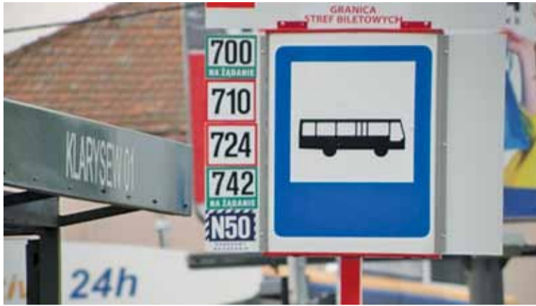
Tańsze bilety miałyby obowiązywać na terenie całej gminy Konstancin-Jeziorna