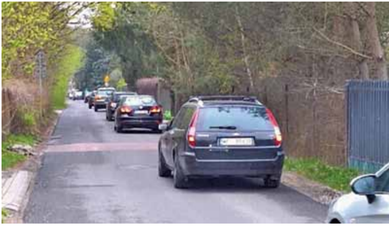
Remont Relaksowej spowodował wiele utrudnień, nie tylko na Ursynowie