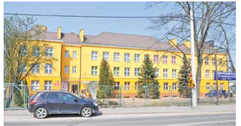
LO jest słoneczne niezależnie od pogody