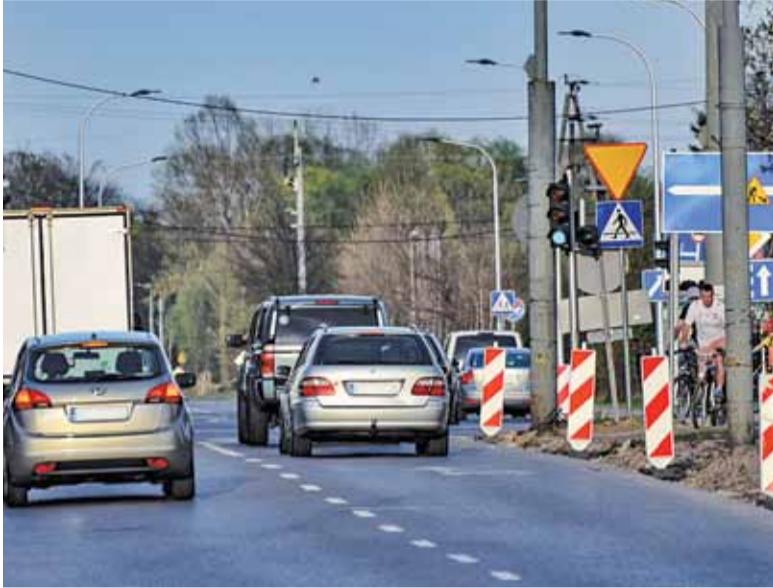
Chyliczkowska jest drogą jednokierunkową od kilkadziesiąt lat, ale czy to jest dobry powód żeby tego nie zmieniać?