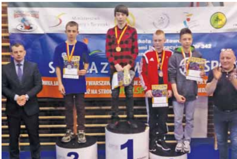
Zawodnicy z Piaseczna z medałami

Kolejny duży sukces reprezentantów gminy Piaseczno.