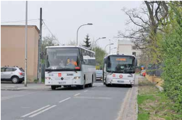
Parkowanie wzdłuż ulicy utrudnia ruch