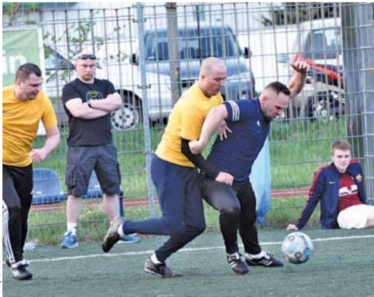
Czy ten sezon będzie należał do Baniochy?