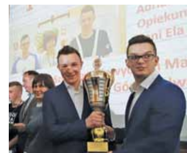
Red. Uczniowie Budowlanki z pucharem

– Duma rozpiera zarówno z sukcesu chłopaków, jak i nauczycieli, którzy przekazują im swoją wiedzę każdego dnia w szkole – gratulują sukcesu przedstawiciele szkoły. My również gratulujemy!