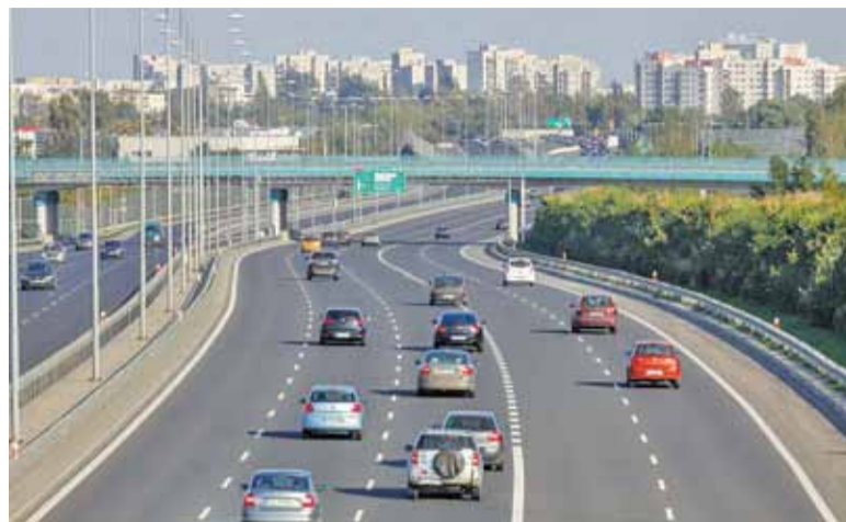
Południowa Obwodnica Warszawy jeszcze nie jest ukończona, ale rząd już planuje nową

– Chcielibyśmy, aby duża obwodnica Warszawy, tzw. duży ring warszawski, został ukończony przed oddaniem do użytkowania Centralnego Portu