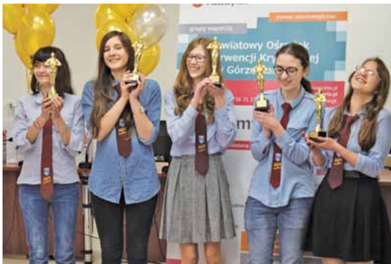
Oscary powędrowały do uczennic z Prażmowa