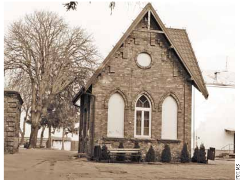
Kaplica grobowa z początku XX w. w OPS w Górze Kalwarii