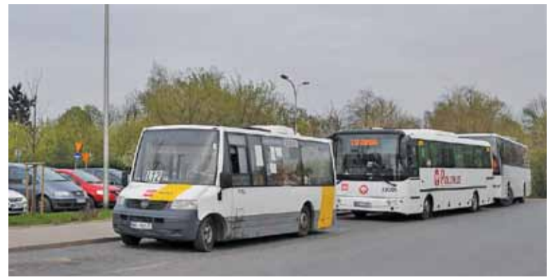
Na parkingu stoją czasem równocześnie trzy lub cztery autobusy

żeby centrum miasta było dobrze skomunikowane – podkreśla.