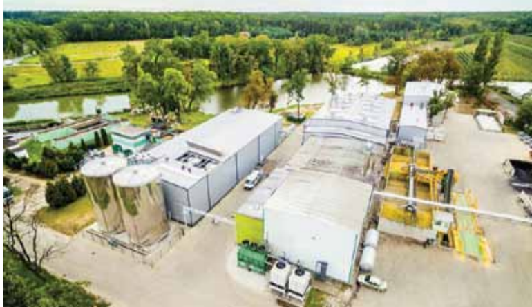
Zakład Appol Bis Sp. z o.o. w Potyczach z lotu ptaka

Trochę o nas. Zakład produkcyjny Appol Bis Sp. z o.o. w Potyczach działa od 2011 roku. Lokalizacja przy trasie nr 79 umożliwia dostanie się do nas z okolicznych miast takich jak Góra Kalwaria czy Warka w niespełna 15 minut. Dojedziesz do nas również PKS-em.