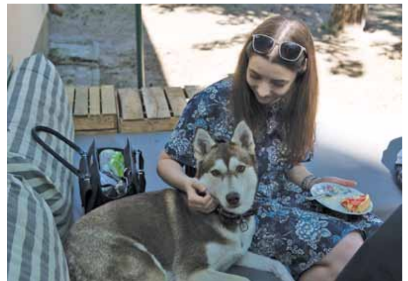
Psiastkarnia oferuje dwie przyjemności w jednym