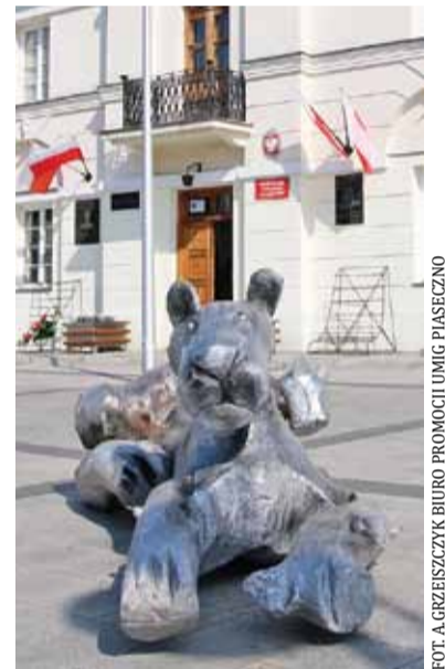
Rzeźby mają szansę stać się symbolem miasta

zwierzęta mają się pojawić w centrum miasta jeszcze przed wakacjami, między innymi na Skwerze Kisiela.