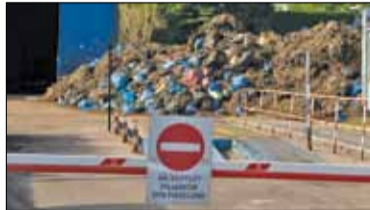
|| Lesznwola - Śmietnikowa gra w kolory