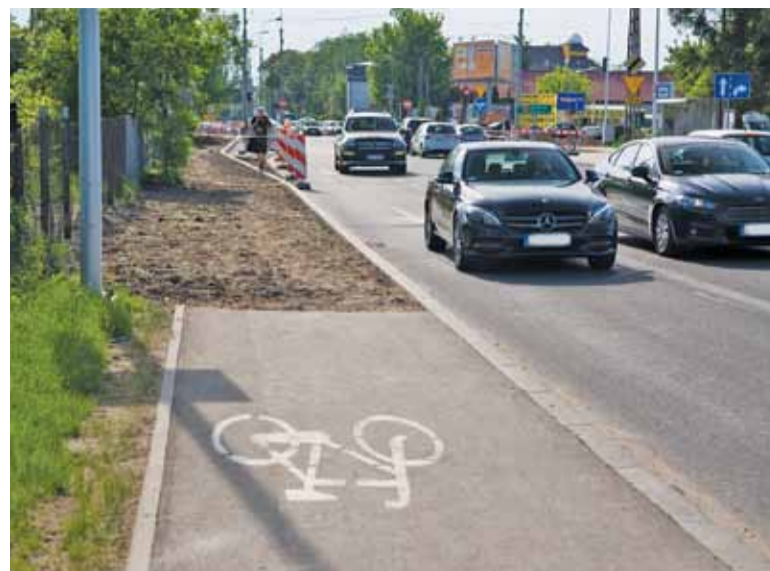
Półowy drogi rowerowej już nie ma