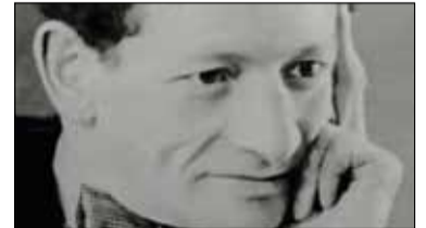
|| Historia - Sztukmistrz z Góry Kalwarii