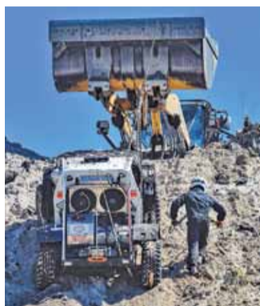
Próba w żwirowni w Tomicach była niezwykle widowiskowa