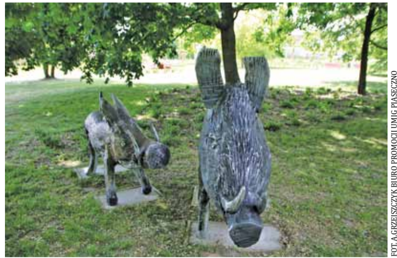
Ciekawe, czy nasze żywe dziki rozpoznają w rzeźbach swoich pobratymców

Policjanci z wydziału dochodzeniowo-sledczego z Piaseczna zwracają się z prośbą do wszystkich osób mogących pomóc w ustaleniu okoliczności tego zdarzenia o pilny kontakt pod numerem telefonu 22 60 45 257 lub mailem: oficer.prasowy@piaseczno.ksp.policja.gov.pl