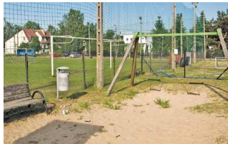
Bałagan nie zachęca do korzystania z placu zabaw