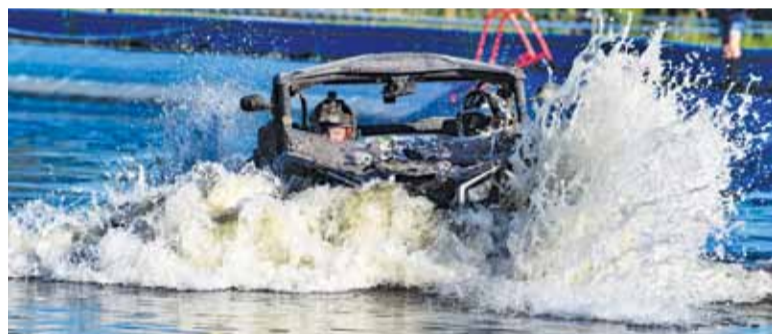
Ostatnim punktem Lajtowego Pucharu była próba w basenie wypełnionym wodą