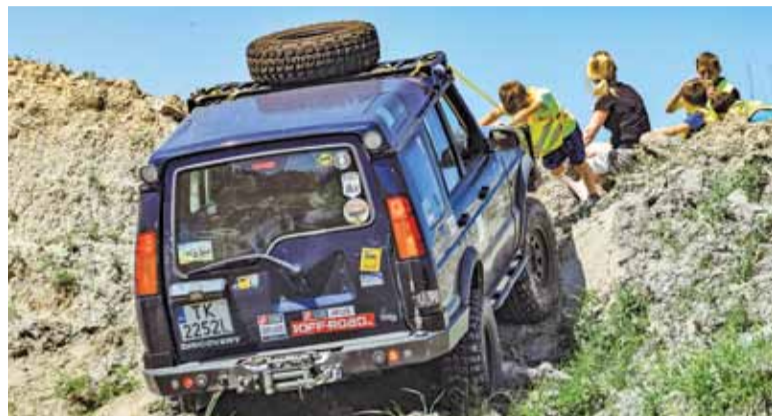
Lajtowy Puchar to impreza zdecydowanie rodzinna

Zawodnicy musieli odnaleźć fotopunkty, korzystając z roadbooka. Próby odbywały się m.in. w lesie, w żwirowni i na terenie Planety Zalesie w Zalesiu Górnym, gdzie Lajtowy Puchar miał swoją bazę. Na terenie Planety Zalesie uczestnicy mieli m.in. zjechać z grobli do wody i dostać się na wyspę oraz zdobyć fotopunkty w basenie wypełnionym wodą.