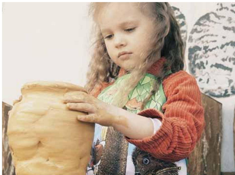
Kadr z filmu o Tarczyńskich Talentach

Gmina Tarczyn wygrała plac zabaw NIVEA już po raz trzeci! Tym razem bez konieczności głosowania internetowego