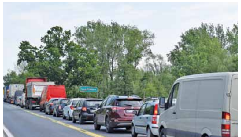
Ruch wahadłowy na moście zakorkował dojazd do mostu, ale także całą Górę Kalwarię