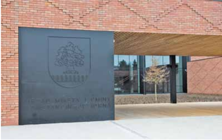
Cieszy gotowość burmistrza do bezpłatnego udostępnienia w ratuszu biura dla urzędników powiatu