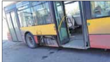
|| Powiat - Tabor padł?