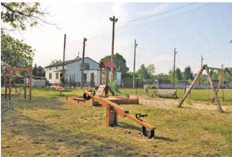
Plac zabaw sąsiaduje ze stadionem KS Laura Chylice