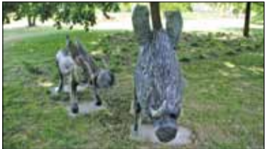
|| Piaseczno - Zwierzyniec Wilkonia

PIASECZNO || GÓRA KALWARIA || KONSTANCIN-JEZIORNA || LESZNOWOLA || PRAŻMÓW || TARCZYN