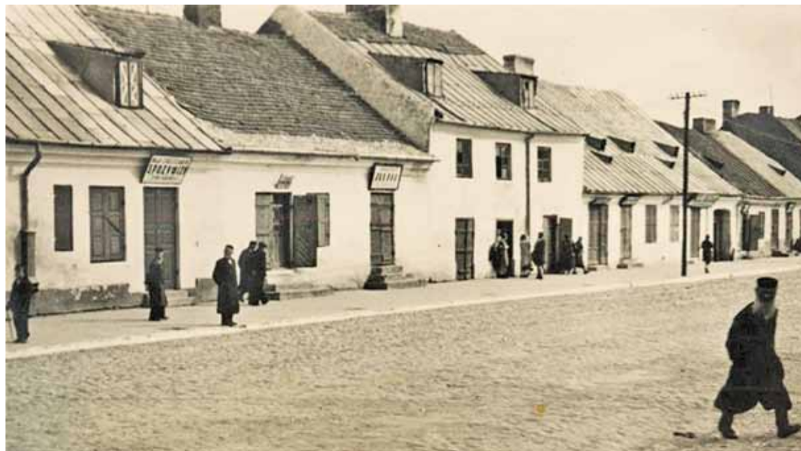
Góra Kalwaria w 1939 r.

Analizując życie Messinga, przychodzi mi do głowy wiele pytań. Czy dar jasnowidzenia, telepatii i umiejętności czytania myśli ludzi jest „darem Bożym” czy przekleństwem? No i przede wszystkim podstawowe pytanie: czy takie umiejętności są możliwe? Messing wyjaśniał dar czytania myśli ludzi, jako