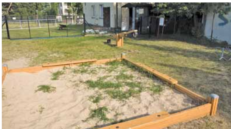
Piaskownica zamienia się w ogródek

– Infrastruktura techniczna jest zaniedbana i w fatalnym stanie, przez co zagraża bezpieczeństwu dzieci. Jako dowód przesyłam zdjęcia, na których widać m.in. popękane konstrukcje od