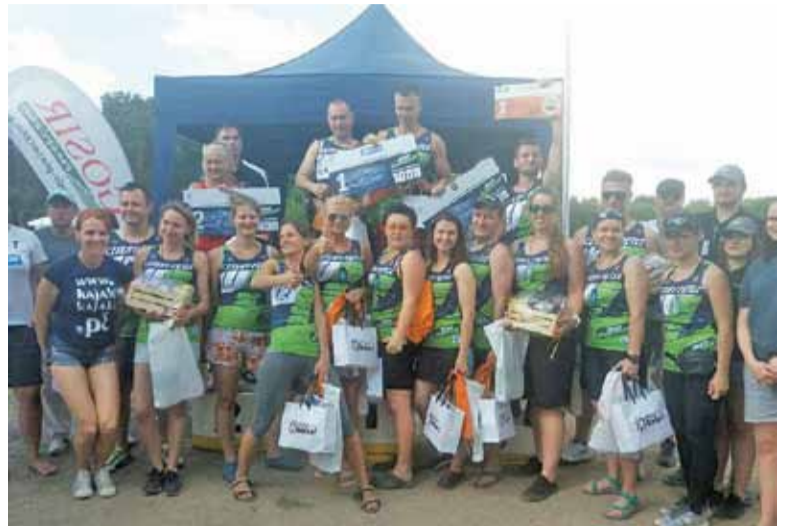
Zwycięzcy czuli się wszyscy – pokonali całkiem spore dystanse w krótkim czasie

Kajakarskie zawody wymagały nie-małej kondycji. W eliminacjach trzeba było przepłynąć dystans w jak najkrótszym czasie. Najlepsi startowali w wyścigu głównym. Ich zadaniem było przepłynąć 1600 metrów, czyli 4 pętla, przez zalew, nie odpadając na poszczególnych pętlach. Rywalizacja była zacięta, ale wśród zawodników panowała bardzo przyjazna atmosfera i wszyscy przede wszystkim doskonale się bawi-