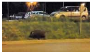
Jeśli zwierzę nas nie zauważyło, możemy powoli oddalić się od niego, nie wykonując gwałtownych ruchów