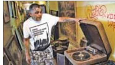
|| Góra Kalwaria - Bezdomy, który sobie radzi