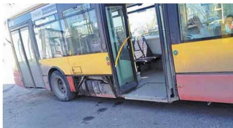
Gołym okiem widać, że autobusy są w fatalnym stanie