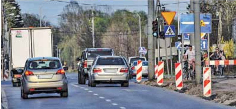
Mimo protestów, Chyliczkowska będzie jednak dwukierunkowa