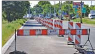
|| Piaseczno - Pachołki znikną s. 5