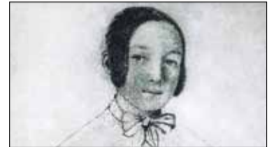
|| Historia - Orsetti herbu Złotokłos s. 12