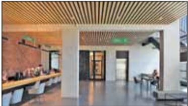
|| Konstancin-Jeziorna - Przeprowadzka s. 2

PIASECZNO || GÓRA KALWARIA || KONSTANCIN-JEZIORNA || LESZNOWOLA || PRAŻMÓW || TARCZYN