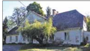
|| Prażmów - Dwór Ryxów s. 7