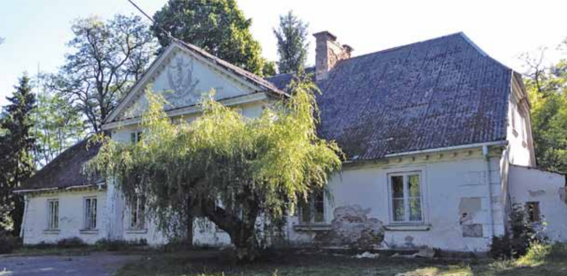
Dwór Ryxów to wyjątkowe miejsce, jednak jego remont przerósł możliwości finansowe gminy