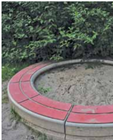
Niektóre place zabaw zdążyły solidnie zarosnąć

o problemie czekających na konserwację ogródków jordanowskich pisaliśmy przed dwoma tygodniami. Mieszkańcy skarżyli się przede wszyst-