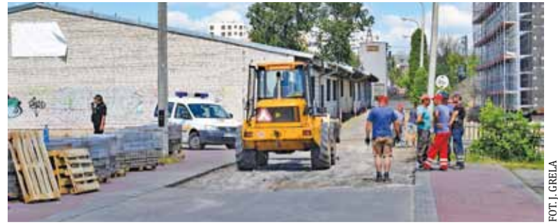
Stare magazyny na targowisku zostaną zburzone, by powstała droga