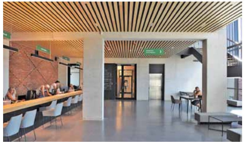
W nowym ratuszu na mieszkańców czeka przestronna sala obsługi