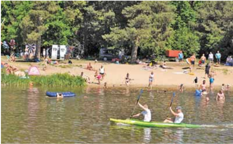
Na Górkach Szymona w ciepłe dni amatorów wodnych kąpiele nie brakuje