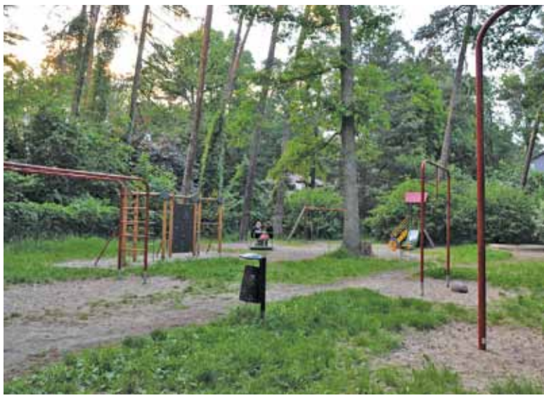
Plac zabaw z Zalesiu Dolnym wydaje się miejscem zupełnie zapomnianym