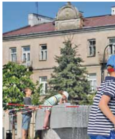
Jak widać najmłodszym nie przeszkadza nawet zabezpieczająca taśma

kie kąpieliska na Górkach Szymona w Zalesiu Dolnym, w Ośrodku Wisła w Zalesiu Górnym i na tzw. „gliniankach” w Gołkowie. Najgorzej sytuacja wygląda na Górkach Szymona, gdzie mali i duzi chętnie wchodzą do wody, kompletnie