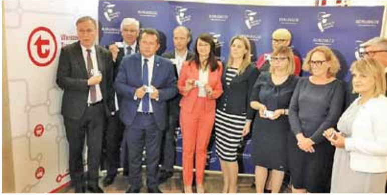
Burmistrz Góry Kalwarii na briefingu prasowym dotyczącym m.in. biletu metropolitalnego