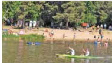
|| Piaseczno - Niebezpieczne kąpiele s. 6