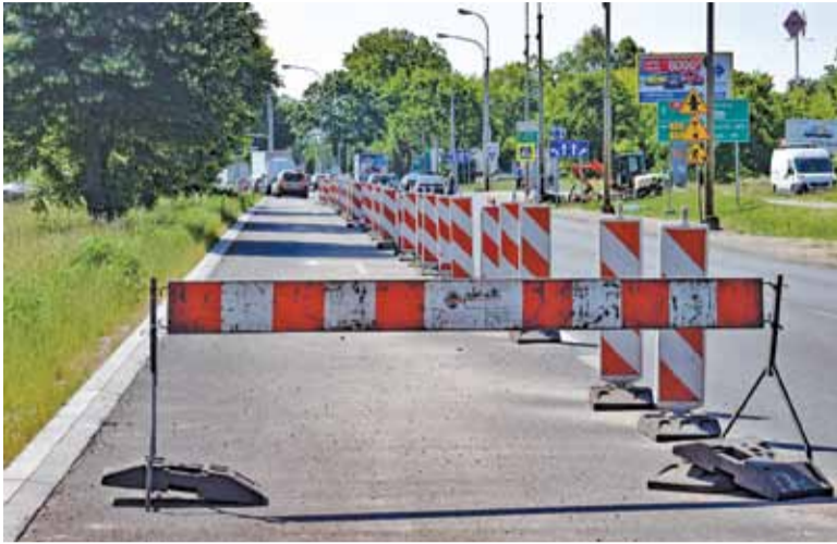
Wydłużony lewoskręt miał usprawnić ruch na skrzyżowaniu, ale od kilku miesięcy jest zamknięty