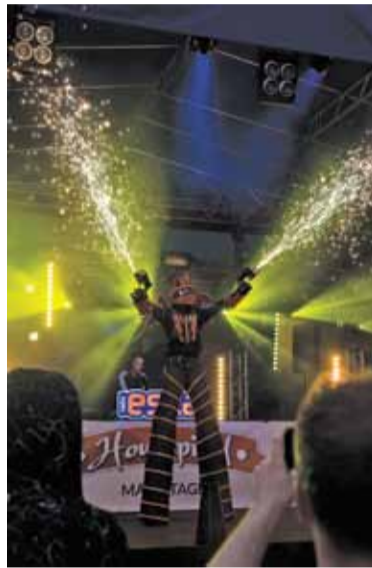
Nie zabrakło efektów specjalnych

mem. Zgromadzeni przed sceną fani nie poddawali się pogodzie, mimo deszczu imprezie towarzyszyła atmosfera dobrej zabawy. Ci mniej „nieprzemakalni” korzystali z osłony parasola. Przez sześć godzin w centrum Piaseczna było naprawdę głośno i tanecznie, a po 22.00, w związku z koniecznością przestrzegania ciszy nocnej, spragnieni dalszej zabawy