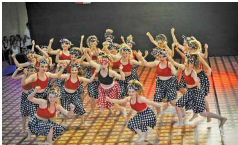
Brązowe medalistki MŚ IDF 2018

Zawodnicy prezentowali swoje umiejętności w solo, duetach, parach, mini-