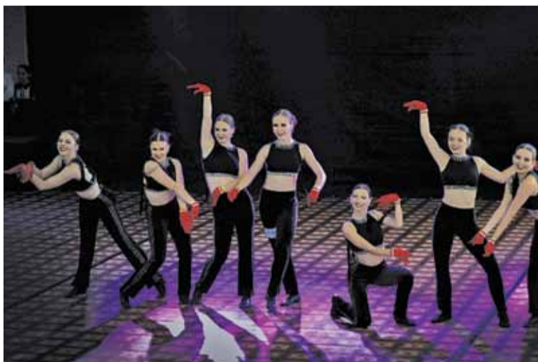
Srebrne medalistki na MŚ IDF 2018