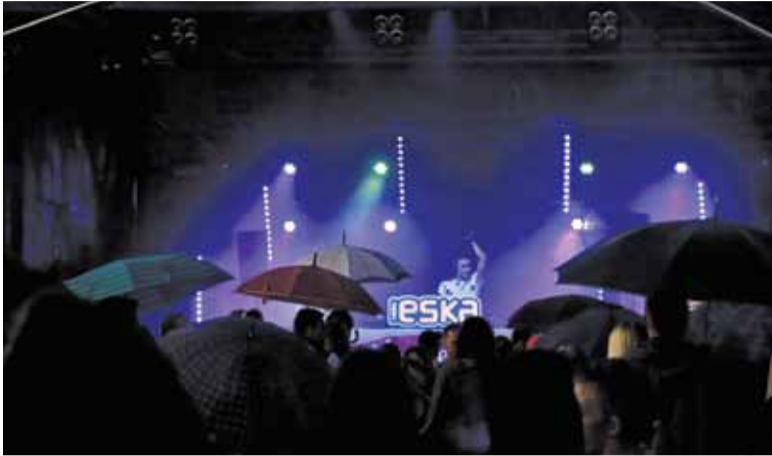
Symbolem VI Housepital Festiwal niewątpliwie będą parasolki