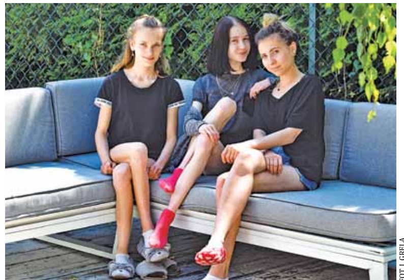
Dziewczyny pod koniec terapii mówią, że w ośrodku czują się jak w bezpiecznym domu