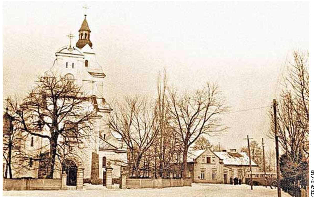
Jazgarzew w latach 60. XX w.