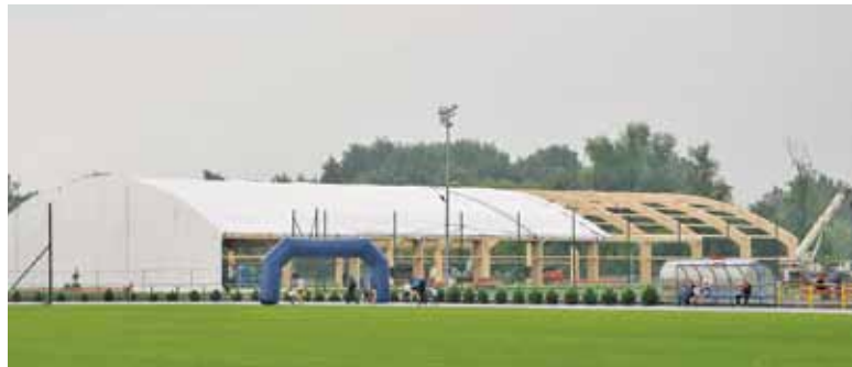
Zadaszenie zapewni zawodnikom komfortowe treningi przez cały rok