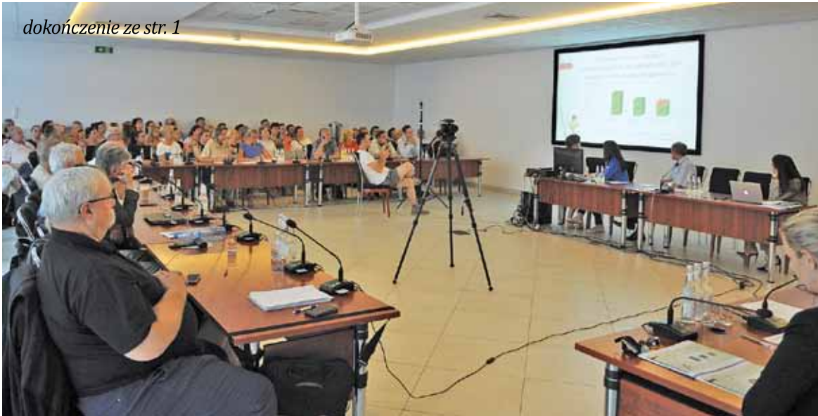
Na sesję przybyła spora grupa rodziców przyszłorocznych absolwentów podstawówek