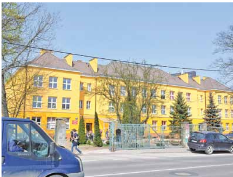
Tradycyjnie największym zainteresowaniem będzie się cieszyć LO przy ulicy Chyliczkowskiej