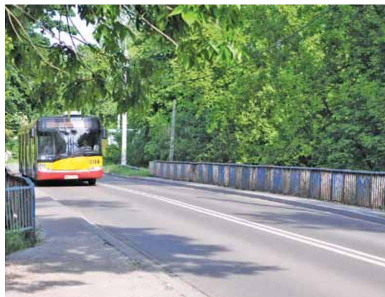
Jesienią most ma szansę zyskać nowy wizerunek