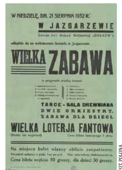
Plakat z lat 30. XX w.