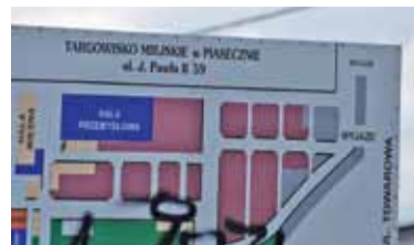
Targowisko czeka modernizacja, ale jeszcze nie wiadomo kiedy