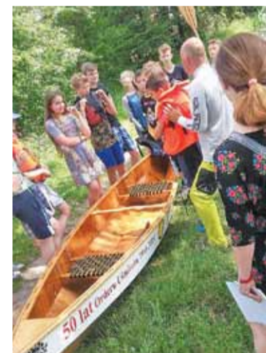
Drewniana łódka budowana była przez dwa dni

Uczniowie każdej z klas uczestniczyli przez dwa dni w budowie łodzi.