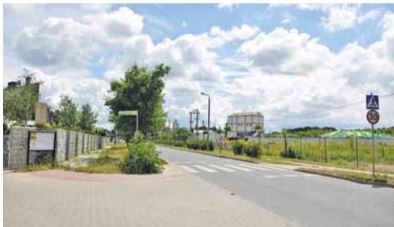
Najbliższym sąsiadem oczyszczalni jest osiedle domków jednorodzinnych

Często, zwłaszcza wieczorami, smród utrudniał przebywanie na zewnątrz, ale to co się dzieje ostatnio, to jakaś tragedia – mówi kręcący się po ogrodzie mężczyzna. Pewnie to też kwestia upałów, ale jeśli się buduje stację w środku wsi między domami, to powinny zostać zapewnione zabezpieczenia, które sprawią, że niezależnie od pogody nie utrudni ona życia okolicznym mieszkańcom – podkreśla.