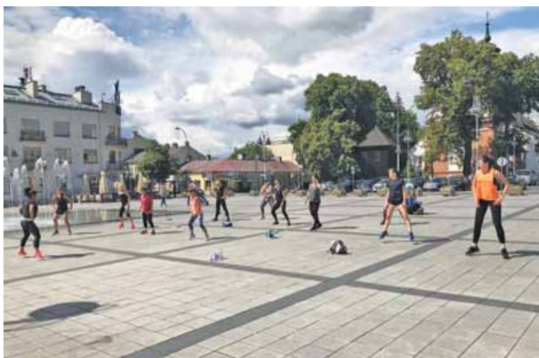
Wspólny trening na piaseczyńskim rynku to świetny pomysł na wakacyjną aktywność