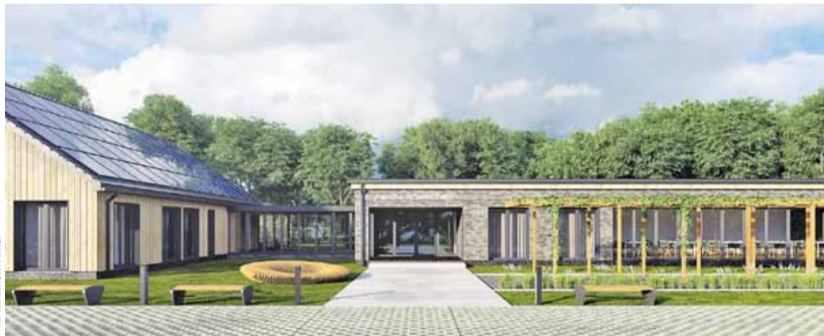
Wizualizacja Farmy zaprezentowana w sobotę na Politechnice Warszawskiej