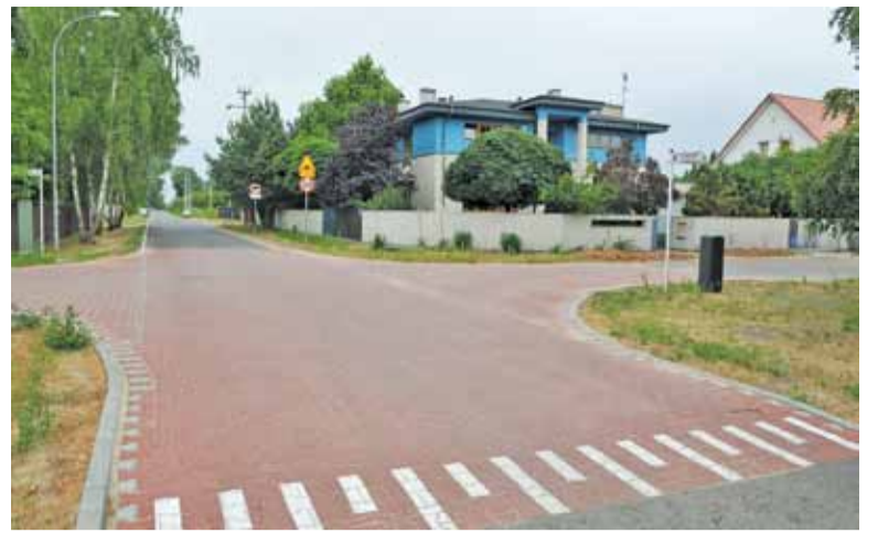
Teraz żaden deszcz mieszkańcom ani ogrodzeniom ich domów niestraszny