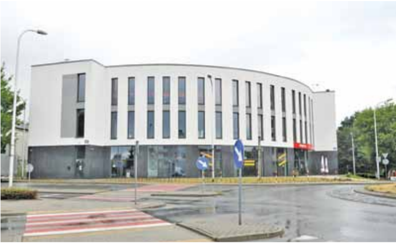
Od września PPP będzie działać w prywatnym budynku