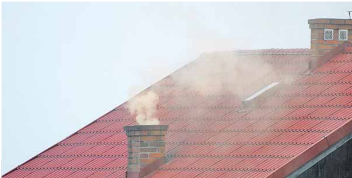
Smog w Górze Kalwarii to poważny problem