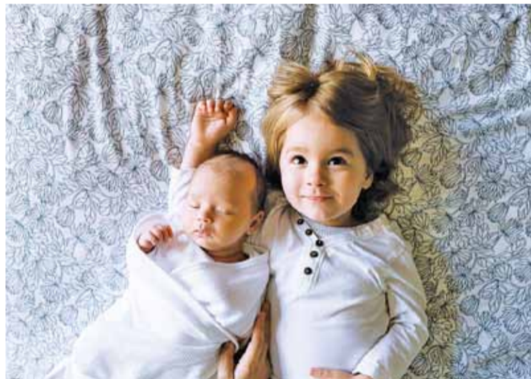
Składanie wniosków rozpocznie się 1 lipca. W tradycyjnej formie od 1 sierpnia

Wnioski on-line można składać od 1 lipca w jednym z 25 banków: Alior Bank SA, Bank BPH SA, Bank Handlowy w Warszawie SA, Bank Millennium SA, Bank Pekao SA, Bank Poczty SA, Bank Polskiej Spółdzielczości SA, Bank Zachodni WBK SA, FM Bank PBP SA (Smart Bank), ING Bank Śląski SA, mBank SA, PKO Bank Polski SA, Raiffeisen Bank Polska SA, SGB-Bank SA, Bank