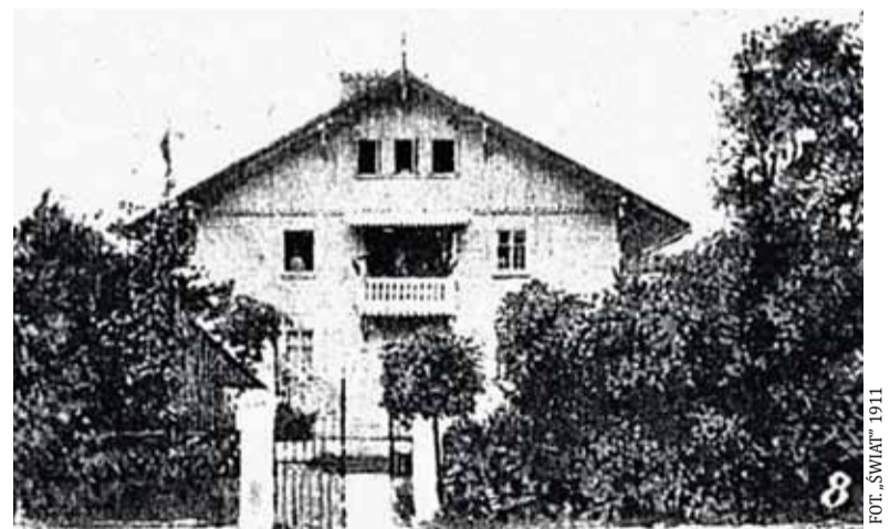
FOT. „ŚWIAT” 1911

120 zł miesięcznie. Zalesie, Zalesinek, Gołków i Głusków, klasyczne letniska podwarszawskie, mimo swego wspaniałego położenia, willi, wielu połączeń kolejowych z Warszawą, nie przyciągały spragnionych ożywczego powietrza