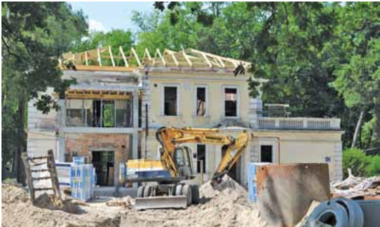
Podobno wykonawca ma zdążyć z przebudową do końca wakacji