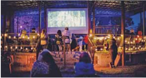
Kino Letnie przy Wieży to niezwykły klimat i ciekawe filmy