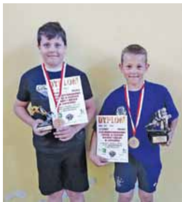
Zawodnicy z Piaseczna zdecydowanie nie zawiedli