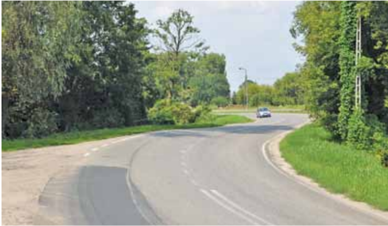
Droga 721 ma kręty przebieg na tym odcinku