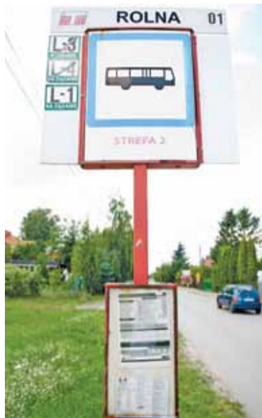
Nazwy przystanków na tablicy przystankowej oraz w rozkładzie jazdy są rozbieżne

– Nie zgadzała się zupełnie godzina, której się spodziewałam i dlatego się zainteresowałam trasą – wyjaśnia. Mało kto sprawdza bowiem takie szczegóły, chyba, że ktoś jedzie po raz pierwszy albo zamierza jechać na inny niż zwykle przystanek. Stali pasażerowie raczej weryfikują tylko godziny odjaz-