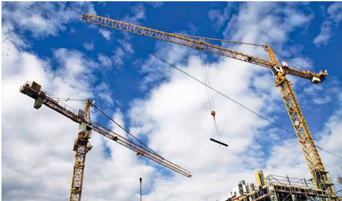
Specustawa mieszkaniowa będzie obowiązywać przez 10 lat

Z kolei w petycji do prezydenta, pod którą podpisy zbierały organizacje zrzeszające miejskich aktywistów, urbanistów i architektów z całej Polski, czytamy: „Niezrozumiałe są intencje ustawodawcy, który uznał, że do przyspieszenia budowy mieszkań konieczne jest wprowadzenie możliwości obchodzenia zapisów miejscowych planów zagospodarowania przestrzennego. Zapis ten znalazł się w ustawie, pomimo że w każdej gminie są wyznaczone w planach miejscowych tereny miesz-