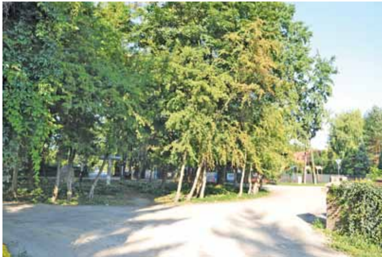
Skwer zostanie zmniejszony na rzecz ruchu na rondzie