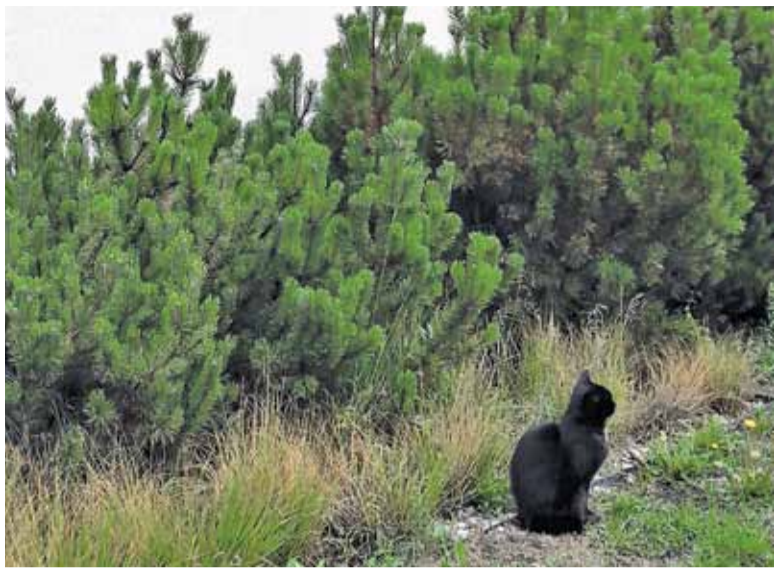
„Strażnik” na posterunku