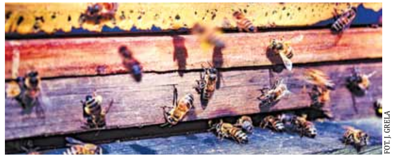
O pszczoły powinni dbać wszyscy, bo wszyscy bez nich zginą