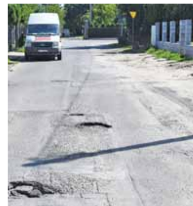
Remontowane odcinki wymagały wymiany nawierzchni

– Wykonawca wybuduje też nowe chodniki oraz wyremontuje pobocza i wjazdy na posesje – informuje urząd.