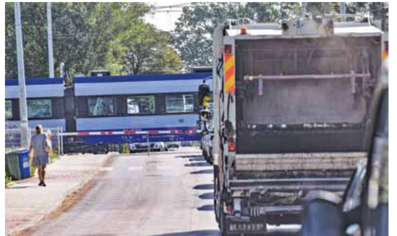
Bezkolizyjny przejazd wydaje się jedynym bezpiecznym rozwiązaniem problemów kierowców na Krasickiego

– Z inicjatywą wystąpiło PKP, które uruchomiło program likwidacji przejazdów kolejowych w ramach poprawy bezpieczeństwa. Powiat wytypował 2 przejazdy: na Krasickiego i Jana Pawła