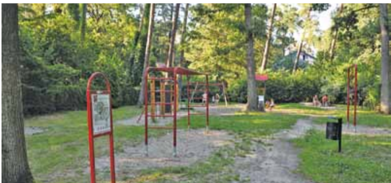
Place zabaw doczekają się prac konserwacyjnych