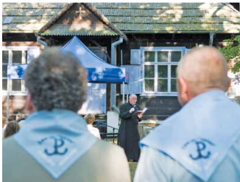
Goście uroczystości recytowali wiersze powstańcze