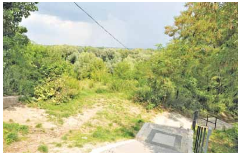
Zielona skarpa zostanie „ucywilizowana”