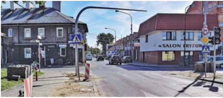
Nowe sygnalizatory uruchomione zostaną pod koniec wakacji, kiedy wprowadzony zostanie ruch dwukierunkowy