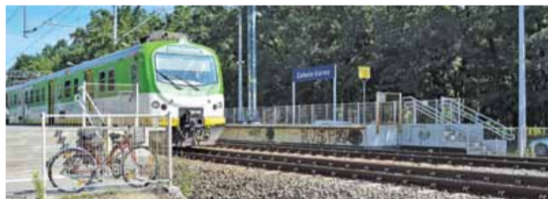
Wykonanie tunelu lub kładki w tym miejscu jest konieczne dla bezpieczeństwa

Ludzie tak czy inaczej przez tory przechodzą i przechodzić będą, ponieważ ci mieszkający na południe od peronów skracają sobie w ten sposób drogę. Miejsca po dawnym przejściu przez jakiś czas pilnowali SOKiści, to jednak nie zda egzaminu na dłuższą metę. Roz-