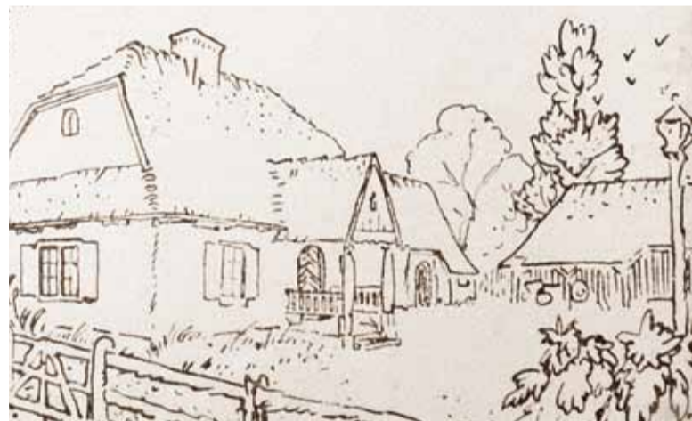
Rysunek arch. Kazimierza Kalinowskiego przedstawiający zagrodę rolnika

Ulica Jana Pawła II (dawniej ul. Kościelna), niegdyś droga należąca do wsi Wola Piasecka, dziś zatraciła zupełnie swój przedwojenny charakter. Poznikały charakterystyczne tu niegdyś jedno-