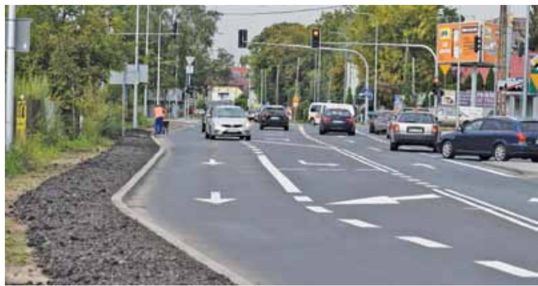
Pobocza przy drodze krajowej nie są najbezpieczniejszymi ciągami dla pieszych