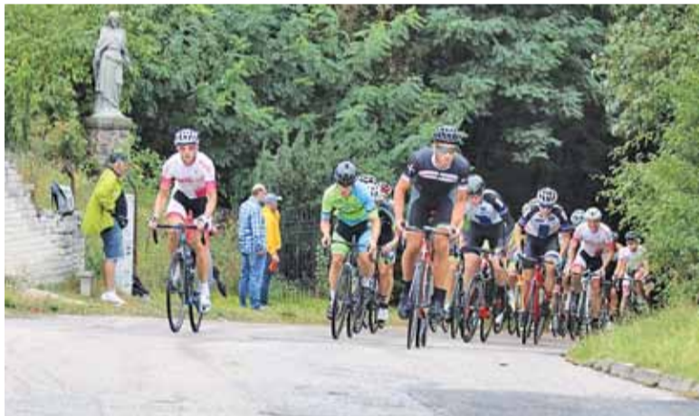
Ponad 150 cyklistów wzięło udział w ŻTC BIKE RACE w Górze Kalwarii