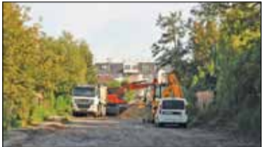
|| Piaseczno - Objazd z nowym rokiem szkolnym s. 2

PIASECZNO || GÓRA KALWARIA || KONSTANCIN-JEZIORNA || LESZNOWOLA || PRAŻMÓW || TARCZYN