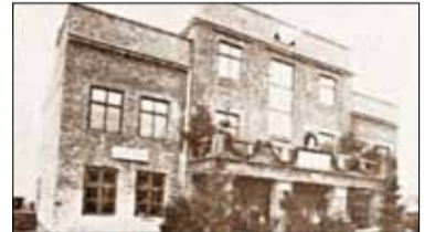
|| Historia - Stara mleczarnia cz. 2 s. 11