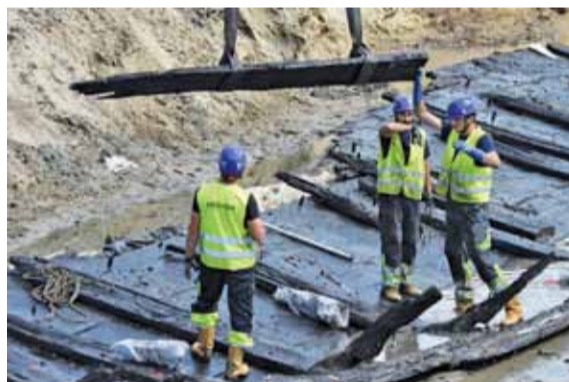
Z wykopu cały czas odpompowywany jest szlam. Wyłączenie pomp spowodowałoby zalanie szkuty