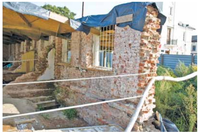
Zadaszenie jest tylko nad obszarem piwnic