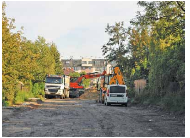
Ruch z Jana Pawła II przeniesie się na trasę objazdu