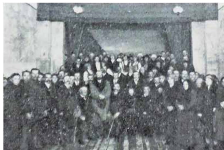
24 listopada 1928 r. – na zdjęciu uczestnicy uroczystości poświęcenia Domu Ludowego w Piasecznie