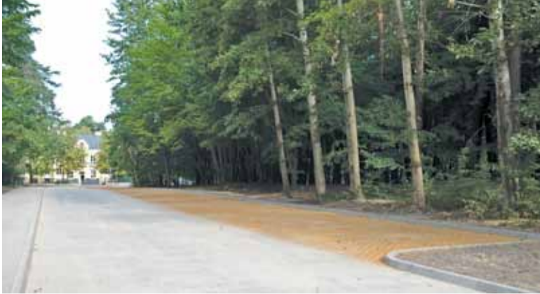
Ta inwestycja zwiększy nie tylko komfort, ale i bezpieczeństwo mieszkańców