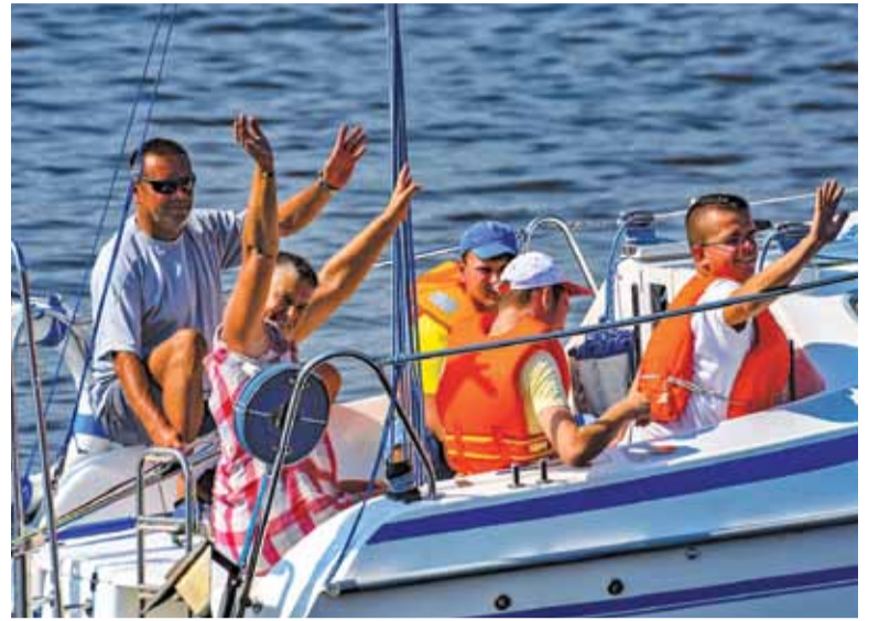
Ostatniego dnia półkolonii dzieci pływały po zalewie żaglówkami

– Intelktualnej niepełnosprawności nie da się cofnąć. Możemy jednak tym osobom dać bardzo wiele; dla nich spotkanie z zimnokrwistymi końmi to ogromne przeżycie, bo te konie są prawdziwe. Podobnie pływanie kajakami, żaglówką. Nas, osób pełnosprawnych, jest