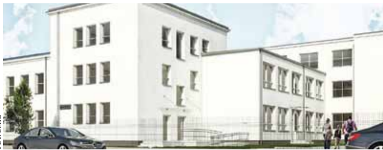
Wizualizacja rozbudowy stołówki (autorem wizualizacji jest Studio Budowlane Unity s.c.)

Projekt i pozwolenie na budowę jest. Obecnie przetarg jest w trakcie roz-