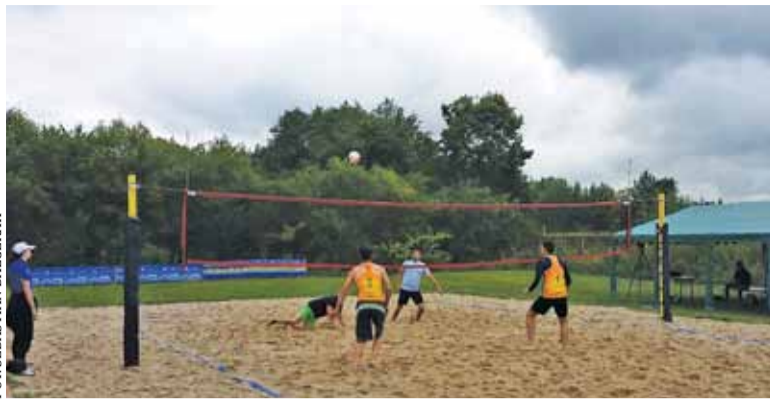
„Na piachu” niejednokrotnie było trzeba dać z siebie wszystko

Siatkówka plażowa ma to do siebie, że lubi zaskakiwać, a zaangażowaniem i wolą walki można wiele osiągnąć. Nie inaczej było na Uwieliny Summer CUP, czyli amatorskim turnieju plażówki. Udział mógł wziąć każdy, kto odpowiednio wcześniej się zgłosił. Wiele osób przyszło też po prostu w roli kibiców, aby wspierać i podziwiać zawodników. A było co, bowiem nie