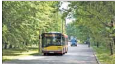
|| Konstancin-Jeziorna - Rusza pierwsza strefa s. 4