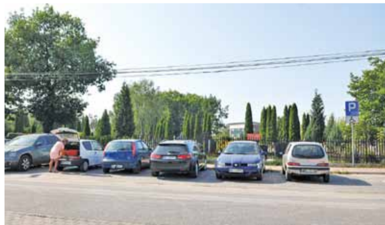
Pomysł Komisji Polityki Gospodarczej to postawienie znaku zakazującego postoju na parkingu powyżej 2 godzin