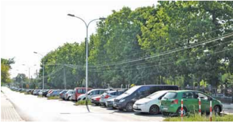
Jak widać nawet w ciągu dnia w środku tygodnia nie zawsze łatwo znaleźć miejsce przy cmentarzu na ul. Julianowskiej (czwartek, godz. 15)

Objęcie strefą płatnego parkowania obszaru przy bazarku w Piasecznie wydaje się przesądzone. Mówiło się już o tym na etapie podejmowania decyzji, czy w ogóle wprowadzać opłaty za parkowanie w mieście. Po tym, jak gmina wyremontowała odcinek ulicy Szkolnej między ulicami Wojska Polskiego i Powstańców Warszawy, przyszedł czas na uregulowanie kwestii parkowania w tym newralgicznym miejscu. Obszar, na którym miałyby obowiązywać identyczne zasady opłat za parkowanie, jak w ścisłym centrum, obejmuje miejsca parkingowe wzdłuż ulicy Szkolnej między ul. Wojska Polskiego a Aleją Róż, w tym 7 miejsc przy poczcie. Wprowadzenie opłat ma zapewnić większą rotację samochodów, a tym samym ułatwić znalezienie miejsca parkingowego przede wszystkim klientom bazarku i poczty, oraz rodzicom przywożącym i odbierającym dzieci ze szkoły.