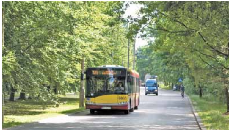
Już nie tylko z Warszawy do Ogrodu Botanicznego w Powsinie pojedziemy z biletem 1. strefy

Wraz z początkiem nowego roku szkolnego gmina Konstancin-Jeziorna zostanie objęta 1. strefą biletową. Tańsze bilety długo- i krótkookresowe będą obowiązywać na terenie całej gminy. W związku z tym, że w sąsiednich gminach Piaseczno i Góra Kalwaria nadal obowiązuje 2. strefa biletowa, przekraczając granice strefy trzeba będzie kupić bilet dwustrefowy. Przystankami granicznymi będą: Śniadeckich dla linii 724, Jasna dla linii 710, Kawęczyn dla linii 742 oraz Dębówka I i Borowina dla linii lokalnych L. Od 1 września zmieni się również numeracja linii autobusowych, które kursują tylko do granic gminy. Linia 700 zostanie zastąpiona linią 200, a linia 725 linią 264.