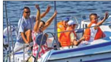
|| Lesznowola - Żeby byli szczęśliwi s. 6