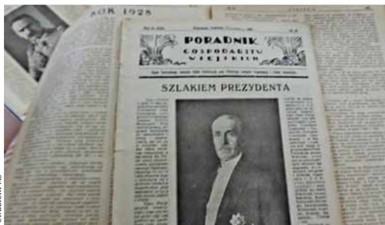
Poradnik Gospodarstw Wiejskich, na pierwszej stronie Prezydent RP prof. dr Ignacy Mościcki

zydenta prof. Ignacego Mościckiego". Następnie zwiedzano gospodarstwo, w którym odbył się pokaz bydła nizinnego. Obejrzano postęp prac melioracyjnych spółki wodnej. Do swego wzorowego gospodarstwa zaprosił pana Prezydenta