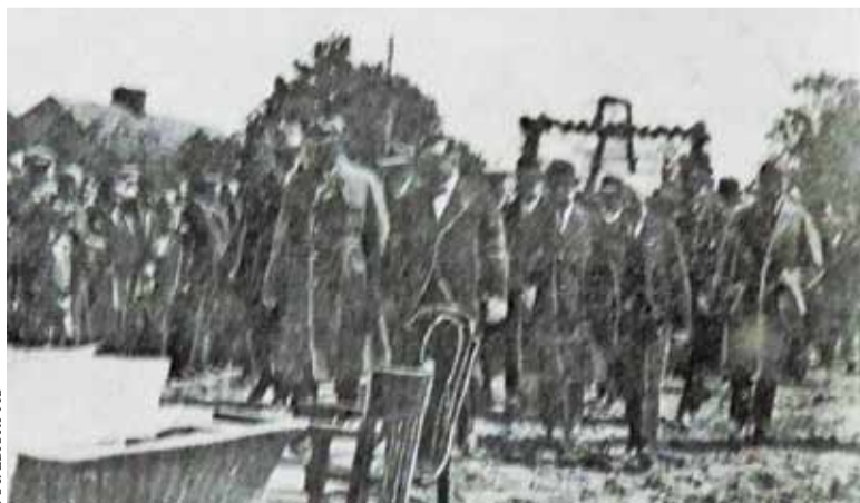
3 czerwca 1928 r. Prezydent RP zmierza do miejsca, w którym zostanie wmurowana pierwsza cegła pod Dom Ludowy

napisz do autorki m.szturowska@przebladpiaseczynski.pl