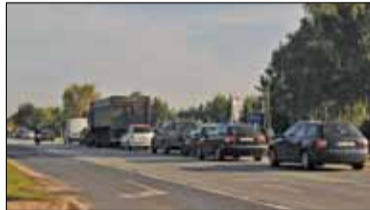
|| Powiat - Wrzesień zweryfikuje s. 5