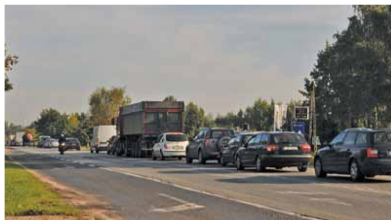
Korek w kierunku Warszawy to standard, ale teraz wymaga więcej cierpliwości

– Wydłużyli czerwone światło dla drogi 79 i już mamy gigantyczny czas oczekiwania na przejechanie tych światła, a są wakacje i ruch jest znacznie mniejszy, niż w trakcie roku szkolnego,