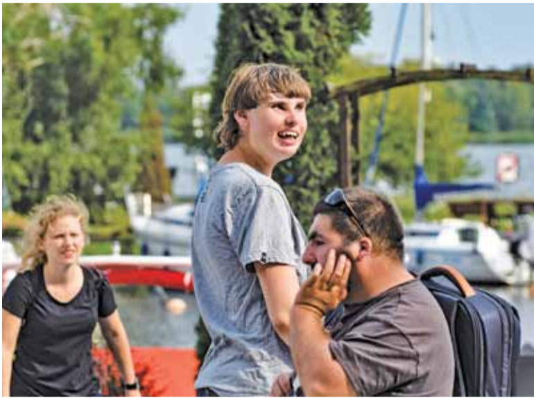
Celem jest, aby niepełnosprawne dzieci były szczęśliwe