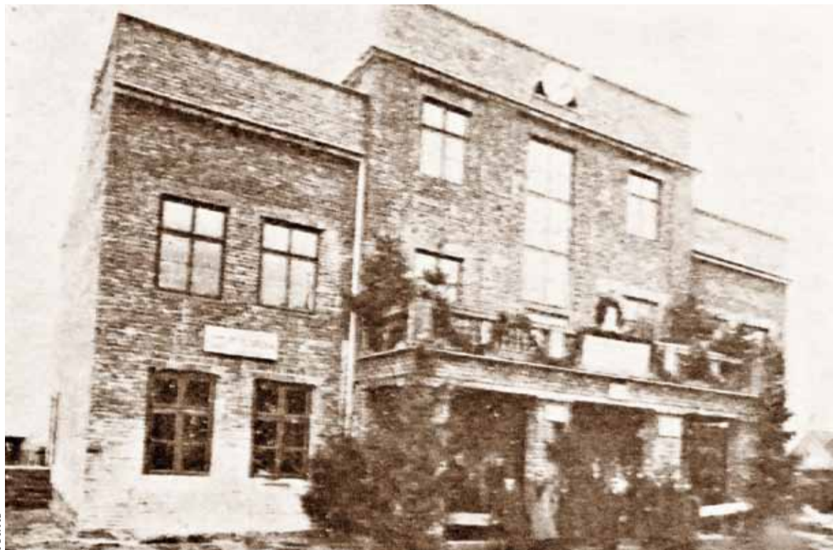
Dom Ludowy w Piasecznie (stara mleczarnia) w dniu 24 listopada 1928 r.

Jakże ważną rolę musiał odegrać w życiu społeczeństwa piaseczyńskiego budynek stojący dziś na skrzyżowaniu ulic Jana Pawła II i ul. Dworcowej, skoro sam Prezydent RP położył pierwszą cegłę pod jego budowę. Na pewno budynek jest symbolem zmian w polskiej pozaborowej, powojennej rzeczywistości. Opowiem dziś kilka słów o postępie, jaki się dokonał na piaseczyńskiej wsi.