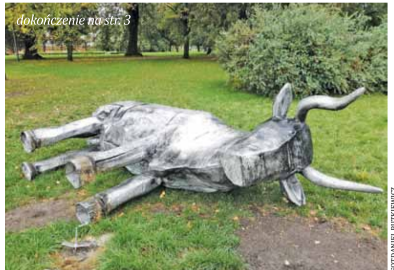
Tur był zamocowany do betonowego podłoża metalowymi prętami