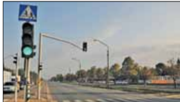
|| Piaseczno - Cuda w Pyrach s. 5