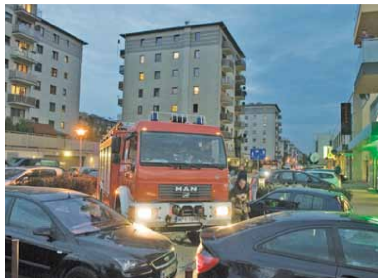
Strażacy muszą być również mistrzami kierowcy

stawiających bezmyślnie drogi. Wielu opowiada się za opcją taranowania takich samochodów.