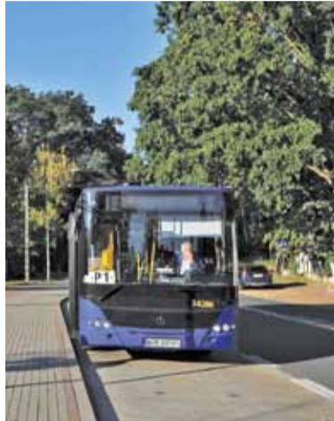
Przystanek przy szkole na razie nie jest wykorzystywany przez uczniów

– Brakuje informacji, promocji takiego rozwiązania – tłumaczył niską frekwencję w autobusach nasz czytelnik. – Ja jestem emerytem, nie korzystam z Internetu, więc nie miałem pojęcia, że taki autobus jeździ i to za darmo. A na przystanku też się nikt tego nie dowie, bo na tych nowych nie ma żadnej informacji, a na starych jest nieaktualny