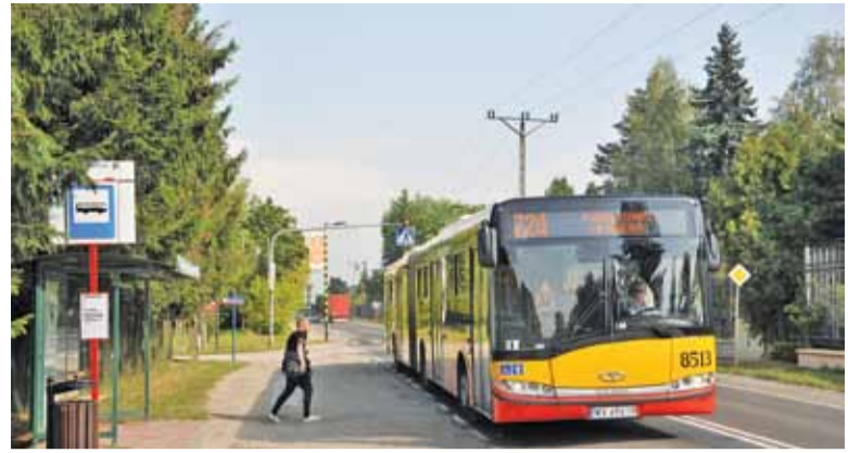
Linia 724 zawiezie mieszkańców Piaseczna i Konstancina-Jeziorna do Metra Kabaty