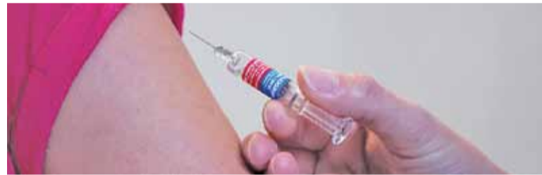
Aktywiści chcą, aby szczepienia były jednym z punktowanych kryteriów w rekrutacji do żłobków i przedszkoli