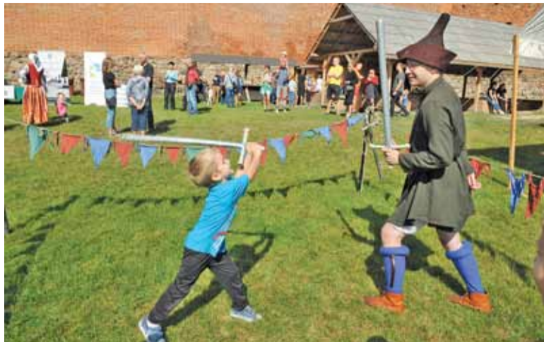
Tuż po hejnale miecze poszły w ruch

Tegoroczna impreza odbywała się pod hasłem „Niepodległa dla