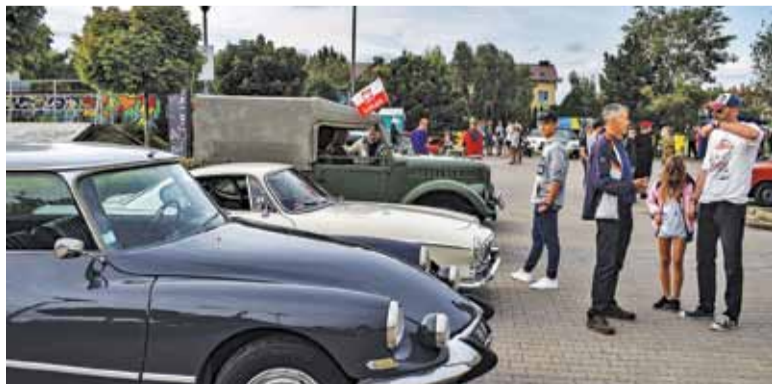
Spoty to świetna atmosfera i wyjątkowe egzemplarze światowej motoryzacji

Spot organizowany jest na parking koło szkoły w Nowej Iwicznej, obok skateparku. Zapraszamy każdego kto choć