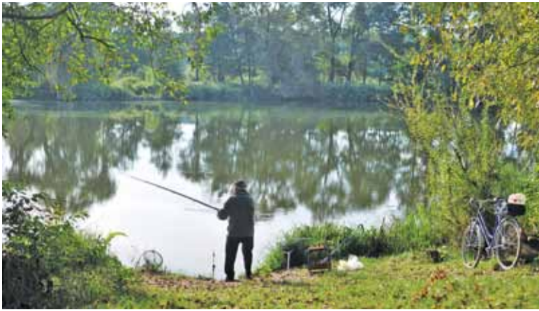
Wędkarze korzystają z odcinków linii brzegowej, do których fetor nie dociera