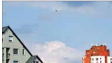
|| Piaseczno - Nie jest głośniejsze s. 4