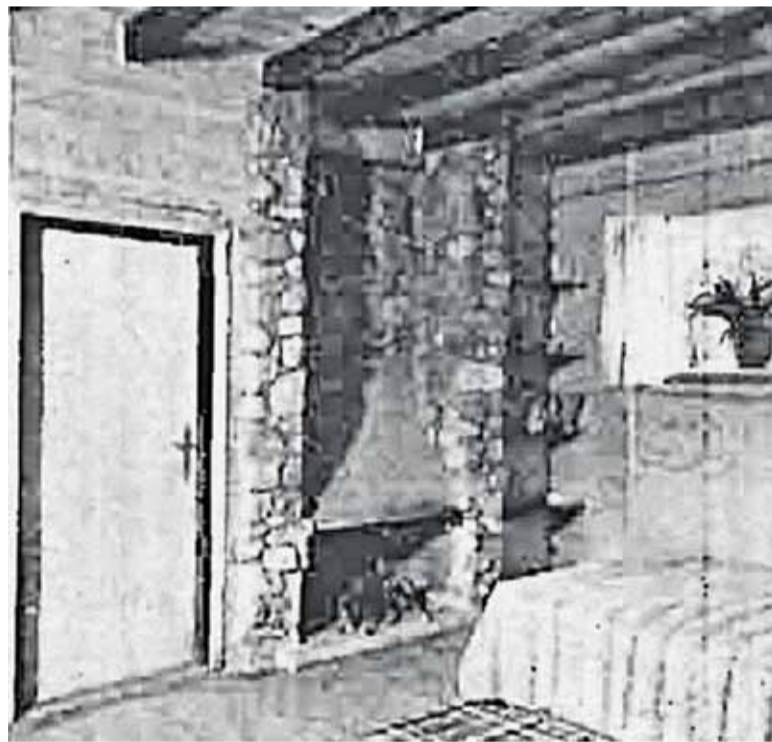
1938 r. Zalesie Górne wnętrze domu letniskowego według projektu arch. Ptaszyckich

domkami. Była tu kiedyś gajówka i karczma zwana Dumanką, jeszcze dawniej miejsce to zwano Zapole Leśne. Tu nasz wędrowiec staje na odpoczynek. Wioskę zamieszkują pracownicy leśni lub robotnicy (stawowi), zatrudnieni przy stawach żabienieckich. Dzierżawią ziemię od gospodarzy z Jesówki. Czego może się tu dowiedzieć nasz podróżny? Najważniejsze informacje dotyczą do-