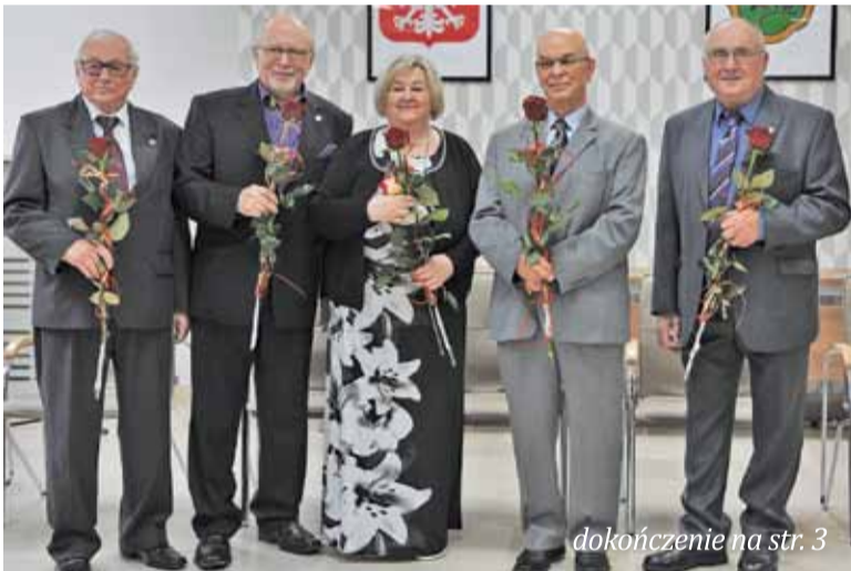
Nagrodzeni za swoją działalność nie ukrywali, że to wzruszająca chwila