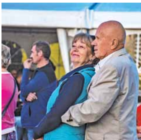
Koncert zespołu Cliver rozruszał całą publiczność i był okazją do dobrej zabawy dla wszystkich

Niemiecki dramaturg Friedrich Schiller pisał: „Z głupotą sami bogowie walczą nadaremno”. 200 lat później głupota wciąż jest faworytem w tej walce.