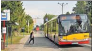
|| Konstancin-Jeziorna - Autobusowa rewolucja s. 2

PIASECZNO || GÓRA KALWARIA || KONSTANCIN-JEZIORNA || LESZNOWOLA || PRAŻMÓW || TARCZYN