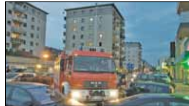
|| Piaseczno - Taranowanie to tylko na filmach s. 7