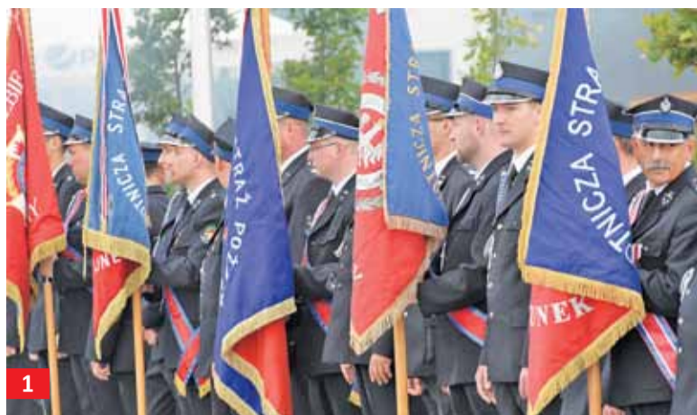
AUTOR: JOANNA GRELA