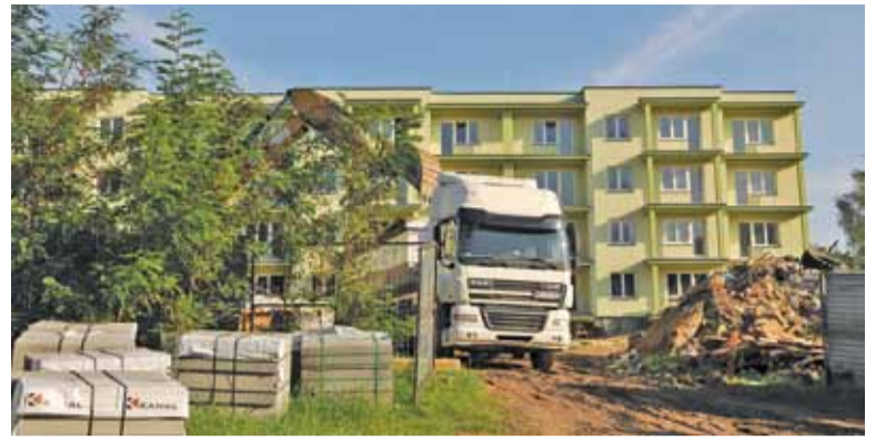
Obecnie trwa zagospodarowywanie terenu wokół budynku