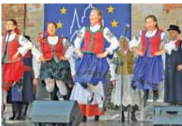
Na scenie zatańczyły między innymi Kalwarki i Urzeczeni

Zamek w Czersku po raz kolejny otworzył swoje podwoje dla mieszkańców i turystów z okazji obchodów XXI Europejskich Dni Dziedzictwa, których główną ideą jest promowanie zabytków.