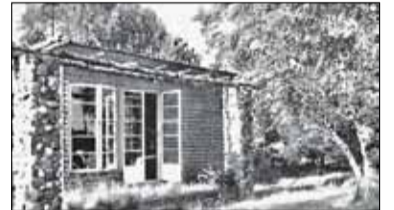
|| Historia - O marzeniach Warszawiaków s. 9