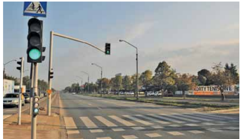
Za sygnalizatorem w Pyrach droga staje się w pełni przejezdna