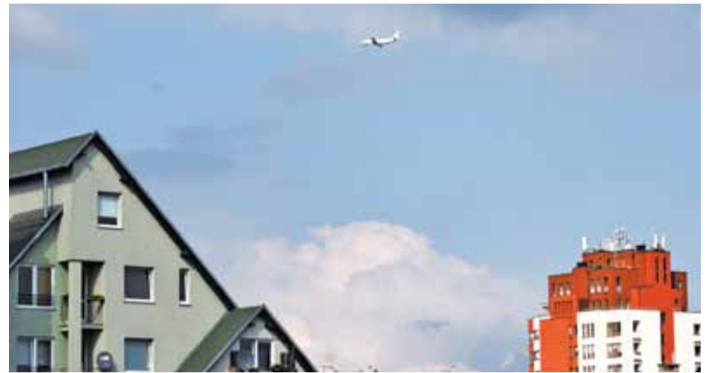
Wg danych z punktu pomiarowego na Urzędzie Miasta i Gminy, hałas wcale się nie zwiększa

Samoloty na Okęciu korzystają z dwóch pasów startowych, krótszego na kierunku Ursus – Ursynów, oraz dłuższego na kierunku Bemowo – Piaseczno. Najczęściej używany jest ten dłuższy. Samoloty startują i lądują zarówno nad Ursusem, jak i nad Piasecznem. To uzależnione jest od kierunku wiatru. Z kolei kiedy wiatr jest tak słaby, że jego kierunek nie ma znaczenia, lotnisko stara się loty ustawiać „sprawiedliwie” – nad Ursusem i nad Piasecznem.