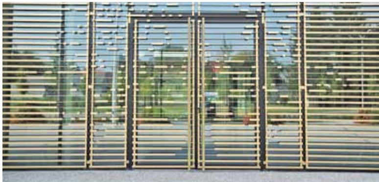
Trzyszybowe drzwi frontowe wpisane są w element ozdobny elewacji – drzewo nawiązujące do herbu miasta