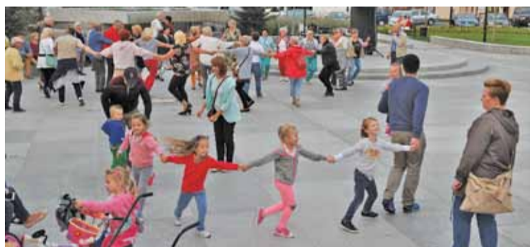
Taniec połączył pokolenia