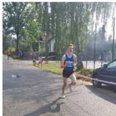
Dorośli zawodnicy biegi na dystansie 1 lub 3km