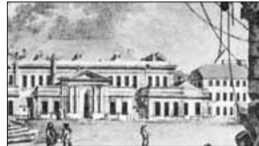
|| Historia - Ludzie teatru s. 9