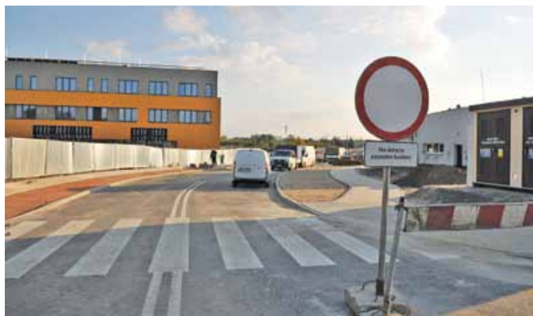
Nową ulicą dojedziemy do nowej szkoły czy na dworzec