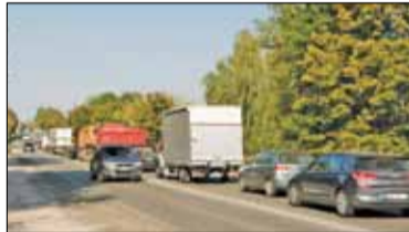
|| Piaseczno - Kierowco, nie śpij! s. 7