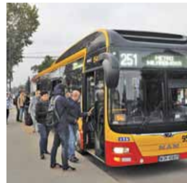
Hybrydowe 251 jest pełne już na drugim przystanku w Konstancinie-Jeziornie

– W sumie mógłbym dojeżdżać teraz do pracy metrem zamiast stać w korku, ale nie wyobrażam sobie wciskania się do autobusu dwa razy dziennie – mówi pracujący w centrum Warszawy informatyk. Zmiana częstotliwości kursowania autobusów wiązałaby się oczywiście z większymi wydatkami gminy.