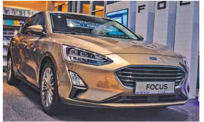
IV generacja Focusa ma tylko dwa nadwozia – 5-drzwiowy hatchback...

– Zaawansowane systemy wspomagające kierowcę korzystają z dwóch kamer, trzech radarów i 12 czujników ultradźwiękowych, które wspólnie mogą monitorować obszar wokół pojazdu i skanować drogę przed nim – informuje producent. – O bezpieczeństwo dbają np. system Pre-Collision Assist z funkcją wykrywania pieszych, funkcja sygnalizacji niezamierzonej zmiany pasa ruchu, system wspomaganie manewru omijania przeszkody, system Cross-Traffic Alert który skanuje lewą i prawą stronę pojazdu podczas wyjazdu tyłem z prostopadłego miejsca postojowego czy system Driver Alert, który monitoruje zachowanie kierowcy podczas jazdy i może ostrzec go, że powinien zrobić przerwę.