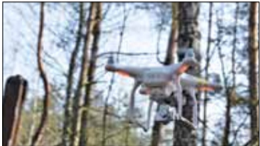
|| Konstancin-Jeziorna - Drony przeciwko smogowi s. 2

PIASECZNO || GÓRA KALWARIA || KONSTANCIN-JEZIORNA || LESZNOWOLA || PRAŻMÓW || TARCZYN