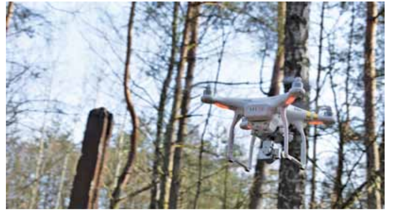
Pomiary jakości powietrza wykonywane za pomocą dronów są bardzo skuteczne, łatwe i szybkie