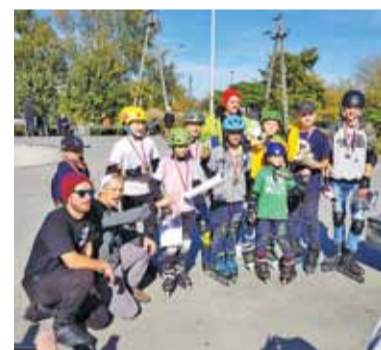
Rollcamp Champion z roku na rok jest coraz lepsze

w rozwoju oraz samodoskonaleniu. I przynosi to efekty, bowiem z roku na rok poziom systematycznie wzrasta. Także podczas rozgrywanych na piaseczyńskim skateparku finałów nie zabrakło emocji. Jako, że był to ostatni przystanek, zawodnicy, którzy wcześniej zebrali mało punktów nie mieli już szans na medale. Wobec tego pojawili się najlepsi z najlepszych i zapewnili świetne widowisko. Nie brakowało efektownych sztuczek, salt, piruetów, agresywnej jazdy i ogromu emocji. A warto zaznaczyć, że większość uczestników miała zaledwie kilka lub kilkanaście lat. Organizatorzy zadbali, aby rolkarze zostali odpowiednio nagrodzeni za trud włożony w cały sezon. Każdy dostał medal, a najlepsi specjalne, ręcznie robione puchary w formie witrażowej. Oprócz tego nie zabrakło dziesiątek mniejszych lub większych nagród od sponsorów, powiązanych z charakterem zawodów. Oczywiście dominowały dobra zabawa i pozytywne emocje, a młodzi sportowcy mogli