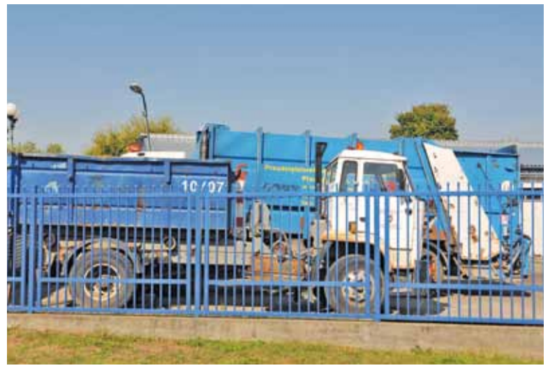
Jednym z zapisów przetargu są wymagania dotyczące rodzajów samochodów oraz ilości emitowanych przez nie spalin