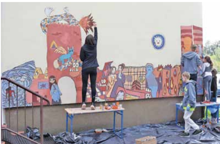
Uczniowie namalowali w piątek piękny mural na murze swojej szkoły