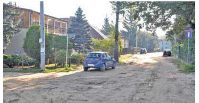
Pył i błoto powinny przestać być zmartwieniem mieszkańców już za dwa miesiące

znaleźć można kałuże. Prace odwodnieniowe trwały wprawdzie długo, między innymi ze względu na pojawiające się notorycznie niezgodności między mapami a stanem faktycznym, jeśli chodzi o infrastrukturę podziemną, ale w większości zostały już zakończone. Przyszedł czas na utwardzenie drogi. Przetarg na to zadanie gmina ogłosiła na początku września. Zakończył się tuż przed sesją rady gminy w ubiegłą środę 19 września. Burmistrz Zdzisław Lis przygotował już uchwałę dotyczącą