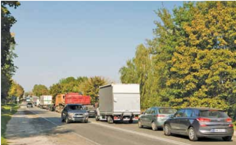
Cykl świateł już się nie wydłuża, więc do sytuacji trzeba się przyzwyczaić