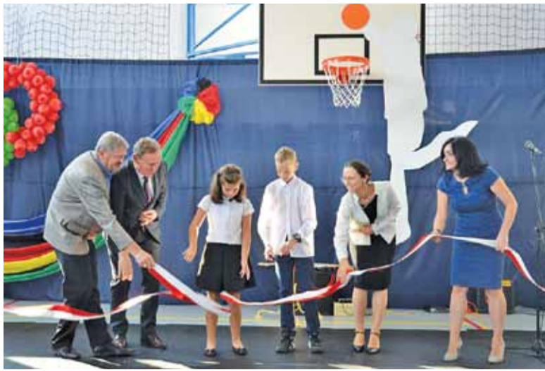
Czachówek długo czekał na nową salę gimnastyczną