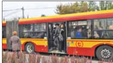
|| Konstancin-Jeziorna - Jak sardynki s. 5