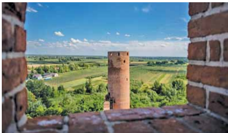
Zamek w Czersku to niezwykle malownicze miejsce

– Zamek znajduje się w pięknej, malowniczej miejscowości, skąd widok na pradolinę Wisły tworzy niepowtarzalny krajobraz. Pierwsi ludzie w tej miejscowości pojawili się 2 tys. lat temu, ale sam zamek zbudowany został przez Janu-