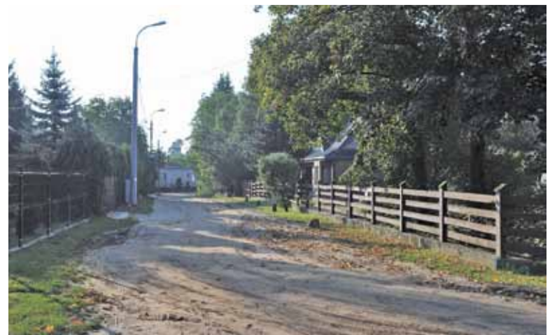
„Cywilizacja” zawita też w ten obszar Zalesia Dolnego