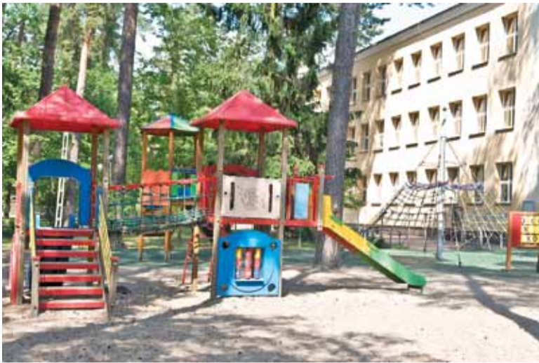
Na modernizację placu zabaw przy SP2 gmina ma wydać 70 tys. złotych