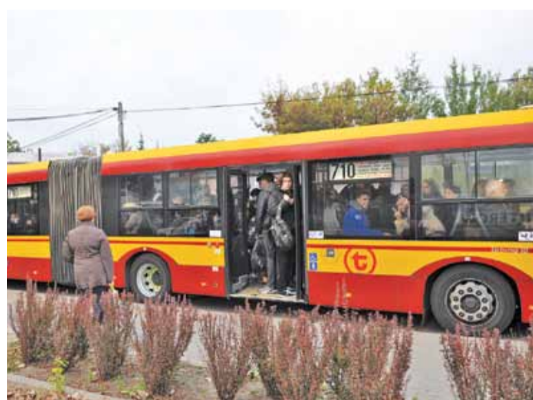
Na przystanku „Polna” po 7 rano ciężko wsiąść do autobusu 710