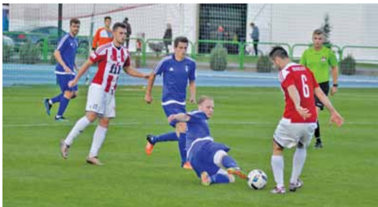
FOT. MKS PIASECZNO