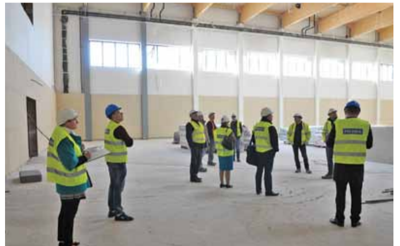
Radni z Komisji Oświaty sprawdzali zaawansowanie prac