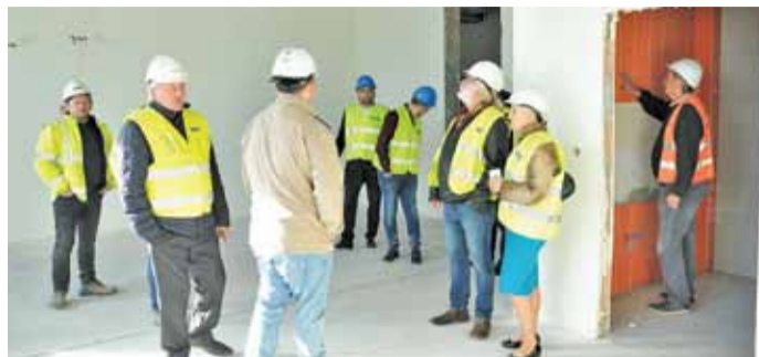
Wewnątrz budynku rozpoczęły się prace wykończeniowe

Kiedy na początku wakacji odwiedziliśmy plac budowy Centrum Edukacyjno-Multimedialnego w Piasecznie, mowa była o zakończeniu prac zgodnie z planem, w listopadzie.