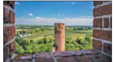
|| Góra Kalwaria - Najpiękniejsze miejsce s. 12