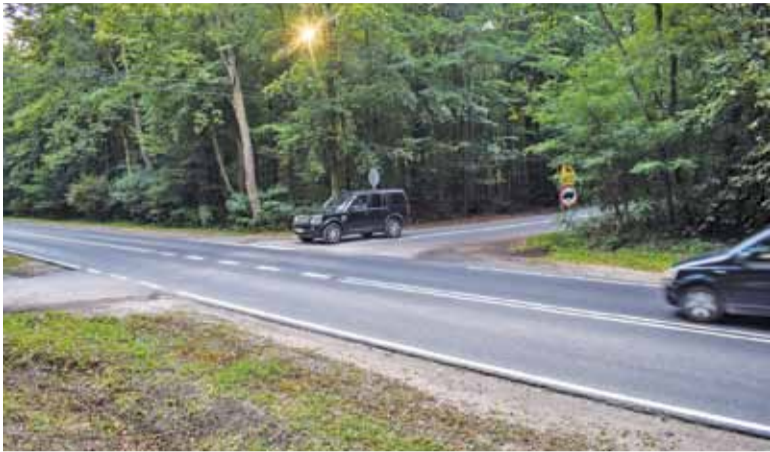
Mimo namalowania podwójnej ciągłej linii, kierowcy dalej wyprzedzają w tym miejscu