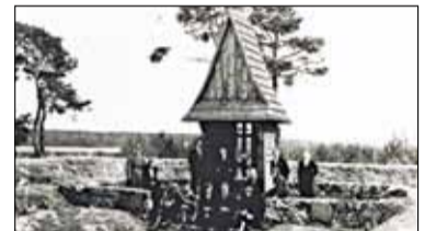
|| Historia - Drogi do wolności