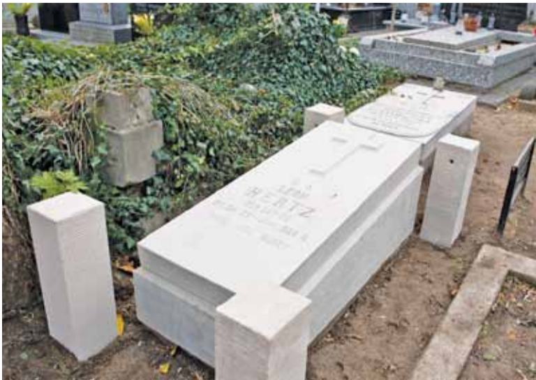
Nagrobek Leona Hertza to jeden z tych odrestaurowanych w 2018 r.