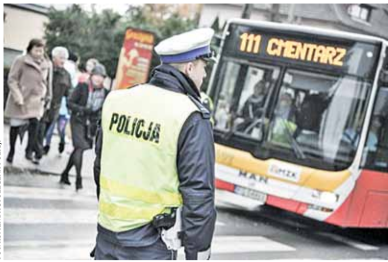
Policja rozpoczęła Akcję Znicz