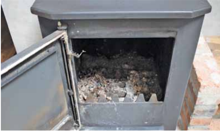
Najważniejsza jest konserwacja, czyszczenie i przeglądy techniczne instalacji gazowych i kominów

kominowych (dymowych, spalinowych i wentylacyjnych).