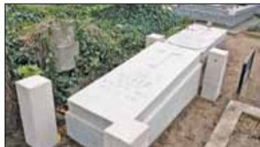
|| Piaseczno - Odnawiają kolejne groby