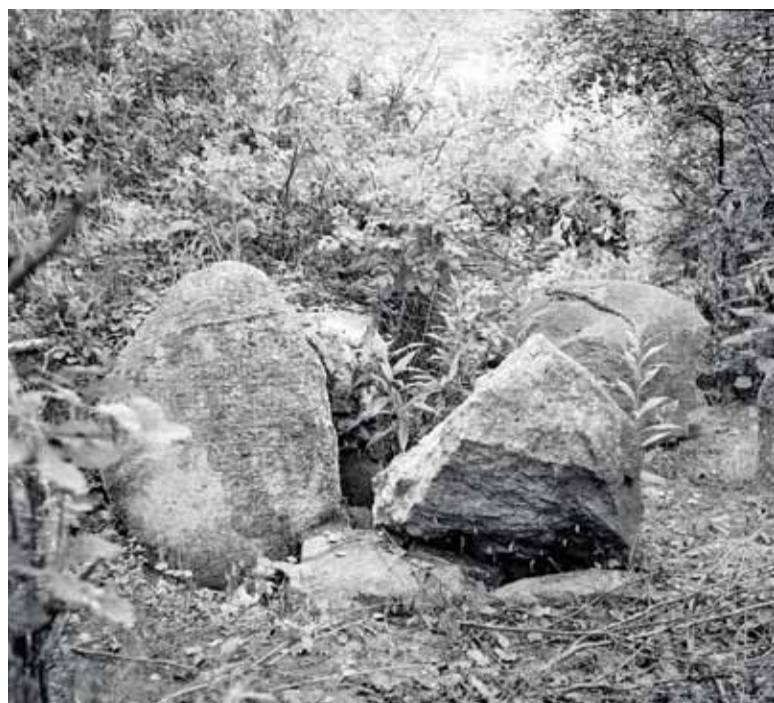
Różanka w latach 70. XX wieku