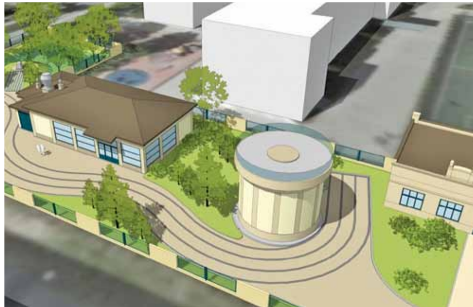
Wizualizacja nowej Stacji Uzdatniania Wody Kalwaryjska

Znaczna część miasta zaopatrywana jest w wodę właśnie z tego miejsca. To jednostka wybudowana w połowie ubiegłego wieku, dlatego dziś musi być kompleksowo zmodernizowana.