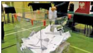
|| Mazowsze - PiS bez większości