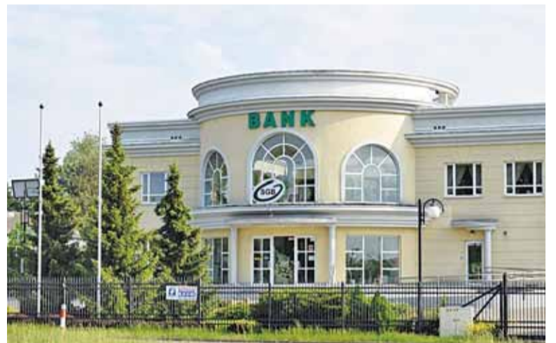
Śledztwo w sprawie BS w Lesznowoli trwa od 2016 r.

Śledztwo dotyczące wyłudzenia wielomilionowych kredytów z Banku Spółdzielczego w Lesznowoli trwa od 2016 r. Zostało wszczęte na podstawie zawiadomienia o podejrzeniu popełnienia przestępstwa, skierowanego przez Komisję Nadzoru Finansowego w sprawie nieprawidłowości w sprawozdaniach finansowych Banku Spółdzielczego w Lesznowoli, oraz uzasadnione-