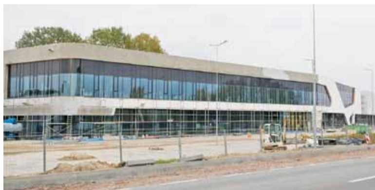
Na placu budowy trwają prace wykończeniowe

Dobiega końca budowa kolejnego parku handlowego na naszym terenie. Centrum N-Park powstało między drogą wojewódzką 721 a cmentarzem i kościołem w Starej Iwicznej. Według planów dojazd ma być zapewniony zarówno od strony ul. Mleczarskiej jak i od ul. Nowej (DW721). W trzech dwupoziomowych budynkach znajdują się między innymi nieobecne na