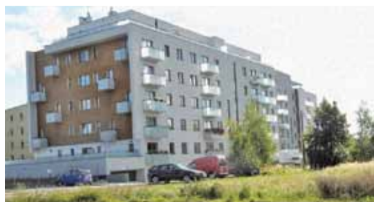
Nowe przyłącze do sieci ciepłowniczej

Wartość inwestycji zrealizowanych przez ZGK w 2016 roku przekroczyła 3,6 mln zł.