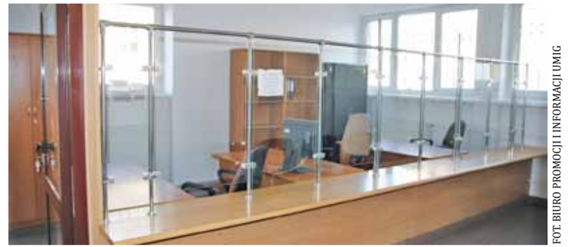
Przyjęcia interesantów będą się odbywać w bardziej komfortowych warunkach