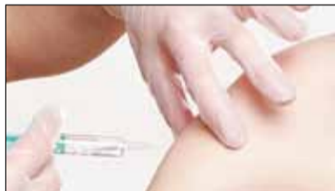
|| Powiat - Szczepić nie ma czym