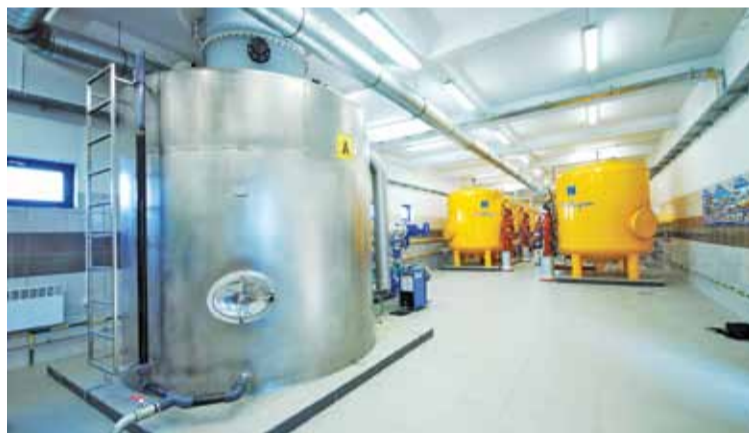
Nowa instalacja uzdatniania wody „Sobików” w Cendrowicach, rok 2015 – inwestycja w czystą i smaczną wodę.

Jedną z inwestycji, której celem było zabezpieczenie dostaw wody do mieszkańców południowo-zachodniej części gminy, była oddana do użytku w 2015 r. nowa stacja uzdatniania wody (SUW) Sobików. Wartość tej inwestycji przekroczyła 6 mln zł, z czego ponad 4 mln spółka pozyskała z Wojewódzkiego Funduszu Ochrony Środowiska i Gospodarki Wodnej w ramach preferencyjnej pożyczki z gwarantowanym 20% umorzeniem.