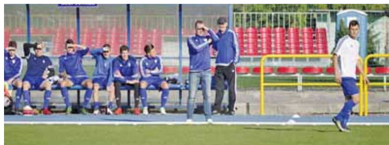
MKS jest 6. w tabeli