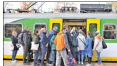
|| Piaseczno - Tłok to się dopiero zacznie