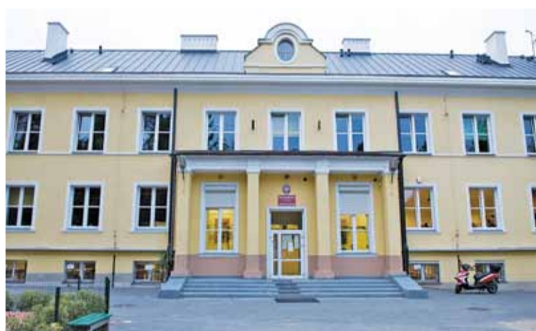
Beneficjentami projektu będą między innymi uczniowie „Krauzówki”

Planowane w ramach projektu zajęcia będą obejmowały obszar informatyki, matematyki, przedsiębiorczości,