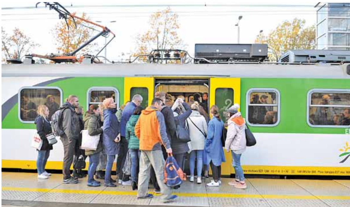
Już teraz rano trudno wsiąść do pociągu