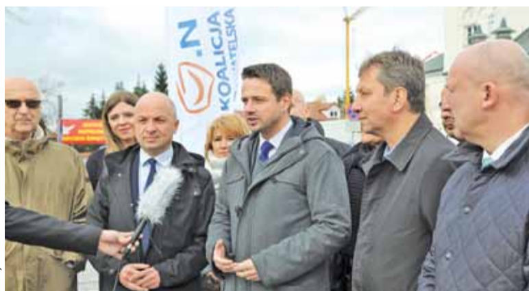
Piaseczyńscy wóldarze rozmawiali z Rafałem Trzaskowskim między innymi na Rynku

AGLOMERACYJNA WSPÓŁPRACA Stołeczny prezydent-elekt odwiedził Piaseczno i zadeklarował współpracę z samorządem gminy w ramach współpracy aglomeracyjnej.