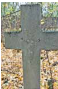
Wiele elementów dawno zostało ukradzionych

rośnięta, wyglądająca na dawno opuszczoną nieruchomość. A tymczasem za rozsypującym się ogrodzeniem i porzecznią bramą ukrywa się wpisany na listę zabytków cmentarz ewangelicko-augsbur-