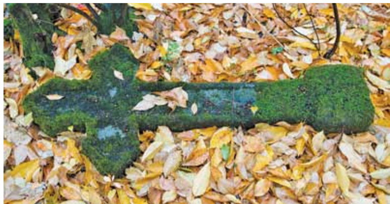
Zniszczone płyty, krzyże i pomniki często pokrywa mech