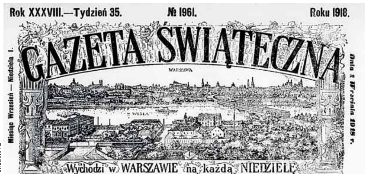
Gazeta Świąteczna z 1918 r.

Obecnie istnieje w Piasecznie szkoła gminna i 4 ochronki szkoły rady opiekuńczej dla dzieci od lat 4 do 15-tu. W jednej z nich dzieci z wyższych oddziałów utworzyły kółko »imienia królowej