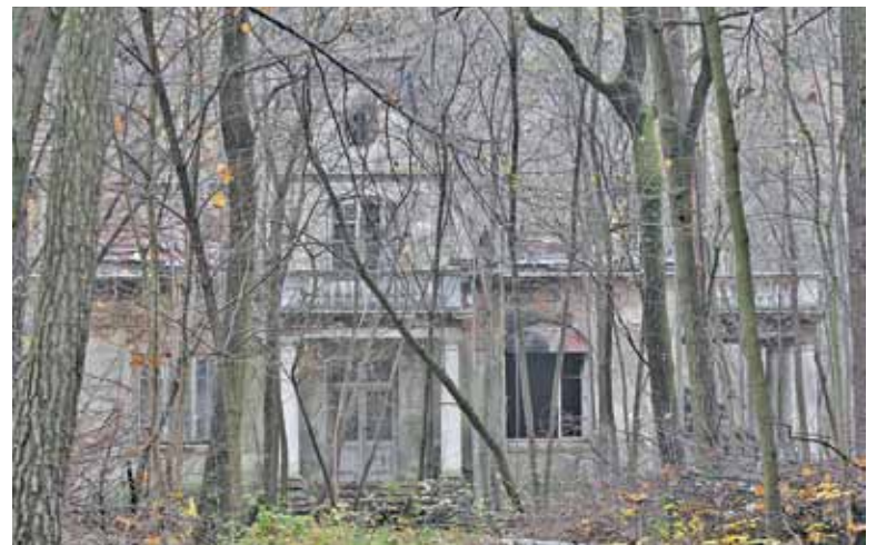
Pożar budynku na zalesionej działce stanowi zagrożenie dla sąsiednich posesji