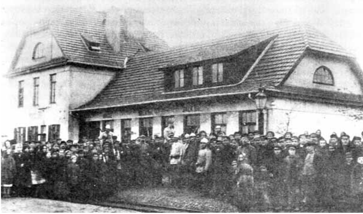
12 listopada 1918 r., dworzec kolejki grójeckiej w Piasecznie. Uzbrojeni członkowie Straży Ogniowej wśród mieszkańców Piaseczna po odstawieniu żandarmerii niemieckiej do Warszawy

Jedenasty listopada 1918 r. był ważnym dniem dla Europy i Polski. W lasku Compiègne pod Paryżem Niemcy podpisali rozejm kończący I wojnę światową. Tego samego dnia w Warszawie Rada Regencyjna przekazała naczelne dowództwo nad wojskiem polskimi Józefowi Piłsudskiemu. Po 123 latach niewoli Polska odzyskała niepodległość.