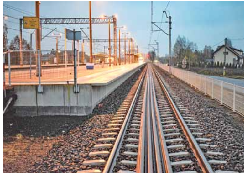
Remont linii na odcinku Czachówek – Warka generuje utrudnienia w ruchu pociągów, jednak możliwe, że zakończy się w terminie

– Oprócz modernizacji torów budowany zostanie drugi tor, a to zwiększy