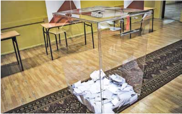
Frekwencja w naszym powiecie może tylko smuć