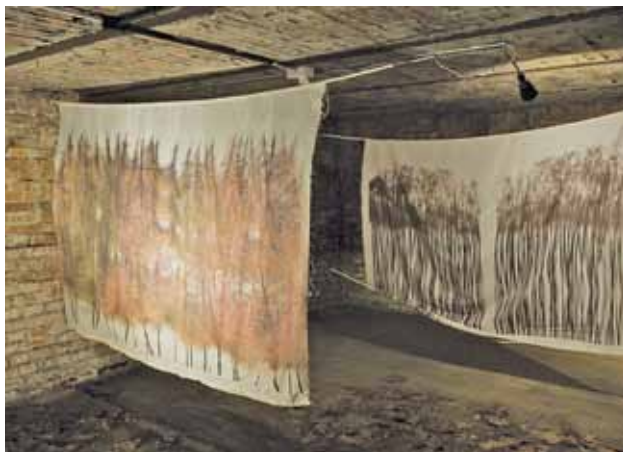
Wielkie białe płótna z grafiką doskonale wkomponowały się w surowe wnętrze