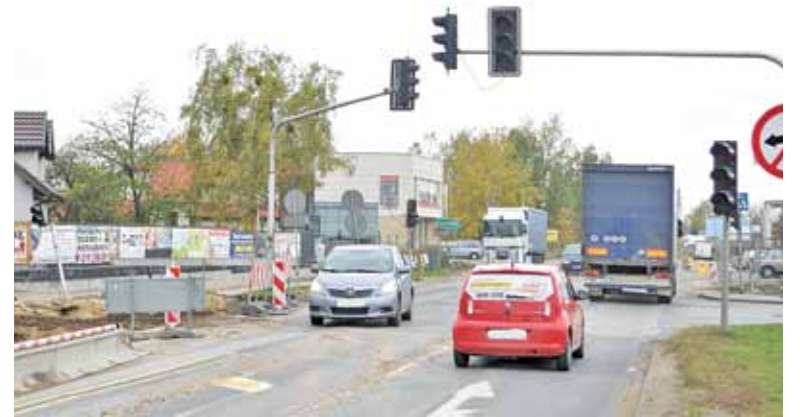
Sygnalizacja jest nieczynna z powodu przebudowy

Kierowcom i pieszym pozostaje uzbroić się w cierpliwość, zachowywać ostrożność i wzajemną życzliwość na drodze. Jeśli pogoda i „kolizje z infrastrukturą podziemną” oraz wszystkie