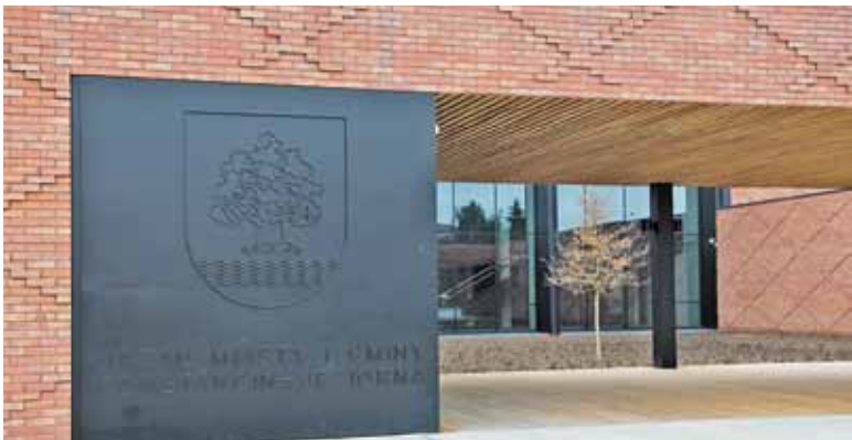
Gmina Konstancin-Jeziorna zajęła 19. miejsce