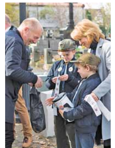
Najmłodszy kwestujący mogą liczyć na wyjątkową przychylność

O d 19 lat na piaseczyńskich cmentarzach przy ul. Kościuszki oraz ul. Julianowskiej prowadzona jest kwesta na rzecz ratowania zabytkowych nagrobków. Organizatorem akcji jest powołany do życia w 1999 r. Społeczny Komitet Renowacji Cmentarza Parafialnego w Piasecznie. Do wsparcia tej cennej inicjatywy zachęcali jak zwykle samorządowcy, ludzie kultury, harcerze i lokalni społecznicy. W tym roku 1 listopada wolontariuszom udało się zebrać do puszek rekordową sumę 22 874 zł i 17 gr. To blisko 5 tys. złotych więcej niż rok wcześniej. Ofiarności mieszkańców pozwoli na ratowanie kolejnych nagrobków na zabytkowym cmentarzu przy ul. Kościuszki w Piasecznie. W tym