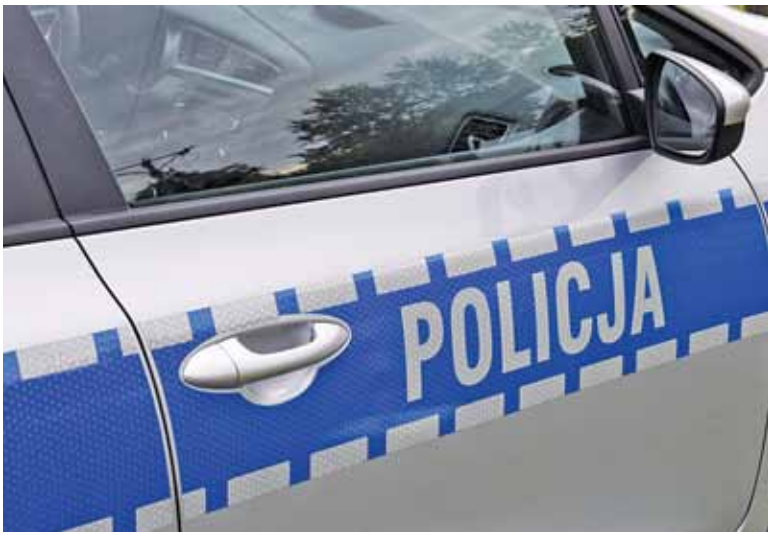
Konsekwencje niespełnienia obietnic dla policji mogą być katastrofalne