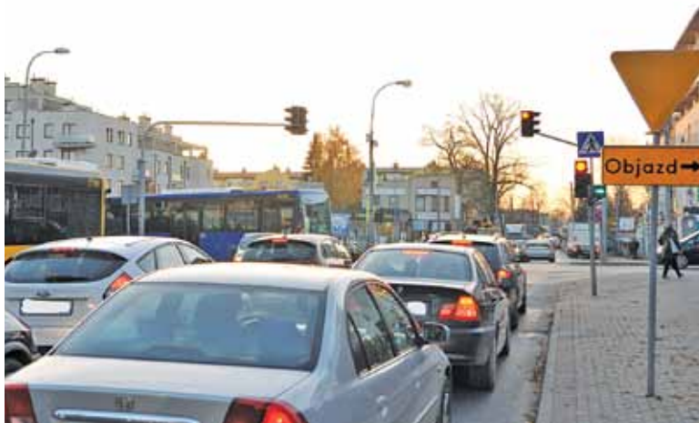
Po południu korki na ulicy Jana Pawła II tworzą się w obu kierunkach