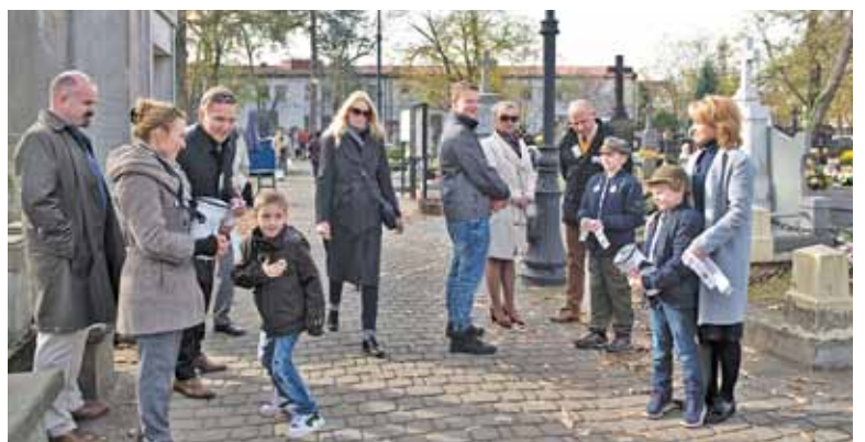
Znakomita większość osób odwiedzających cmentarz wspiera akcję datkiem

Tegoroczna kwesta zakończyła się największym sukcesem w historii. Na ratowanie zabytkowych grobów udało się zebrać blisko 23 tys. zł.