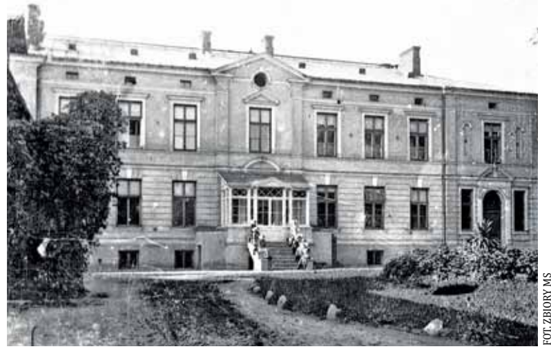
Szkoła w Chyliczkach w 1921 r.

Besserówka przy ul. Kościuszki. Byłam ciekawa, jak wyglądały w mieście te ostatnie tygodnie przed odzyskaniem niepodległości. Z felietonów prasowych z tych lat Piaseczno jawi się jako miasto zorganizowane, w którym działają organizacje pilnujące ładu i gotowe do akcji przeciwko okupantowi, ale nie tylko o