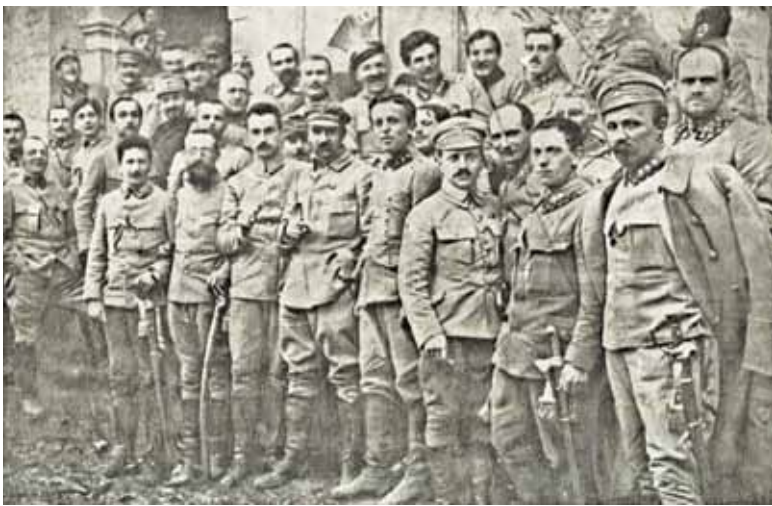
Imieniny Józefa Piłsudskiego obchodzone na polu walki nad Nidą

napisz do autorki m.szturomska@przekladpiaseczyński.pl