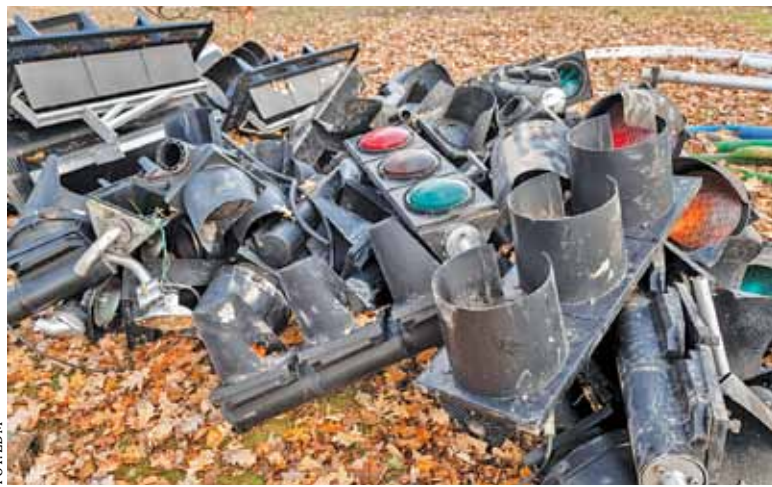
ZDM rozpoczął modernizację sygnalizacji świetlnej na Puławskiej