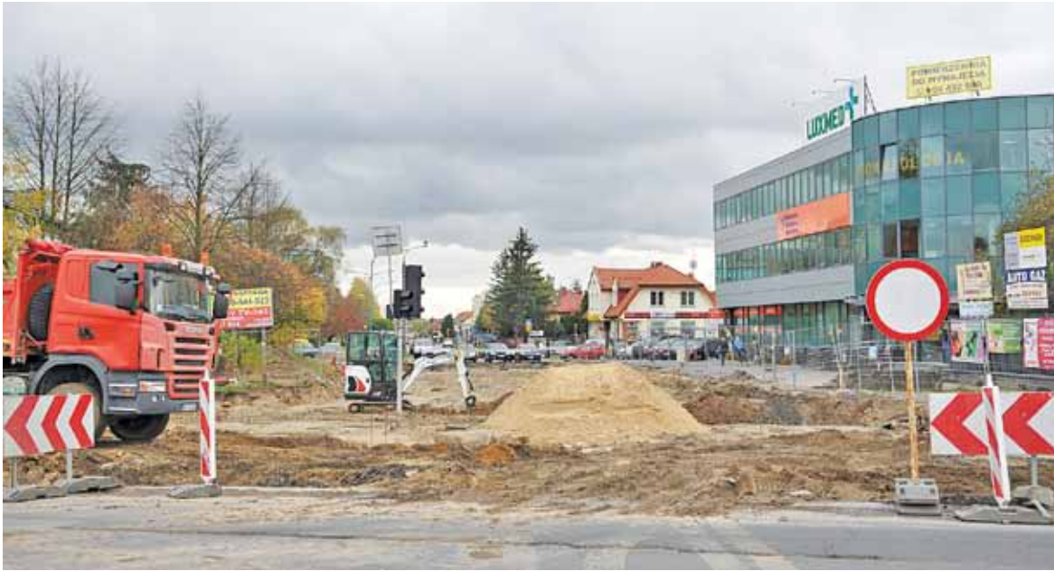
Prace na samym skrzyżowaniu ulic wykonywane są rzadko