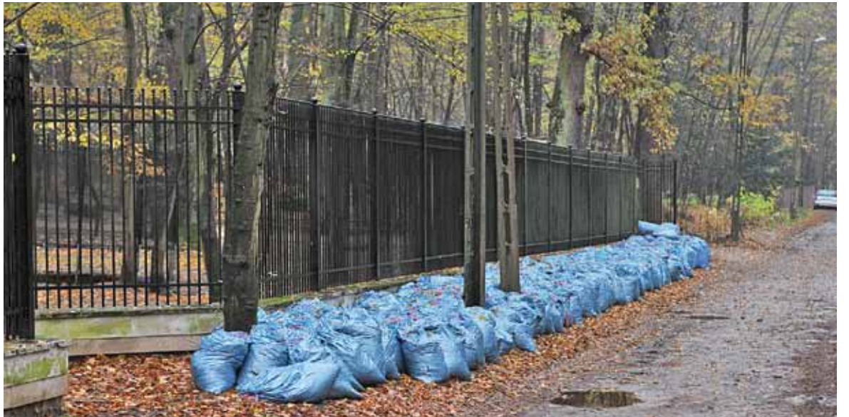
Taki widok budzi zdumienie nie tylko u śmieciarzy

To zrozumiałe, że osoby, które mają zagospodarowany ogród, dbają o jego estetyczny wygląd. Warto wtedy w jakimś kącie znaleźć miejsce na kompostownik i przynajmniej część liści przetworzyć tam na naturalny nawóz, którym wiosną zasilimy nasze drzewa i krzewy. Znacznie mniej zrozumiałe