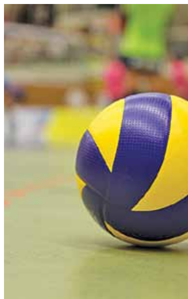
Krótką Mysiadło walczyła, ale lider nie dał się zaskoczyć

Zespół z Mysiadła chciał, ale nie chciał nie znaczyć moc. W 8. kolejce Krótką miała wymagającego rywala, który dotychczas przegrał tylko raz. W poprzednich spotkaniach NOSiR Nowy Dwór stracił zaledwie cztery sety, więc siatkarki z Mysiadła musiały wspiąć się na wyżyny, aby myśleć o sukcesie.