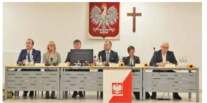
W prezydium rady i zarządzie zasiadli tylko radni z list Koalicji Obywatelskiej