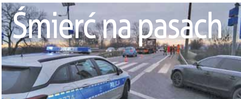
We wtorek rano doszło na tym przejściu do tragicznego wypadku