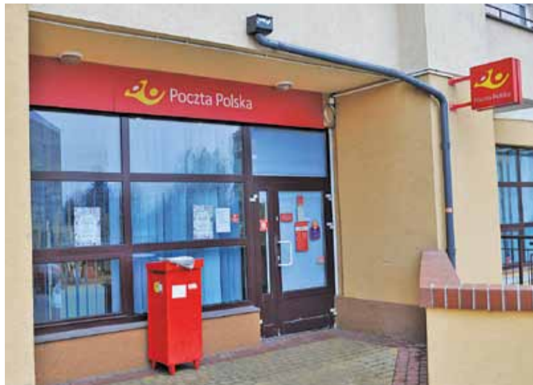
Urząd w Mysiadle obsługuje też rejon Lesznowoli, Mrokowa i Jabłonowa, w tym hale w Wólce Kosowskiej