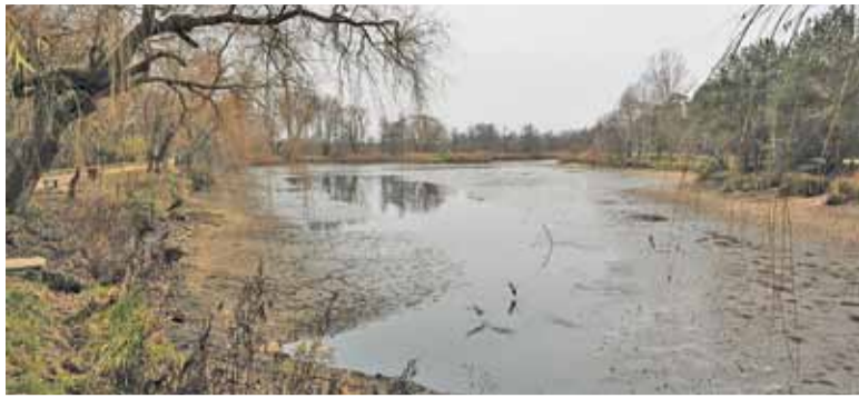
Kaczki korzystają czasem z resztek wody w stawie