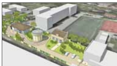
|| Góra Kalwaria - Nowa stacja s. 4