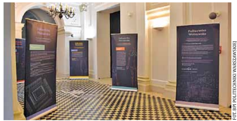
Wystawa „Inżynierowie w służbie społeczeństwu”