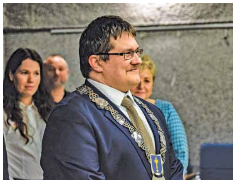
Nowy przewodniczący rady miejskiej Jan Rokita