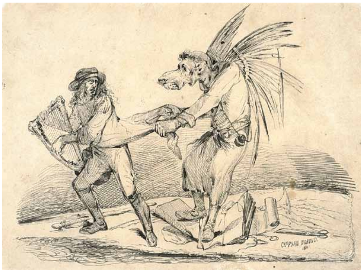
Zoilus – rys. Norwida

napisz do autorki m.szturowska@przeledpiaseczynski.pl