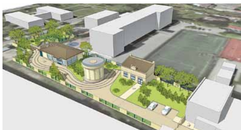
Nowa stacja uzdatniania wody będzie nowoczesnym obiektem