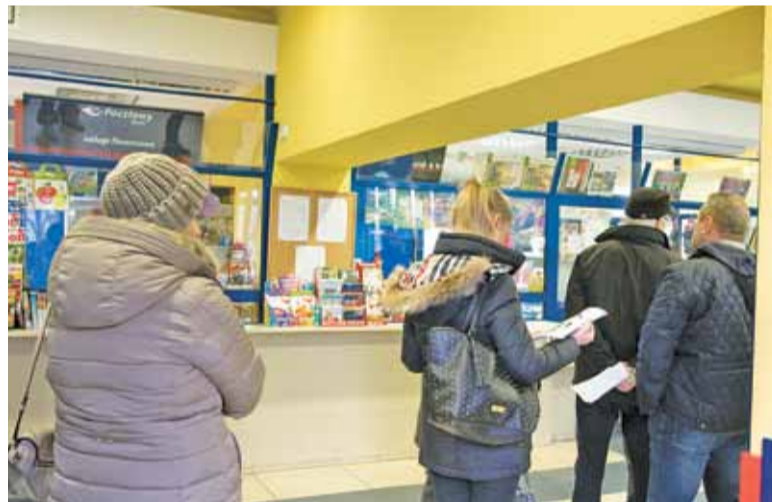
Kolejki w urzędzie w Mysiadle to standard nawet w południe w dniu powszednim

Mysiadło zostało wydzielone z Piaseczna w lipcu bieżącego roku. Miało to poprawić sytuację. Własna sortownia, oddelegowani do niej pracownicy