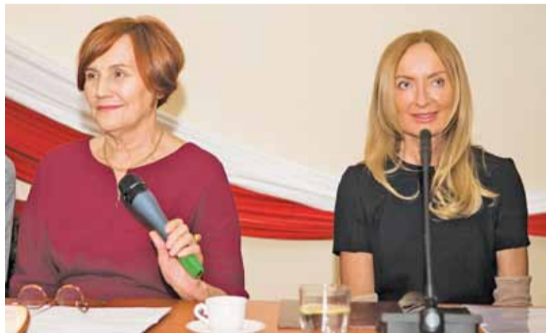
Obie panie zgodnie współpracują od lat