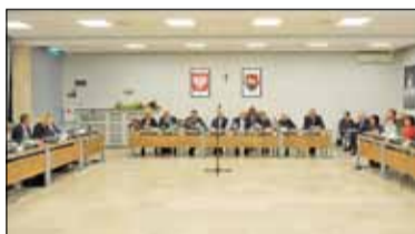
|| Powiat - Ile zarobią radni s. 2

PIASECZNO || GÓRA KALWARIA || KONSTANCIN-JEZIORNA || LESZNOWOLA || PRAŻMÓW || TARCZYN