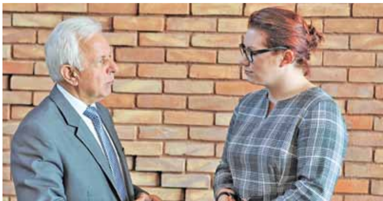
Pierwsza lekcja od doświadczonego samorządowca?