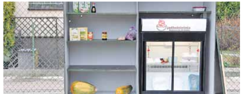
Gotowe posiłki, produkty paczkowane czy specjały z własnego ogrodu – wszystkim można się podzielić