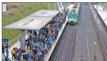
|| Piaseczno - Gorzej niż było s. 3