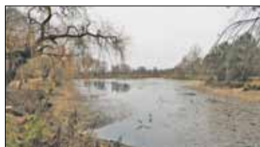
|| Piaseczno - Staw bez wody s. 6