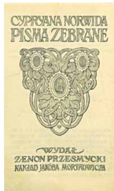
Okładka pierwszego wydania dzieł Norwida