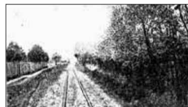
|| Historia - Kolejka wilanowska a płot poety cz. 2 s. 9