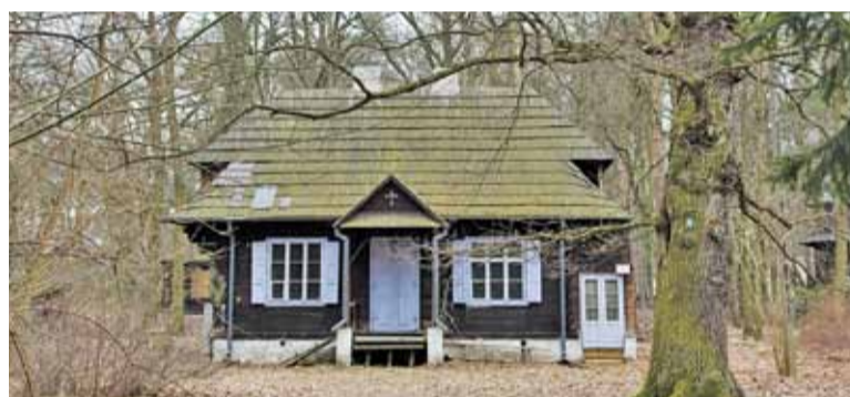
Pracownicy firmy Revelare twierdzą, że znaleźli dokumenty przypadkiem