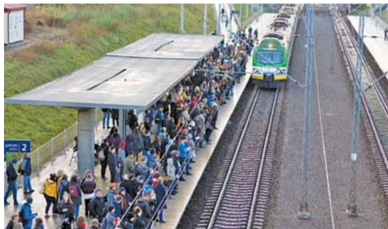
Tyłu pasażerów wsiada w pociąg o godzinie 7.00 w Piasecznie