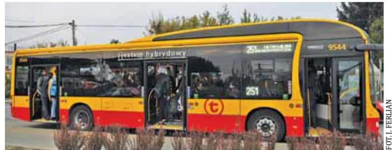
Autobus 251 miałby jeździć częściej w godzinach szczytu

Poranne kursy linii 742 powinny zostać dostosowane do potrzeb uczniów, którzy muszą zdążyć na lekcje zarówno w szkołach średnich w Górze Kalwarii, jak i w Konstancinie-Jeziornie. Trasa linii 251 miałaby zostać wydłużona do pętli przy przystanku Pańska, za to skrócona na odcinku warszawskim – autobus miałby kończyć kurs w Wilanowie, zamiast dojeżdżać do Metra Wilanowska. Taki wniosek często podnoszą mieszkańcy, zwracając uwagę, że odcinek między Wilanowem a stacją metra Wilanowska jest zwykle bardzo zakorkowany, co między innymi powoduje duże opóźnienia. A z kolei w sytuacji, gdy pasażerowie mogą skorzystać z autobusów dojeżdżających do metra Kabaty, znacznie szybciej mogą dotrzeć