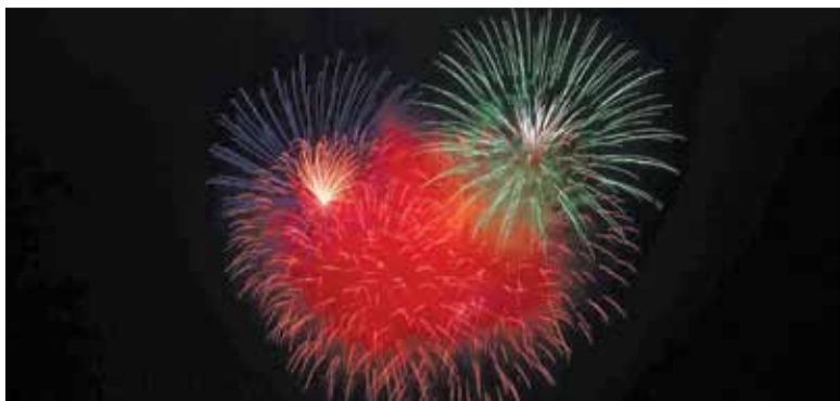
Fajerwerki w sylwestra to ogromny stres dla zwierząt