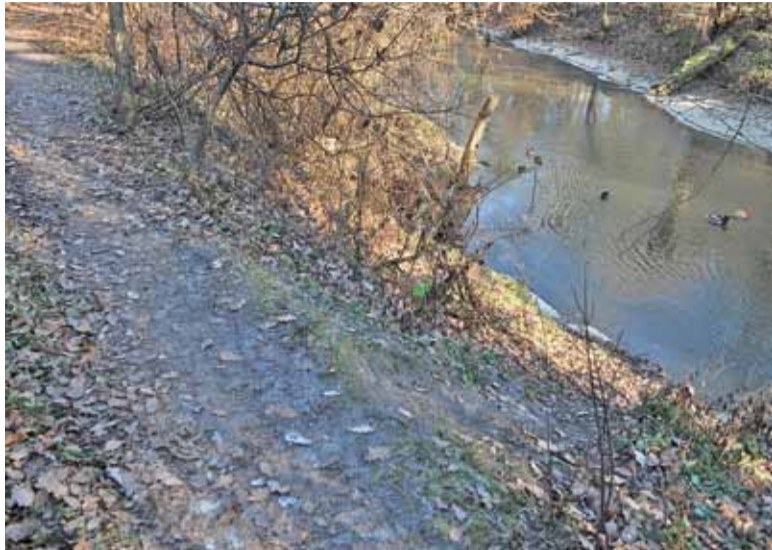
Wąski odcinek ścieżki nad brzegiem rzeki wymaga zachowania szczególnej uwagi