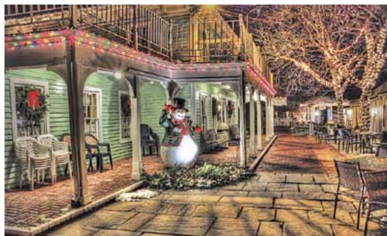
Moda na dekorowanie posesji przyszła do nas z USA i zachodniej Europy