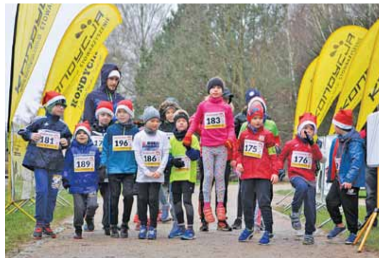
Najmłodszym deszcz zupełnie nie psuł zabawy

Najbarwniejszy z organizowanych przez Stowarzyszenie Kondycja biegów odbył się po raz szósty. Tym razem na starcie stanęli najbardziej „nieprzemakalni” Mikołaje. Trudna, biegnąca przez las po pagórkach, trasa wymagała dodatkowej uwagi ze względu na padający przez cały czas deszcz. Mimo to w każdym z biegów swoich sił spróbowało spore grono zawodników. Oprócz „Małego Mikusia” (500 m) dla najmłodszych rozegrano bieg rodzinny na dystansie 1 kilometra, liczący 3 km, marsz nordic walking oraz bieg główny na 5 km. Ten ostatni tradycyjnie już wy-