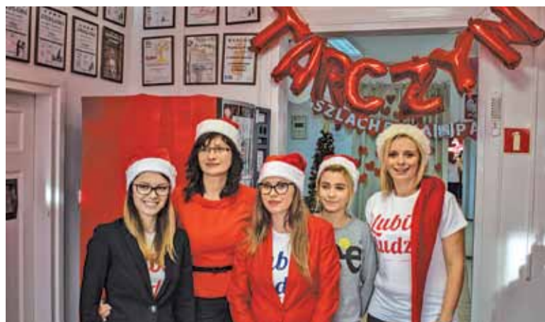
Szlachetna Paczka odbyła się w Tarczynie po raz pierwszy, ale na pewno nie ostatni

im tego, czego najbardziej potrzebują do normalnego funkcjonowania. Tak byłoby najprościej, wybrać inną rodzinę. Ale druga myśl – kto im pomoże? Każdy może zmienić wybór rodziny na łatwiejszy do realizacji, oni swego życia nie zmienią bez pomocy innych. Nie mogłam... nie szukałam innej rodziny