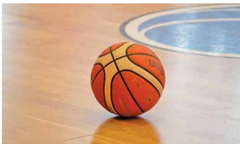
Ekipa z Konstancina dobrze rozpoczęła mecz z Mustangiem, ale ostatecznie przegrała z gospodarzami