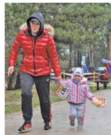
Najmłodsza biegaczka nie ma jeszcze nawet 2 lat

ka, drożdżówka i ognisko, przy którym można było się ogrzać w oczekiwaniu na dekorację.