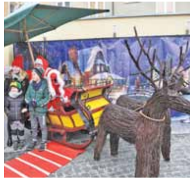
Tym razem sanie św. Mikołaja musiały zostać wyposażone dodatkowo w parasol

Na straganach pojawia się co raz więcej regionalnych produktów – obok wędlin, chleba czy miodów, można było kupić domowe alkohole, przetwory czy chałwę. Oczywiście nie zabrakło rękodzieła, świątecznych stroików i pierników. Te ostatnie dzieci mogły własnoręcznie ozdabiać w Zakątku św. Mikołaja. Na najmłodszych czekały tam liczne atrakcje oraz sam św. Mikołaj w saniach zaprzężonych w wiklinowe renifery. Na scenie po-