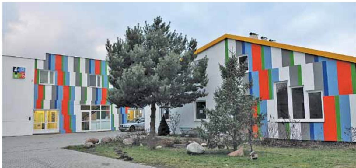
Od poniedziałku w szkole znów są prowadzone zajęcia