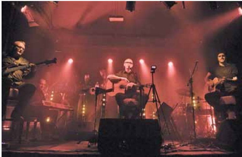
Koncert miał wyjątkową oprawę dzięki specjalnemu oświetleniu sceny