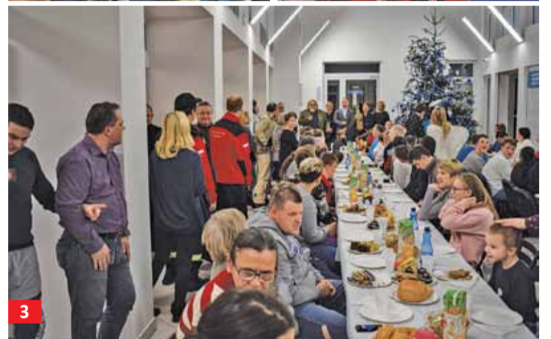
1. Na pierniczkach Piekarnia Krzosek namalowała logo Stowarzyszenia Dobra Wola