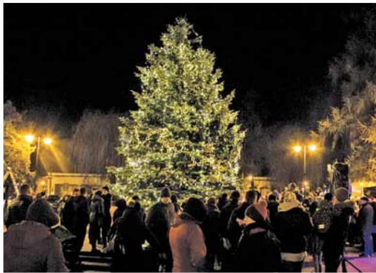
Kalwaryjska choinka to najbardziej uroczne drzewko w powiecie