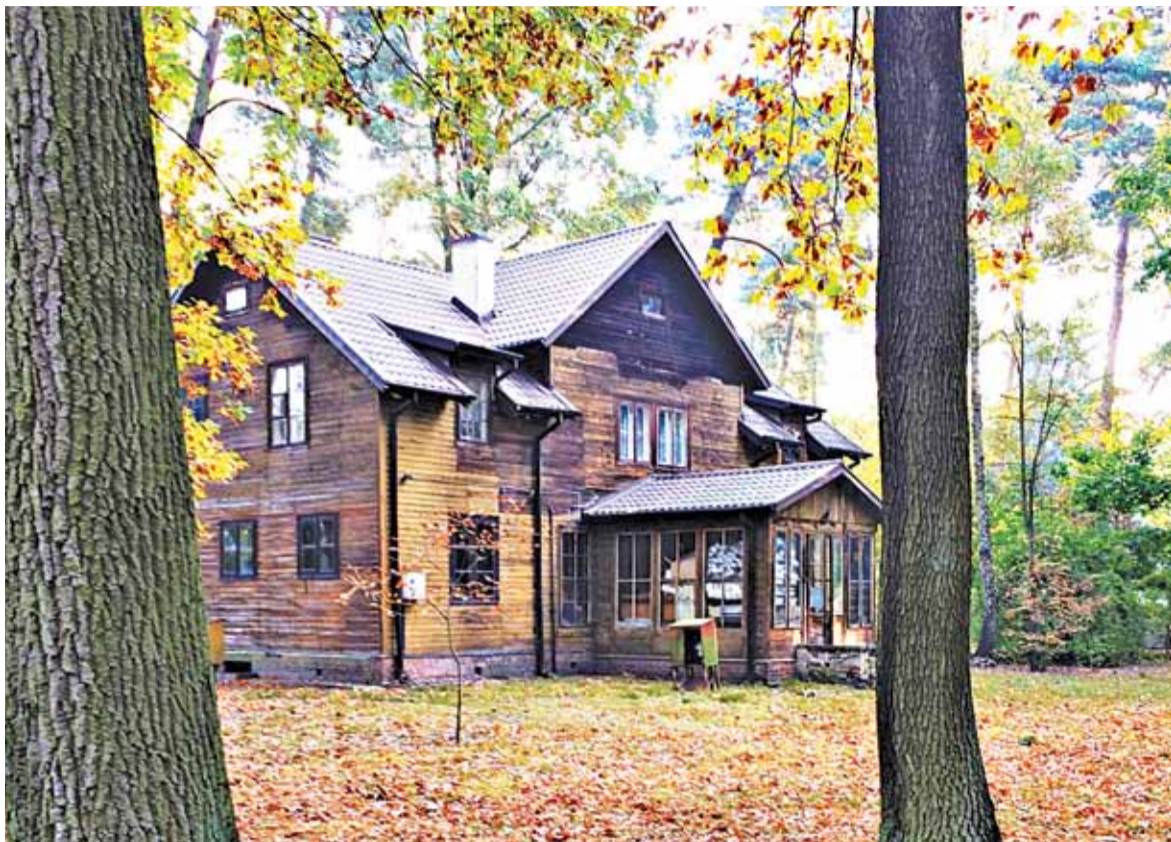
Budynek, w którym w latach 50. i 60. XX w. mieściła się biblioteka z Zalesiu Donym

W historii biblioteki w Zalesiu Dolnym jest wiele ciekawych wątków i intrygujących zwrotów akcji. Władze Piaseczna co jakiś czas postanawiały zlikwidować bibliotekę, spakować księgozbiór i umieścić go w piwnicznych archiwach. Wtedy zaczynała się walka między tymi, którym na sercu leżało istnienie biblioteki a tymi, którym z niezrozumiałych powodów wręcz przeciwnie. Może ci drudzy nie znali prawdy zawartej w powieści Carlosa Marii Domingueza „Dom z papieru”: „Założyć bibliotekę to jak stworzyć życie”.