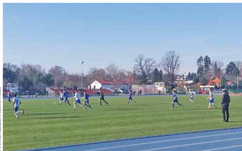
MKS Piaseczno – Sparta Jazgarzew