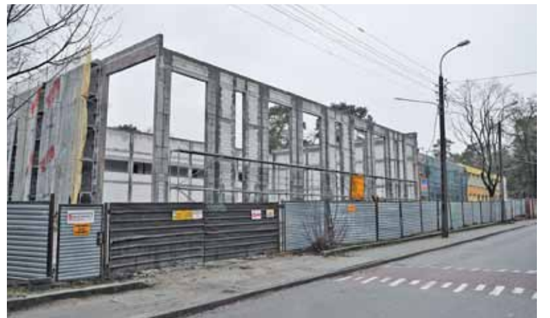
Rozbudowa SP nr 1 to najdroższa przyszłoroczna inwestycja