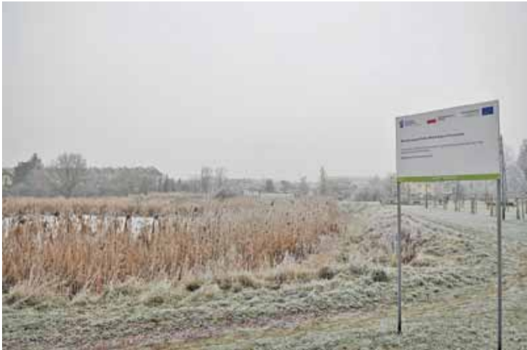
W 2019 roku gmina zamierza m.in. zrewitalizować parkowy staw