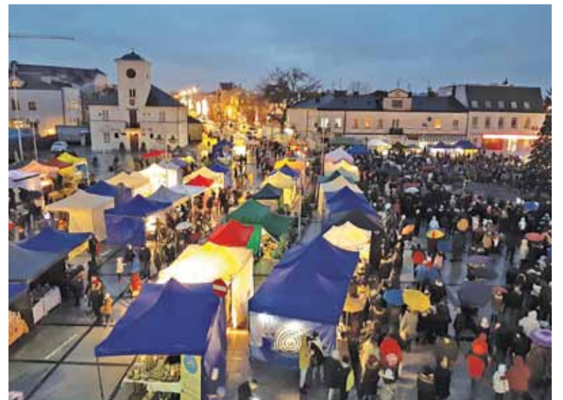
Rozmieszczenie straganów również na zamkniętym odcinku ul. Kościuszki zapewnia więcej przestrzeni, ale też zwiększa bezpieczeństwo