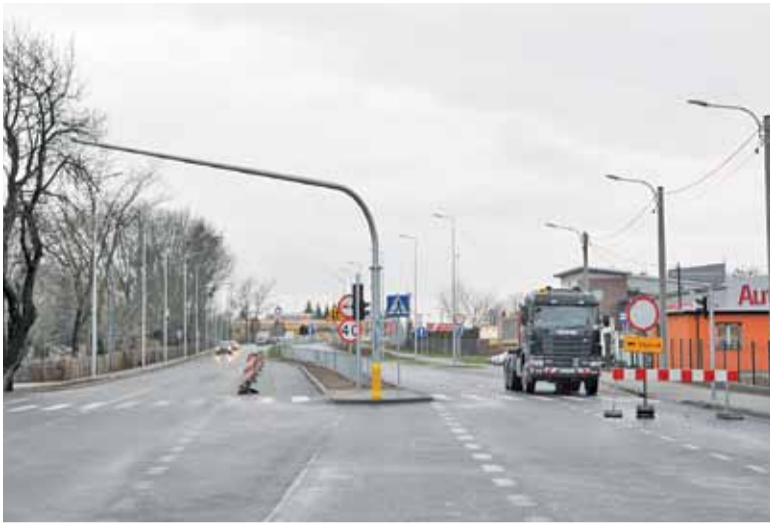
Na ile dwupasmowa droga upłynni ruch, przekonamy się w najbliższych dniach