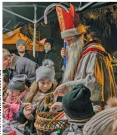
Mimo pogody Kalwaryjski Rynek Bożonarodzeniowy przyciągnął wielu mieszkańców