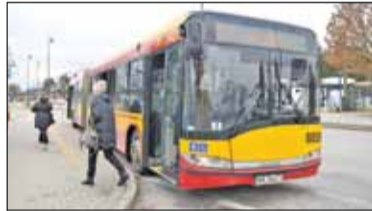
|| Konstancin-Jeziorna - Chcą prawdziwych konsultacji s. 5