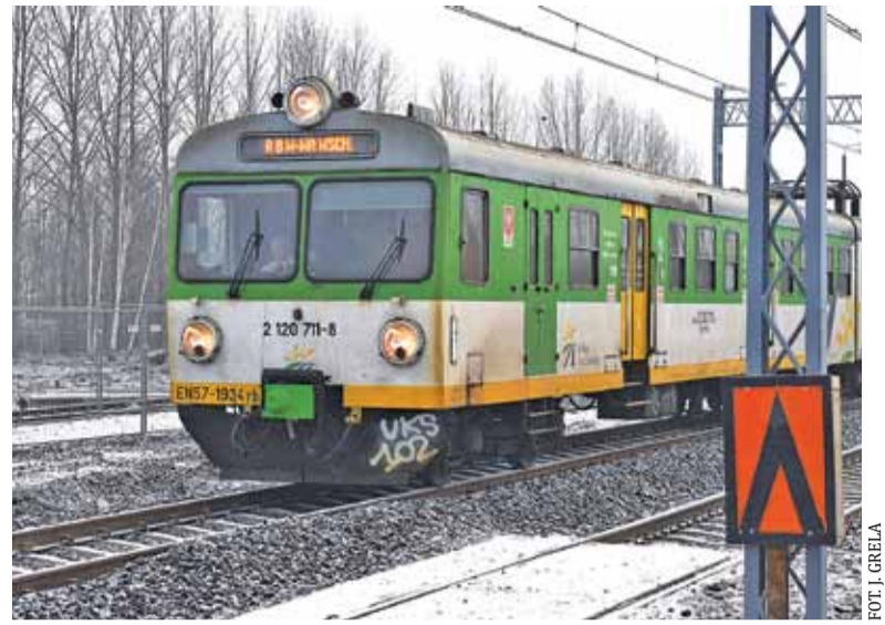
Niezmodernizowane EN57 nie znikną tak prędko z naszych torów