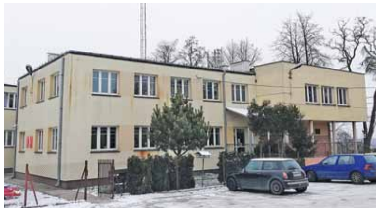
Szkoła w Czersku

Kalwaryjski samorząd uchwalił, że rozbuduje podstawówki w Czersku i Kątach.