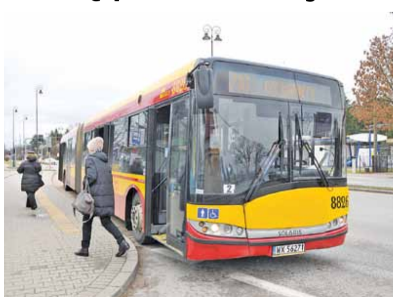
Zwiększenie liczby kursów linii 251 mogłoby się zdaniem władz gminy odbyć dzięki „cięciom” w rozkładzie jazdy linii 710