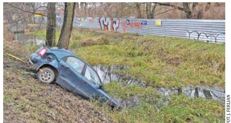
Strażacy zabezpieczyli samochód, by nie wpadł całkiem do rowu

Jak informowaliśmy rok temu, Stadler Polska dostarczy Kolejom Mazowieckim 71 elektrycznych zespołów trakcyjnych, z czego 15 po 2020 roku trafi na linię nr 8. Joanna Grela