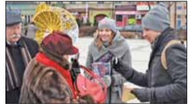
|| Powiat - 27. Finał WOŚP s. 8