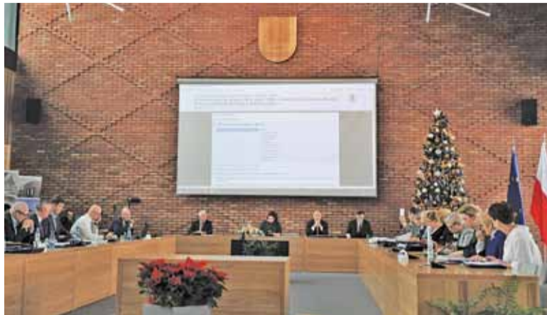
Pierwotny skład prezydium Rady Gminy pracował tylko przez dwie sesje