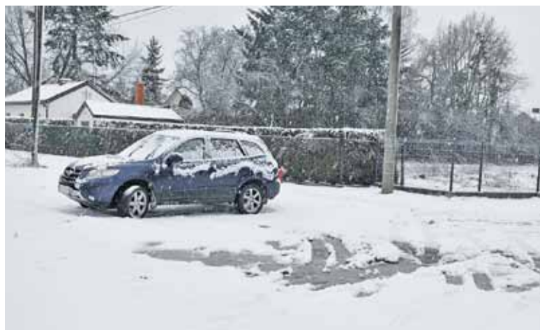
Parking przy ul. Reymonta miał być gotowy do połowy grudnia