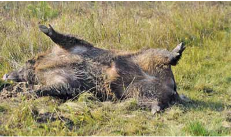
Informacje o terminach polowań grzęzną w naszych gminach