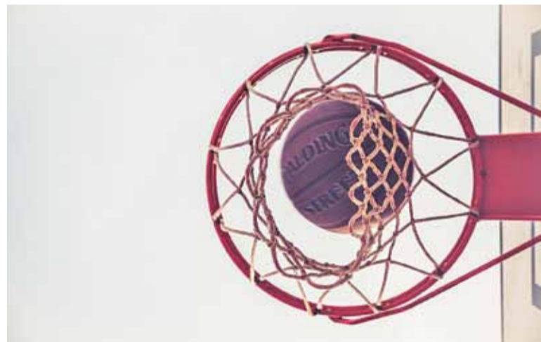
MUKS zanotował siódmą wygraną

zbudowali bezpieczną przewagę 29:20. W kolejnych odsonach MUKS nie miał litości dla rywala. Przyjezdni nie zbliżyli się nawet do granicy 20 punktów w po-