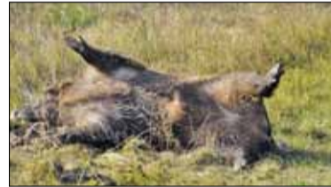
|| Powiat - Polowanie na dziki s. 7