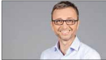
|| Piaseczno - Komunikacja jest niezwykle istotna s. 6