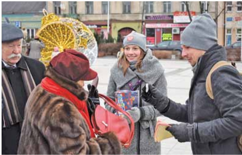
Wolontariusze WOŚP to siła Finałów