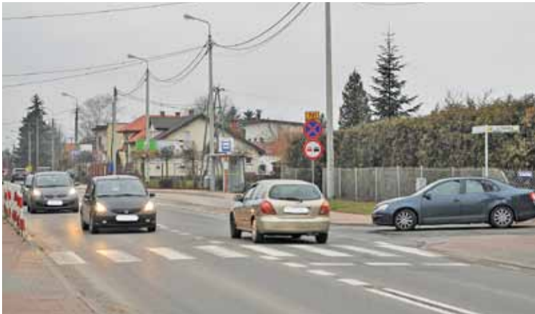
W kwietniu ubiegłego roku na tym przejściu dla pieszych zginęła kobieta