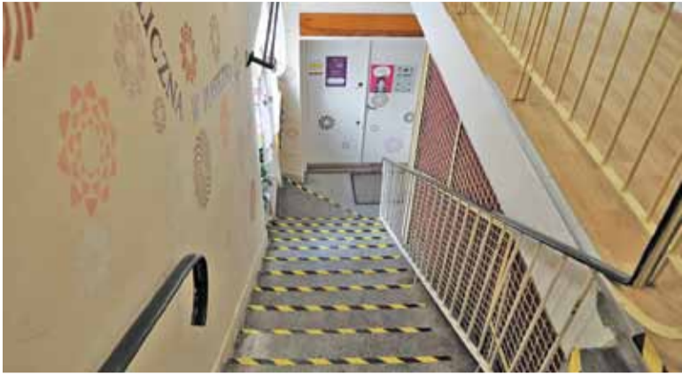
Dotarcie do biblioteki wymaga pokonania stromych i zakręcających schodów