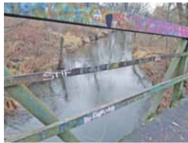
Ciało znaleziono w okolicach mostu między Piasecznem a Żabieńcem

Na zwłoki mężczyzny w Jeziorce kajakarz natknął się w drugi dzień Świąt Bożego Narodzenia. Dość szybko udało się ustalić tożsamość ofiary. To poszukiwany od końca listopada 59-letni mieszkaniec Żabieńca. Ciało znaleziono w okolicach mostu łączącego Piaseczno z Żabieńcem, jego stan wskazywał na to,