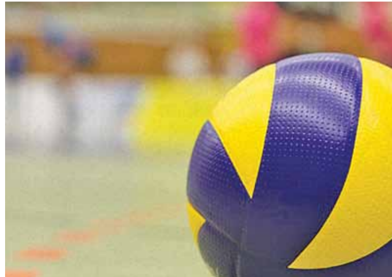
Krótka zajmuje 5. miejsce w tabeli

W 13. kolejce zespół z Mysiadła pauzował, ale w następnej serii gier łatwo uległ Nike Węgrów - 0:3. Gorsze dni osłodziło zwycięstwo ze Spartą Warszawa