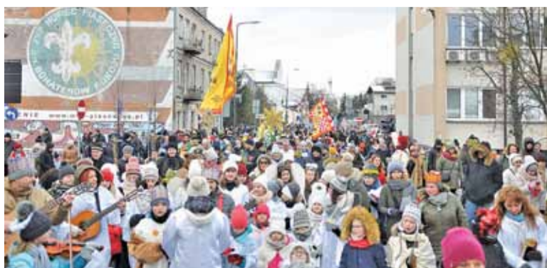
Liczba uczestników piaseczyńskiego orszaku rośnie z każdym rokiem