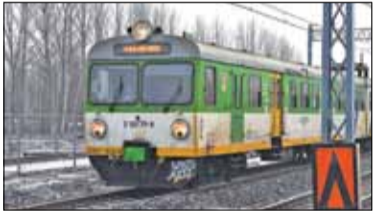
|| Powiat - Stare składy jeszcze pojeżdżą s. 2

STYCZNIOWA PROMOCJA REKLAMY DO -50% ZADZWOŃ I SIĘ PRZEKONAJ! 799 366 447