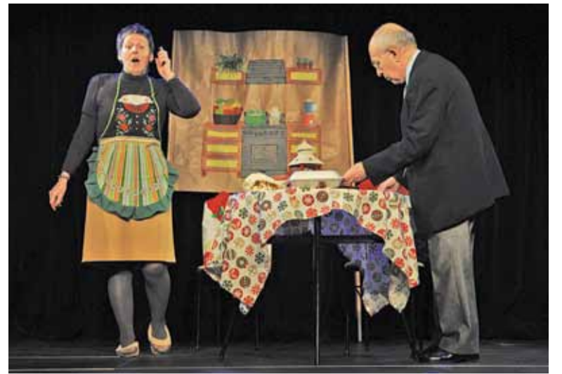
Aktorki świetnie zagrały perypetie gospodyni organizującej wigilię dla kilkunastu osób