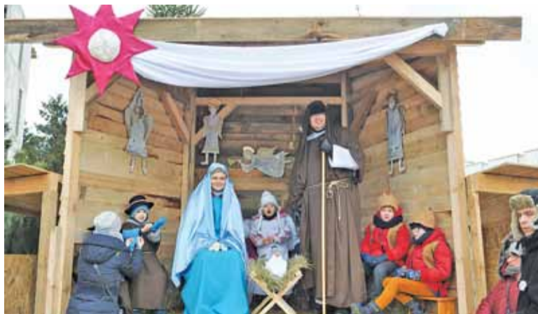
W żłóbku czekała Święta Rodzina i Pastuszkowie