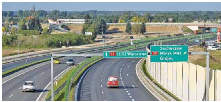
Częściowo S7 będzie biegła istniejącym śladem drogi ekspresowej