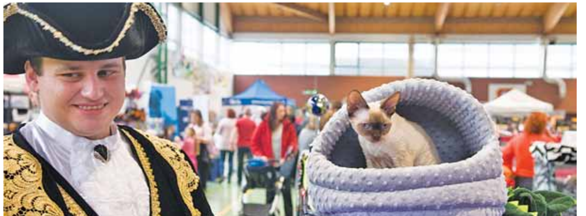
Część wystawców zazwyczaj jest przebrana w stroje charakterystyczne dla epoki, narodowości czy zawodu

Od kilku lat w Piasecznie na początku stycznia odbywa się Międzynarodowa Wystawa Kotów. W tym roku Piaseczno zostało wyróżnione Światową Wystawą Kotów Rasowych, jedyną tej rangi imprezą organizowaną w 2019 r. w Polsce. Podczas dwudniowej imprezy halę GOSiR przy ul. Sikorskiego odwiedziło nie tylko 150 wystawców z różnych krajów, ale również rzesze widzów zainteresowanych hodowlą, zakupem rodowodowego kota czy po prostu obejrzeniem wielu kocich ras na żywo.