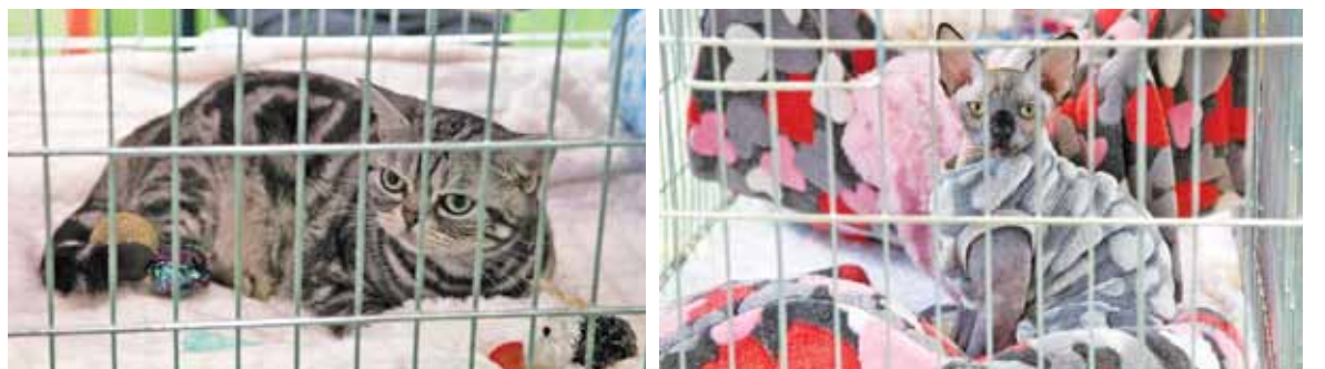
Miny niektórych kotów mogą sugerować brak entuzjazmu dla spotkania z człowiekiem