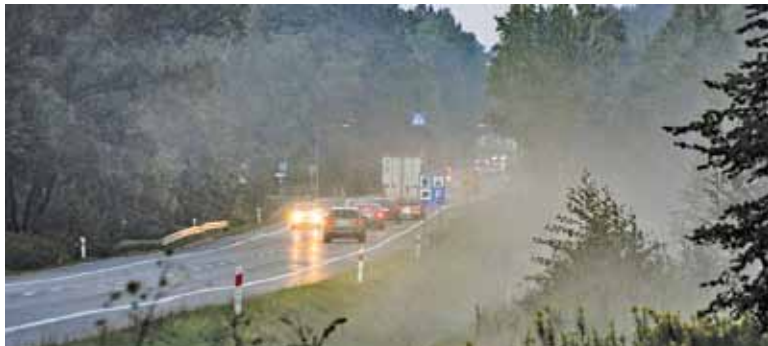
DK 50 na odcinku między Górą Kalwarią a Chynowem. Czy za 8 lat będzie tu autostrada?

jej budowy od południa wykorzystana zostanie droga krajowa nr 50, a od północy planowany dopiero odcinek drogi ekspresowej S10. Obwodnica biegnąca przez Kołbiel, Górę Kalwarię, przechodząca koło Grójca, Mszczonowa, Żyrardowa, przez Sochaczew, Wyszogród, w pobliżu lotniska Warszawa – Modlin, przez Serock i Wyszaków.