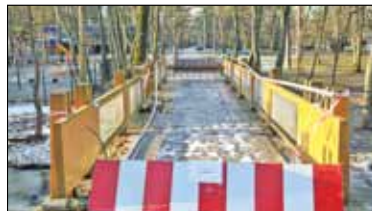
|| Konstancin-Jeziorna - Mostek pokonany przez naturę s. 6