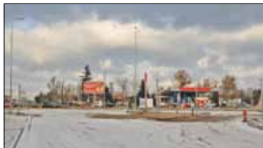
|| Piaseczno - Wszystko zależy od pogody s. 2