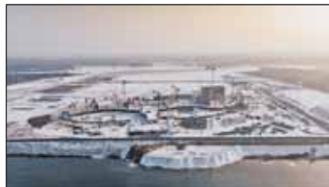
|| Kraj - Aquapark we wrześniu s. 4