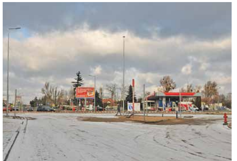
Wykończeniowe prace przy jezdni wymagają lepszej aury