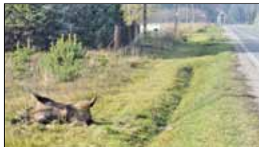
|| Powiat - Walka z ASF s. 5