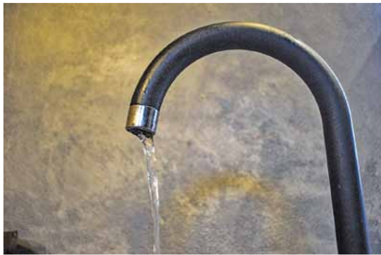
Dzisiejsza kranówka jest zdrowsza i pewniejsza od wody z plastikowych butelek