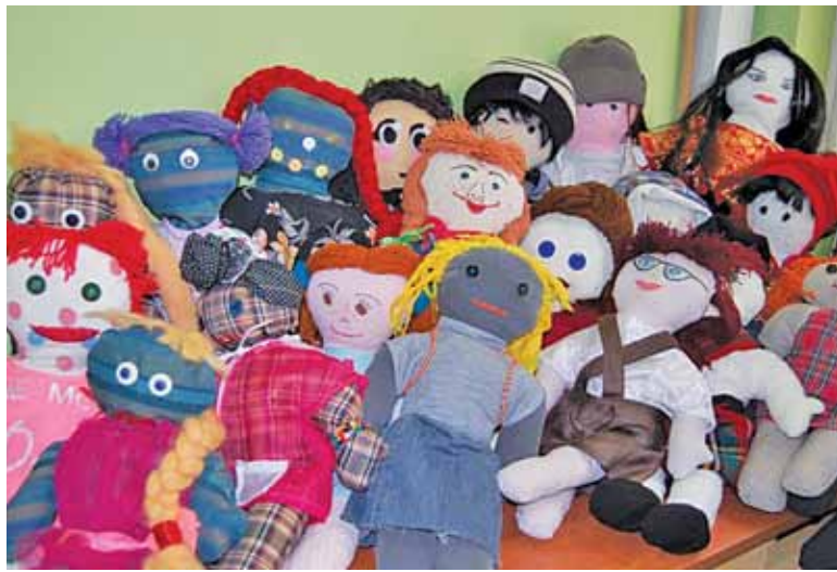
Te pozornie zwykłe szmaciane lalki niosą ważne przesłanie