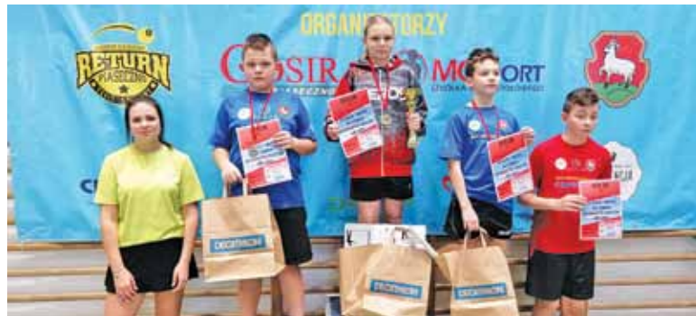
Najlepsi w kategorii dzieci