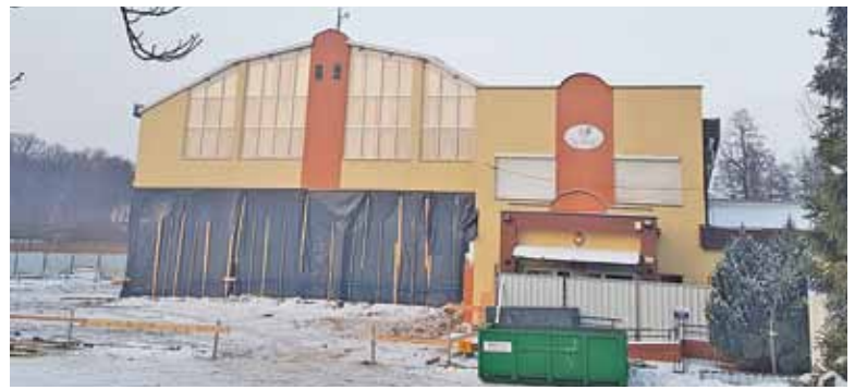
Jedną z najdroższych inwestycji gminy to rozbudowa szkoły w Głoskowie