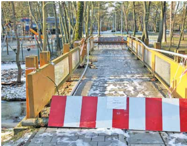
Uszkodzeniu uległy elementy drewniane i metalowe