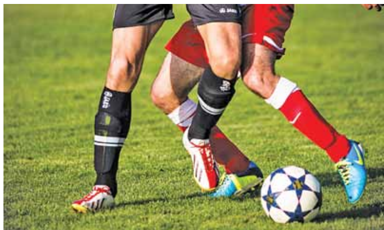
Piłkarze będą budować formę na drugą część sezonu