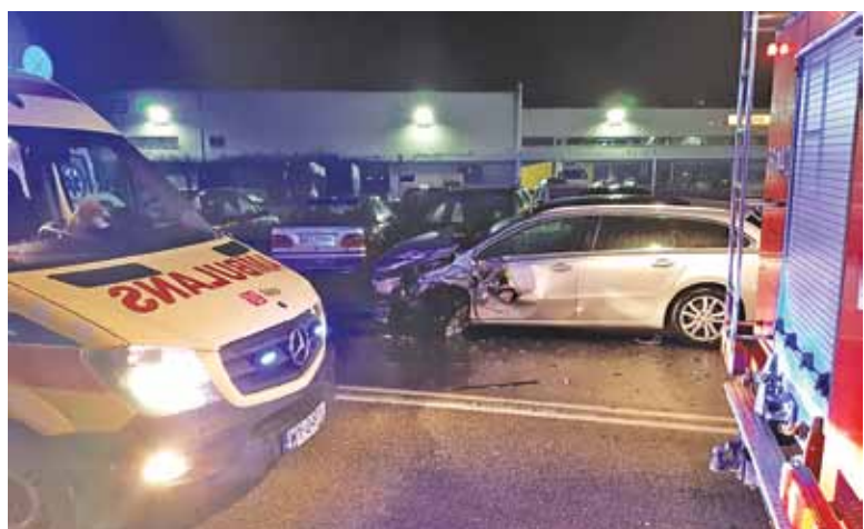
Kierowca samochodu, w który uderzył pirat drogowy, trafił do szpitala