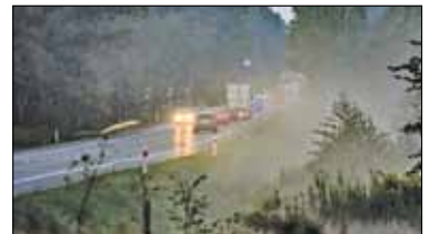
|| Góra Kalwaria - Obwodnica za 15 miliardów s. 7