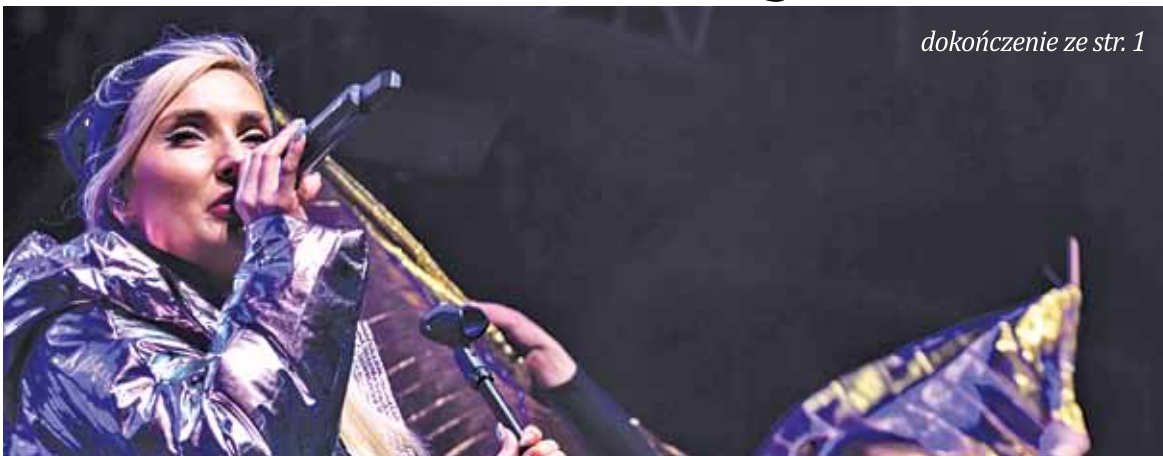
Gwiazdą tegorocznego WOŚPowego koncertu była Cleo