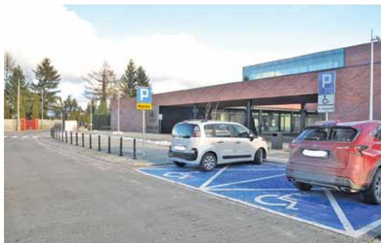
Z miejsc dla niepełnosprawnych nie da się wjechać od razu na chodnik

P rzez ponad pół roku od otwarcia nowego konstancińskiego Ratusza wszyscy odwiedzający go goście i pracownicy musieli siłować się z drzwiami. Ich waga sprawiała, że otwarcie okazało się trudne dla nieco słabszych fizycznie osób, a niemożliwe dla nie-