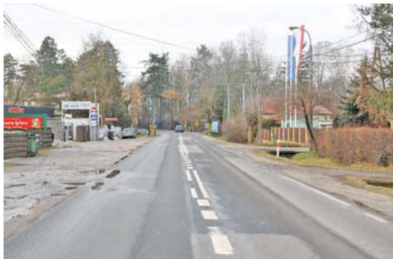
Droga wojewódzka zyska wreszcie chodnik i drogę rowerową