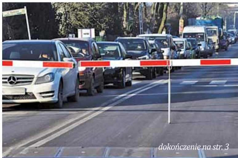
dokończenie na str. 3