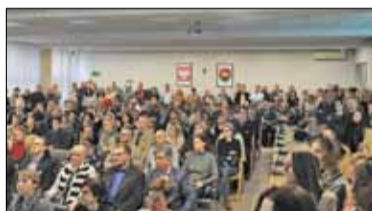
|| Powiat - Oswajanie rekrutacji s. 5