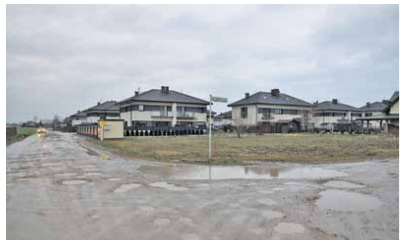
Stan ul. Fabrycznej kiedyś ulegnie trwałej poprawie. Ul. Złotych Łanów pozostanie w obecnym standardzie