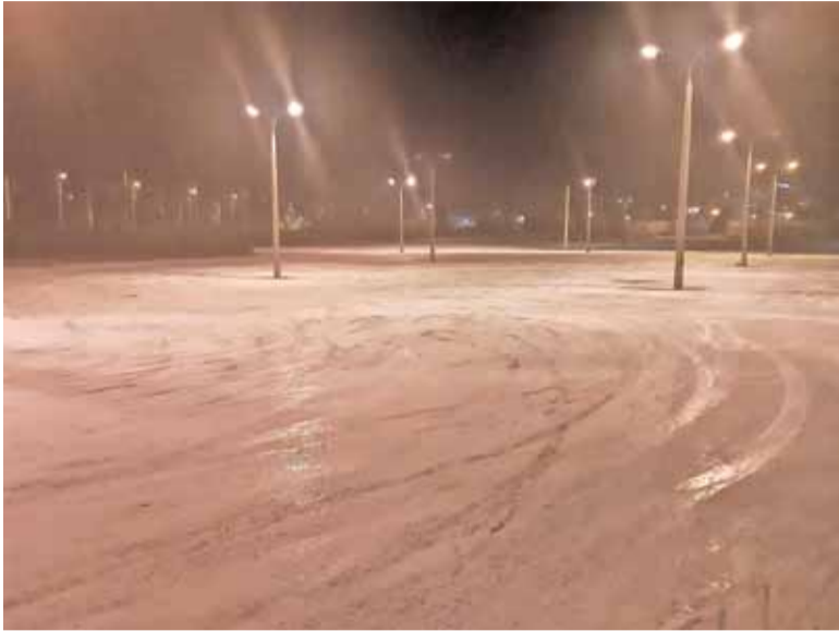
Śliska nawierzchnia parkingu przy ul. Żytniej błyskawicznie stała się areną do popisów