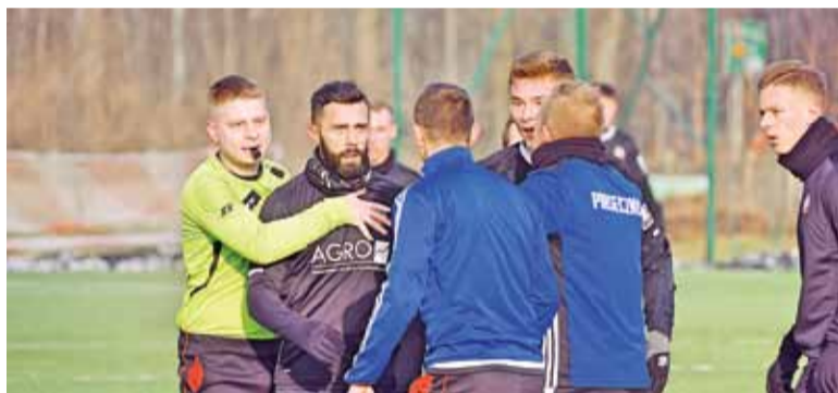
Przepychanka na boisku

sprzeciw. To nie ekstraklasa, dotychczasowe zarobki nie pozwoliły im porobić takich oszczędności, by móc spokojnie przeczekać. Większość ma kontrakty na ok. 3 tys. zł miesięcznie. Część z nich jest zatrudniona »na firmę«, musi więc odprowadzać od tego podatek i samemu opłacać ZUS. Nie mają za co żyć”.