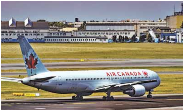
Na głównym lotnisku w Polsce powoli zaczyna brakować miejsca