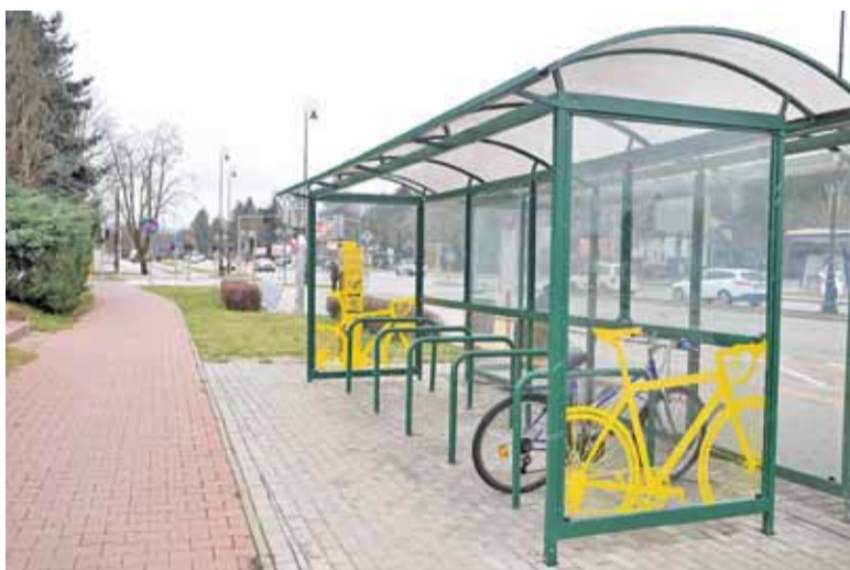
Wiaty rowerowe przy przystankach zachęcają do przesiadania się w autobusy w drodze do Warszawy