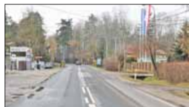
|| Piaseczno, Konstancin-Jeziorna - Dłuższa droga s. 7