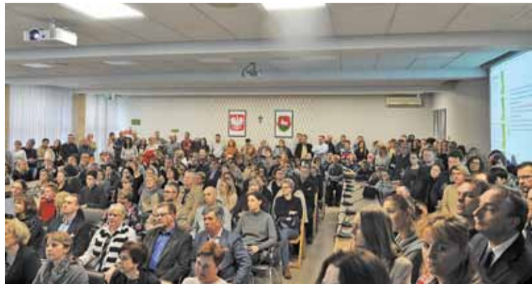
Na spotkanie przyszło około 200 osób, w znakomitej większości byli to rodzice