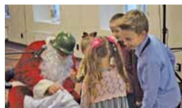
Święty Mikołaj, jak przystało na koszarowce, na głowie miał wojskowy hełm

W piątek 18 stycznia wspólny obiad w restauracji hotelu Koszary zjedli repatrianci, sprowadzeni do kraju przez Fundację im. Leny Grochowskiej, oraz uchodźcy z objętej wojną części Ukrainy.