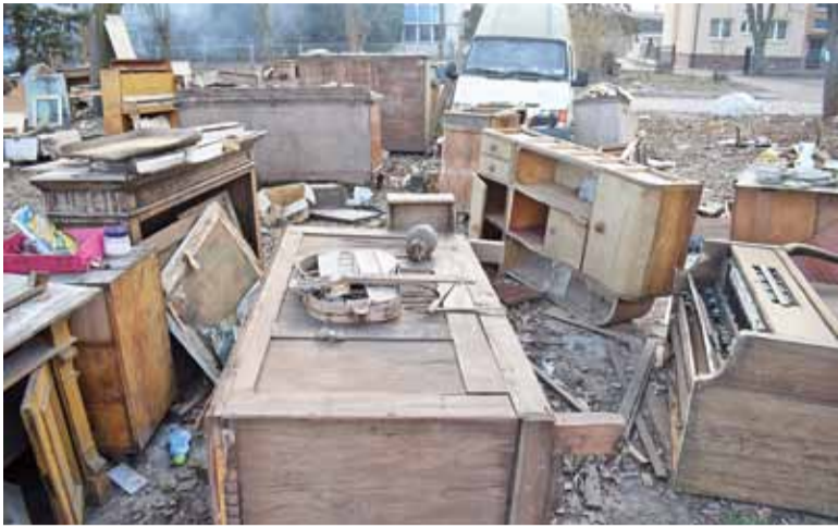
Pan Ryszard trafił do szpitala po tym, jak oparzył sobie nogę