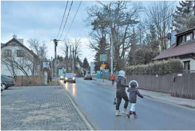
Brak bezpiecznego przejścia zmusza do zwiększonej ostrożności przy przechodzeniu przez jezdnię