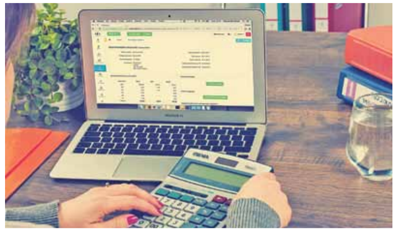
Od tego roku to skarbowka będzie nas rozliczać