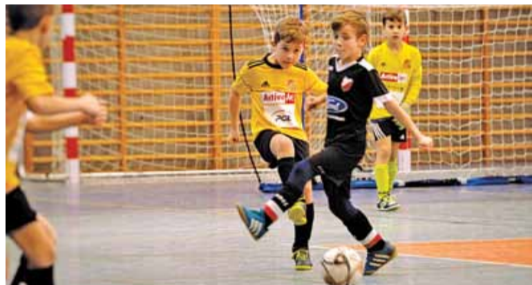
W zawodach wystąpiło 9 zespołów