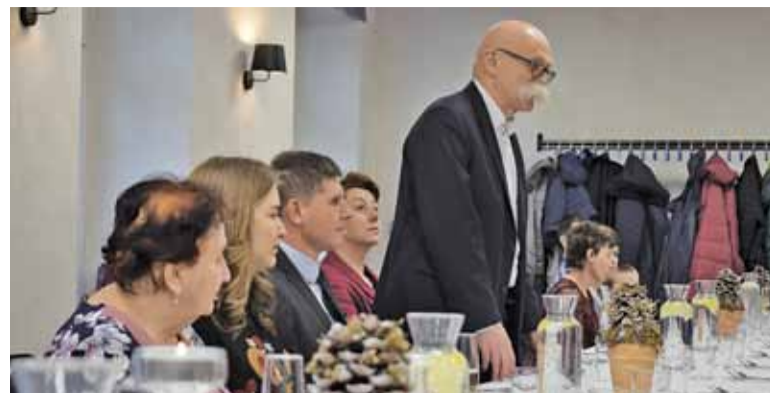
Noworoczny obiad Fundacji im. Leny Grochowskiej po raz pierwszy odbył się w Górze Kalwarii