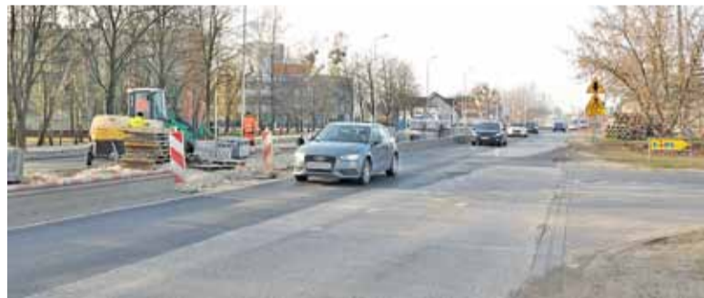
Wykonawca zapewnia, że dojazd do sklepów będzie zapewniony

Wykonawca przebudowy drogi wojewódzkiej 721 zapowiedział wprowadzenie nowej organizacji ruchu na godzinę 10.00 w środę 23 stycznia. W najbliższych miesiącach przebudowana będzie południowa nitka ul.