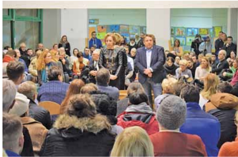
Frekwencja na spotkaniu była ogromna