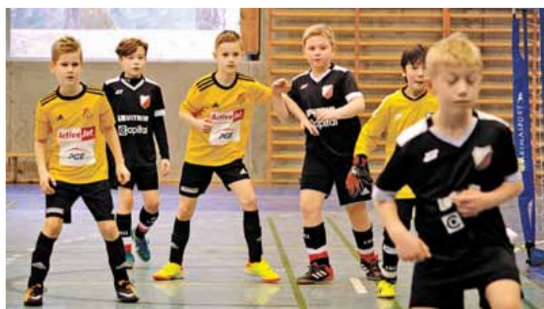
Starcie drużyny FC Lesznowola z Polonią Warszawa