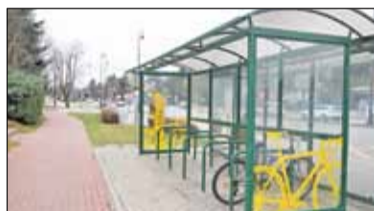
|| Konstancin-Jeziorna - Rowerem do szkoły s. 4