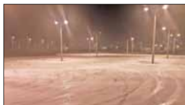
|| Powiat - Ścigaja, ale wybiórczo s. 6