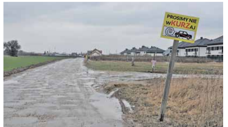
Jak widać po tablicach dziury i kałuże to nie jedyny problem mieszkańców.

Dramatycznie dziurawa droga nie pozwala się za bardzo rozpędzić, a mimo to podczas „suchych” miesięcy mieszkańcom dokuczają unoszący się z drogi kurz. Ustawili nawet we własnym zakresie tablice zachęcające kierowców do zmniejszenia prędkości, a tym samym intensywności unoszenia się kurzu z nawierzchni drogi. W sezonie jesienno-zimowym z koleji w dziurach stoi woda.