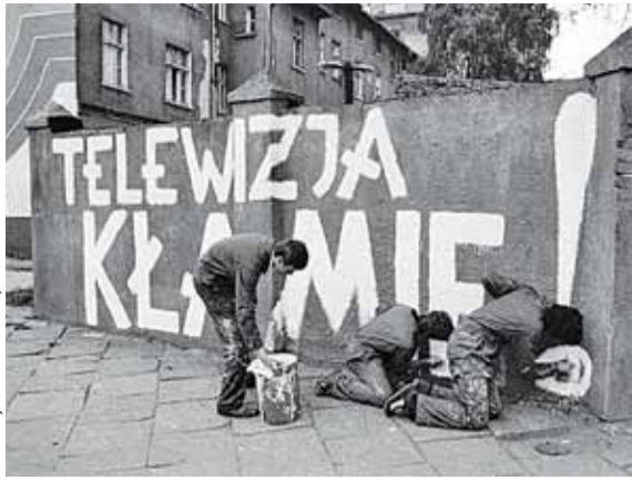
FOT. WOJCIECH KRZYŃSKI, GDANSK 1981 R.