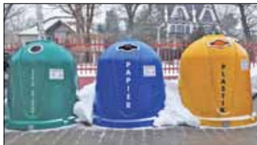
|| Lesznowola - Podwyżka od kwietnia s. 2

PIASECZNO || GÓRA KALWARIA || KONSTANCIN-JEZIORNA || LESZNOWOLA || PRAŻMÓW || TARCZYN