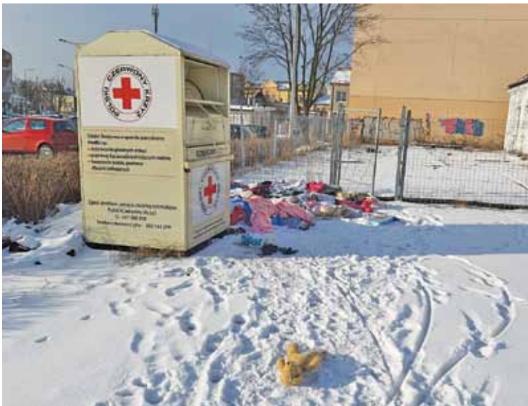
Śnieg i deszcz skutecznie niszczą rzeczy, z których mogłaby skorzystać jakaś rodzina