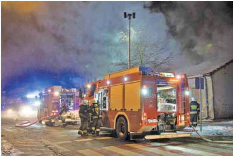
Z pożarem walczyło kilkunastu strażaków