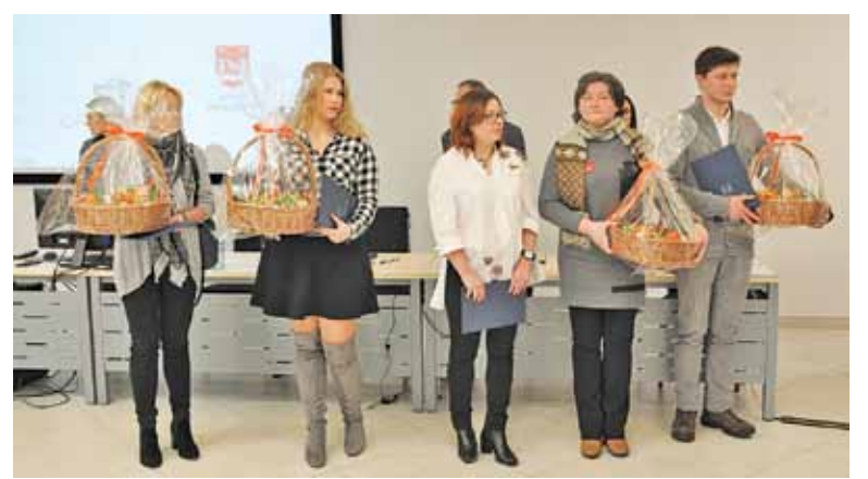
„Sztabowcy” WOŚP zostali docenieni przez powiat po raz pierwszy