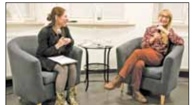
|| Piaseczno - Uwiedziona przez Albanie s. 8