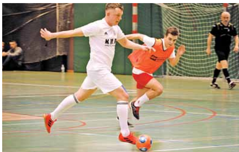
Turniej co roku przyciąga najlepsze ekipy powiatu piaseczyńskiego

W minioną niedzielę 27 stycznia w hali Gminnego Ośrodka Sportu i Rekreacji w Piasecznie odbył się Memoriał im. Walentego Kazubka. Halowy turniej piłki nożnej, mający na celu upamiętnienie honorowego obywatela Piaseczna i założyciela Ludowego Klubu Sportowego „Jedność” w Żabieńcu, co roku przyciąga najlepsze