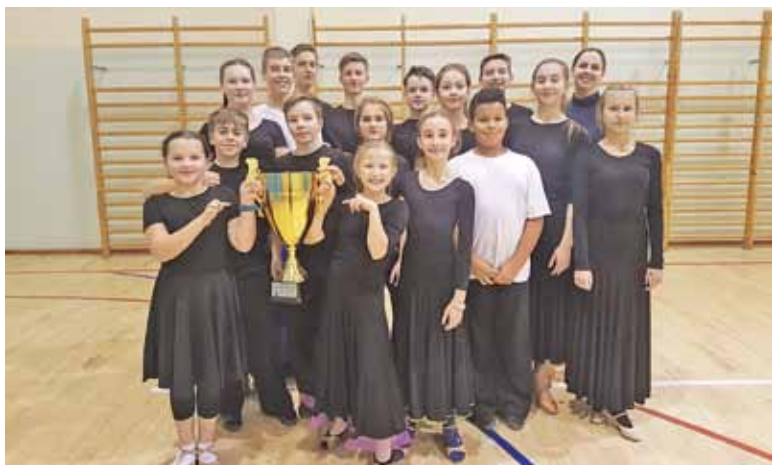
Tancerze Emotion z pucharem