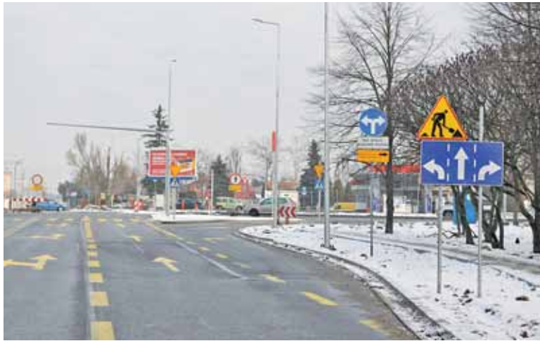
Znaki drogowe wzajemnie się wykluczają

Jeśli dotychczas przejechanie przez skrzyżowanie ulicy Okulickiego z ul. Wojska Polskiego wydawało się trudne, zwłaszcza dla kierowców skręcających w lewo, to teraz można dojść do wniosku, że... zawsze może być gorzej. Na skrzyżowanie z ul. Wojska Polskiego w ul. Okulickiego decydują się tylko prawdziwi desperaci. Kiedy ruch w DW721 odbywał się północną nitką, samochody nadjeżdżające od strony Leszno-