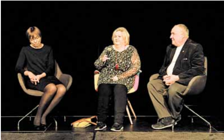
Autorzy publikacji mówili między innymi o tym jak przebiegał proces twórczy