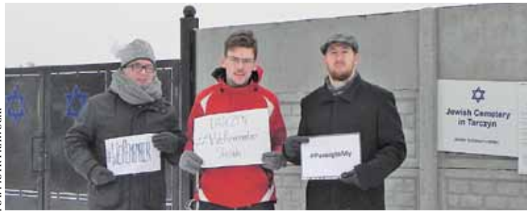
Inicjatorzy sprzątania kirkutu upamiętnili ofiary Holocaustu

27 stycznia przypadła 74. rocznica wyzwolenia obozu Auschwitz Birkenau. W 2005 roku ONZ ustanowiło dzień 27 stycznia Międzynarodowym Dniem Pamięci o Ofiarach Holocaustu.