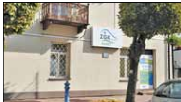
|| Góra Kalwaria - Nowy prezes ZGK s. 4