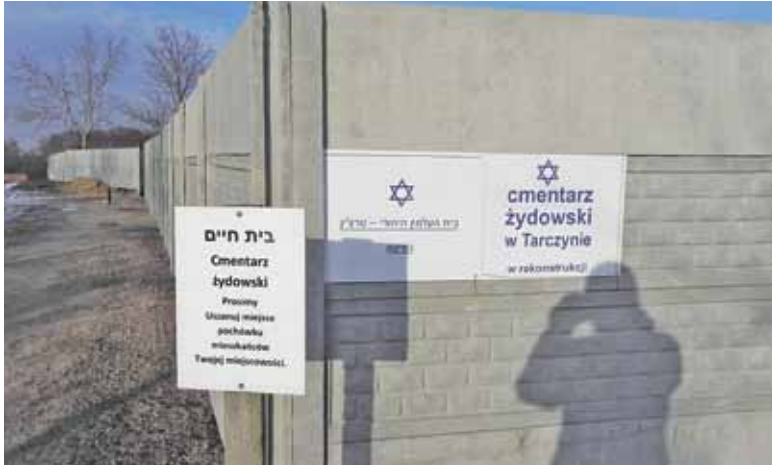
Nie dość, że cmentarz został wysprzątany to doczekał się ogrodzenia