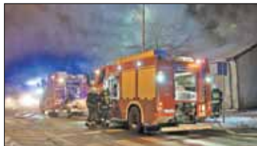
|| Piaseczno - Kolejny pożar obok poczty s. 5