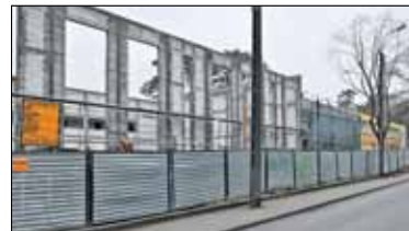
|| Konstancin-Jeziorna - Mało dochodów, to mało inwestycji s. 6