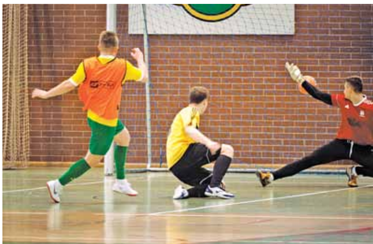
Bramka dla Perły Złotokłós