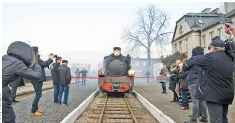
Wjazd parowozu podczas oficjalnego przywitania to było prawdziwe show