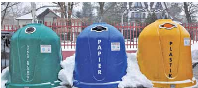
Mieszkańcy Lesznowoli płacą również za specjalne worki na śmieci, chyba że korzystają z odpowiednich kontenerów