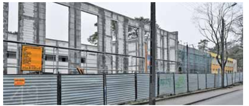
Na kontynuację rozbudowy SP nr 1 gmina wyda 6,7 mln zł