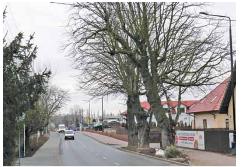
Grupa kasztanowców w Józefosławiu od 13 lutego jest pomnikiem przyrody