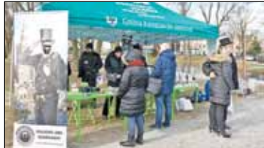
|| Konstancin-Jeziorna – Pokazy nie wystarczą s. 5