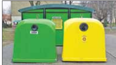
|| Powiat – Nasze drogie śmieci s. 3