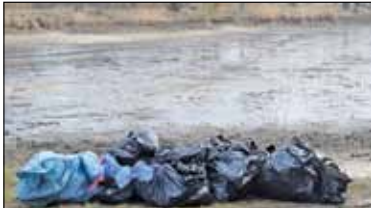
|| Zalesie Dolne – Posprzątał AMO s. 2