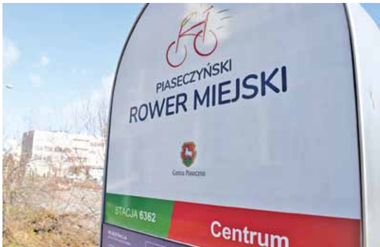
Konstancińskie i piaseczyńskie rowery będą kompatybilne z warszawskim systemem