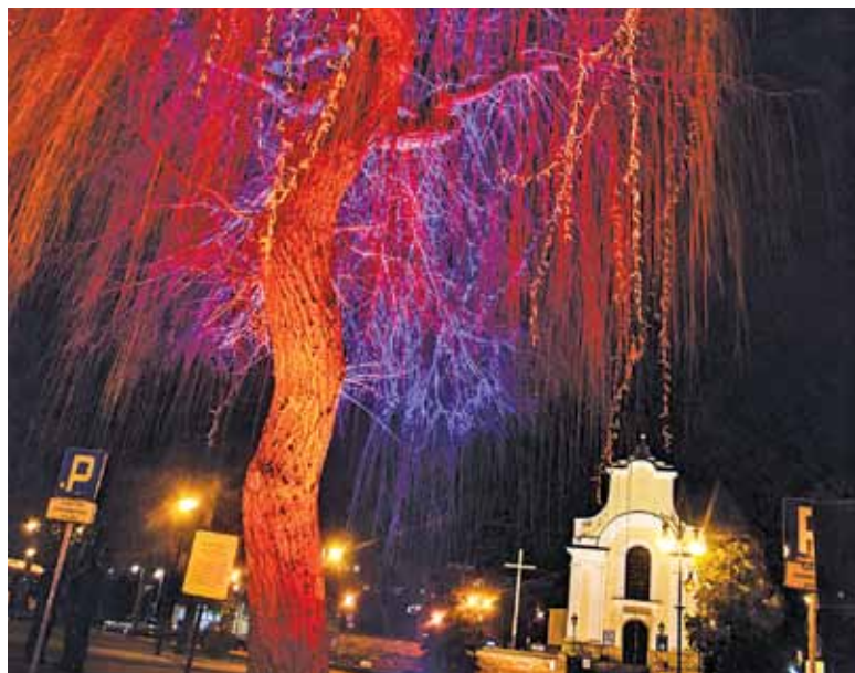
Kulminacyjnym momentem obchodów była iluminacja Drzewa Pamięci

25 i 26 lutego 1941 roku, podczas likwidacji getta, zebrano na rynku 3400