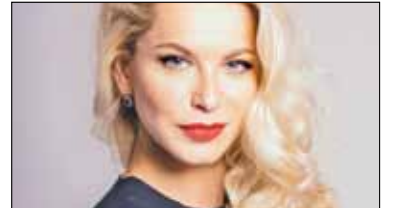
|| Konkurs! Graj i wygrywaj s. 9