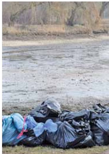
Podczas akcji sprzątnięcia zalewu na Górkach Szymona zebrano 150 worków śmieci

Wędkarze zebrali 150 worków śmieci, znaleźli m.in. opony, a nawet znak drogowy. Ponieważ akcja sprzątnię-