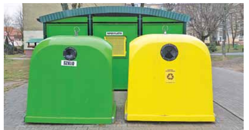
Śmieci są coraz droższe, a ich odbiór i segregacja nastęrcza problemów

– W przyszłości chcielibyśmy oddzielić odbiór odpadów od ich zagospodarowania i to pierwsze zadanie powierzyć spółce komunalnej w celu jak największego ograniczenia kosztów gospodarki odpadami – mówi Chmielewski.