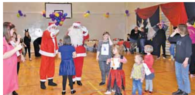
Wyjątkowi goście dla wyjątkowych dzieci