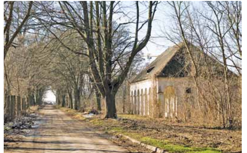
Mieszkańcy zwracają uwagę, że spora część niskiej roślinności i kilka drzew zostało już wyciętych

W tej sytuacji mieszkańcy założyli Stowarzyszenie i wystąpili do Mazowieckiego Wojewódzkiego Konserwatora Zabytków z prośbą o otoczenie ochroną zabytkowego obszaru w Zamieniu. Po zapoznaniu się z wnioskiem, sytuacją prawną nieruchomości, zapisami prawa miejscowego oraz stanem faktycznym, 2 listopada MWKZ wydał decyzję o wpisaniu całego zespołu dworsko-parkowego w Zamieniu do Wojewódzkiej Ewidencji Zabytków. To powinno skutkować automatycznym wpisaniem do Gminnej Ewidencji Zabytków (GEZ). Tak się jednak nie stało. A tymczasem do starostwa wpłynął wniosek o pozwolenie na budowę na terenie parkowych działek należących do dewelopera, który postawił już bloki w bezpośrednim sąsiedztwie parku.