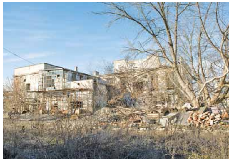
Nowoczesny budynek CEM kontrastuje z ruiną i bałaganem wokół niej