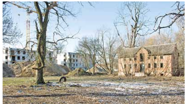
Developer buduje osiedle w bezpośrednim sąsiedztwie zabytkowych zabudowań

P ark w Zamieniu to jedyny teren zielony w północnej części gminy Lesznowola. Ceniony przez okolicznych mieszkańców jako miejsce spacerów, ale również historyczna pamiątka. To pozostałości pochodzącego z XIX wieku folwarku Zamienie. Zespół dworsko-parkowy został wymieniony w „Studium uwarunkowań i kierunków zagospodarowania przestrzennego gminy Lesznowola” z 2011 r. Nie pojawił się jednak jako teren wymagający ochrony w uchwalonym na początku 2012 roku miejscowym planie zagospodarowania przestrzennego.