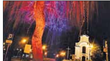
|| Góra Kalwaria – To wyjątkowe miasto s. 9