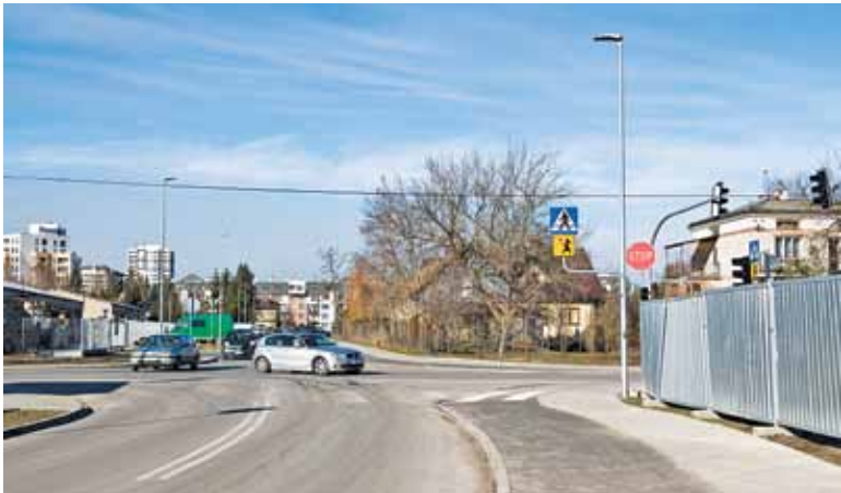
Sygnalizacja dla ul. Żytniej nie została wykonana