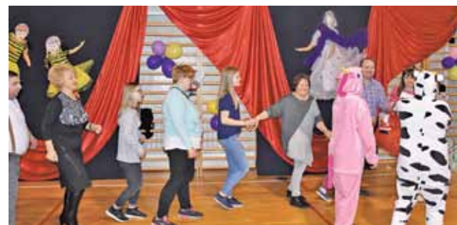
Wspólna zabawa sprzyjała integracji

Zabawa dostarczyła wszystkim uczestnikom wielu wzruszeń i radości. Tym bardziej, że organizatorzy zadbali o konkursy i atrakcyjne niespodzianki. Na specjalne życzenie dzieci na bal zaproszono Świętego Mikołaja (a nawet dwóch), który rozdał uczestnikom karnawałowe paczki. Upominki ufundowane przez Gminę dzieci otrzymały także na zakończenie zabawy.