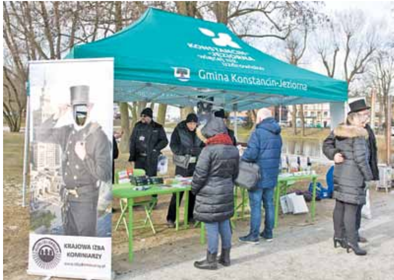
Według mieszkańców takie pokazy to stanowczo za mało