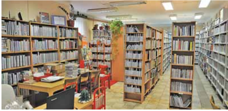
Odległość między regałami nie spełnia norm. A w celu zorganizowania zajęć trzeba je przesunąć