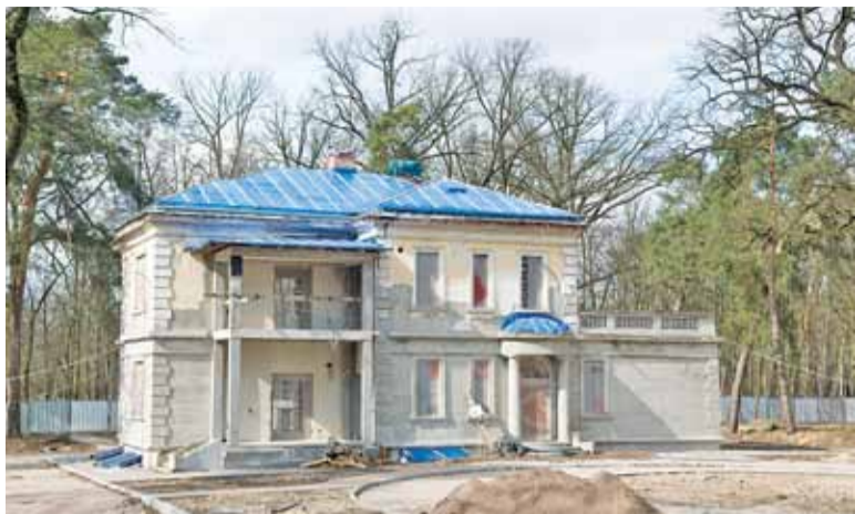
Zabytkowy budynek czeka na nowego wykonawcę