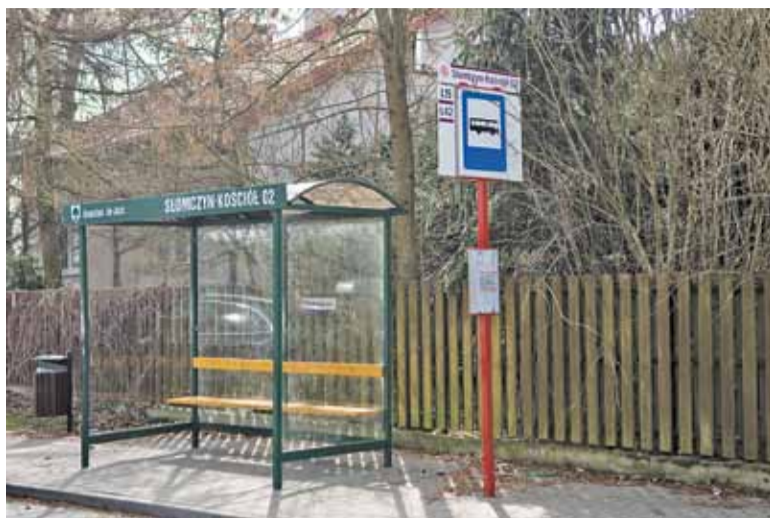
Przystanek w sąsiedztwie kościoła w Słomczynie niebawem zniknie

Do spotkania doszło w ubiegłą środę, 13 marca. Mieszkańcom przedstawiono trzy możliwe warianty rozwiązania problemu zlokalizowania przystanku blisko potrójnego skrzyżowania, gdzie autobus podczas postoju ogranicza widoczność kierowcom, którzy chcieliby go ominąć. Jedną z opcji mówiła więc o tym, by autobusy