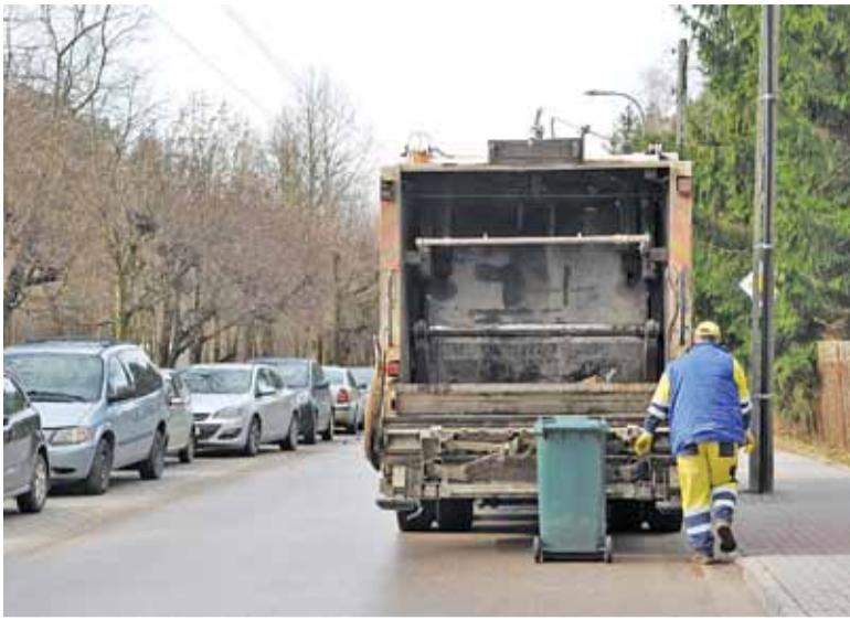
Jak widać kontrakty ze śmieciarskimi spółkami nie dają żadnej gwarancji ceny i spokoju