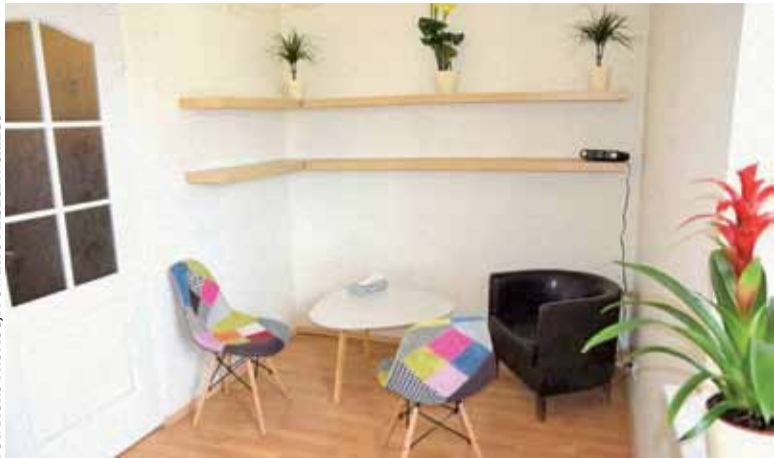
W takim pokoju będzie można porozmawiać z psychologiem