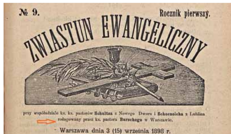
Strona tytułowa „Zwiastuna Ewangelicznego”

zbyt szczupłym i od dawna już nie odpowiadał potrzebom coraz liczniejszej parafii. Od dawna też życzeniem ewangelików w Starej Iwicznej i okolicach było zamienić dom modlitwy na kościół, zbudować sobie świątynię, w której by i podczas większych uroczystości mogli się pomieścić parafianie. Ale jak często bywa, rok upływał za rokiem, a życzenia pozostawały życzeniami, mieszczono