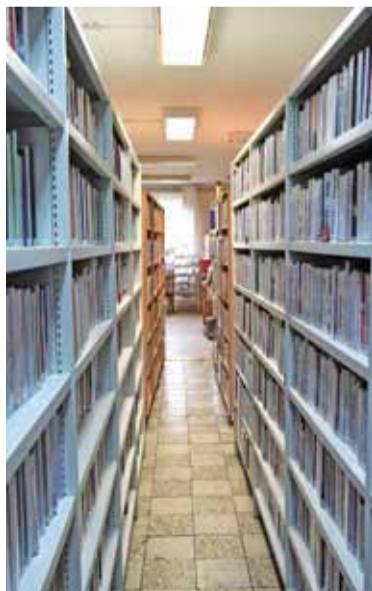
Przy Chyliczkowskiej na niewielkiej powierzchni zgromadzono kilkanaście tysięcy książek