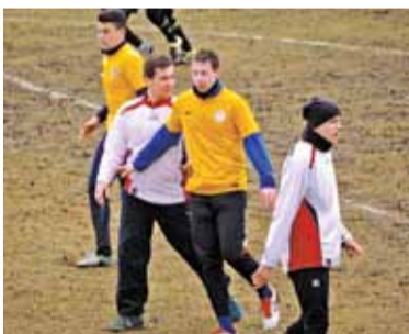
Lokalne kluby walczą o różne cele – jedni o awans, drudzy o utrzymanie