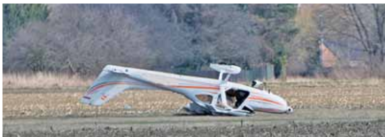
Niecodzienny widok samolotu do góry kołami pobudzał wyobraźnię

opuścił maszynę, która w wyniku niefortunnego lądowania uległa uszkodzeniu. W samolocie w chwili zdarzenia znajdował się tylko pilot – dodaje.