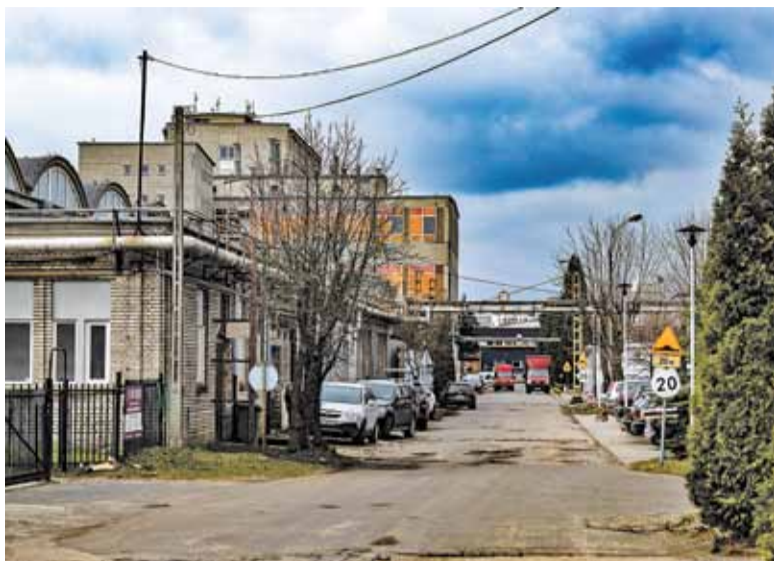
Czy dzielnica przemysłowa Piaseczna stanie się dzielnicą wielofunkcyjną?