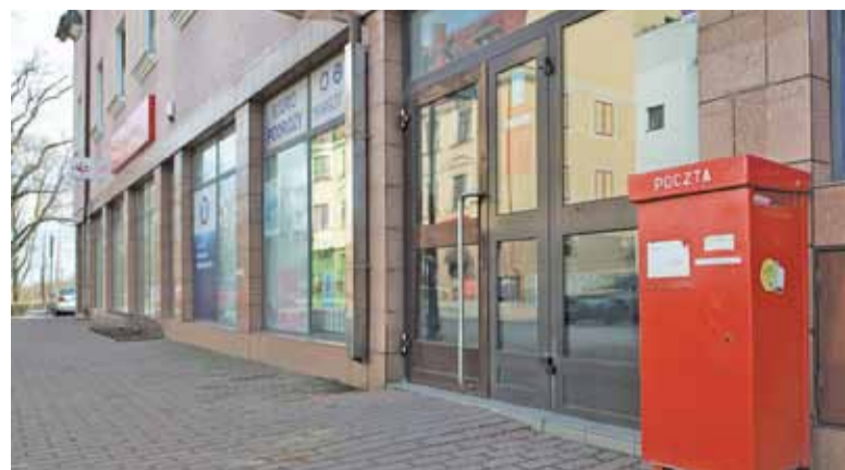
Najbardziej mieszkańcy narzekają na główną konstancińską placówkę przy ul. Wilanowskiej 1