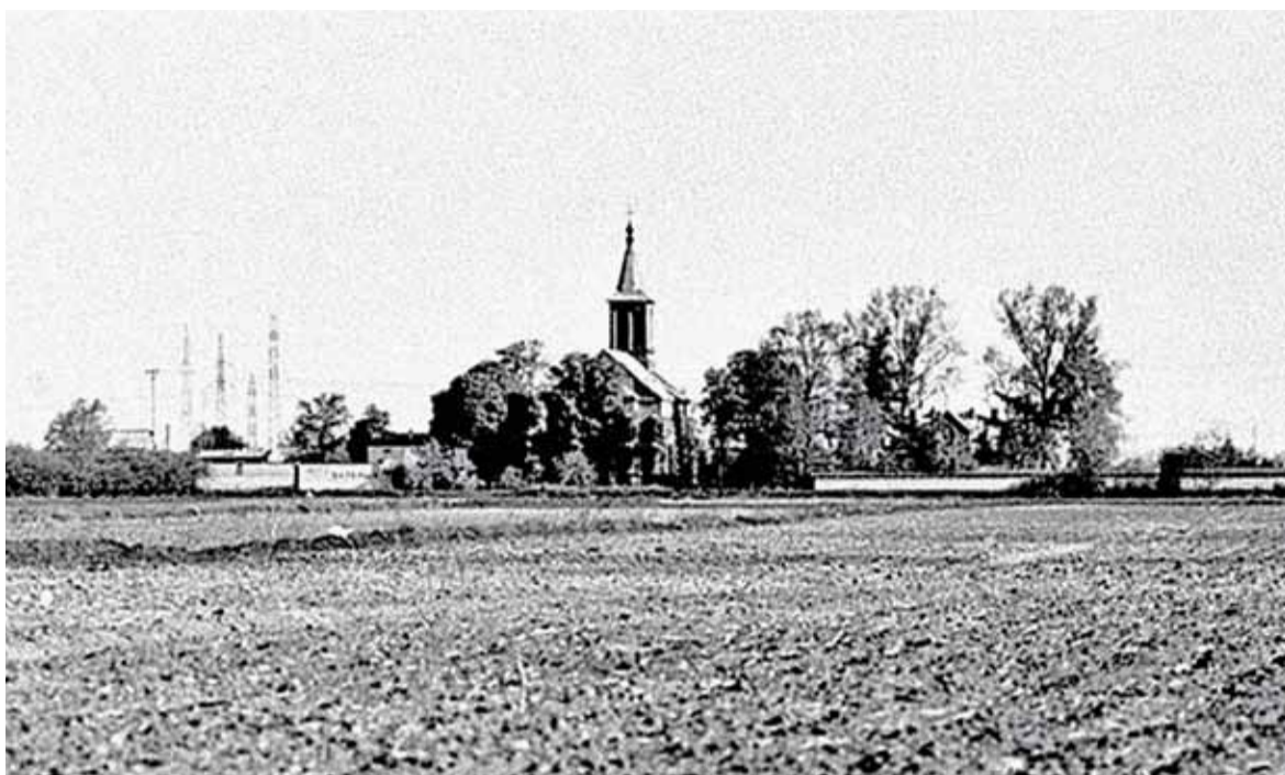
Kościół w Starej Iwicznej