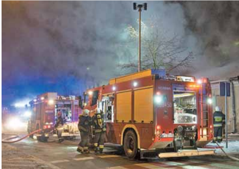
W 2018 r. strażacy gасili 876 pożarów