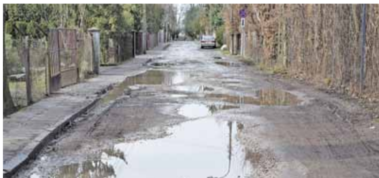
Wjazd w Anhellego z Głównej wygląda jak tor offroadowy

Mieszkańcy zaczęli starać się o utwardzenie tej drogi 11 lat temu.