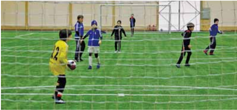
Ogromne pieniądze dla szkółek piłkarskich