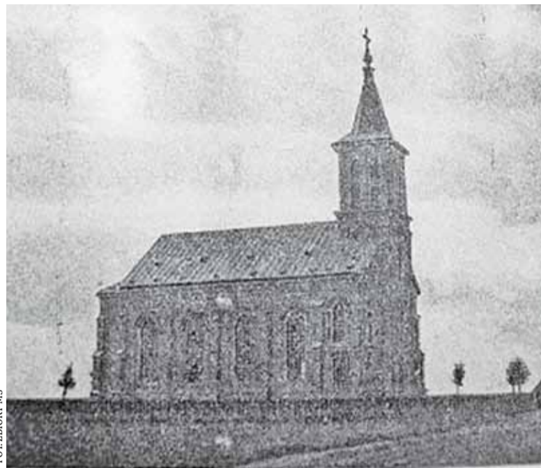
Kościół w Starej Iwicznej. Zdjęcie z początku XX w.

Latem 1965 roku po raz pierwszy pojechałam do kościoła w Starej Iwicznej, wsi założonej niegdyś przez władze pruskie dla kolonistów niemieckich i nazwanej Alt Ilvesheim. Podróżując rowerem polnymi drogami z ulicy Bema, wśród pół kapusty, jęczmienia i ziemniaków do północnych granic miasta, nagle trafiłam w miejsce naprawdę tajemnicze.