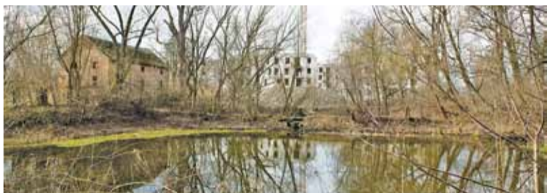
Gmina zamierza kupić działkę z dwoma stawami i starym spichlerzem