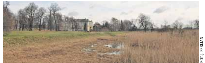
Przycięcie wodnych roślin to działania doraźne

P rzycięcie wodnych roślin na terenie stawu zwanego „Balatonem” rozbudziło wyobraźnię mieszkańców. Wielu myślało, że to już początek zaplanowanego na ten rok kolejnego etapu modernizacji parku, czyli prac wokół stawu. Okazuje się jednak, że to tylko działania profilaktyczne prowadzone przez Wydział Utrzymania Terenów Publicznych Urzędu Gminy. Wycinka