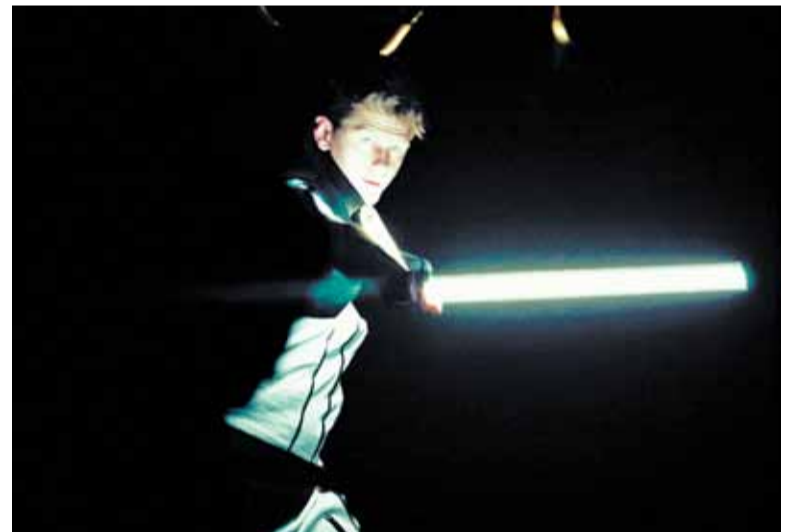
Występ grupy Multivisual

O oprawę artystyczną zadbał finalista V edycji programu „Mam Talent!” – grupa Multivisual, która swoim pokazem światła zrobiła ogromne wrażenie na gościach.