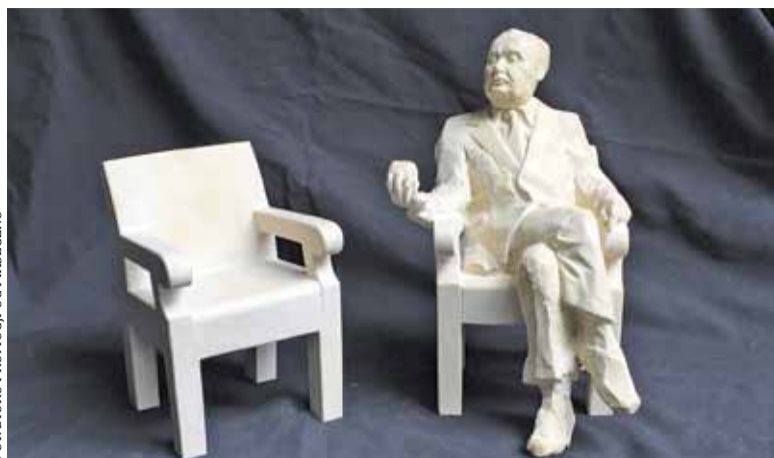
Pierwotny zamysł ławeczki z rzeźbą artysty zamienili na dwa fotele