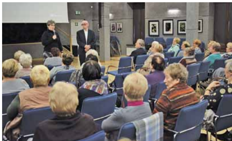
Repatriantki mieszkające w Górze Kalwarii opowiedziały podczas wykładu UTW swoje niezwykłe historie