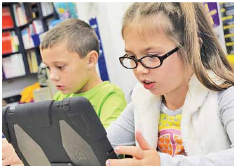
Edukacja wkracza w nowy etap