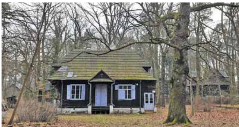
Przebudowa jest ważna, ale należy też zadbać o bezpieczeństwo zabytkowego dębu