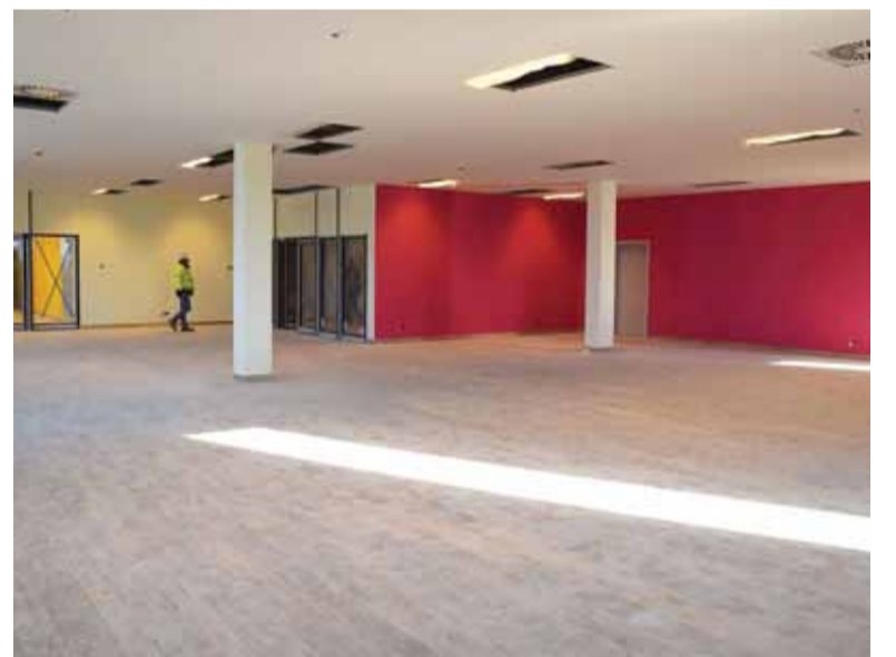
W budynku CEM będzie duża czytelnia, miejsce na spotkania i zajęcia oraz przestrzeń do dalszego rozwoju

musi spełniać odpowiednie warunki. Tak ciężkie zbiory wymagają specjalnego stropu, a to znacznie skraca listę potencjalnych lokali. Jakis czas temu pojawił się pomysł podpisania porozumienia z Ambasadą Gruzji i przeniesienia biblioteki do należącego do tej placówki dyplomatycznego domu przy ul. Królowej Jadwigi w Zalesiu Dolnym. Niestety, przedwojenna willa wymaga kosztownego remontu i dostosowania do wspomnianych wcześniej specyficznych wymogów. – Poza tym, Powiat nie jest właścicielem tej nieruchomości, a więc z miejsca pojawiłyby się pytania o zasadność tych nakładów – tłumaczy wicestarosta i dodaje, że dodatkowym problemem byłaby konieczność zmiany gminnego planu zagospodarowania przestrzennego. – A to niestety nie jest takie proste i zawsze musi trochę potrwać.