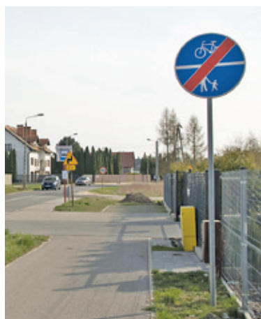
Ścieżka rowerowa w Siedliskach ma zostać wydłużona aż do DK79

– Obecnie trwają uzgodnienia dotyczące przebudowy sieci urządzeń podziemnych – informuje starosta Ksawery Gut.