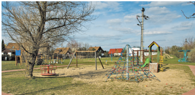
Nowa nawierzchnia pojawi się m.in. na placu zabaw w Wólce Kozodawskiej

P odobnie jak przed rokiem, Wydział Utrzymania Terenów Publicznych UG zamierza unowocześnić kolejne ogródki jordanowskie. Przetarg na to zadanie mówił o czterech lokalizacjach gminnych placów zabaw: w Wólce Kozodawskiej przy ul. Herbacianej Róży, street workout w Henrykowie Uroczu przy ul. Mokrej, w Jazgarzewie przy ul. Leśnej oraz plac zabaw „Nivea” w Józefosławiu przy ul. Ogrodowej. Oczywiście zakres prac zależy od ilości środków. Gmina zamierza na to