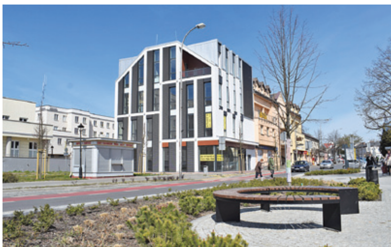
Kamienica wyróżnia się na tle sąsiadujących budynków