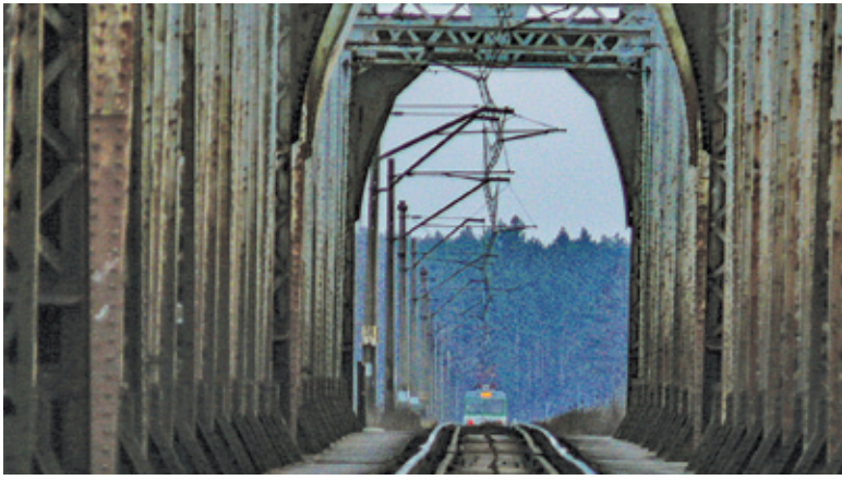
Most w Warce, chociaż piękny, od dawna wymagał przebudowy