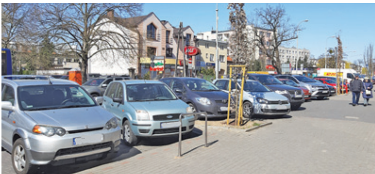
Kolejna strefa płatnego parkowania ma powstać przy ul. Puławskiej