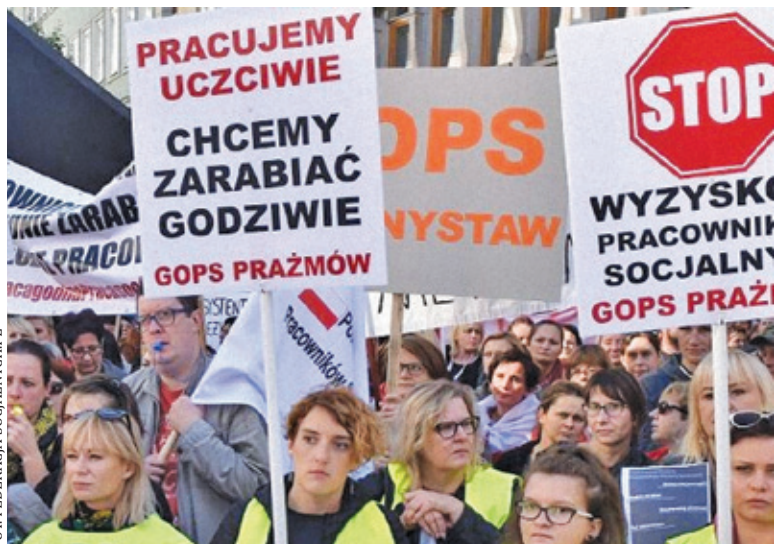
Protest pracowników pomocy społecznej trwa od października