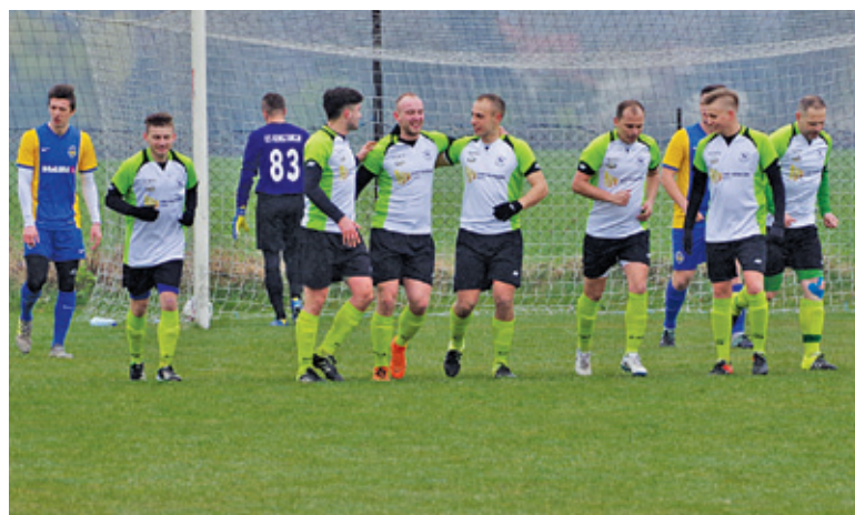
Bramka w ostatniej minucie ustaliła rezultat meczu

W niewesołych nastrojach byli również gracze rezerw MKS Piaseczno, którzy przegrali na wyjeździe 0:1