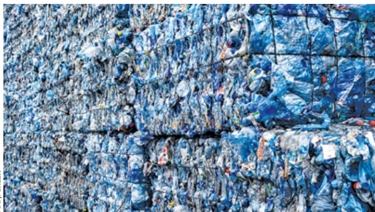
Poziom odzysku tworzyw sztucznych i papieru w ostatnim czasie maleje, a to właśnie tych frakcji produkujemy najwięcej