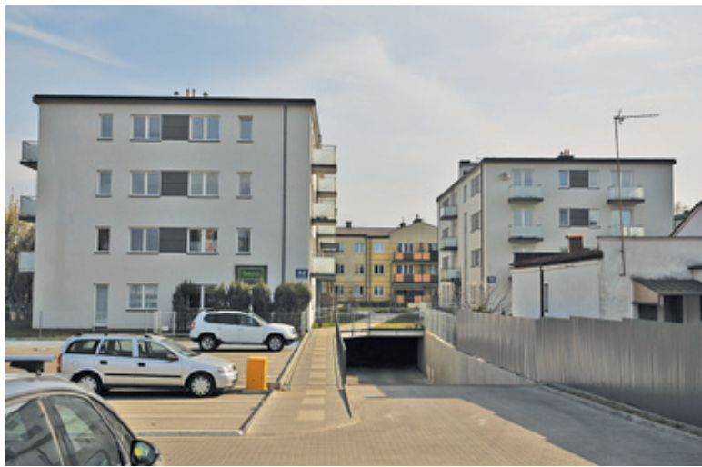
Na osiedlu „Moje miejsce” mieszka kilkadziesiąt rodzin