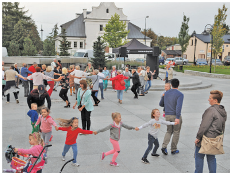
Ubiegłoroczna potańcówka bardzo przypadła mieszkańcom do gustu