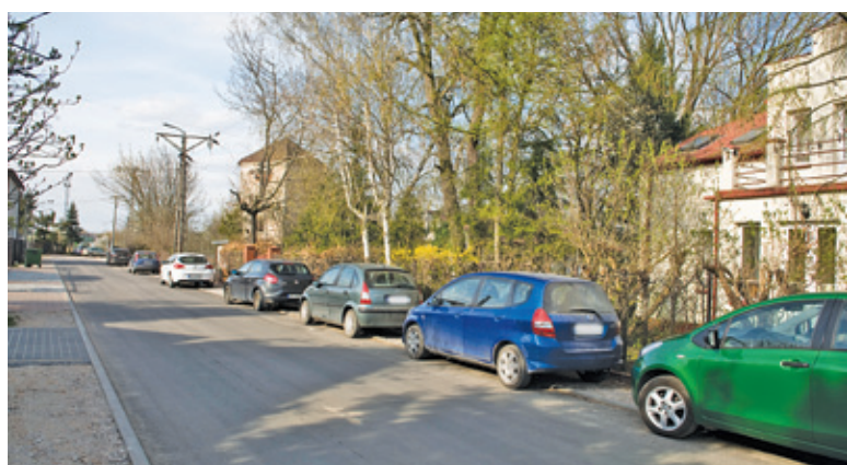
Auta parkujące wzdłuż tego odcinka ulicy Kasprowicza nie łamią przepisów