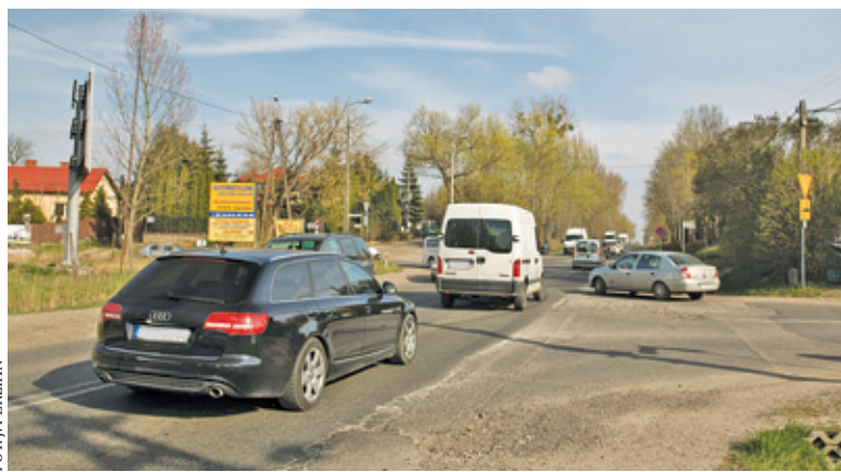
Obecnie by przejechać przez DK79, kierowcy muszą liczyć na życzliwość innych użytkowników drogi