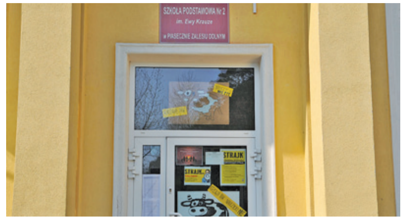
Strajkujący nauczyciele ciągle liczą na zrozumienie rodziców i podkreślają, że walczą o przyszłość edukacji, a nie tylko podwyżki