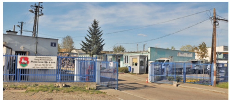
Komunalna spółka chciałaby być jedynym podmiotem odbierającym odpady od mieszkańców