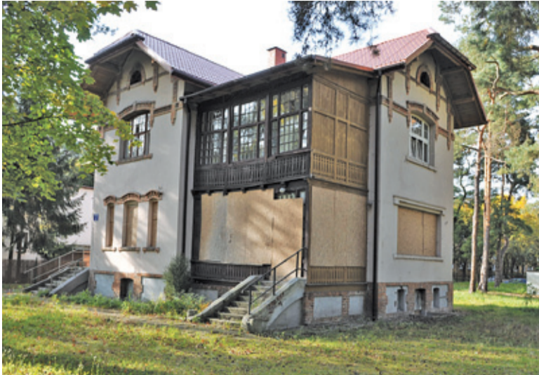
Willa Biała musi czekać na nowego właściciela