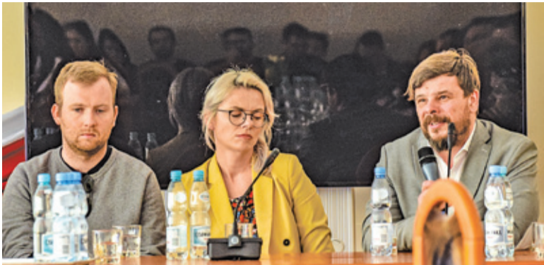
Na czwartkowym spotkaniu mieszkańcy tłumaczyli dlaczego radni powinni zmienić plan