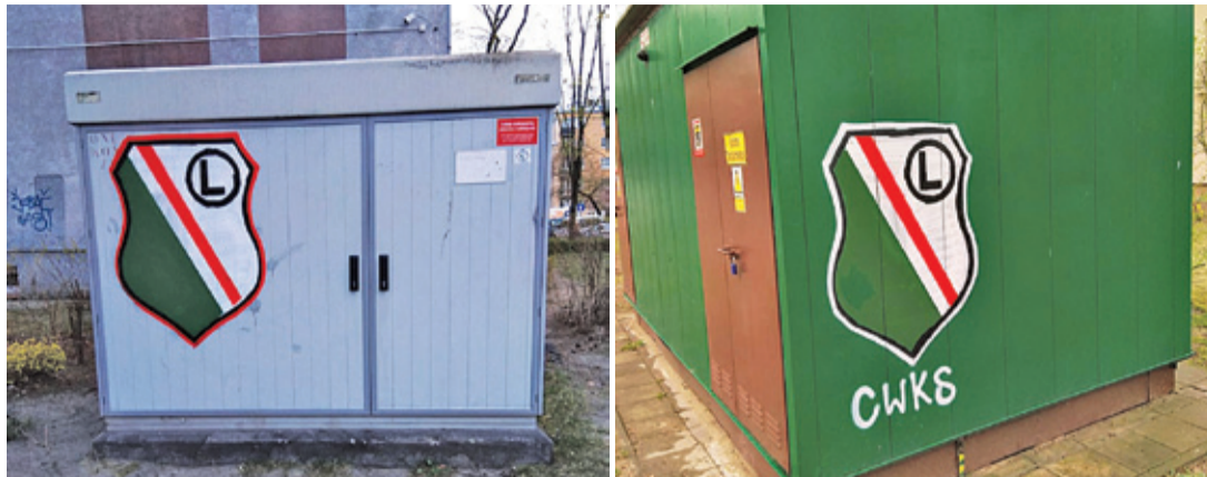
Herby można spotkać praktycznie wszędzie