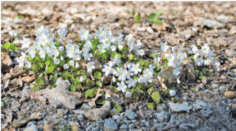
Nowe rośliny pojawiają się wśród bardzo wysuszonej ściółki