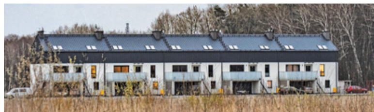
Budynki przy Gazeli powstały niezgodnie z planem zagospodarowania

Wniosek o pozwolenie na budowę deweloper złożył 14 listopada 2014 roku, 17 listopada z kolei zaczął obowiązywać nowy plan zagospodarowania przestrzennego, co spowodowało, że projekt budowlany przestał spełniać wymogi planu zagospodarowania. Mimo to, 30 grudnia 2014 roku starosta wydał pozwolenie na budowę. Deweloper postawił budynki, a w czerwcu 2018 roku otrzymał pozwolenie na użytkowanie. Trzy miesiące wcześniej wojewoda, z powodu rażącego naruszenia prawa, stwierdził nieważność pozwolenia na budowę.