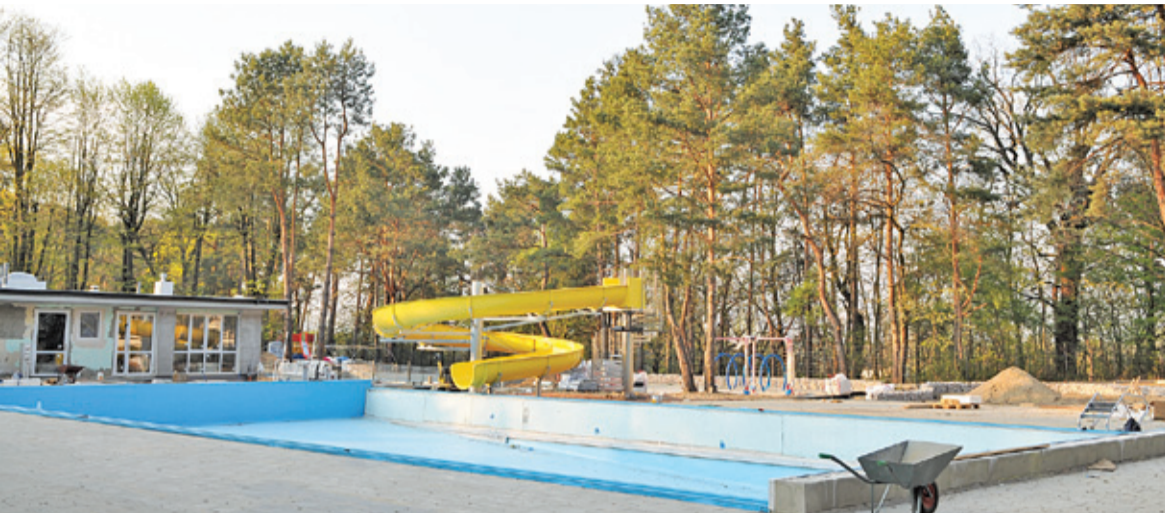
Władze Parku Kultury w Powsinie zapewniają, że prace idą zgodnie z planem

W ramach kolejnych inwestycji wyremontowano całoroczne korty tenisowe a także rozbudowano i unowocześniono plac zabaw. W parku pojawiły nowe estetyczne elementy małej architektury: ławki, leżanki, stoliki. Modernizacja basenu ma być ostatnim elementem tych prac.