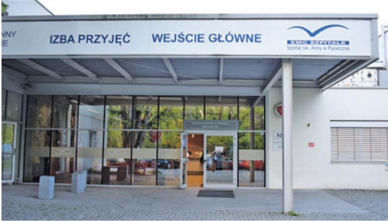
Szpital ma nadzieję zatrudnić odpowiednią liczbę lekarzy do połowy maja