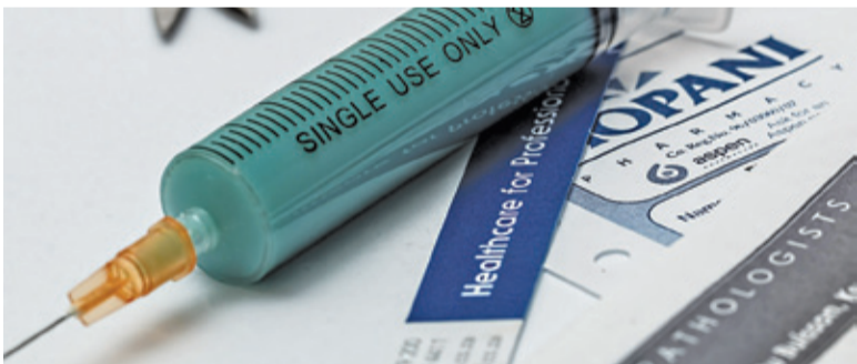
Na terenie województwa odnotowuje się coraz więcej przypadków zachorowań na odrę