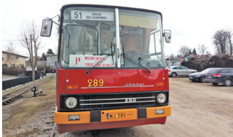
Linia 51 wróci do Piaseczna już 1 maja