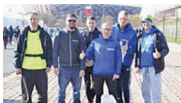
Kondycja na Orlen Warsaw Marathon