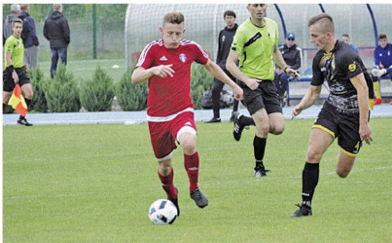
W zeszłym sezonie MKS uległ 1:2, teraz mecz wygląda zupełnie inaczej