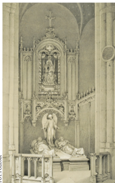
Grobowiec Niemcewicza i Kniaziewicza w Montmorency