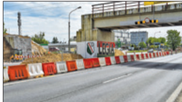
|| Piaseczno – Rozbiórka wiaduktu s. 5