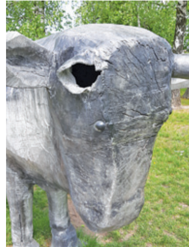
Mieszkańcy często zapominają, że rzeźby nie są urządzeniami przeznaczonymi do zabawy

Odwiedzający w majówkę piaseczyński park im. Książąt Mazowieckich spacerowicze zauważyli, że tur zamienił się w... jednorożca. W miejscu drugiego rogu została tylko ziejąca dziura.