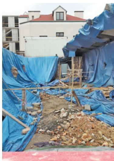
Zabezpieczone folią resztki murów czekają na wznowienie prac od kilkunastu miesięcy