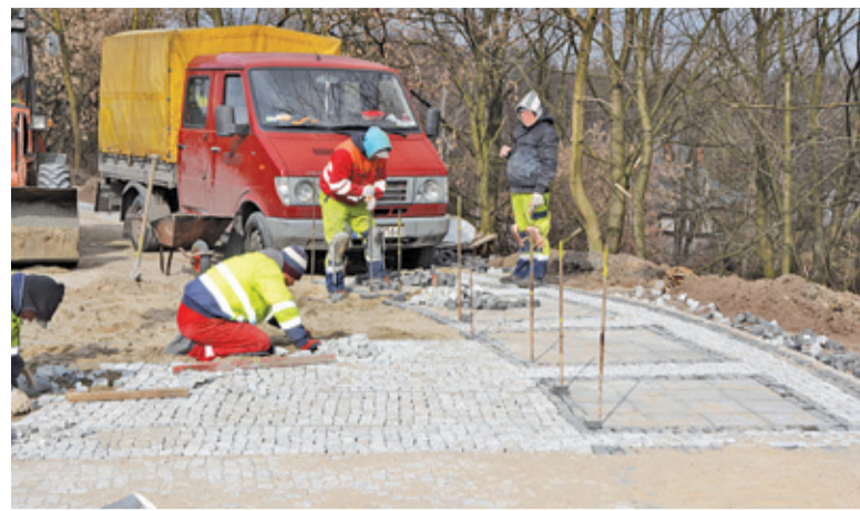
Wykonawca spóźnił się z oddaniem inwestycji o 194 dni