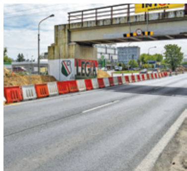
Połowa wiaduktu została zburzona w zeszły weekend, kolejna część zostanie zburzona w ten weekend