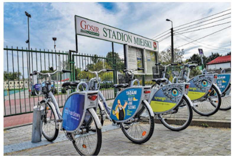
Czwarta stacja Piaseczyńskiego Roweru Miejskiego została zrealizowana z Budżetu Obywatelskiego