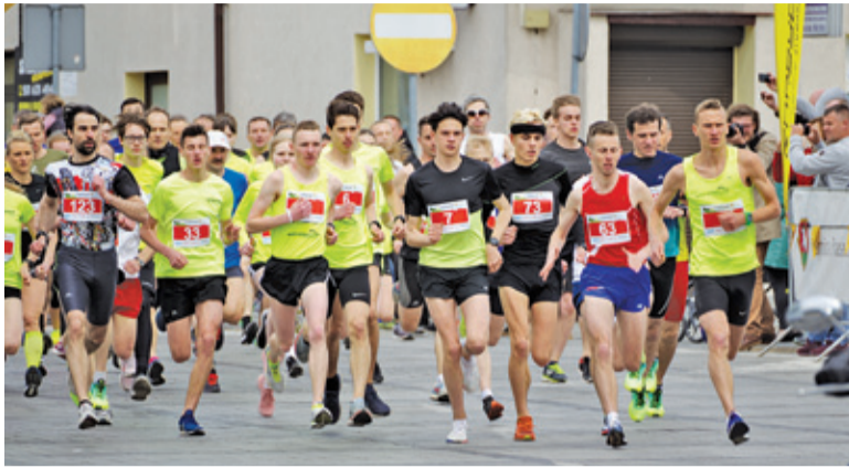
Emocji nie brakowało