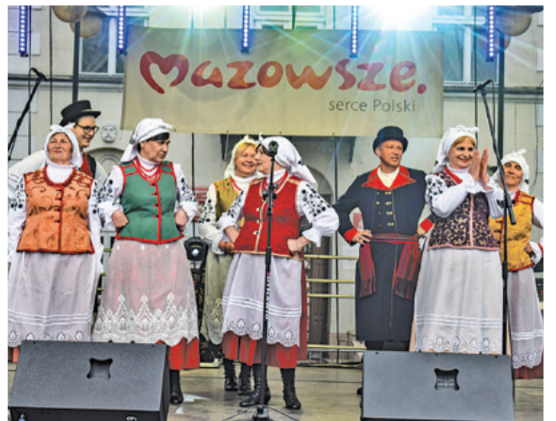
Na scenie zagrali i zaśpiewali m.in. Urzeczni