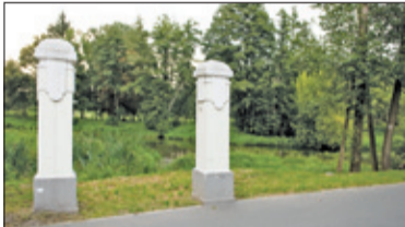
|| Konstancin-Jeziorna – I po pomoście s. 2