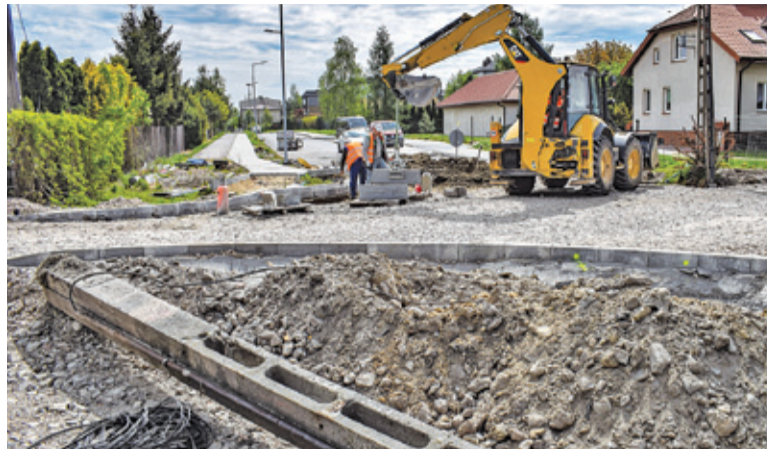
Budowane skrzyżowanie z Osiedlowej będzie połączeniem ul. Cyraneczki z Kuropatwy, dzięki czemu Józefosław zyska nowe połączenie z Puławską

Niestety wciąż nie rozwiązana jest kwestia „wąskiego gardła” na ulicy Kuropatwy od granicy gminy Lesznowola do ronda przy sklepie Selgros. Ten odcinek jest wąską osiedlową drogą, z