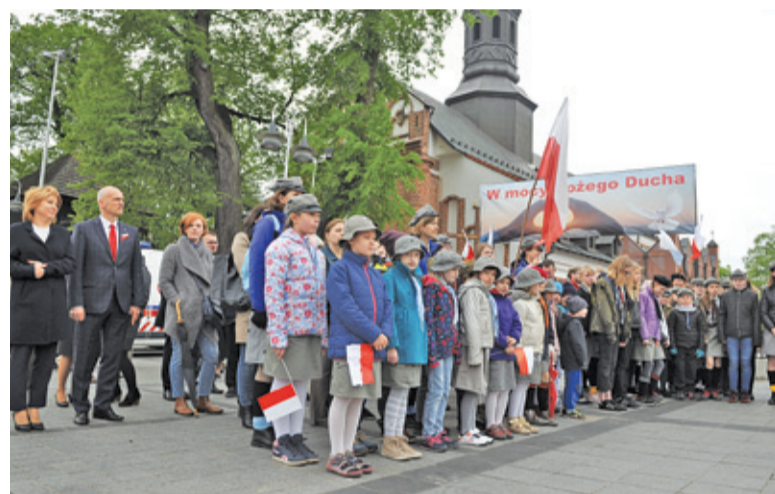
W patriotycznych uroczystościach licznie uczestniczyły zuchy i harcerze