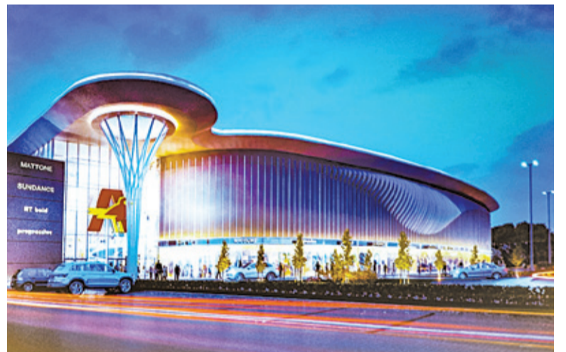
Tak ma wyglądać Galeria Piaseczno

tyłach Auchan, na której przeważa zabudowa jednorodzinna. Rozbudowa w zasadzie została na pewien czas zablo-