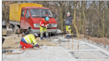
|| Góra Kalwaria – Kara zbyt niska s. 4