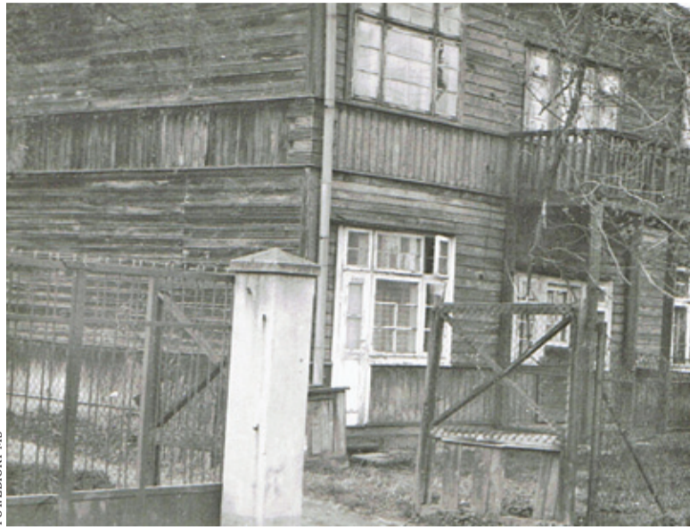
Nieistniejący dom stojący niegdyś przy ul. Kniaziewicza, zamieszkały przez m.in. rodzinę Markowskich

N a ulicy Karola Kniaziewicza czas był odliczany stukotem jadącego pociągu kolejki wąskotorowej, dzwonekami szlabanów z ul. Sienkiewicza, tych obok kina Mewa, i wyciem syren oznajmujących o 7.00 rozpoczęcie pracy, a o 15.00 zakończenie pracy warsztatów kolejki.