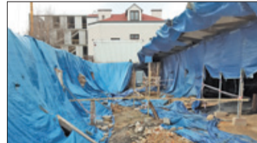
|| Piaseczno – Plebania do odtworzenia s. 7