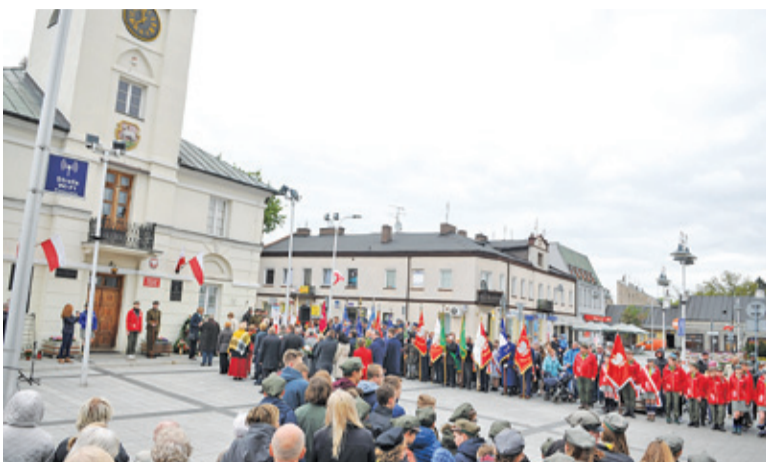
Uroczystą oprawę uroczystości zapewnia między innymi obecność pocztów sztandarowych