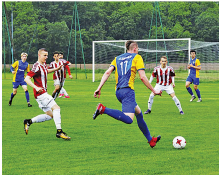
Spadek pewny, ale seniorzy Konstancina grają dalej