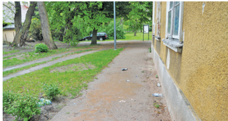
Takie „pamiątki” zostają po spotkaniach obok zabytkowego budynku mimo znajdujących się obok koszy na śmieci

wiście mogłaby być niebezpieczna. Jak poinformowało nas Biuro Promocji UG, straż miejska nie odnotowała tego typu zgłoszeń od mieszkańców, a patrolujący