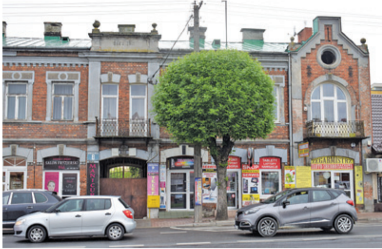
Uchwała krajobrazowa jest w Górze Kalwarii ewidentnie potrzebna