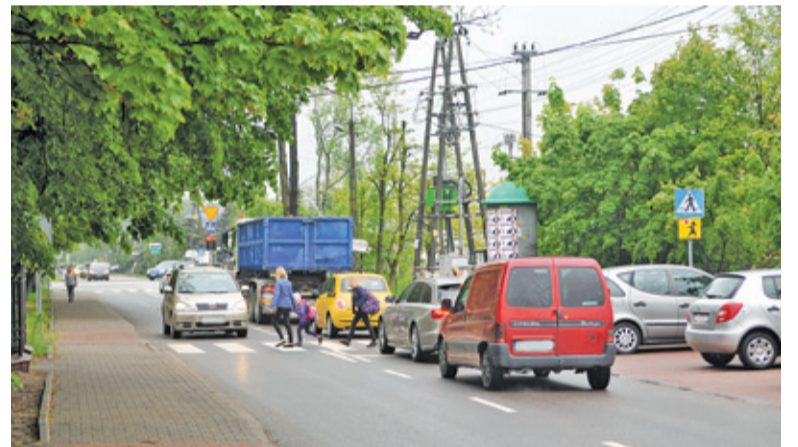
Przejście jest niebezpieczne, gdy na ulicy stoi korek, który utrudnia dzieciom widoczność sąsiedniego pasa ruchu

– Czasem sytuacja jest bardzo trudna, bo zjeżdżamy ze skrzyżowania z al. Krakowskiej, a korek w ul. Szkolnej sprawia, że blokujemy ruch – mówi jedna z matek dojeżdżających z Woli Mrokow-