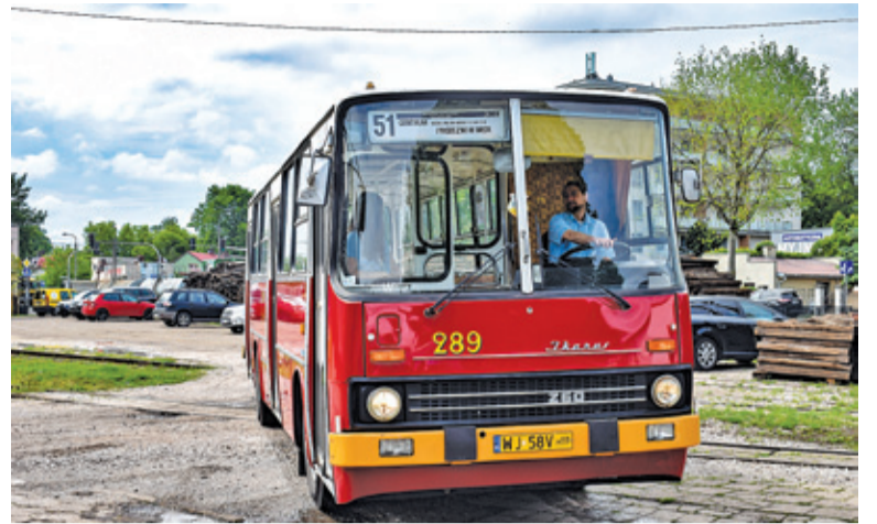
Dziennikarze przyjechali do Piaseczna Zabytkową Linią 51