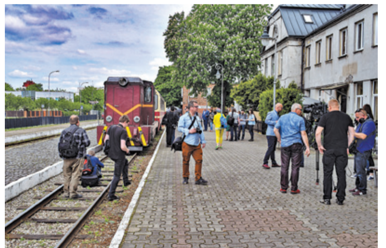
Konferencja odbyła się na peronie stacji Piaseczno Miasto Wąskotorowe oraz pociągu do Złotokłosu

Dziennikarze przyjechali do Piaseczna Ikarusem, a potem wsiadli do