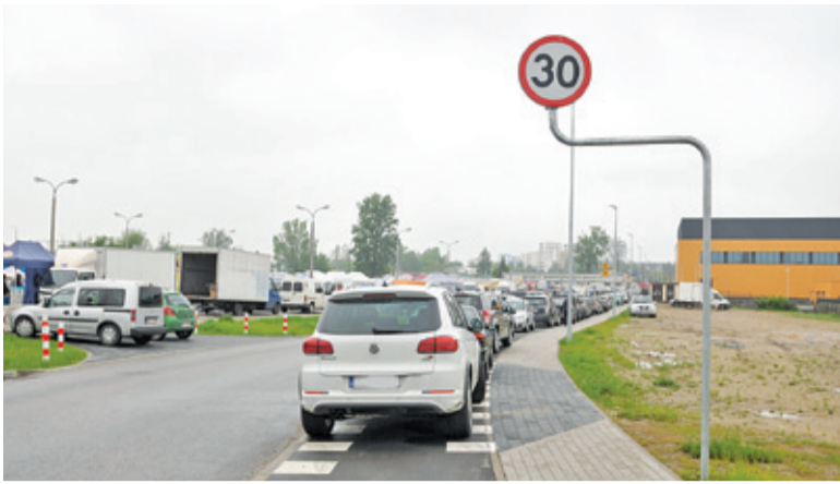
Ścieżka rowerowa stała się regularnym parkingiem