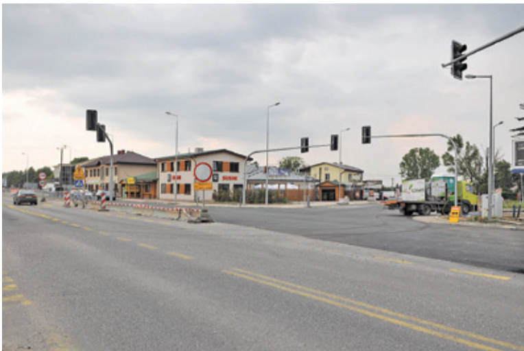
Układanie nawierzchni powinno się zakończyć w przyszłym tygodniu