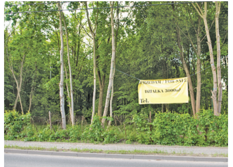
Z przestrzeni publicznej mają zniknąć również tego typu banery

– To są materiały wyborcze, a nie reklamy i kwestie te są regulowane inną ustawą, ale jeszcze to zweryfikuję – powiedziała Ewa Klimkowska-Sul. Żadne szczegóły dotyczące dalszych prac nad uchwałą nie zostały podane. Warto zauważyć, że uchwała intency-