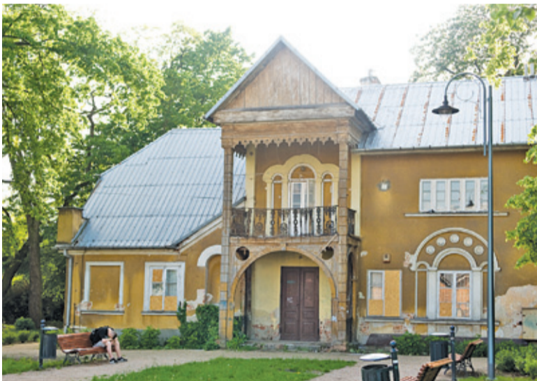
Na tyłach budynku brakuje kamer monitoringu