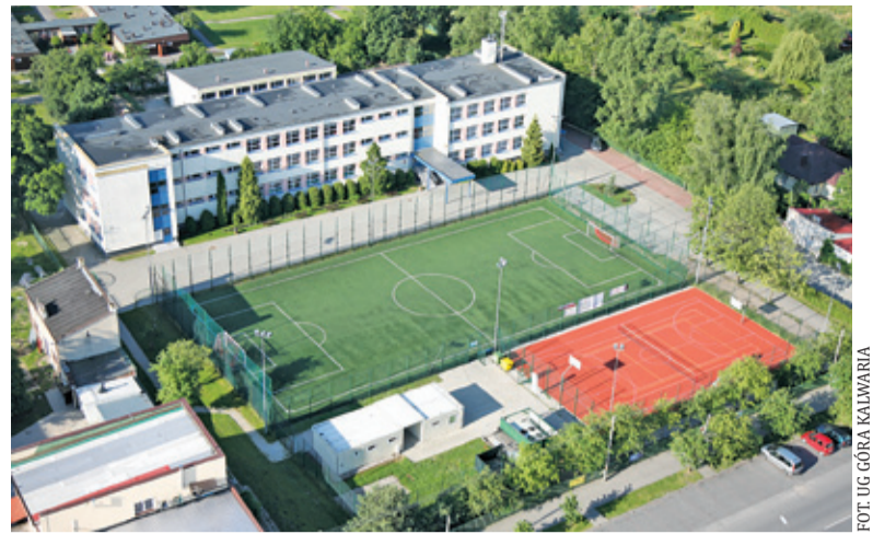
Przy „dwójce” jest orlik, jednak placówka zdecydowała się postawić na intensywną naukę pływania

Procedura zmiany mpzp dla Zalesia Górnego będzie nadal prowadzona. Urzędnicy liczyli, że dzięki spotkaniu informacja o możliwości złożenia wniosku o odlesienie dotrze do jak największej liczby osób, które uznają, że w bliższej czy dalszej przyszłości będą chciały skorzystać z możliwości dokonania