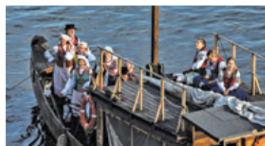
Szkuta „Oskar Kolberg” to idealna jednostka na turystyczne rejsy po Wiśle

– Statek będzie kursować 2 i 8 czerwca od 10.00 do 14.00. Rejsy zaczynać się będą w porcie w Górze Kalwarii (teren piaskarni). Szkuta popłynie w stronę Warszawy, po 20-25 minutach zawróci, a zatrzyma się w porcie – informuje gmina Góra Kalwaria.