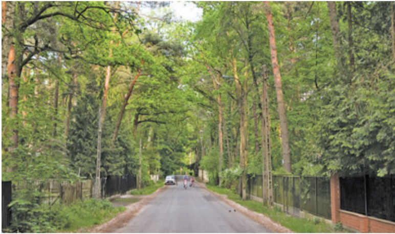
Mieszkańcy Zalesia Górnego chcą zachowania maksymalnego poziomu zalesienia swojej miejscowości