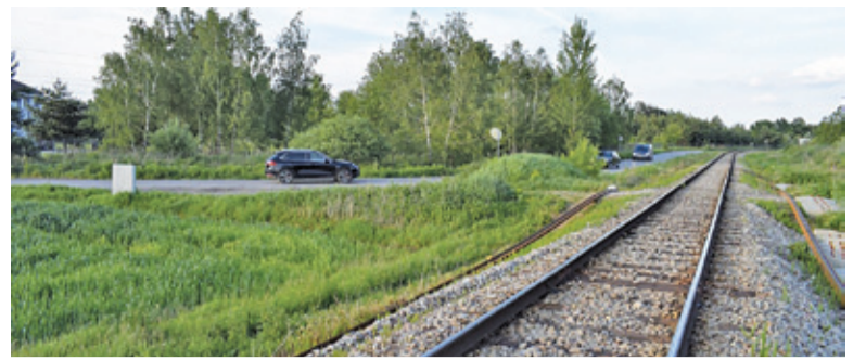
10 KDL miała przebiegać wzdłuż linii siekierkowskiej