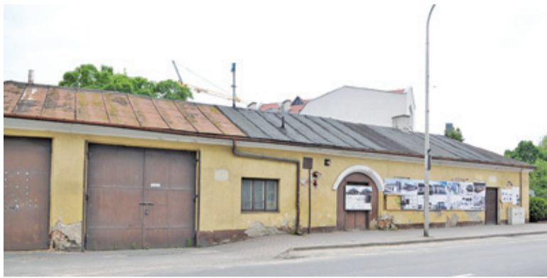
Bez powiększenia powierzchni budynku remiza nie będzie zbyt funkcjonalna

Projekt budowlany został już przygotowany przez architektów. Usiłowaliśmy się dowiedzieć w Urzędzie Gminy, czy konserwator zabytków nie złożył do niego zastrzeżeń. Taką bowiem informację otrzymaliśmy nieoficjalnie od jednego z radnych.