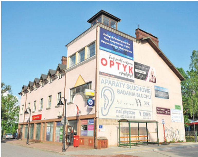
Łączna powierzchnia szyldów na jednym budynku będzie podlegać znaczącym ograniczeniom