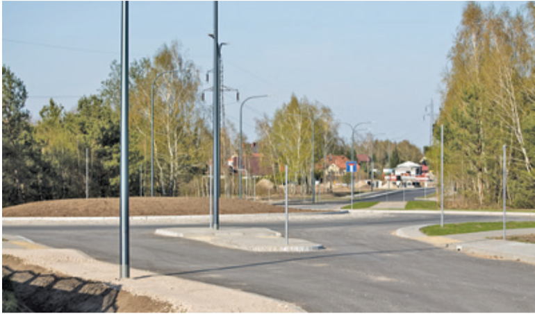
Tymczasem połączenie z węzłem Antoninów na terenie gminy Piaseczno jest już prawie gotowe