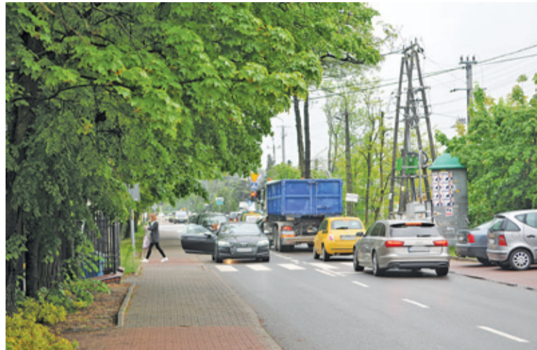
Tamowanie ruchu, by wypuścić dzieci z samochodu irytuje innych kierowców