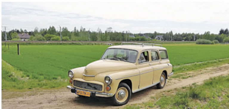
Warszawa 203 kombi jedzie w czerwcu na rajd do Rumunii