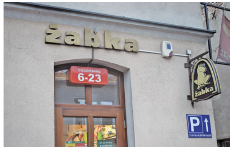
Ładne, estetyczne szyldy są często lepiej zauważalne niż pstrokaty nośniki

W I i II strefie na elewacji budynku nie będzie można zamieszczać nośników reklamowych niezwiązanych z działalnością prowadzoną w danym obiekcie (poza reklamą okolicznościową).