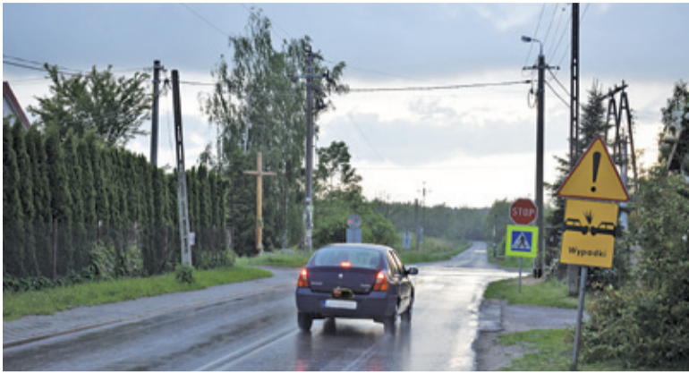
Rondo na skrzyżowaniu w Piskórcie poprawi bezpieczeństwo użytkowników