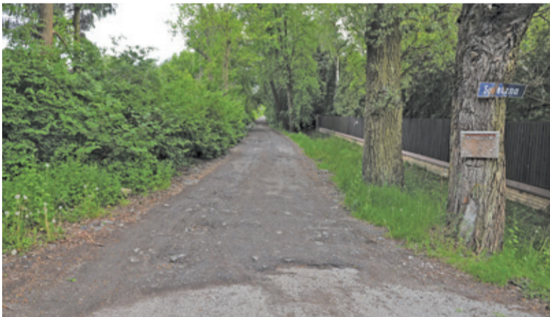
Mieszkańcy skarżą się nie tylko na nawierzchnię ul. Iwa, ale też niebezpiecznie wąski wjazd od głównej ulicy