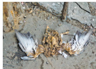
Ciało gołębia musiało leżeć na ganku przez dłuższy czas

– W ostatnim czasie wpłynęła jednak do SM interpelacja radnej Gminy Piaseczno w sprawie picia alkoholu na tyłach Poniatówki. Komendant straży