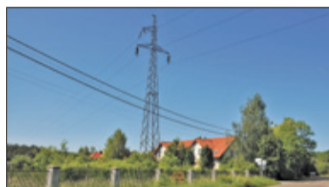
|| Konstancin-Jeziorna – Za słupy dziękujemy