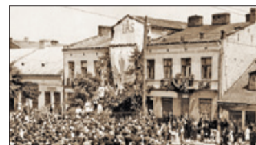
|| Historia – Piaseczno dwudziestolecia