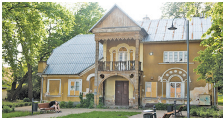
„Zakrapiane” spotkania odbywają się na skwerze na tyłach Poniatówki

Na pomysł zabezpieczenia zabytku przed ewentualnymi atakami dewastatorów w postaci ogrodzenia wpadła jedna z radnych.