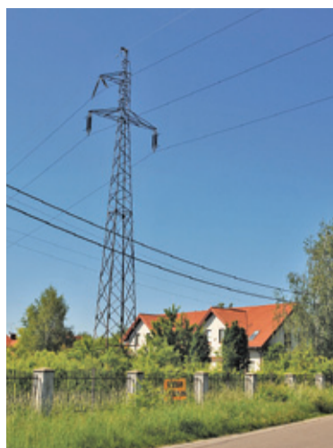
Mieszkańcy Borowiny akceptują stan obecny, ale nie zgadzają się na pogorszenie sytuacji jeśli chodzi o liczbę linii i wysokość słupów

– Rozumiemy argument o konieczności dostarczenia energii elektrycznej dla gminy Góra Kalwaria, jednak w