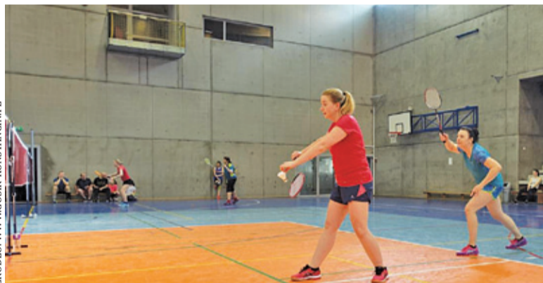
Zawody Konstancińskiej Ligi Badmintona odbywają się w hali GOSiR przy ulicy Żeromskiego