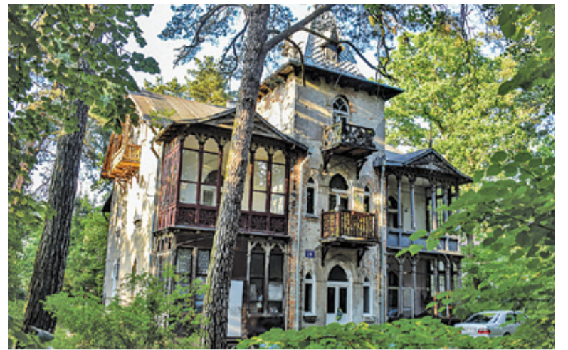
Willa Maryla to doskonała ilustracja upadku przedwojennego Konstancina