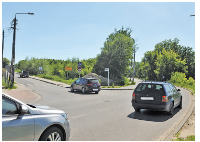
Okrężny ruch na skrzyżowaniu ma usprawnić komunikację