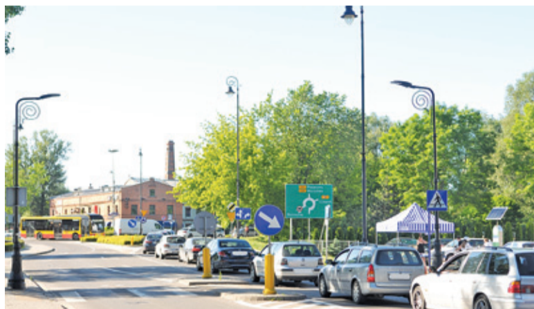
Droga wojewódzka 724 miałaby przenieść ruch tranzytowy poza centrum miasta