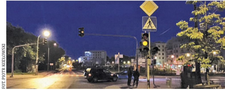
Przestrzeganie przepisów i zasada ograniczonego zaufania – to niezbędne elementy przy pokonywaniu skrzyżowania nocą