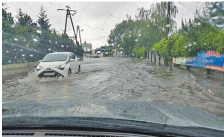
Podczas ulewnych deszczów ulica zamienia się w rzekę

lewa w ten sposób do kilku razy w roku. Problem w tym, że przy aktualnym układzie drogowym oraz remontach, trudno te ulice ominąć.