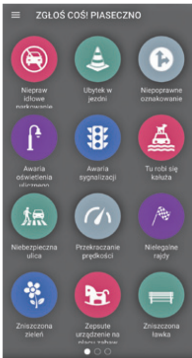
Aplikacja jest prosta w obsłudze