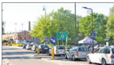
|| Konstancin-Jeziorna – Pytają o obwodnicę