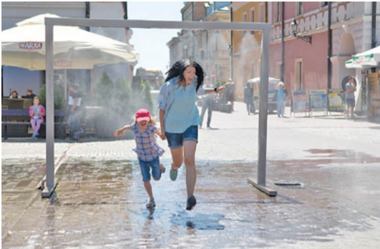
Kurтины wodne pojawiają się często na miejskich rynkach