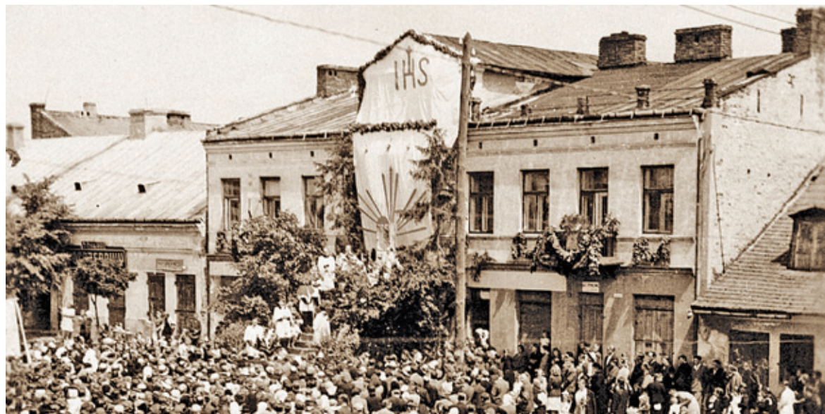
Piaseczno rynek w święto Bożego Ciała przed 1939 r.

Wiadomości ze świata to przede wszystkim olimpiada w Paryżu. W styczniu umiera Włodzimierz Lenin, a Wielka Brytania w lutym oficjalnie uznaje ZSRR. Hitler rozpoczyna dyktowanie Mein Kampf. Świat, jak to świat, żyje sensacjami, co tam jakiś Hitler czy Stalin, czytelników interesuje bardziej informacja o okręcie-widmo. Otóż dziennik paryski „Paris-Midi” donosi, że francuski parowiec osobowy, po-