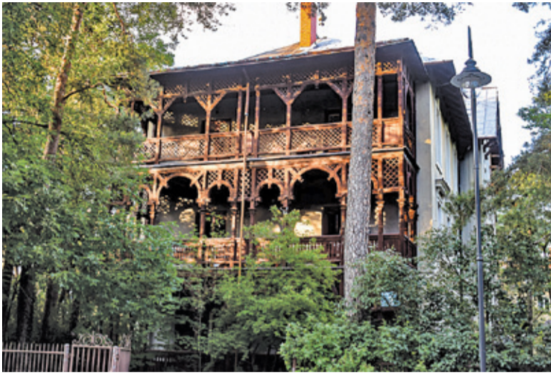
Quo Vadis przy Sobieskiego to monumentalny budynek z trójkondygnacyjnymi drewnianymi werandami