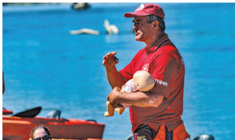
Nie zapominajcie o zasadach bezpieczeństwa

Nie skacz do wody w nieznanach miejscach. Jeżeli skaczesz, musisz dokładnie wiedzieć, na jakiej głębokości jest dno i jakie ono jest. Z dna może wystawać np. deska lub korzeń. To nie-