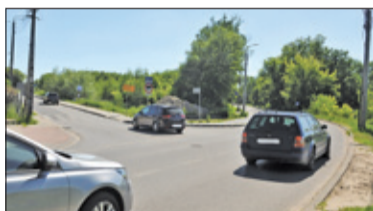
|| Chylce – Korki murowane