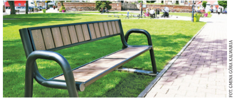
W centrum miasta stanie 21 takich ławek