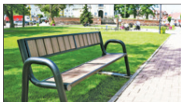
|| Góra Kalwaria – Ławki z recyklingu