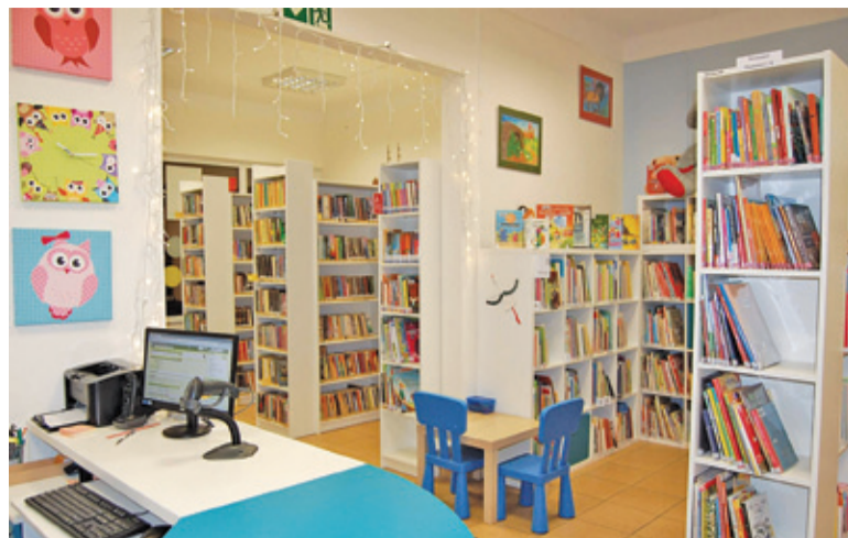
Najbardziej kolorowe są wypożyczalnie dla dzieci i młodzieży

– Chciałabym móc pójść z kimś na spacer, do kina – mówiła jedna z uczestniczek pikniku.