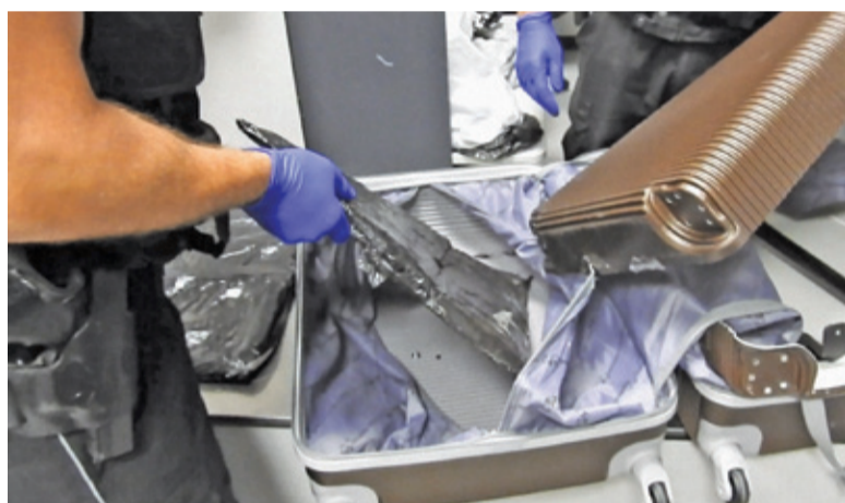
Badania potwierdziły, że proszek ukryty w walizce jest heroiną

|| Historia - Zakład hrabiny Moriconi s. 13