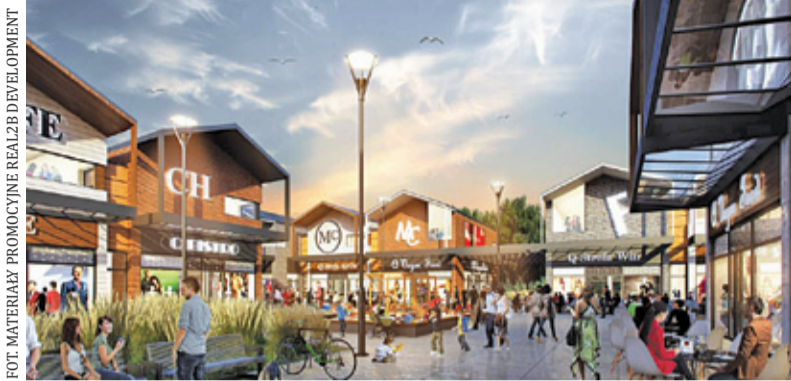
Kolejne centrum handlowe powstanie w sąsiedztwie osiedla Konstancja