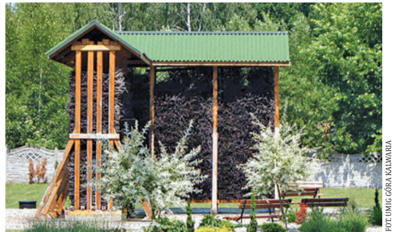
W Czaplinie powstanie tężnia