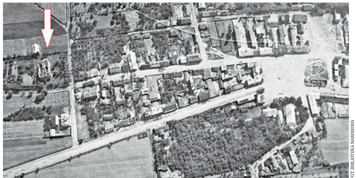
Piaseczno. Zdjęcie lotnicze z zaznaczonym budynkiem przytułku dla dziewcząt i dzieci, 1920 r.