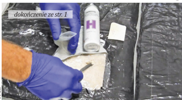
dokończenie ze str. 1