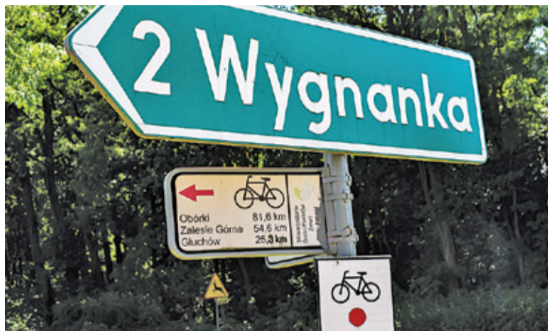
Początek Szlaku Głównego Krainy Jeziorki w Osuchowie