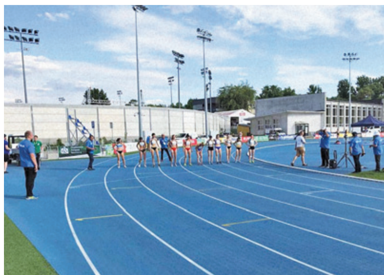
Rywalizacja na stadionie w Lublinie