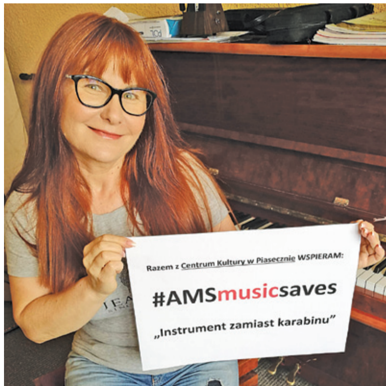
Każdy może zrobić swoje zdjęcie i zachęcić znajomych do udziału w akcji

też oczywiście kupić sprzęt nowy lub przekazać wpłatę na zakup sprzętu. Podarunki powinny trafić do Przystanku Kultura, znajdującego się przy piaseczyńskim Rynku. Jeśli ktoś nie może przekazać sprzętu, organizatorzy akcji odbiorą go ze wskazanego miejsca. W tym celu, podobnie jak z pomysłami, pytaniami lub własnymi zdjęciami z kartką promującą akcję z czytelnym hasłem: Razem z Centrum Kultury w Piasecznie WSPIERAM #AMSmusicssaves „Instrument zamiast karabinu”, można wysłać wiadomość na adres: renata.opala@kulturalni.pl, w temacie wpisując „Instrument zamiast karabinu”. Zdjęcia trafią na FB Centrum Kultury jako promocja akcji. Jej organizatorzy zachęcają również do rozpowszechniania informacji o zbiórce. Pomóżmy dzieciom wziąć do ręki „Instrument zamiast karabinu” – apelują. Joanna Ferlian