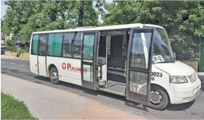
W małych autobusach linii P zmieszczenie roweru może być trudne