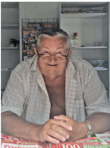
Kioskarz zarażał klientów optymizmem i poczuciem humoru