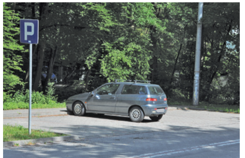
Samochód posiada tablice rejestracyjne z województwa dolnośląskiego

– Dopiero jeśli to nie skutkuje, w uzasadnionych przypadkach SM odholowuje pojazd – informuje i podkreśla, że postępowanie w podobnych sprawach jest czasochłonne. Wcześniej na