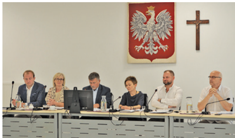
Radni udzielili też zarządowi absolutorium