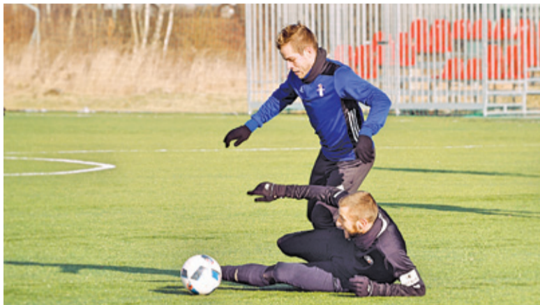
Piasecznianie zajęli w ubiegłym sezonie IV Ligi 6. pozycję w tabeli