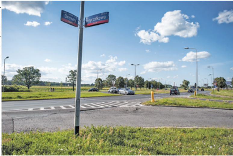
Stolica chce wybudować ciąg pieszo-rowerowy po wschodniej stronie ul. Drewny od skrzyżowania z ul. Przyczółkową do granicy Warszawy