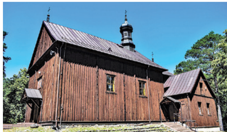
Kościół w Lutkówce to jeden z najstarszych i najlepiej zachowanych drewnianych obiektów sakralnych na Mazowszu