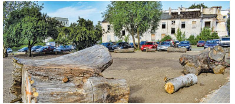
Łąka ma zakwitnąć do końca lipca, teren został otoczony pniami drzew zamiast słupkami