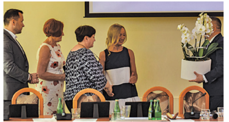
Pani wójt po otrzymaniu absolutorium przyjęła gratulacje i kwiaty