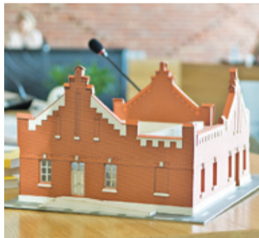
Makieta projektowanego muzeum pozwoliła pokazać, jak jego przestrzeń będzie zagospodarowana również wewnątrz

O tym, że projekt z dużym unijnym dofinansowaniem jest zagrożony, pisaliśmy szerzej przed miesiącem, w wydaniu 243 („Wytną muzeum?”). Renowacja zabytkowego budynku przy ul. Walentynowicz 18 i utworzenie w nim Muzeum Wycinanki Polskiej stały pod znakiem zapytania. W trakcie prac projektowych okazało się bowiem, że konieczne będą nieprzewidziane prace przy fundamentach, co znacznie podniosło koszty. Dyrektor Konstancińskiego Domu Kultury udało się pozyskać 2,5 mln złotych unijnej dotacji na ten projekt. Jednak wyższe koszty, które znalazły odzwierciedlenie w wysokości ofert w kolejnym przetar-