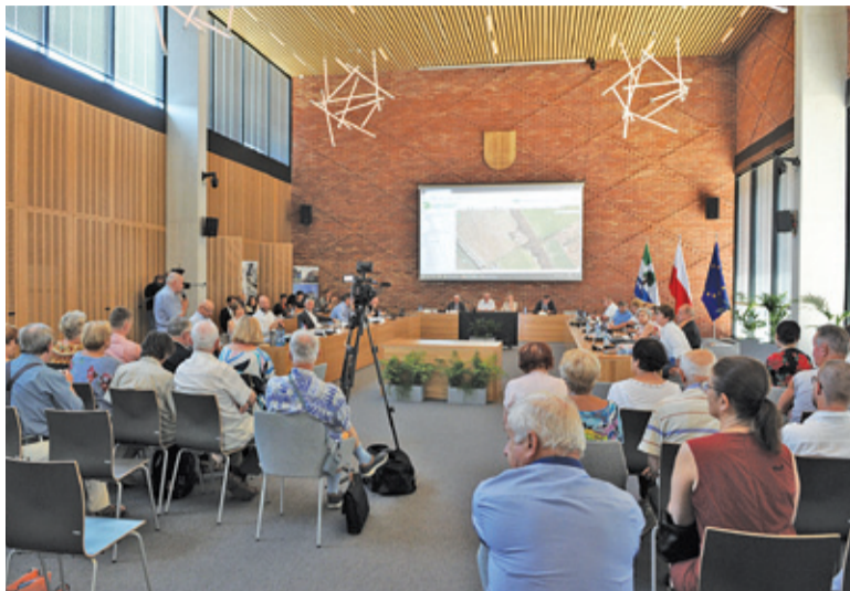
Czerwcowe sesje odbywały się pod okiem kamer, a głos w sprawie sprzedaży działek SGGW zabrali również mieszkańcy