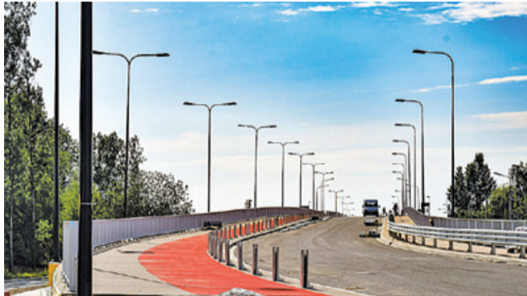
Wiadukt na Karczkowskiej jest już gotowy. Teraz PKP PLK musi uzyskać pozwolenie na użytkowanie wiaduktu od WINB

- Gdy rozpoczynaliśmy prace, wykonawca zlokalizował kilka kolizji sieci, co wymagało nieprzewidzianej przebu-