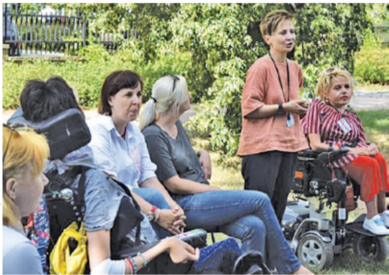
Podczas pikniku członkowie Bazy Wolontariatu opowiadali o swoich potrzebach i możliwościach