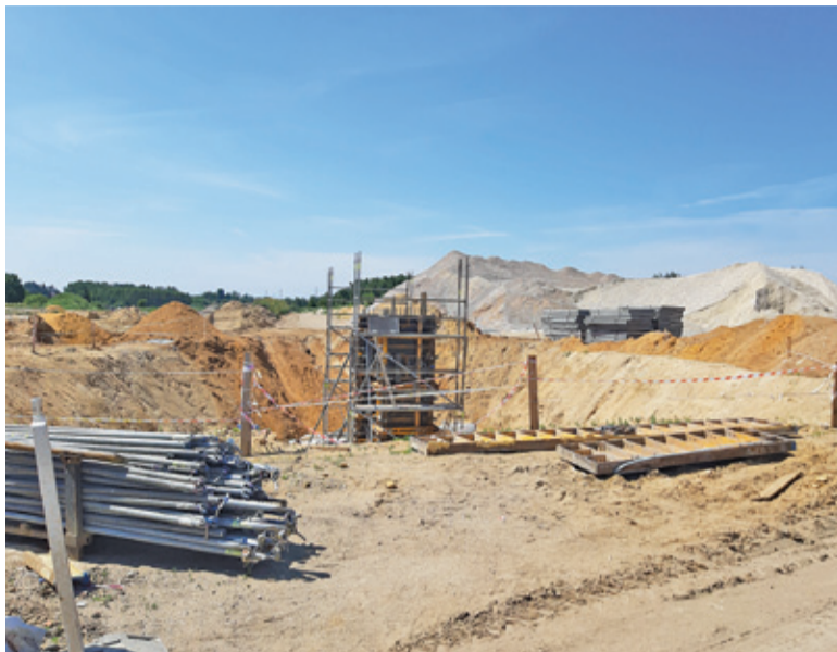
Budowana właśnie w okolicach Tarczyna S7 to kluczowa inwestycja drogowa dla całego powiatu