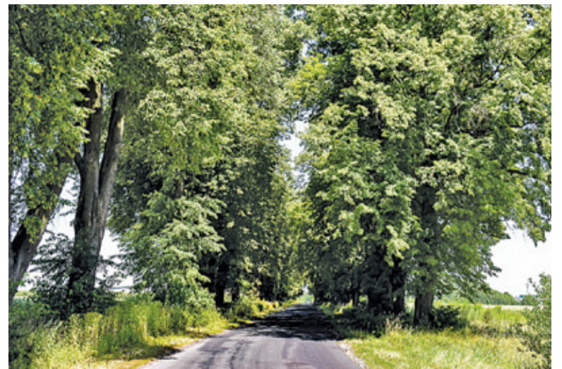
Zabytkowa Aleja Drzew w Osuchowie

Szlak rozpoczyna na rozwidleniu dróg w Osuchowie i biegnie w stronę Wycznanki. W Wycznance w II połowie XX wieku wykopano w korycie Jeziorci stawy rybne. Dalej jedziemy przez Cy-