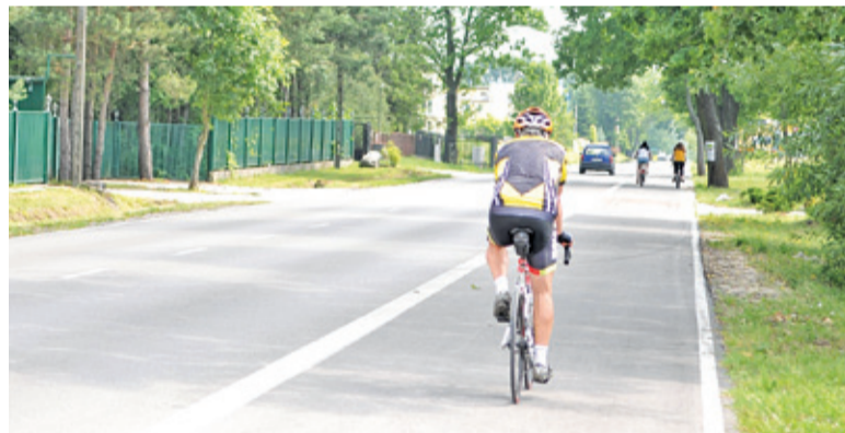
Bywa, że rowerzyści część trasy chcą pokonać autobusem, zwłaszcza tam, gdzie brakuje infrastruktury rowerowej

Regulamin porządkowy warszawskiego ZTM, który obowiązuje