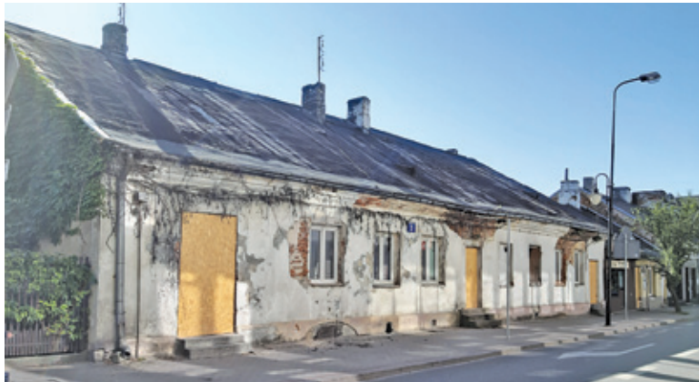
Stare budynki przy ul. Warszawskiej niebawem przestaną istnieć