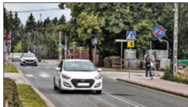
||| Józefosław - Zamkną skrzyżowanie s. 4