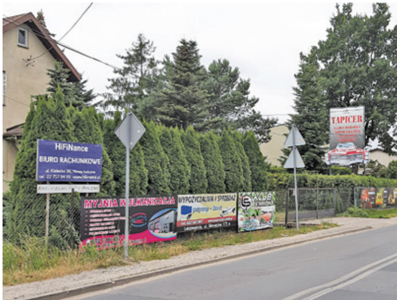
Uchwała krajobrazowa ma za zadanie okiełznać ilość i jakość reklam umieszczanych w przestrzeni publicznej