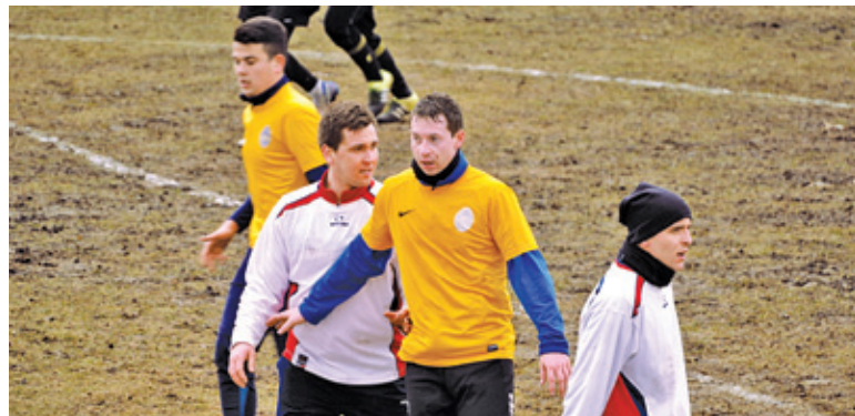
Mecz sparingowy Korony z KS Konstancin. Teraz obie drużyny zmierzą się ze sobą w lidze