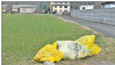
||| Lesznówola - Stawka za śmieci razy trzy s. 2