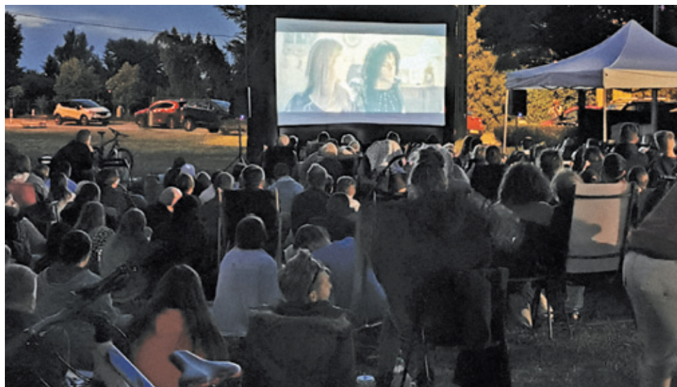
Letnie kino nad stawem w Mysiadle