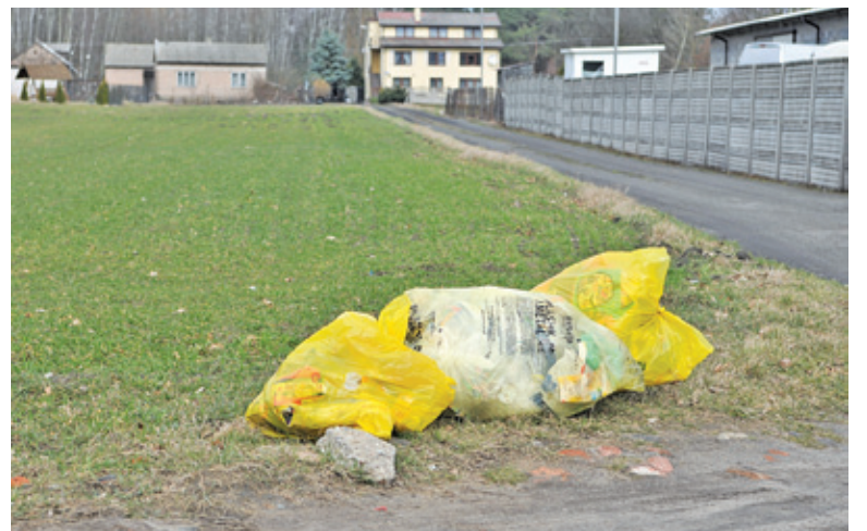
Zmienia się także zasady segregacji – przybywa frakcja odpadów kuchennych