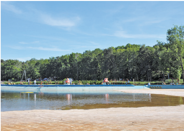
Jedyna odkryta pływalnia na terenie powiatu od wielu lat nie nadaje się do użytku