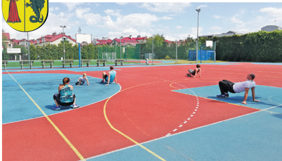
Trening funkcjonalny na stadionie w Nowej Iwicznej

ul. Gminna 60, tel. 22 708 91 11, www.lesznowola.pl