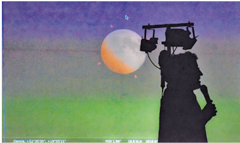
W zeszłym roku cykl tematycznych pociągów cieszył się dużym zainteresowaniem

– Polana w Runowie, dzięki położeniu z dala od siedzib ludzkich, jest doskonałym miejscem do obserwacji nieba ze względu na brak latarni w bezpośredniej okolicy. Nasza polana jest więc o wiele lepszym miejscem do obserwacji nieba niż miasto – informuje