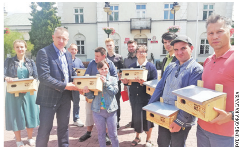
W piątek autorzy budek przekazali je burmistrzowi i dyrektorowi OSiR