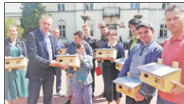
||| Góra Kalwaria - Jerzyki przeciwko komarom s. 5