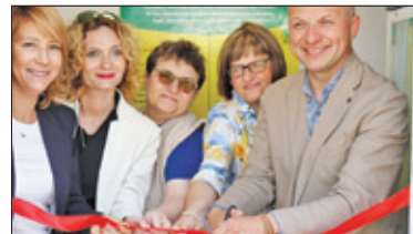
||| Piaseczno - Jadłodzielnia już działa s. 5