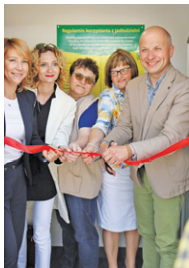
Reprezentanci gminy i pomysłodawcy uroczystie otworzyli jadłodzielnię

Oficjalne otwarcie jadłodzielni nastąpiło w ubiegły wtorek 9 lipca. Wzię-