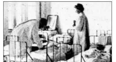
||| Historia - Zakład hrabiny Moriconi, cz. 2 s. 8