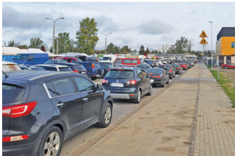
Rano najwlniej jechało się ulicą Żytnią