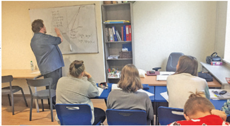
Lecząca się tu młodzież może równocześnie zaliczać szkolne przedmioty