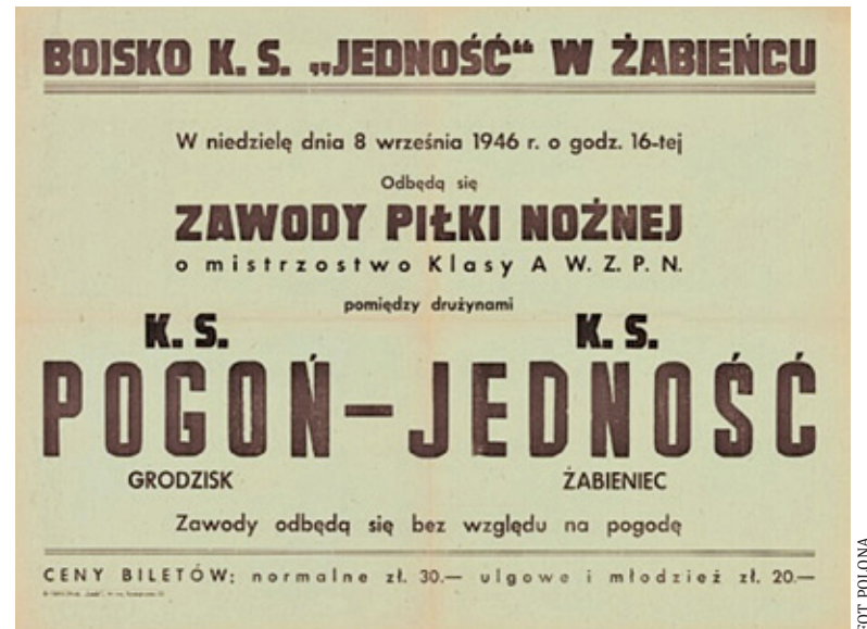
Plakat z meczu z 1946 r.

Ktoś przed 40 laty zachował na pamiętkę fragment gazety. Mam przed sobą ten fragment ze świetnymi ilustracjami, ale niestety nie wiem, jaki jest tytuł gazety, co przedstawiają zdjęcia, ani w którym roku została wydana. Fragment ten zawiera artykuł cenny dla historii gminy Piaseczno. Pomyślałam, że warto opisać jego treść i komu poświęcone są zdjęcia. Szczególnie chodzi tu o nazwiska bohaterów zdarzeń. Czekam na pracę detektywistyczną, bez pomocy Czytelników raczej mało efektywna. Sądząc po artykule o pierwszej rocznicy rewolucji w Afganistanie, zamieszczonym w tej gazecie, mamy rok 1979. Na boisku w Żabieńcu został wówczas rozegrany pierwszy mecz sezonu między LKS Mazur Karczew a LKS Jedność Żabieniec. Spraw organizacyjnych pił-