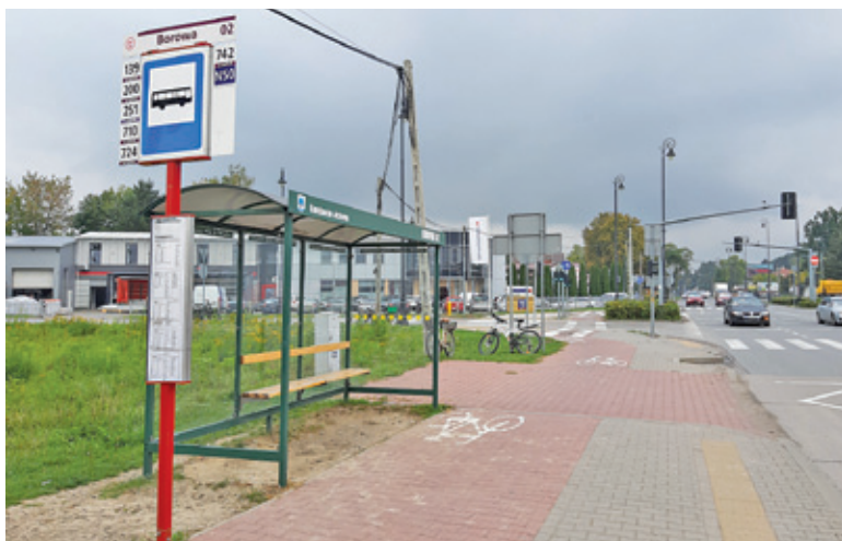
Przystanek przy ścieżce rowerowej zagraża bezpieczeństwu rowerzystów i pasażerów