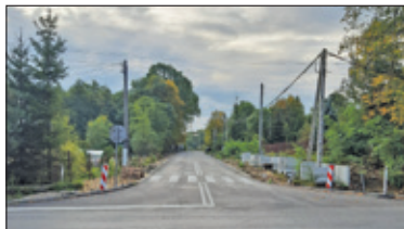
|| Głusków – Bez dotacji, zgodnie z planem s. 2

PIASECZNO || GÓRA KALWARIA || KONSTANCIN-JEZIORNA || LESZNOWOLA || PRAŻMÓW || TARCZYN