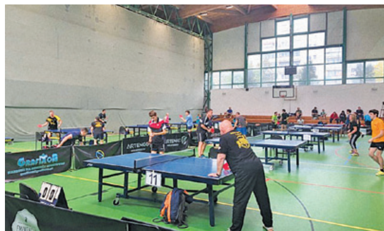
Zawody odbyły się w sali GOSiR przy ulicy Sikorskiego w Piasecznie