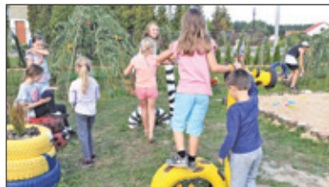
|| Cendrowice – Żywy plac zabaw s. 4