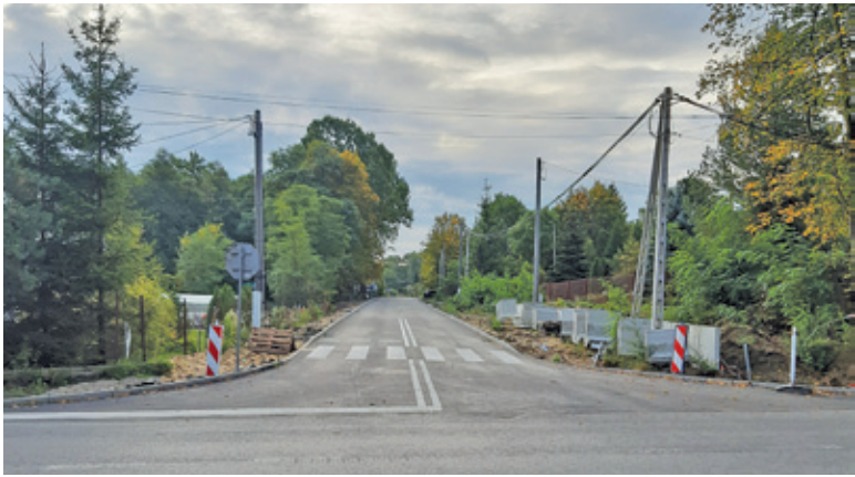
Ulica została już otwarta dla ruchu, mimo że wykonawca nie zakończył jeszcze prac budowlanych