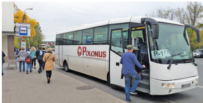
Autobusem gminnej komunikacji zastępczej nie ma szans jechać np. matką z wózkiem

Jak zawsze początki są trudne. Wszyscy musimy się oswoić z nową