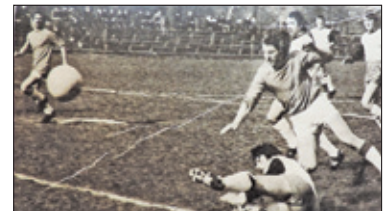
|| Historia – Świetliki, Kazubki i Stolarczykowie s. 11