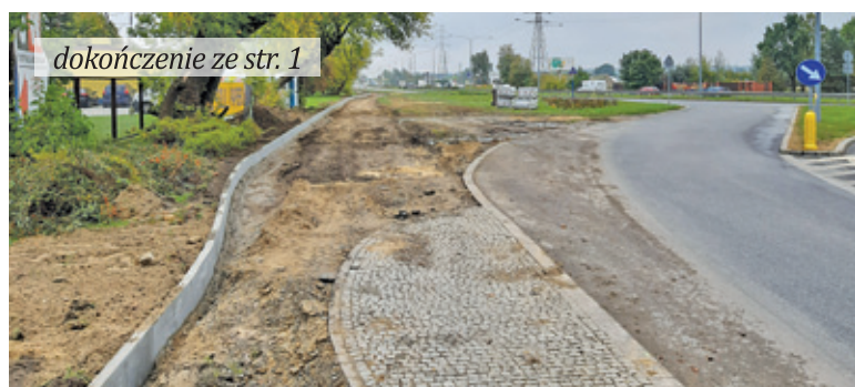
dokończenie ze str. 1