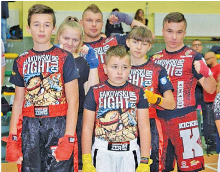
Zawodnicy ekipy Bąkowski Fight Club