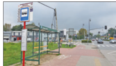
|| Konstancin-Jeziorna – Pod dachem, ale w błocie s. 6