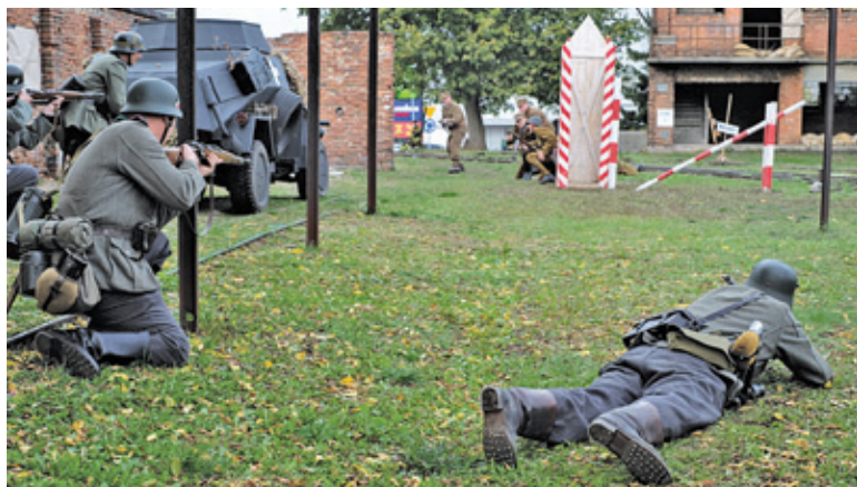
Rekonstruktorzy odegrali atak wojsk niemieckich na granicę Polski z 1 września 1939 roku

W niedzielę 29 września, na stacji kolejki wąskotorowej, ponad 70 rekonstruktorów wzięło udział w odtworzeniu wydarzeń z okresu II wojny