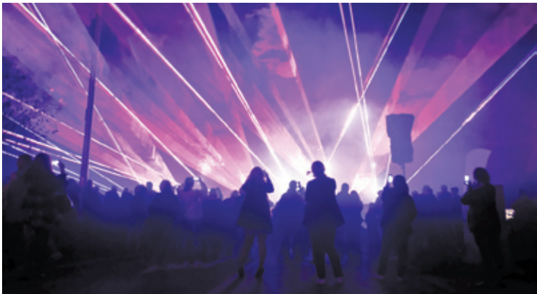
Pokaz laserów do muzyki filmowej