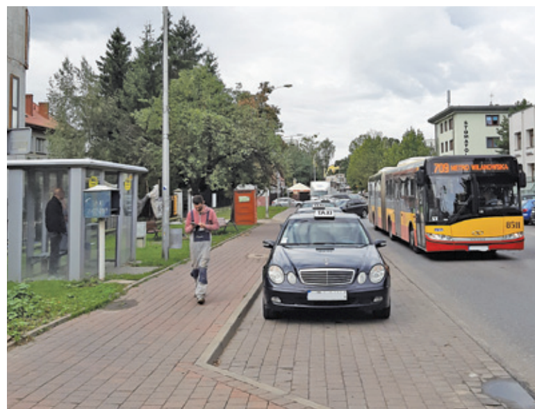
Dotychczasowy postój zamieni się w przystanek autobusowy