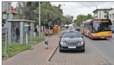
|| Piaseczno – Nieoczekiwana zmiana miejsc s. 5