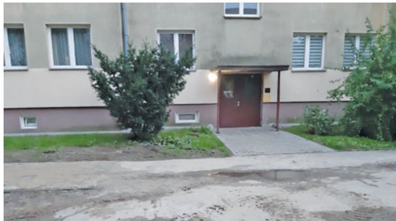
Chodnik kończy się przy pierwszej klatce, ale w przyszłości ma zostać przedłużony dla całego bloku