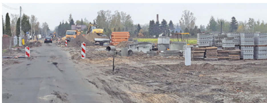
Roboty budowlane w Wólce Kosowskiej, stan na 29.10.2019 r.