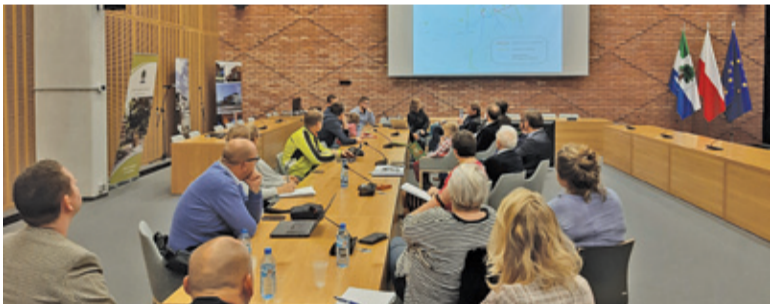
Rowerzyści przekonywali, że poprawa bezpieczeństwa skłoni do korzystania z rowerów znacznie większą grupę mieszkańców