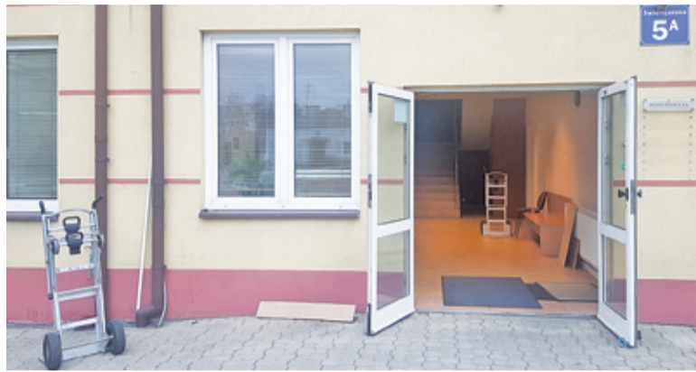
Nie ma jeszcze tabliczek informujących o tym, jakie mieszczą się tu wydziały, ale urzędnicy już pracują

Obiekt, który ma 1512 m 2 powierzchni, został wynajęty na czas nieokreślony z rocznym okresem wypowiedzenia. – Mimo że jest o pięćdziesiąt procent większy od dotychczasowej powierzchni najmu w biurcu przy