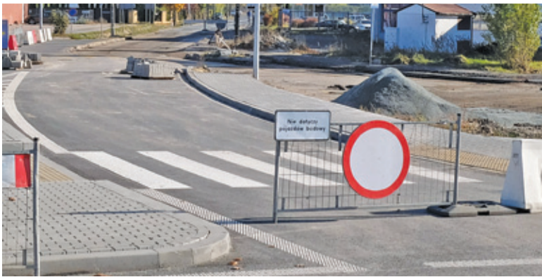
Utrudnienia dla kierowców potrwać co najmniej do końca roku