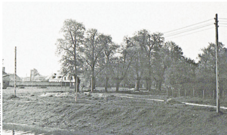
Fragment parku chylickowskiego z Balatonem i ratuszem w tle