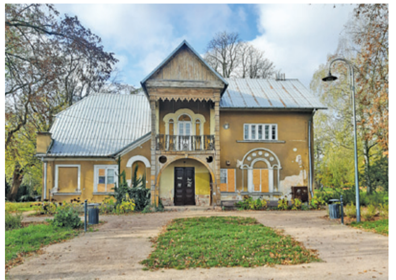
Ławki ze skweru na tyłach Poniatówki zniknęły po ostatniej dewastacji budynku

Kilka dni temu na zabytkowym dworku pojawiły się w kilku miejscach