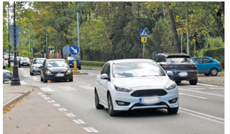
Światła miałyby poprawić przede wszystkim bezpieczeństwo pieszych, ale też ułatwić włączanie się do ruchu pojazdów z ulic podporządkowanych