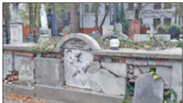
|| Piaseczno - Kolejne groby do renowacji s. 2