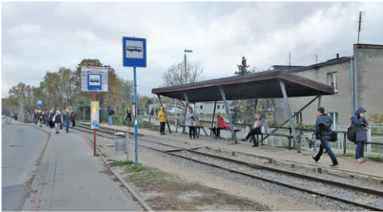
Na przystanku zatrzymuje się kilka linii lokalnych, 727 oraz linie PKS