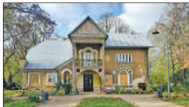
|| Piaseczno - Poniatówka pod większym nadzorem s. 5