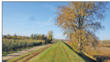
|| Góra Kalwaria - Wyremontowali wał s. 4