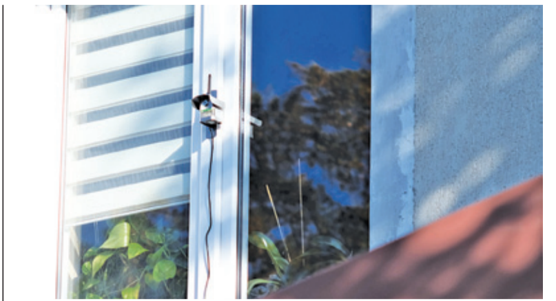
Czujnik na budynku Cechu Rzemiosł Różnych

WYDAWCA: MIKAWAS SP. Z O.O. ADRES REDAKCJI: ul. Sierakowskiego 12a (przy skwerze Kisiela), 05-500 Piaseczno REDAKTOR NACZELNA: Agnieszka Zofia Piechowska, z.piechowska@przegladpiaseczynski.pl, tel. 731 163 646 REDAKCJA: redakcja@przegladpiaseczynski.pl; Joanna Ferlian, j.ferlian@przegladpiaseczynski.pl; Hubert Gieleciński, h.gielecinski@przegladpiaseczynski.pl, Karolina Hofman, k.hofman@przegladpiaseczynski.pl WSPÓŁPRACUJĄ: Małgorzata Szturomska, Rafał Lipski ILUSTRACJE: Katarzyna „Wawryko” Wawrykiewicz OPRACOWANIE GRAFICZNE/ŁAMANIE: Małgorzata Kulesza