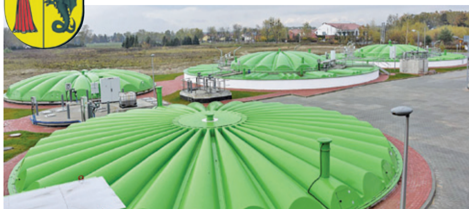
Oczyszczalnia po rozbudowie

ul. Gminna 60, tel. 22 708 91 11, www.lesznowola.pl