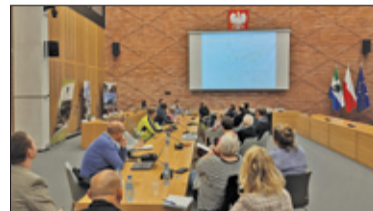
|| Konstancin-Jeziorna - Ścieżki najpierw na papierze s. 6