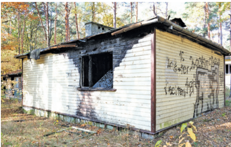
Domki stanowią zagrożenie pożarowe