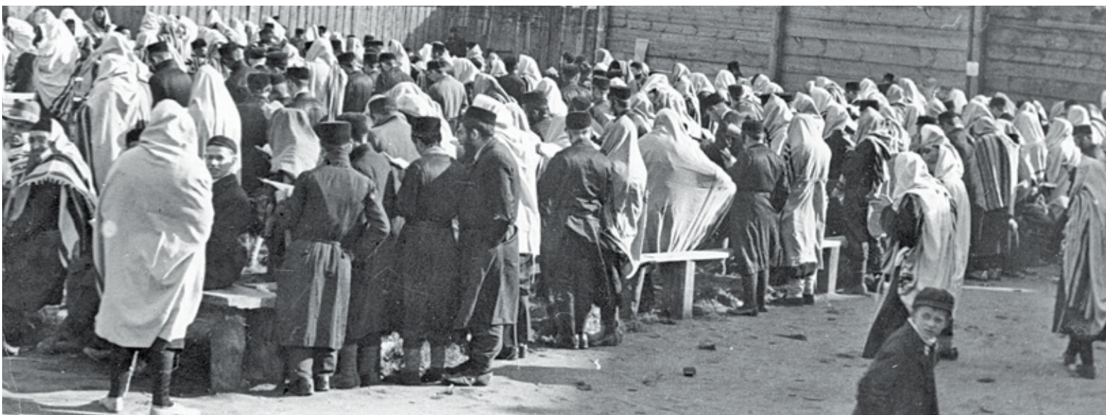
Uroczystości w domu cadyka w Górze Kalwarii