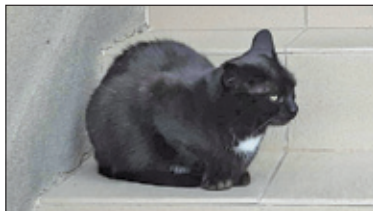
|| Piaseczno – Gdzie jest Zdzisława? s. 2