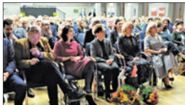
|| Góra Kalwaria – Urodziny miasta s. 5