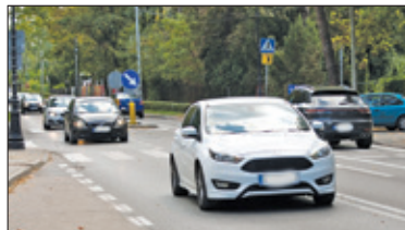
|| Konstancin-Jeziorna – Światła – to skomplikowane s. 3