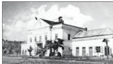
|| Historia – Przypadki z Góry Kalwarii s. 6