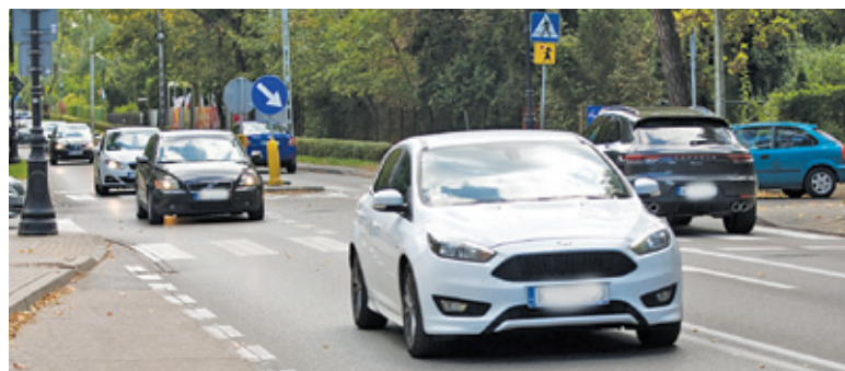
Przez to skrzyżowanie przejeżdża ponad 16 tys. samochodów na dobę

Marszałek województwa podobno jest za, pieniądze to też nie problem, ale jak informuje burmistrz, gmina może mieć trudność ze spełnieniem tajemniczych oczekiwań. Chodzi o sygnalizację na skrzyżowaniu ulic Wilanowskiej i Mickiewicza.