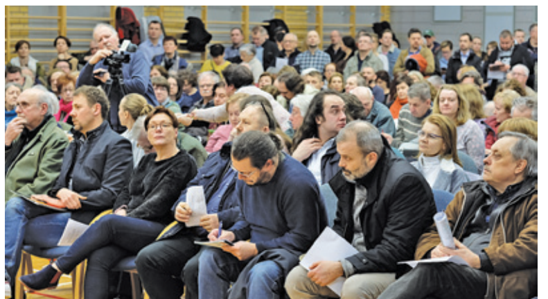
Na spotkanie w Zalesiu Górnym przyszło kilkuset mieszkańców