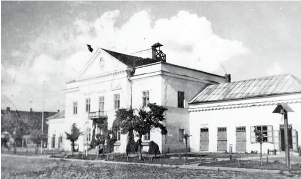
Gmach urzędu burmistrza w Górze Kalwarii w roku 1940

Chasydzi z Góry Kalwarii wnosili w życie miasta niepowtarzalny koloryt, ale zarazem ich zwyczaj, jak sądzę, nie były do końca zrozumiałe dla mieszkańców spoza kręgu chasydzkiego. Uważam, że tylko człowiek ciekawy ludzi, ciekawy świata, wychowany w szacunku dla osób o innych poglądach, jest w stanie analizować i rozumieć to, z czym się spotyka w domu sąsiada. Chasydyzm jest częścią polskiej kultury i warto o tym pamiętać choćby po to, by zrozumieć przeszłość. Góra Kalwaria to miasto o zdumiewająco bogatej i złożonej historii. Oto mała wioska Góra staje się miastem pełnym kościołów i kapliczek a w chwilę później ośrodkiem chasydyzmu z rabinami mającymi rzesze wyznawców w kraju i za granicą. W tym tekście skupiłam się na chasydach z Góry Kalwarii na podstawie informacji znalezionych w czasopiśmie z dekadencjonalnych lat 30. XX w. Wszystkie tu opisane zdarzenia są prawdziwe.