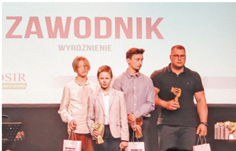
Statuetki otrzymali przedstawiciele różnych dyscyplin sportu

– Śmiało możemy powiedzieć, że Gmina Piaseczno jest gminą sportową. Nie tylko ze względu na nakłady i infrastrukturę sportową, ale również ze względu na działalność naszych klubów sportowych, indywidualne sukcesy zawodników i trenerów – powiedziała