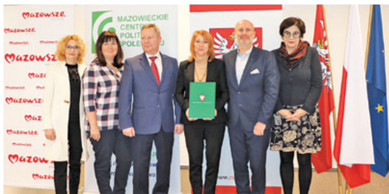
Umowę na realizację programu pilotażowego podpisano 28 lutego