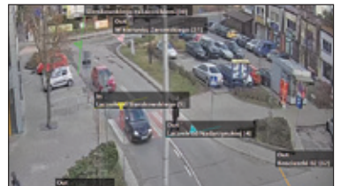
|| Piaseczno – Koniec driftów na parkingu? s. 8