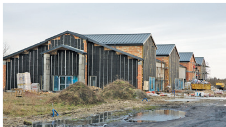
W nowej placówce będzie 8 oddziałów przedszkolnych