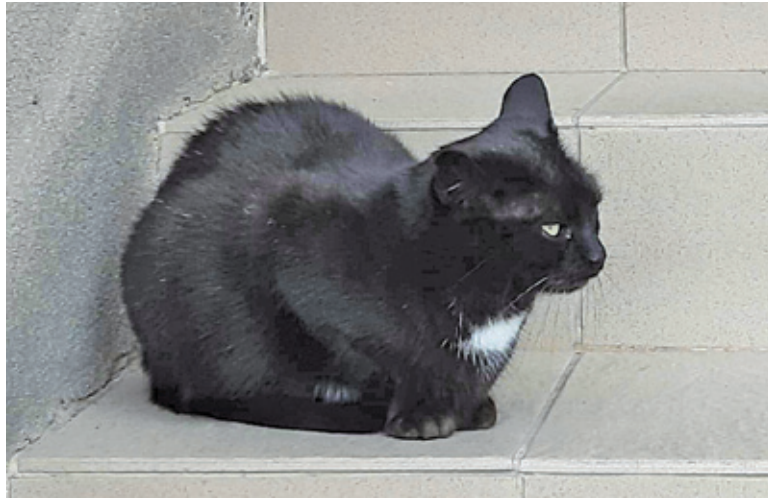
Kocięgo bywalca urzędu darzyli sympatią pracownicy i mieszkańcy gminy

– Powiesiliśmy przy wejściu taki komunikat, by miłośnicy kotów nam jej nie zabierali, uważając ją za bezdomną lub zaginioną – napisał w połowie stycznia na swoim profilu na Facebooku, publikując zdjęcie kota. Po tej publikacji „Zdzisława” stała się sławna na całą Polskę, bo informacja o piaseczyńskim czworonogu pojawiła się na wielu portalach internetowych. Jakiś czas później przed samymi drzwiami