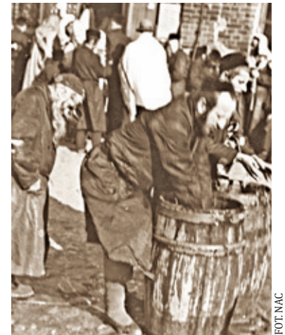
Rytualne obmywanie rąk

pobożnym pielgrzymom bilety na dostąpienie owych trzech łask, z tym, że za ujrzenie cadyka pobierali 5 złotych, za „siulim” 10 złotych, za „szoraim” zaś 15 złotych. Tym, którzy dziwili się pobieraniu opłat, kombinatory wyjaśniali, że pójda one na odnowienie domu reb Altera. Interes szedł znakomicie... Niestety jednak „kant” wydał się zbyt wcześnie. Zbitych i poturbowanych tłum powłócił przed szamesa, wytaczając przed nim swe żale. Szames, w zastępstwie reb Altera, wysłuchał skarg i polecił obu