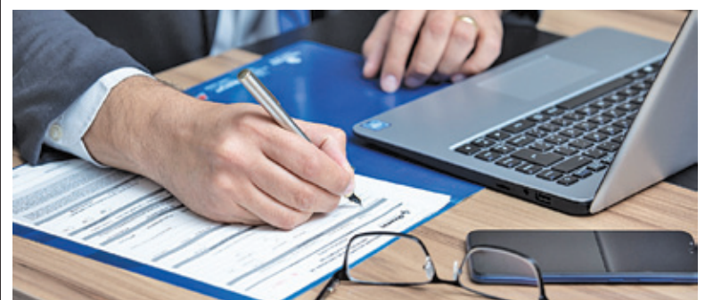
Obowiązek zapewnienia dostępu do bezpłatnej pomocy prawnej spoczywa na Powiecie

kańców zajmuje się Powiat. To jedno z odelegowanych do niego zadań. Z pomocy tej mogą skorzystać tylko osoby, które złożą oświadczenie, że nie są w stanie pokryć kosztów odpłatnej pomocy prawnej.