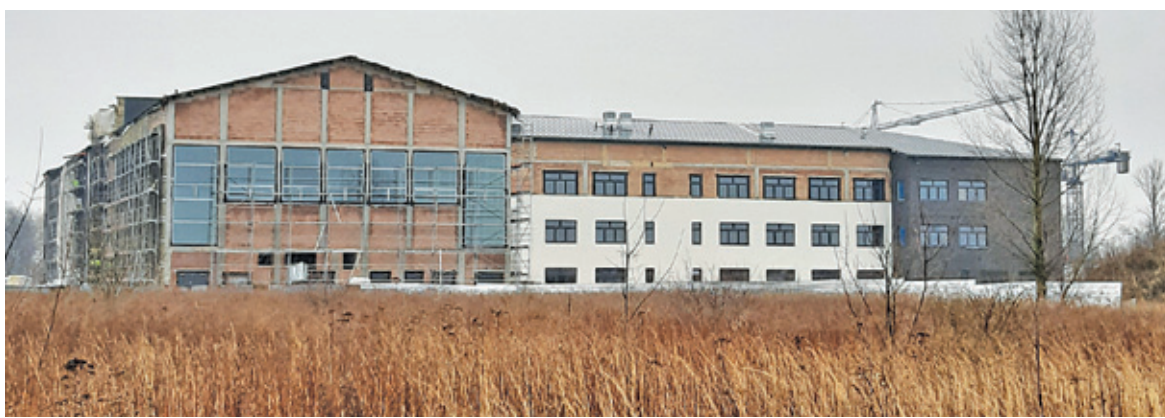
Nauka w szkole podstawowej w Zamieniu ma się rozpocząć od września 2020 r.

uczniowie z filii w Zgorzale mają zostać przeniesieni do szkoły w Zamieniu. Nie wykluczone więc, że rekrutacja ograniczy się do przeniesienia tych uczniów.