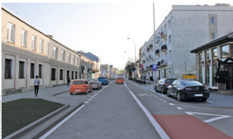
Fragment pasa rowerowego będzie przedłużony na całą długość ul. Kościuszki

Pas rowerowy miałby zaczynać się na wysokości ulicy Kusocińskiego i zapewnić bezpieczny przejazd aż do istniejącej ścieżki rowerowej przy cmentarzu parafialnym w Piasecznie. W przeciwnym kierunku ścieżka będzie poprowadzona przez ul. Wschodnią i dalej Kilińskiego, Sierakowskiego, Warszawską do Placu Piłsudskiego. Dalej w kierunku północnym ścieżka ma być