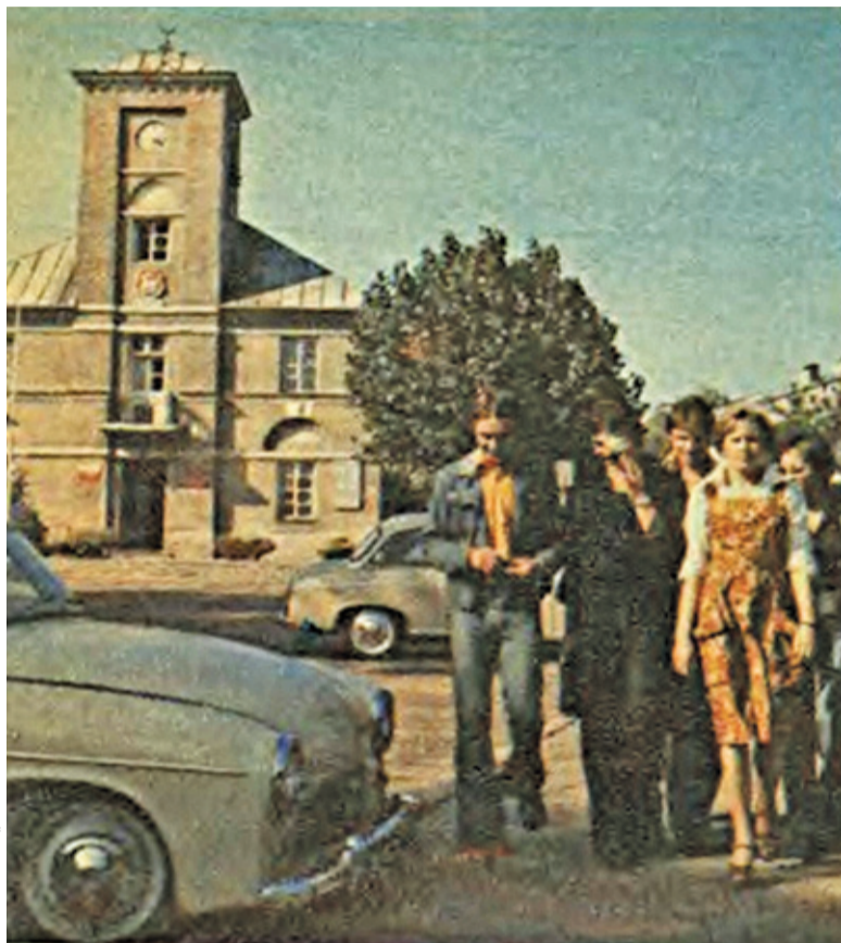
Rynek w Piasecznie lata 70.