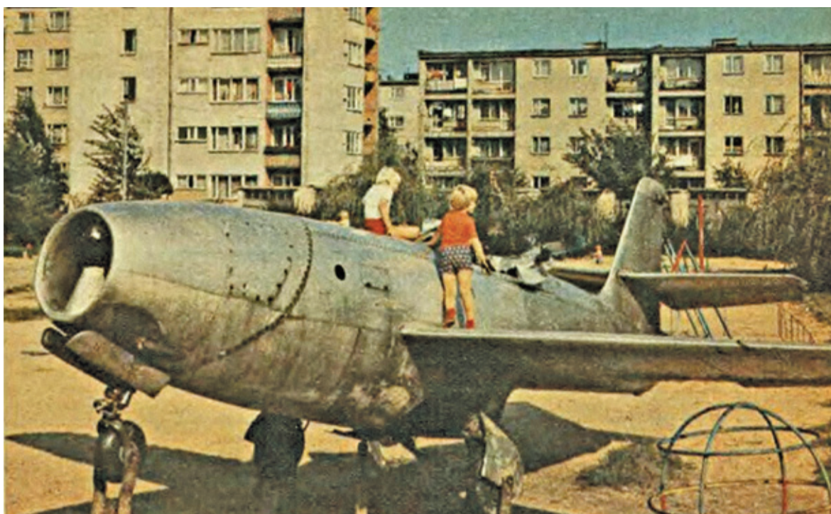
Fragment spółdzielczego osiedla mieszkaniowego w Piasecznie w latach 70.

Burzono domy nie tylko te będące w obrębie planowanej drogi, ale też te w „drugiej strefie”, czyli domy szpecące swym wyglądem krajobraz; wyburzano głównie parterowe drewniaki. Mieszkańcy tychże domów, ku swojej radości, dostawali mieszkania w blokach np. przy ul. Wilanowskiej czy na Ursynowie. Jeśli drewniak zamieszkiwała rodzina składająca się z zamężnych dzieci i starszych rodziców bytujących na 60 m 2 , przydzielano im mieszkania osobne dla każdej rodziny. Nowoczesne, z łazienkami i widnymi już kuchniami. Dla wysiedlonych z obszaru ul. Puławskiej towarzyszył Gierek dał preferencje. Kończyła się epoka ciemnych, gomułkowskich kłitek. Mój kuzyn z Pyr, mieszkający tuż obok restauracji Baszta (najlepsza na świecie kaczka pieczona z jabłkami), na działce, gdzie królowały bzy i jaśminy, dostał na trzyosobową rodzinę, wygodne 3-pokojowe mieszkanie na 14. piętrze. Mieszkało się w tym lokalu jak w samolocie, za to był balkon, widok na całą stolicę, dwie łazienki, jedna z ubikacją, druga z wanną.