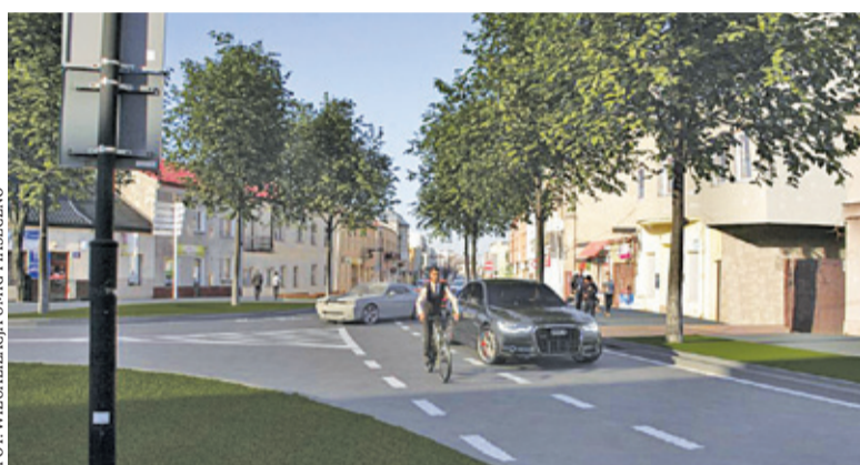
Wariant A gwarantuje więcej zieleni przy głównej ulicy miasta