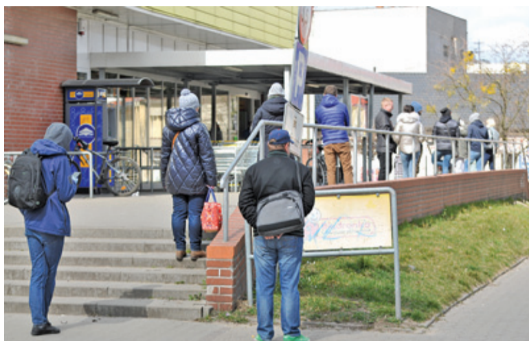
Na wejście do supermarketu zwykle trzeba trochę poczekać. Najmniejsze kolejki są tuż po otwarciu lub niedługo przed zamknięciem

Obowiązujące od 1 kwietnia przepisy ograniczające liczbę klientów przebywających jednocześnie w sklepie do 3 osób na jedno stanowisko kasowe spowodowały pojawienie się sporych kolejek przed sklepami. Do tego dochodzi wyłączenie z powszechnej dostępności dwóch godzin (10.00-12.00) dedykowanych seniorom. Klienci w większości stosują się do narzuconych regulacji, stoją w obowiązującej odległości 2 metrów od siebie i czekają na swoją kolej. Aby ułatwić zakupy swoim klientom, sklepy między innymi wydłużyły godziny obsługi. Sieć Auchan pracuje w godzinach od 6.30 do 21.00 we wszystkie dni tygodnia. Biedronki są otwarte w godzinach 6.00-24.00, ale w tygodniu przedświątecznym aż do piątku będą pracować całodobowo. W godzinach od 6.00 do 24.00 zakupy zrobimy w Lidlu w Konstancinie-Jeziornie. Sklep w Piasecznie od 6 kwietnia działa całodobowo. Od 3 kwietnia w godzinach 6.00-24.00 otwarty jest również Kaufland. Selgros z kolei jest otwarty od poniedziałku do piątku w godzinach 4.00-22.00, w piątek i sobotę zakupy zrobimy do 22.00, a w handlowe niedziele w godzinach 8.00-20.00. W sobotę 11 kwietnia wszystkie sklepy tych sieci będą czynne do godziny 13.00.