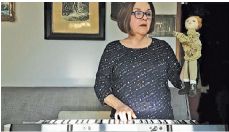
CK w Piasecznie oferuje m.in. zajęcia muzyczne dla dzieci

Na Facebooku działa również GOK w Lesznowoli. Mieszkańcy znajdą tam między innymi lekcje z rysunku, warsztaty plastyczne czy kąci czytania bajek. Specjalną platformę mają też uczest-