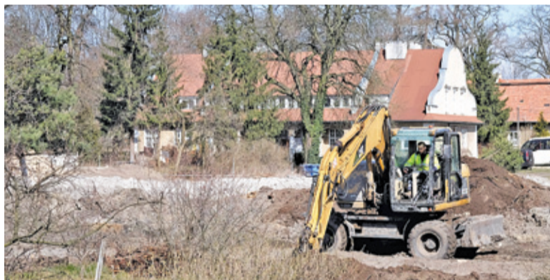
Prace w piaseczyńskim parku na razie nie zwalniają tempa

W związku w pandemię koronawirusa prezydent stolicy Rafał Trzaskowski zaproponował radykalne cięcia wydatków w Warszawie. Wstrzymane będą wszystkie nowe przetargi na realizację inwestycji. Jednocześnie stolica ma wycofać się z tych, które można jeszcze zatrzymać. Wstrzymana ma też być większość remontów i modernizacji dróg. Zakazane będzie uzupełnianie etatów po pracownikach odchodzących na emeryturę i zawieranie nowych umów o pracę. Będzie obowiązywał nawet zakaz rozmów o podwyżkach.