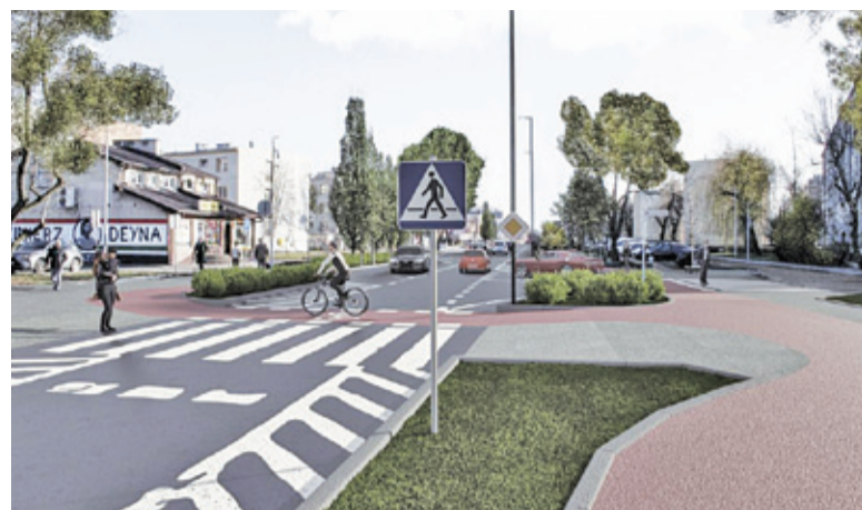
Bezpieczna droga rowerowa ma bieć od ul. Okulickiego do istniejącej drogi obok cmentarza parafialnego

Niezależnie od wariantu, globalnie liczba miejsc parkingowych się zmniejszy. Zrekompensować ma to rozszerze-