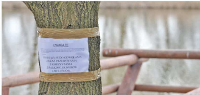
Zakaz wstępu obowiązuje między innymi na Górkach Szymona

Policja zapowiedziała restrykcyjne kontrole i „zero pobjazania”. Repertuar kar jest niemały. Oprócz mandatu o wysokości do 500 złotych, stróżowie prawa mogą też skierować wniosek o ukaranie do sądu. Kary administracyjne