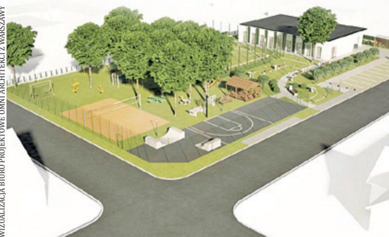
WIZUALIZACJA BIURO PROJEKTOWE ONNI ARCHITEKCI Z WARSZAWY

– Nowoczesna bryła budynku w przyszłości ma pełnić funkcję placówki wsparcia dziennego, a w założeniu budynek świetlicy ma służyć mieszkańcom Głoscowa-Letnisko – informuje Urząd Gminy Piaseczno. Wewnątrz zaprojektowano trzy sale po około 60 m 2 każda, w tym jedna dedykowana seniorom, sala do zajęć sportowo-ruchowych i sala na warsztaty.