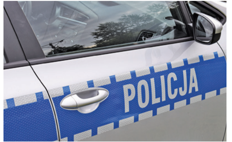
W czasie epidemii policjantom doszły nowe obowiązki

CBOS bada cyklicznie, dwa razy w roku – w marcu i wrześniu, opinie dorosłych Polaków na temat działalności różnych instytucji publicznych, w tym prezydenta, parlamentu, władz samorządowych, sądu, ZUS, NBP a nawet kościoła rzymskokatolickiego. Najnowsze, opublikowane pod koniec marca wyniki dały policji zdecydowane zwycięstwo w rankingu już po raz czwarty z rzędu. Wynik z marca 2020 roku jest najwyższy w dotychczasowej historii prowadzonych od 1990 r. badań. Działania policji dobrze oceniło 80% ankietowanych. Źle ocenia je tylko 11%, w przypadku 9% odpowiedź brzmiała: trudno powiedzieć. Policja pokonała drugie w kolejności władze samorządowe, ocenione dobrze przez 74% ankietowanych, oraz wojsko – 72% ocen pozytywnych. W pierwszej piątce znalazły się jeszcze NBP (59%) i prezydent (58%). Wyjątkowo źle oceniane są z kolei instytucje związane z wymiarem sprawiedliwości – działalność sądów dobrze ocenia zaledwie