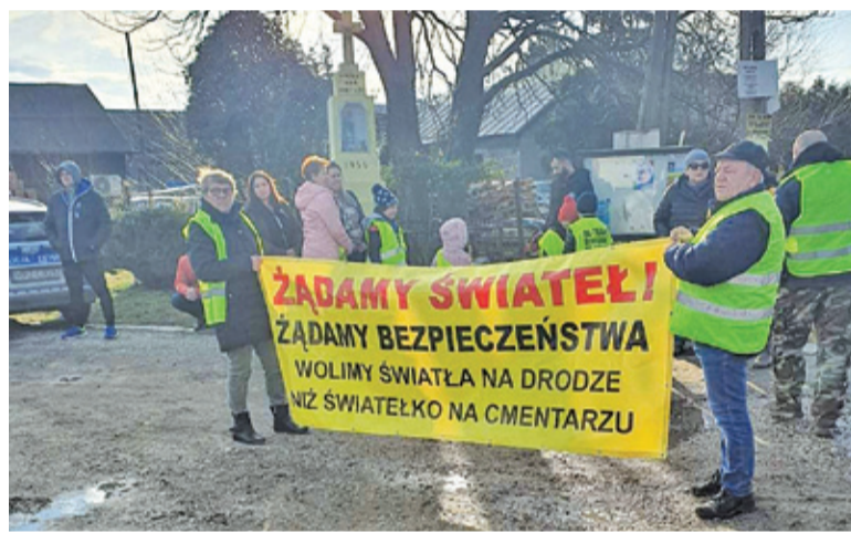
Lokalna społeczność włączyła się w walkę o poprawę bezpieczeństwa

Stefanowie fabryka firmy Kamis, której właścicielem jest spółka McCormick. Przekazał samorządowi na ten cel 100 tys. złotych. Podczas marcowej sesji