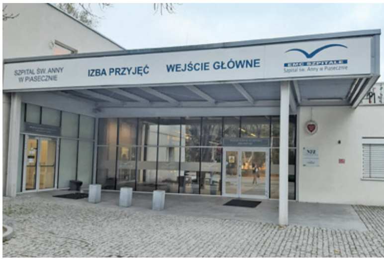
W szpitalu kwarantanną były objęte 4 oddziały