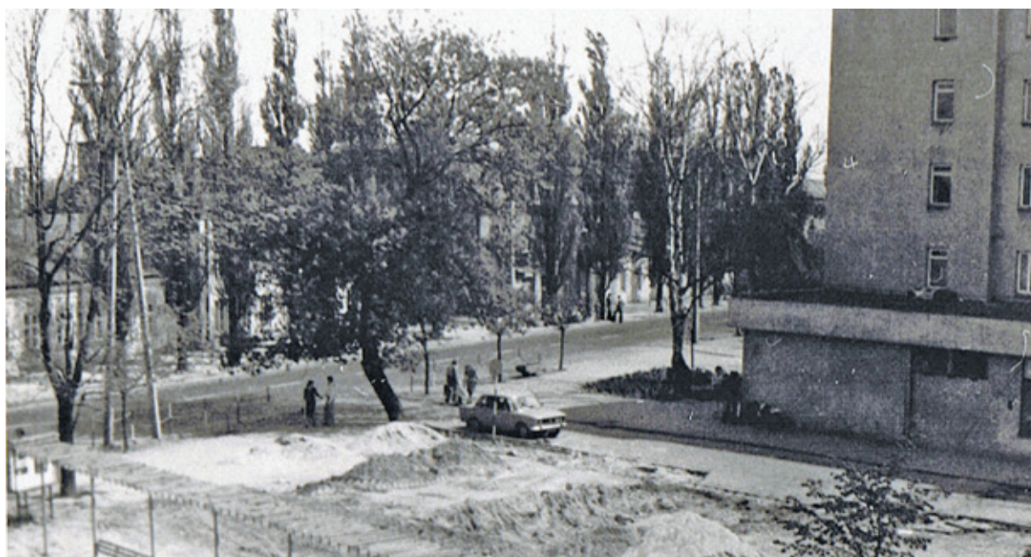
Ulica Puławska w roku 1978

Odległość od Piaseczna do Warszawy na początku lat 70. pokonywaliśmy wąską szosą ulicy Puławskiej, wzdłuż której biegły tory kolejki wąskotorowej. W połowie dekady rozpoczęto budowę nowoczesnej arterii, powstały szerokie dwie jednokierunkowe jezdnie z przewidzianą możliwością ruchu trolejbusów. Budowa nowej drogi do Warszawy zmiotła z powierzchni ziemi domy stojące blisko szos, zmieniając całkowicie krajobraz ul. Puławskiej.