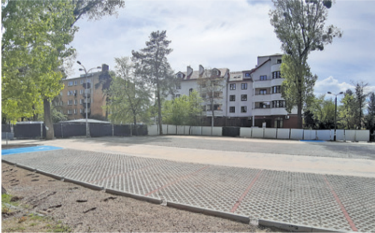
Prace budowlane trwały kilka tygodni