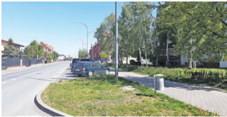
Ścieżka rowerowa ma być wytyczona po wschodniej stronie drogi. Częściowo będzie oddzielona od chodnika pasem zieleni