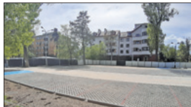
|| Konstancin-Jeziorna – Parking prawie gotowy s. 2