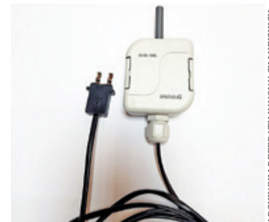
Czujnik Inels AirIM 100, właśnie takie urządzenia zostaną zamontowane

kroczeniu określonego stanu w danym miejscu. Informacje będą przekazywane do powstającego stanowiska dyspozytorskiego w Urzędzie Miasta i Gminy Piaseczno, gdzie będą zbierane wszystkie zgłoszenia. Dyspozytor będzie decydował o ewentualnym dalszym przekazaniu informacji do stosownych służb