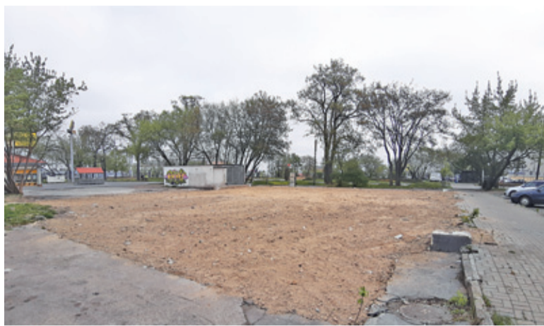
Działka inwestora obejmuje teren po dawnym sklepie wraz z otoczeniem

Przy okazji wyburzania marketu Tesco u zbiegu ulic Puławskiej i Kusocińskiego pojawiła się informacja, że w miejscu tym powstanie budynek wielorodzinny. Ustaliliśmy, co i kiedy może w tym miejscu zostać zbudowane.