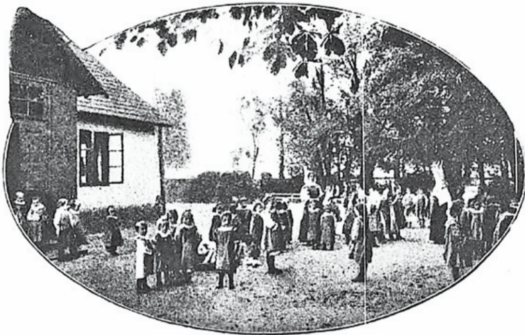
Zdjęcie z czasopisma Lechita z 1908 r. Na zdjęciu budynek ochronki, wskazujący swoim wyglądem na budowlę z XIX w. dziś już nieistniejący, też wart analiz. Stał obok Poniatówki