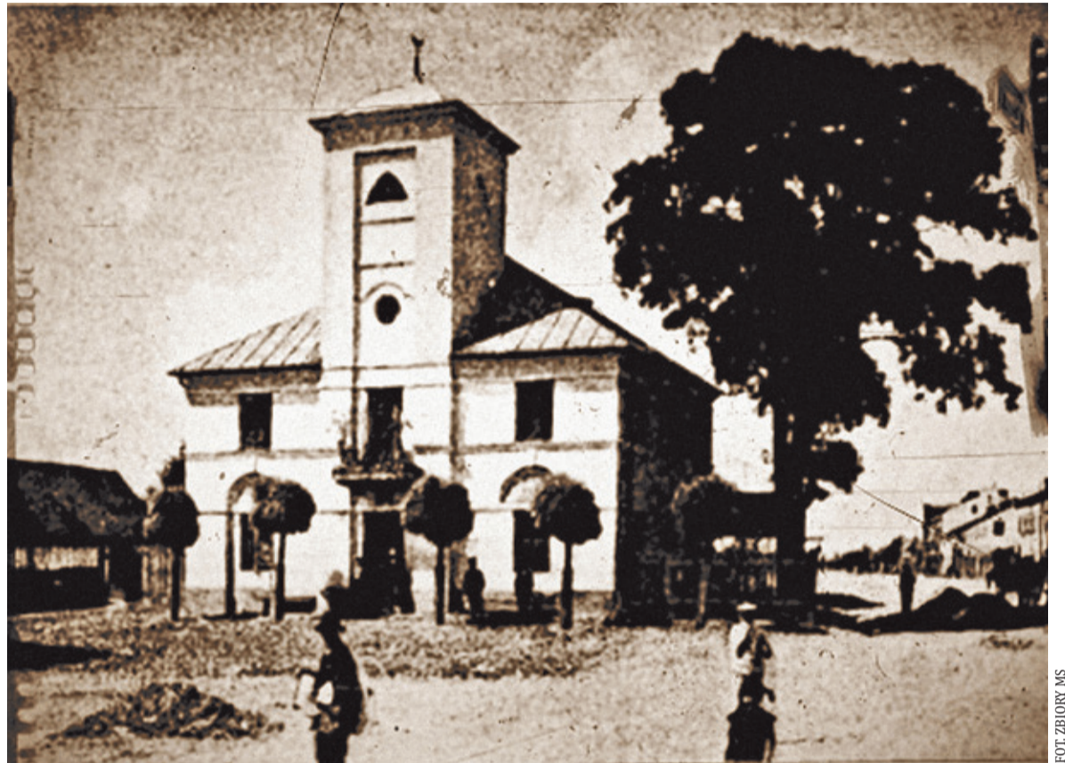
Ratusz w Piasecznie, gdyby nie to zdjęcie nie wiedzielibyśmy jak wyglądał ratusz w XIX w. W czasie remontu w latach 20. XX w. zmieniono wygląd elewacji

I tak zastanawiając się nad zagubionymi gdzieś w pożogach dziejowych i niedbalstwie miejscowej „elity” w wieku XIX historii miasta, natrafiłam na opis pewnej podróży odbytej w 1850 r., która wiele wyjaśnia.