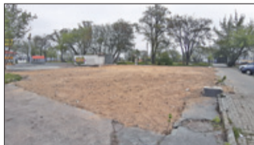
|| Piaseczno – Blok zamiast Tesco s. 4