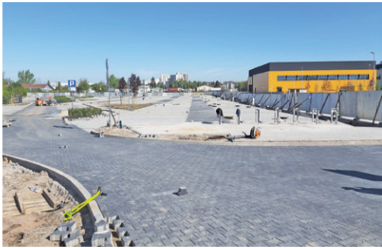
Najważniejsze prace budowlane na południowej części zostały już wykonane

nowano miejsca parkingowe, których w sumie do obsługi targowiska ma być 95, w tym 6 dla osób niepełnosprawnych. Na rowerzystów czekać będą 32 miejsca postojowe. Dla handlujących przewidziano 254 stanowiska, nieco mniej niż jest obecnie. Niewielki budynek administracyjny powstanie w zabudowie kontenerowej. Projekt zakłada również nasadzenia, w tym utworzenie niewielkiego skweru, oraz montaż oświetlenia. Teren targowiska miejskiego to jeden z elementów rewitalizacji całego obszaru między dworcem kolejowym, osiedlem Słowicza a torami kolejowymi. Gmina wprawdzie ze względu na bardzo wysokie koszty zrezygnowała ze specjalnego zadania terenu i przygotowania go