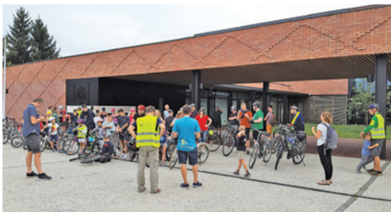
Mieszkańcy od dawna upominają się o udział w projektowaniu infrastruktury rowerowej