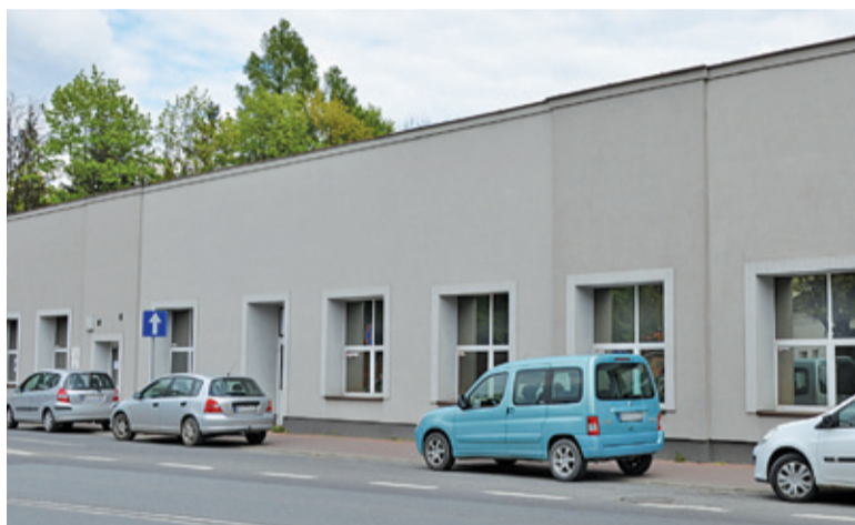
Budynek dawnej Wisetki przy Piarskiej 40

– Dzięki temu babcie i dziadkowie opiekujących się wnuczętami, będą mogli spotkać się przy herbacie, porozmawiać czy wziąć udział w zajęciach. W większej sali zostanie zamontowanych na ścianach kilka drabinek do ćwiczeń, powstanie tu także niewielka scena z wyposażeniem multimedialnym. Spotkanie autorskie, warsztaty artystyczne, kameralnych koncert czy potańcówka – to wszystko będzie w tym miejscu możliwe – informuje Piotr Chmielewski, rzecznik burmistrza. – Gminie, a dokładniej Ośrodkowi Pomocy Społecznej w jej imieniu, udało się pozyskać 150 tys. zł z programu rządowego Senior+. Była to już ostatnia szansa na zdobycie środków na zakładanie klubów