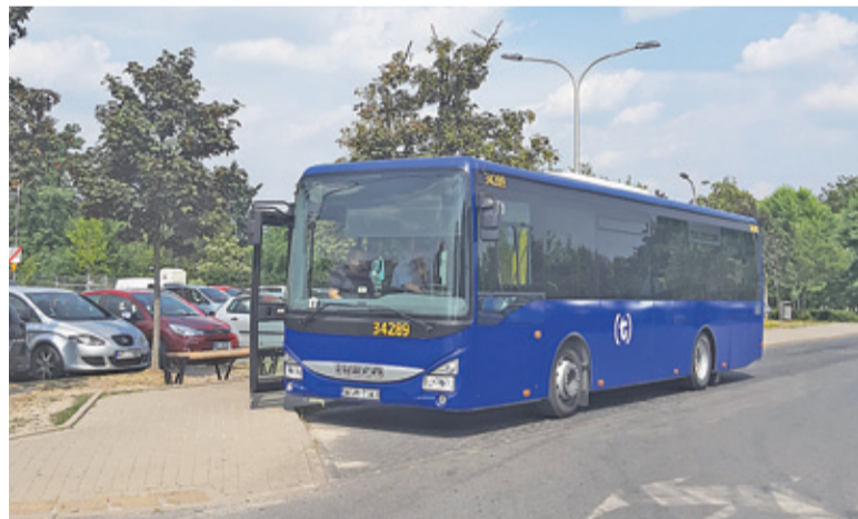
Linie L17 i L19 łączą Prażmów z Piasecznem

Od 11 maja zmiany uległy trasy linii L17 i L19. Linia L17 czasowo zmienia trasę przez Łoś, a zawieszona zostaje połączenie Zadębie – Pieczyska. Urząd Gminy Prażmów podkreśla, że ma to związek z brakiem współfinansowania ze strony gminy Chynów, małą liczbą podróży oraz brakiem pętli autobusowej w Zadębii.