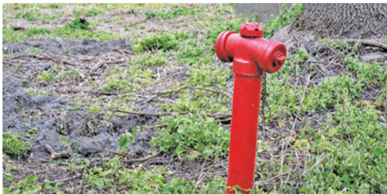
Samowolny pobór wody z hydrantu jest czynem zabronionym i podlega karze