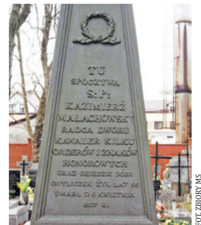
Obelisk na grobie Kazimierza Małachowskiego dziedzica Chyliczek. Wiemy o Małachowskich niezwykle mało

Okazało się, że tym, co jeszcze zostało z ksiąg Piotrowskiego, był pamiętnik, niebywale cenny, opisujący życie dworzan za czasów głównie Stanisława Augusta Poniatowskiego. Manuskrypty