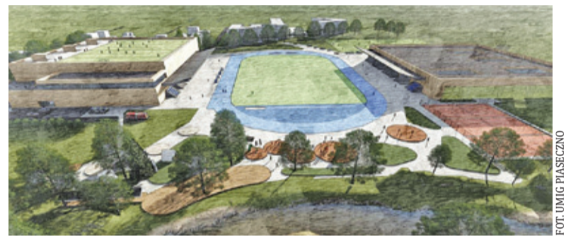
Studenci przygotowali 19 różnych projektów budowy hali oraz zagospodarowania terenu

Studenci przygotowali swoje projekty w ramach trwającej od kilku lat