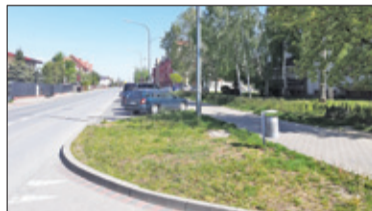
|| Piaseczno – Kolejna ścieżka w mieście s. 3