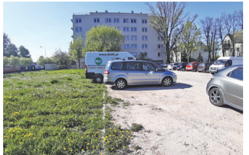
Parking zostanie powiększony o pas zieleni od strony ul. Wojska Polskiego

Istniejący, utwardzony kruszywem parking ma zostać powiększony o fragment działki od strony ulicy Wojska Polskiego. Całość zostanie utwardzo-