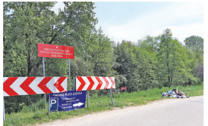
Śmietnisko stworzone na terenie chronionym przyrodniczo, w sąsiedztwie rezerwatu przyrody

Jak zawsze w takiej sytuacji pojawia się pytanie, czy osoby, które przywożą pełne worki węgla, chipsów oraz butelki z napojami nie mogły zabrać pustych opakowań ze sobą i wyrzucić do własnego czy nawet najbliższego pub-