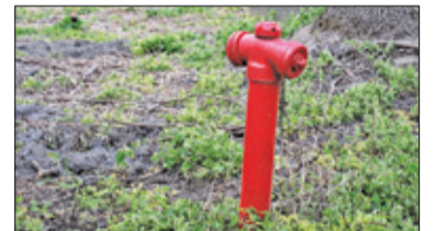
|| Góra Kalwaria – Kradną wodę z hydrantów s. 8