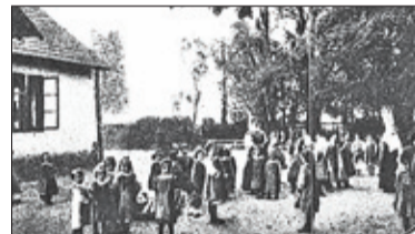
|| Historia – Rękopis znaleziony w Piasecznie s. 7