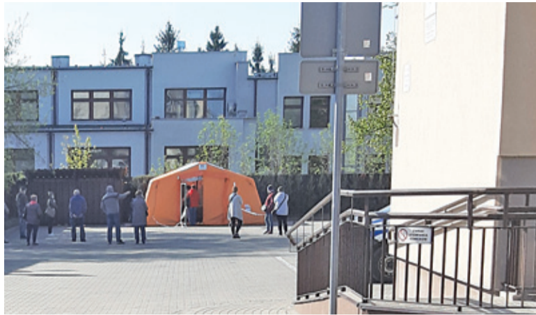
W ciągu trzech tygodni wykonano ponad 900 testów

Podwyższenie wartości jest spowodowane wzrostem cen za jednorazowe, specjalistyczne środki ochrony osobistej oraz materiały do badań – mówi