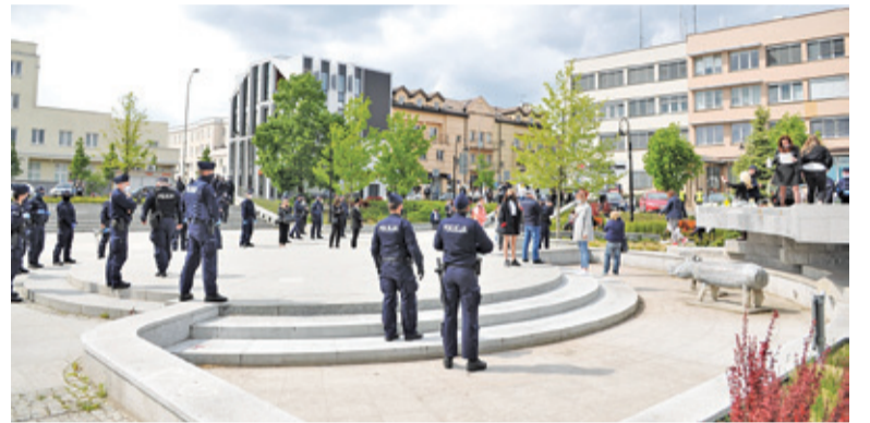
Na Skwerze Kisiela pojawiła się głównie młodzież. Siły policyjne znacząco przekraczały liczbę uczestników manifestacji

Policjantów widać było w sumie kilkudziesięciu. Kilka grup czekało w niewielkiej odległości na wypadek, gdyby konieczne było wsparcie. W mediach społecznościowych od momentu