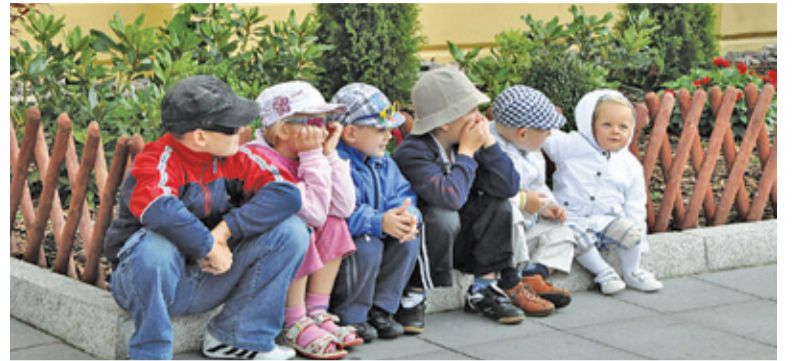
Ze względu na epidemiologiczne dzieci spotykają się w stałych, niewielkich grupach

– Od 25 maja przedszkola będą funkcjonować w dotychczasowej organizacji, która przewiduje zapisanie dziecka po złożeniu zaświadczenia o