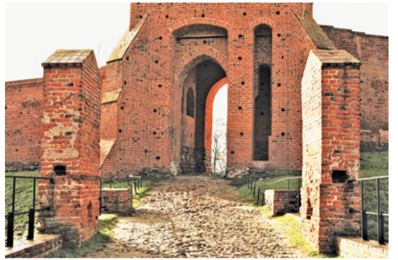
Na wieżę bramną może wejść maksymalnie 20 osób

Ośrodek Kultury w Górze Kalwarii, jako administrator Zamku Książąt Mazowieckich w Czersku, zgłosił do programu dotacyjnego „Kultura w sieci” za-