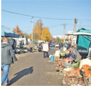
Na razie mieszkańcy Lesznowoli korzystają z targowisk w sąsiednich gminach, np. w Piasecznie

Z pewnym zaskoczeniem zobaczyliśmy na liście projektów, które uzyskały dotacje do budowy lub modernizacji targowisk, gminę Lesznowola. Wnioski o dofinansowanie bowiem należało złożyć pod koniec ubiegłego