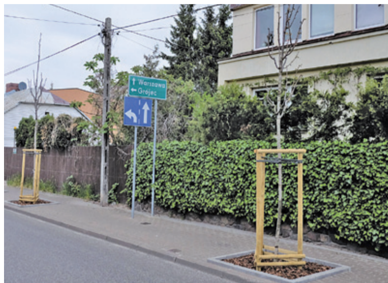
Przy ulicy Kilińskiego rosną robinie Małgorzaty Pink Cascade. Koszt posadzenia jednego takiego drzewa wraz zakupem materiału oraz roczną pielęgnacją to prawie 1200 zł

W ramach projektów Budżetu Obywatelskiego na 2020 rok posadzono 50 lip drobnolistnych przy ulicach Szkolnej i Młynarskiej oraz 20 robinii Małgorzaty