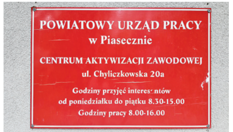
Urzednicy PUP pracują po godzinach, a nawet w sobotę

Pierwsze wnioski, złożone w kwietniu, tuż po ogłoszeniu tarczy antykryzysowej, miały szansę zostać rozpatrzone dość szybko. Potem liczba chętnych na pomoc od państwa zaczęła lawinowo rosnąć. Każdego dnia przybywało ich po około 800, w tym również w weekendy, ze względu na możliwość składania wniosków drogą elektroniczną.