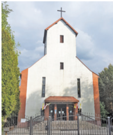
Kościół został zamknięty dla wiernych w sobotę 16 maja

Decyzją sanepidu, od 16 maja do odwołania kościół przy ul. Świerkowej 9/13 w Kamionce pozostaje zamknięty dla wiernych. Powodem