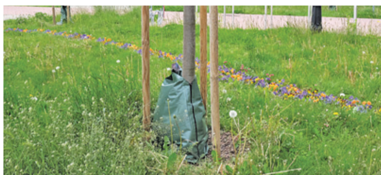
Worki do podlewania napełniane są wodą w suche i ciepłe dni. Do systemu korzeniowego drzewa dostaje się jej prawie 60 litrów