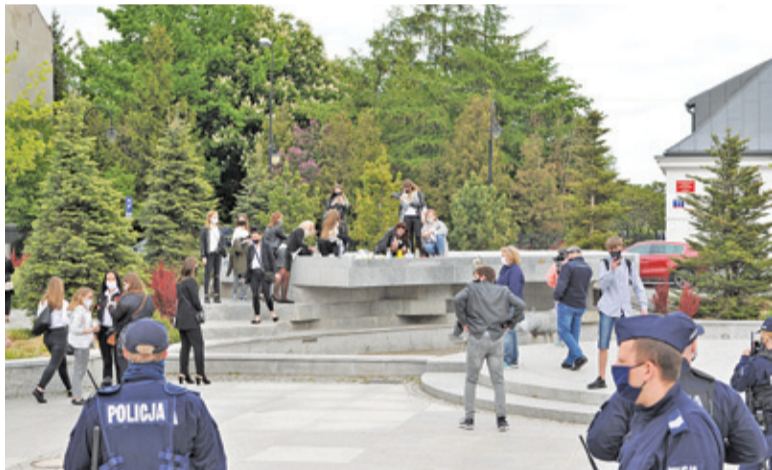
Nałożone kary dotyczyły nieprzestrzegania przepisów ustawy antycovidowej

młodzi, która przyszła złożyć kwiaty i znicze na fontannie oraz kilkunastu policjantów na skwerze i kilkudziesięciu w pogotowiu.