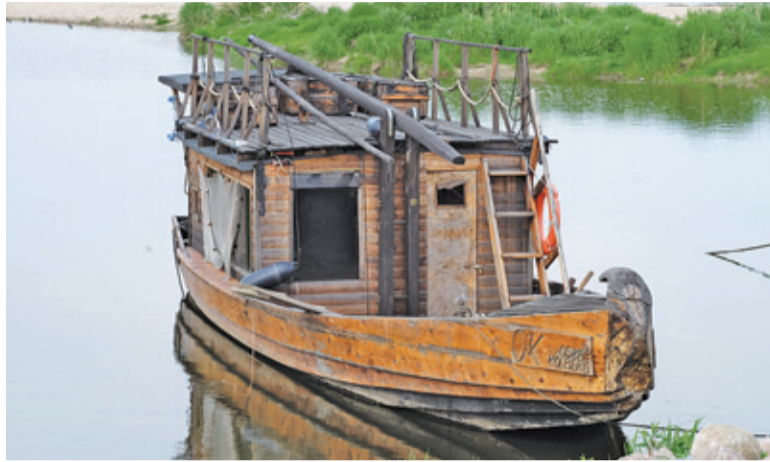
Oskar Kolberg opuścił już bezpieczną zatokę i czeka w nurcie rzeki na kolejne rejsy

Jak poinformowało Ministerstwo Gospodarki Morskiej i Żeglugi Śródlądowej – zgodnie z brzmieniem Rozporządzenia Rady Ministrów z 16 maja