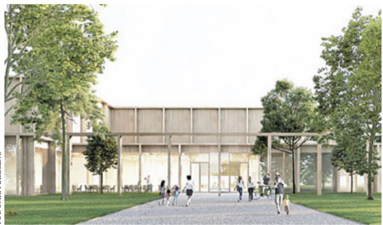
Gmina będzie negocjować z autorem zwycięskiej pracy opracowanie gotowego projektu budowlanego