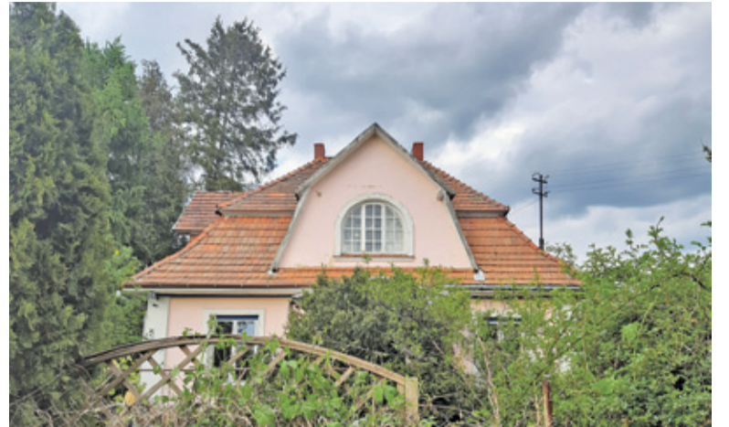
Najwyższa kwota miałaby trafić do właściciela zabytkowej willi w Gołkowie