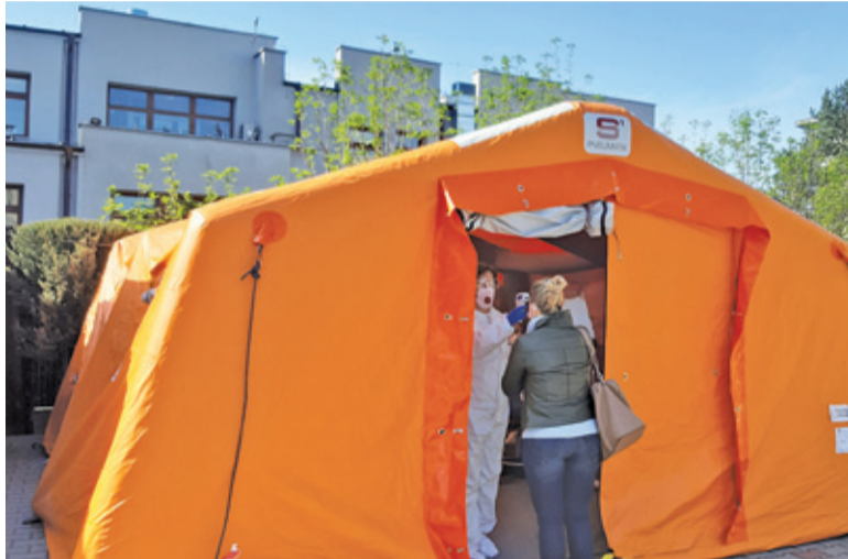
Laboratorium wykonuje odpłatne testy serologiczne od 27 kwietnia

dnia zrobiło się głośno o podobnych testach przeprowadzonych w Łodzi. Testy serologiczne w kierunku przeciwiał SARS-CoV-2 od miesiąca są prowadzone przez laboratorium w piaseczyńskim ZOZ przy ul. Fabrycznej, organizacja nie