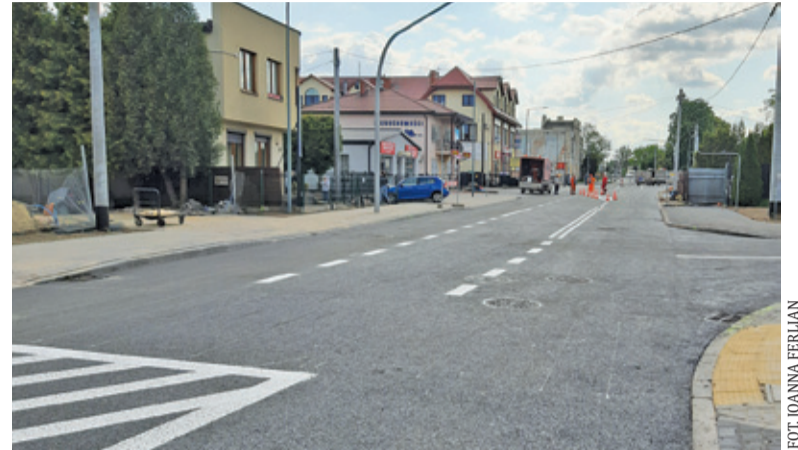
Obecnie trwają ostatnie prace na odcinku między ul. Powstańców Warszawy a ul. Jarząbka