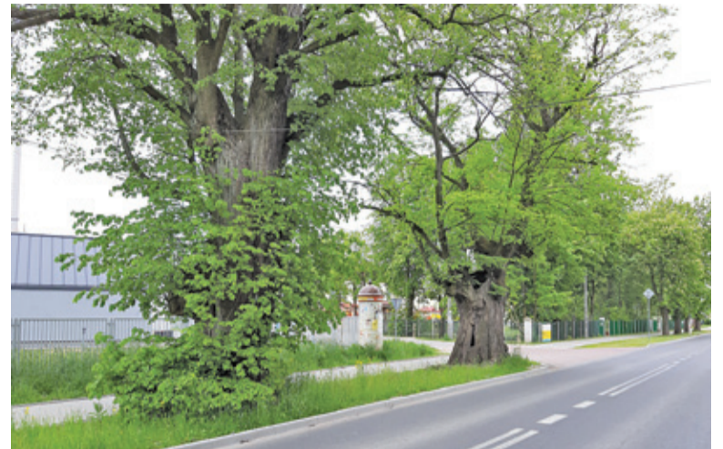
Drzewa wzdłuż ul. Ryxa zostaną zbadane przez dendrologów

Mieszkańcy są na tym punkcie wyczuleni po tym, jak planowano wycinkę blisko 50 drzew wzdłuż ulicy Ryxa (DW722) w Prażmowie. Pod koniec ubiegłego tygodnia radny Sejmiku Mazowieckiego Piotr Kandyba poinformował, że wybrano wykonawcę przetargu na wykonanie ekspertyzy prażmowskich drzew. To efekt działań grupy mieszkańców, która podjęła walkę o ocalenie przeznaczonych do usunięcia okazów pod koniec ubiegłego roku. Ostatecznie wycinka została przez MZDW wstrzymana w związku z tym, że upłynął termin ważności dokumentu zezwalającego na wycinkę 46 drzew. W wyniku negocjacji Mazowiecki Zarząd Dróg Wojewódzkich zgodził się na wykonanie ekspertyzy dendrologicznej przed ponownym wydaniem decyzji o wycince. Po podpisaniu umowy wy-