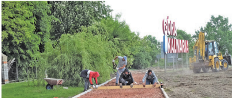
Za kilka dni będzie można dojść do parku na skarpie nową ścieżką

Taki materiał jest już zastosowany na ścieżkach w parku. Nowa alejka ma umożliwić wygodne dotarcie do niego pieszo czy z wózkiem.