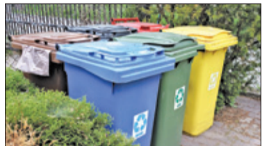
❧ Góra Kalwaria - Segregować, żeby nie było drożej s. 8