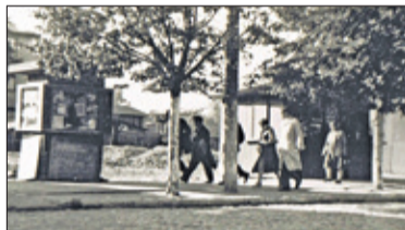
❧ Historia - Blok przy ulicy Kościuszki 18 s. 6