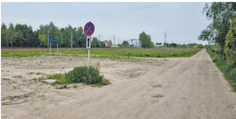
Pomysł budowy targowiska przy ul. Sadowej nie podoba się okolicznym mieszkańcom oraz części radnych