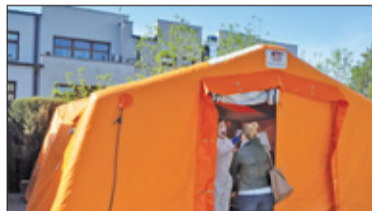
❧ Piaseczno - Przedszkolanki przetestowane s. 5