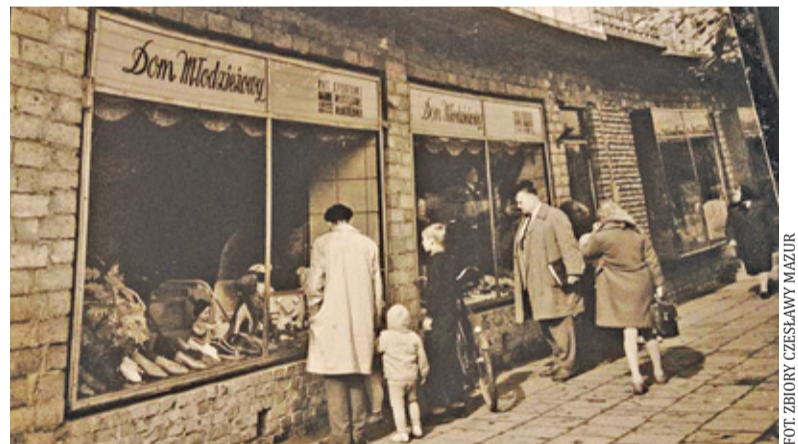
Wystawy sklepów w bloku przy ul. Kościuszki 18, zawsze zadbane i pomysłowo dekorowane. Zdjęcie z przełomu lat 60. i 70.

ale pyszną szynkę, której kupowało się 10 dkg dla dziecka. Początkowo garmazierka miała osobne wejście z ulicy, potem to się zmieniło i połączono oba sklepy. Stąd dwie pary drzwi sklepu od ulicy Kościuszki. Niestety nie pamiętam czasu, gdy zaopatrzenie było dostateczne, pamiętam natomiast puste półki, butelki z octem i metalowe puszki bez etykiet z „jakby tuszonką” dla wojska, ustawiane w piramidę stanowiącą koszmarną dekorację garmazierki (lata 70.). Obok spożywczego był w latach 60. sklep odzieżowy, były tam też buty. Za nim sklep z gospodarstwem domowym, gdzie królowały pralki wirnikowe „Frania” i „Światowit”. Towar na wysta-