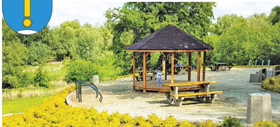
Na skarpie wzdłuż ul. ks. Sajny pojawiła się w ostatnich dniach m.in. drewniana altana

ul. 3 Maja 10, tel. 22 727 34 11, www.gorakalwaria.pl