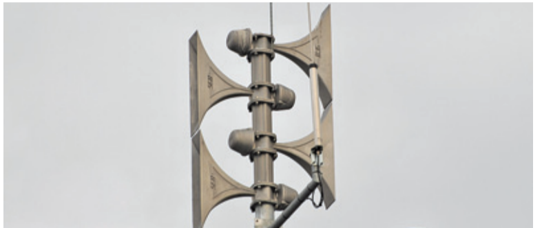
dokończenie na str. 3 Komunikaty nadawane są od 27 marca

❧ POWIAT Wielu mieszkańców uważa nadawanie komunikatów informujących o stanie epidemii przez system alarmowy za bezcelowe. Wiemy, kto zdecydował o ich emisji i kto ewentualnie może je odwołać.