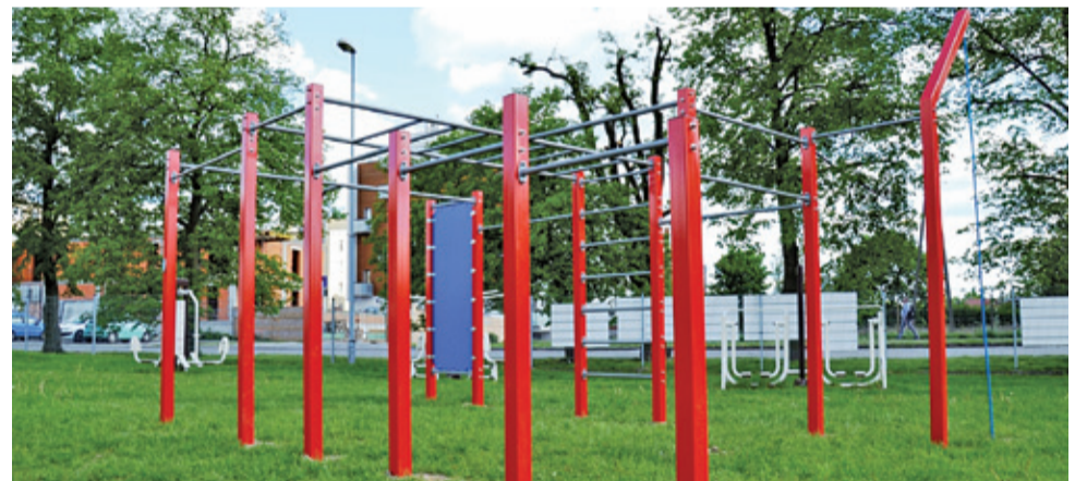
Zestaw do street workoutu to jedna z nowych atrakcji w sąsiedztwie basenu