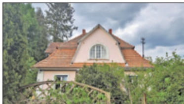
❧ Piaseczno - Kolejna potyczka o zabytki s. 4