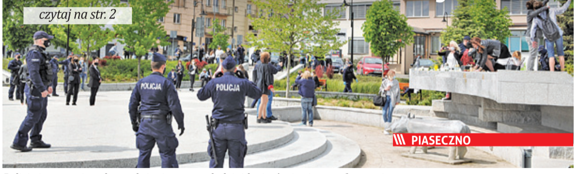
Policja interweniowała po złożeniu przez młodzież kwiatów i zniszczy na fontannie