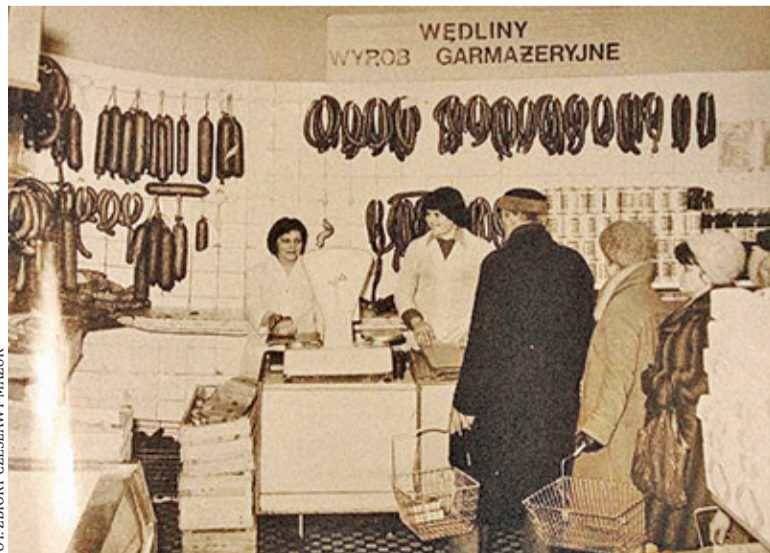
Stoisko garmazeryjne w sklepie przy ul. Kościuszki 18 lata 60/70.

przegubowego czerwoniaka, autobusu podmiejskiego, ale też i dlatego, że blok jest wybudowany z czerwonej cegły i przez jakiś czas nie był tynkowany. Nowa historia miejsca zaczyna się pod koniec 1960 r., większość mieszkańców