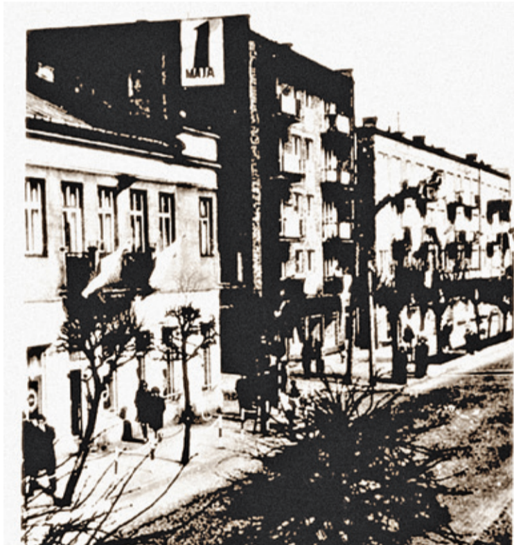
Widok zabudowań ul. Kościuszki. Na zdjęciu dom z apteką i blok z adresem ul. Kościuszki 18

ty” dla dziadka i czekoladę wedlowską (22 Lipca) za 9,50 zł kupowałam w budce przy ul. Sienkiewicza, tuż przy stacji kolejki wąskotorowej. Zdjęcie pochodzi z lat 50. i mogłoby być zrobione w różnych częściach miasta, gdyby nie pewien szczegół na zdjęciu, który nagle przyciąga moją uwagę. W tle widzę małą budowlę z dziwnym dachem. I tu nagle olśnienie. To jest gołębnik i na pewno jesteśmy przy ulicy Kościuszki, a na dalszym planie widać zabudowania ul. Nadarzyńskiej. Mieszkańcy oficyny przy ul. Nadarzyńskiej hodowali gołębie, ten gołębnik przetrwał dekady i zniknął dopiero po rozbiórce kamienic przy ul. Nadarzyńskiej w 2015 r. Na zdjęciu widać, że plac za budką jest powoli porządkowany, za chwilę historia tego miejsca nabierze znów kolorytu.