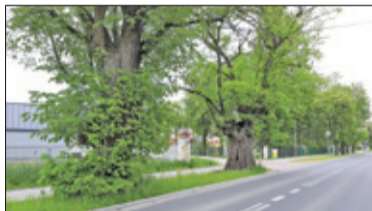
❧ Prażmów - Wciąż pilnują drzew rosnących przy drodze s. 7