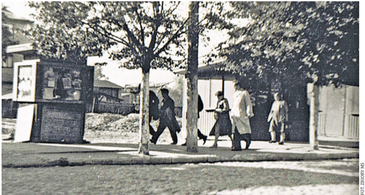
Zdjęcie z 1954 roku ul. Kościuszki w tle zabudowania ul. Nadarzyńskiej z gołębnikiem. Tu za 6 lat stanie olbrzymi blok

mieszkań. Wówczas rodzi się projekt budowy domu dla pracowników Laminy i ZELOSu, budynku o potężnej kubaturze, z dziesiątkami mieszkań. Powstaje blok z cegły budowany metodą jeszcze tradycyjną. Budynek kształtem zupełnie nie pasuje do zabudowy małego miasteczka, nie komponuje się z pozostałymi budynkami, ale cóż, będzie prekursorem zdarzeń budowlanych, jakże charakterystycznych dla Piaseczna, czyli braku dobrego stylu architektonicznego i gustu, braku urbanistycznej myśli zagospodarowania dużych przestrzeni w jedno spójne estetyczne miasto. Mieszkańcy krytykują wygląd bloku, a obiekt powoli wrasta w miasto, tym bardziej, że parter domu przeznaczony jest na eleganckie sklepy, o wielkich witrynach wystawowych, co przyciąga kupujących. Mieszkańcy mówią na ten blok: „ten przy Nadarzyńskiej”, choć adresem sklepów i mieszkań jest ul. Kościuszki 18. Mówią też „czerwoniak”, trochę złośliwie, nazwa jakby wzięta z nazwy