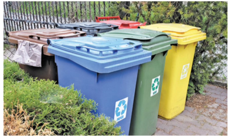
Dokładnie segregowane śmieci do oszczędności dla gminy i mieszkańców

– Zastanawiamy się nad tym, żeby ewentualnie część transportu przekazać do Zakładu Gospodarki Komunalnej. Analizujemy, czy się to opłaca – dodaje rzecznik burmistrza.