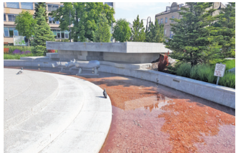
W najbliższym czasie odpalona może zostać fontanna na Skwerze Kisiela