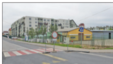
|| Piaseczno - Nadarzyńska zamkną w wakacje s. 2

PIASECZNO || GÓRA KALWARIA || KONSTANCIN-JEZIORNA || LESZNOWOLA || PRAŻMÓW || TARCZYN