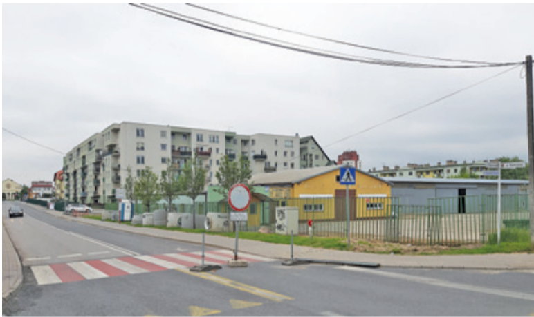
Termin zamknięcia a skrzyżowania nie został jeszcze podany