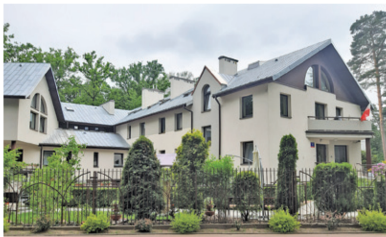
Domu w Zalesiu Górnym nie wolno ani opuszczać, ani odwiedzać

Informacja ta wzbudziła niepokój lokalnej społeczności, zwłaszcza że siostry zakonne pracujące w domu opieki pełnią posługę również w pobliskim kościele.