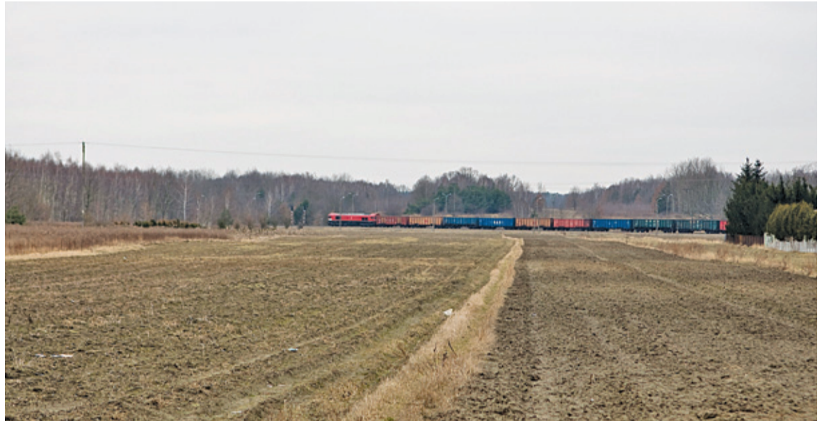
Na tyłach ratusza inwestor chciałby zbudować osiedle na kilka tysięcy mieszkańców

Na początku kwietnia w BIP pojawiła się informacja o wniosku inwestora w sprawie wydania decyzji o środowiskowych uwarunkowaniach dla budowy zespołu budynków usługowych, mieszkalnych wielorodzinnych i jednorodzinnych na działkach zlokalizowanych między ulicą Kolejową a torami linii siekierkowskiej. W sieci pojawiły się informacje, że na tyłach ratusza dzięki tej inwestycji mogłoby zamieszkać 6-7 tys. osób. Komentatorzy podkreślają, że to 25% liczby wszystkich obecnych mieszkańców gminy.