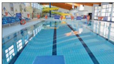
|| Powiat - Baseny jeszcze zamknięte s. 5