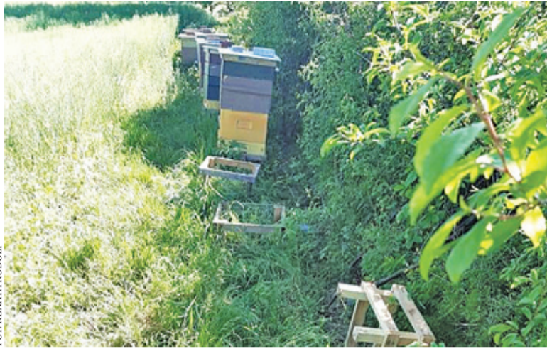
Pasieka ustawiona był obok pola rzepaku w Oborach

Pszczelarkom z Wólki Dworskiej zostały skradzione 4 ule wraz z rodzinami pszczół i miodem. Do kradzieży doszło wieczorem 1 czerwca w Oborach.