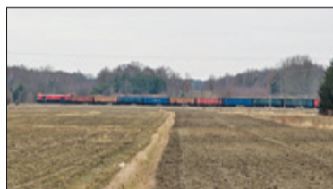
|| Konstancin-Jeziorna - Józefosław bis w Konstancinie s. 6