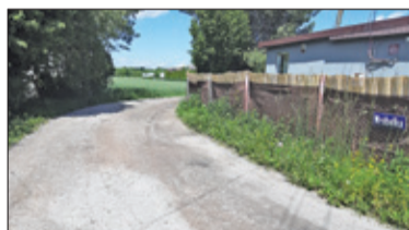
|| Zgorzała, Zamienie - Zielone światło dla hal? s. 4