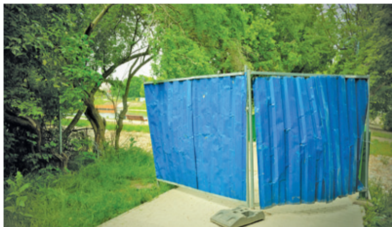
Mostek nad Perełką będzie jeszcze zamknięty przez kilka dni

Tak więc udostępnienia całej przestrzeni wokół stawu możemy spodziewać się na koniec czerwca. Poza pogłę-