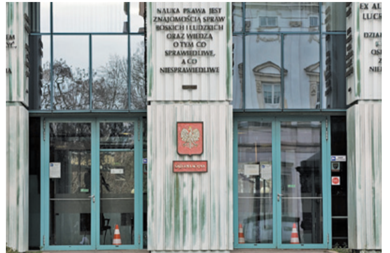
Sąd Apelacyjny podtrzymał wyrok Sądu Okręgowego w Warszawie

– Sąd w przedmiotowej sprawie ustalił, że pozwani nie naruszyli w sposób bezprawny dóbr osobistych powódki – stwierdził sędzia Paweł Pyzio. – Przekazane dziennikarce informacje