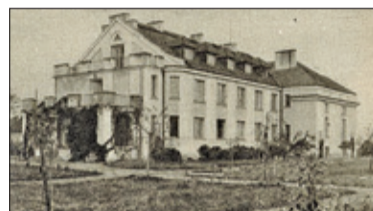
|| Historia - Dom w Skolimowie s. 13