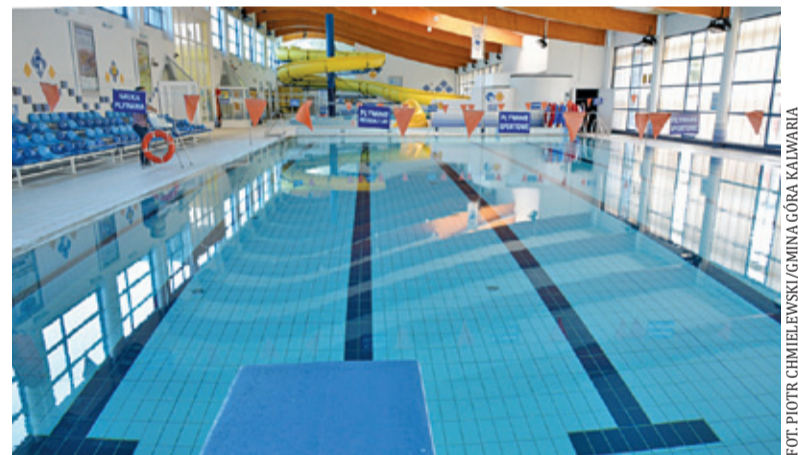
Najwcześniej ze wszystkich otwarty zostanie basen w Górze Kalwarii

Piaseczyński basen w GOSiR przy ul. Sikorskiego ma wystartować dopiero od lipca. Będzie za to czynny przez całe wakacje. Zwykle przerwa techniczna na wykonanie niezbędnych prac remontowych ma miejsce w sierpniu, ale w tym