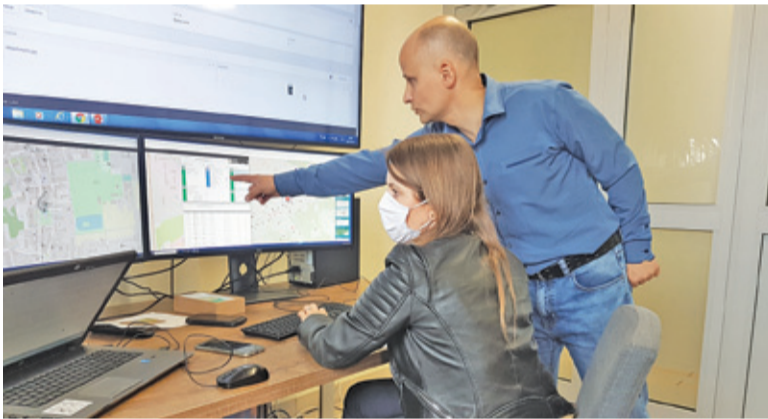
Pracownicy Referatu Innowacji Miejskich prezentują działanie sytemu i stanowiska dyspozytorskiego

Zarówno urzędnicy, jak i mieszkańcy będą mogli odszukać dane zgłoszenie i zweryfikować jego status w rejestrze zgłoszeń na stronie gminy i w portalu mapowym gminy.