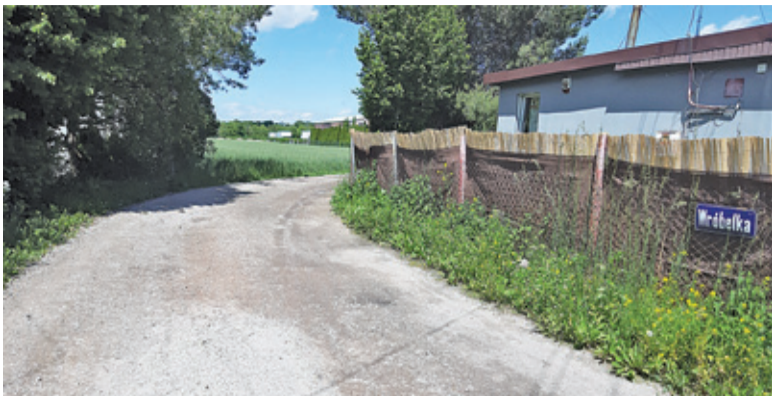
Obecnie na ulicy Wróbelka trudno sobie wyobrazić nie tylko tiry, ale również koparkę czy betoniarke