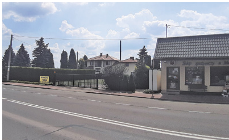
Maszt miałby stanąć na działce 273/1 przy ul. Słonecznej w Lesznowoli

– Proponujemy lokalizację wieży z dala od zabudowań jednorodzinnych