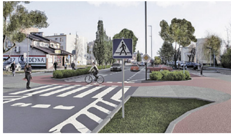
Przy głównej ulicy miasta ścieżka miałaby się zaczynać przed skrzyżowaniem ulic Puławskiej i Kusocińskiego