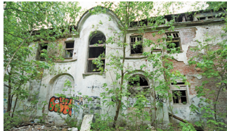
Sanatorium „Zofiówka” przez kilkadziesiąt lat pełniło funkcję szpitala psychiatrycznego

Położone nad Świdrem miasto najbardziej znane jest z dawnej zabudowy sanatoryjno-uzdrowiskowej. Pod koniec XIX wieku, dzięki budowie Kolei Nadwiślańskiej, Otwock ze swoimi wyjątkowymi walorami klimatycznymi, które zawdzięczał rozległym sosnowym lasom, stał się atrakcyjnym miejscem do stawiania sanatoriów, willi czy domów letniskowych. Wówczas zaczęły powstawać pierwsze „świdermaje-