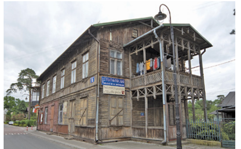
Willi Szeliga przy ul. Kościelnej była na początku XXw. ośrodkiem kulturalnym, społecznym i handlowym mieszkańców Otwocka

ry”, czyli drewniane budynki z bogato zdobionymi gankami, werandami, balkonami, nawiązujące do architektury szwajcarskiej. Ten styl, stworzony przez Michała Elwiro Andriollego, jest charakterystyczny dla budynków wznoszonych na przełomie wieku XIX i XX na tzw. linii otwockiej. Drewniane „świdermajery” spotkać możemy nieopodal dworca PKP, przy ulicach Kościelnej czy Kościuszki. Na prowadzonej przez gminę Otwock stronie internetowej www.turystycznyotwock.pl znajdziemy mapki z oznaczeniem tras i interesujących punktów. Otwock ma też kilka ciekawych budynków murowanych. Jednym z nich jest willa Julia przy ul. Kościelnej. Kolejnym – dawny dom uzdrowiskowy (który miał być pierwotnie kasynem), w którym obecnie ma swą siedzibę Zespół Szkół Ogólnokształcących. Imponujący