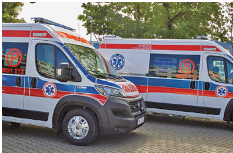
Nowe karetki mają ułatwić szybką i skuteczną pomoc pacjentom

Nowe karetki dla Lesznowoli i Konstancina-Jeziorny to nie wszystkie zmiany taboru. Jak informuje starostwo po-