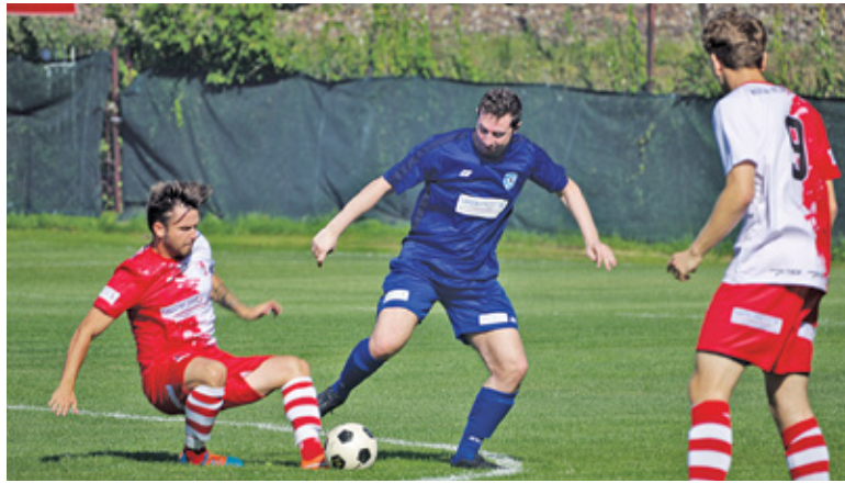
Na boisku nie zabrakło emocji

Mimo podwyższonej liczby zakażeń koronawirusem, na stadionie przy ulicy Bielawskiej w Konstancinie zebrała się duża liczba sympatyków lokalnego futbolu. Kibice RKS Mirków, ze względu na ograniczenia Mazowieckiego Związku Piłki Nożnej związane z pandemią, na stadion wejść nie mogli, ale licznie zgromadzili się na torach za stadionem i przygotowali niesamowitą oprawę, gorąco dopingując swoich piłkarzy przez