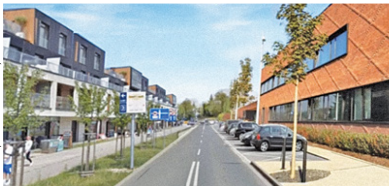
Zabudowa miałaby powstać między ul. Kolejową a torami linii siekierkowskiej

O bowach mieszkańców związanych z procedowanym projektem zmiany miejscowego planu zagospodarowania dla terenów na tyłach konstancińskiego Ratusza pisaliśmy pod koniec lipca. Mieszkańców najbardziej niepokoi perspektywa wprowadzenia zabudowy wielorodzinnej na liczącym blisko 65 ha obszarze bez zapewnienia odpowiedniej infrastruktury. Według różnych danych bowiem na tym terenie mogłoby zamieszkać od ponad trzech do nawet kilkunastu tysięcy osób. W związku z ogromnym zainteresowaniem tym tematem nie tylko osób mieszkających w sąsiedztwie wskazanego obszaru, burmistrz zorganizował 5 sierpnia w Ratuszu spotkanie z zainteresowanymi mieszkańcami. Wyrzucili oni szereg obaw związanych z procedowanym planem zagospodarowania terenu. Podkreślali też, że konsulto-