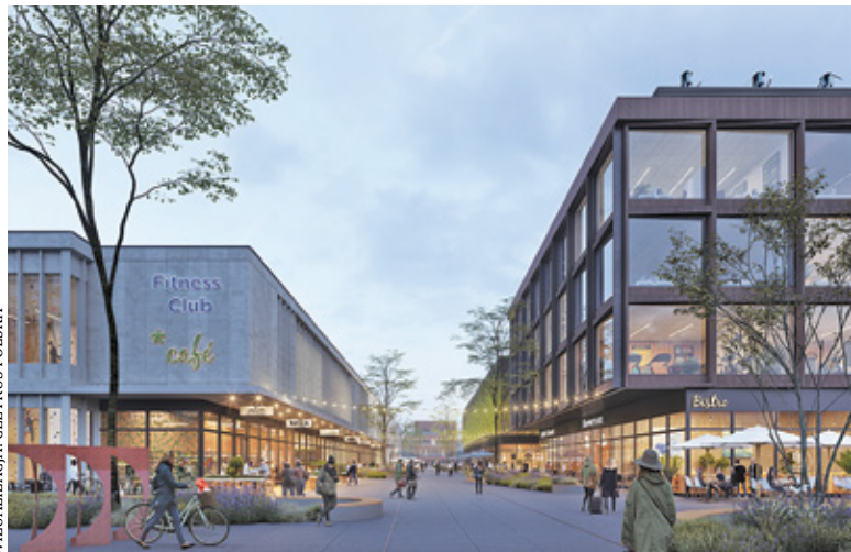
WIZUALIZACJA: CEETRUS POLSKA

W pierwszym etapie inwestor chce zbudować część handlowo-rozrywkową