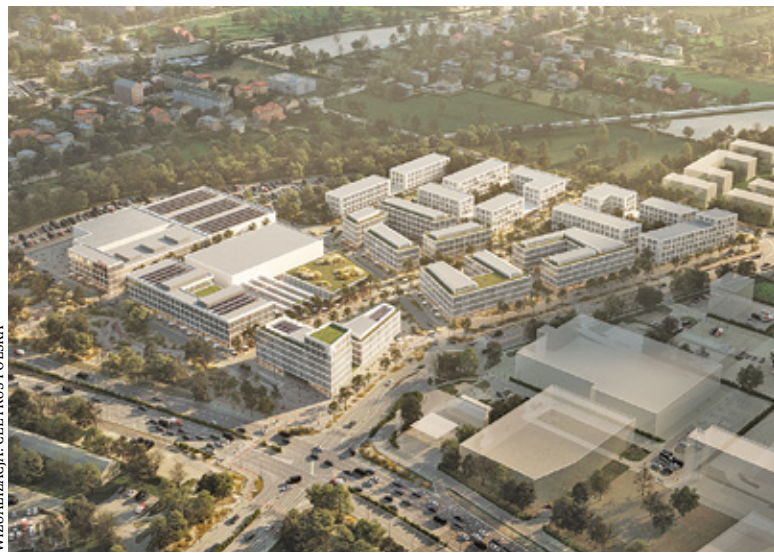
WIZUALIZACJA: CEETRUS POLSKA

Biurowce miałyby zostać zlokalizowane od strony ulicy Energetycznej.