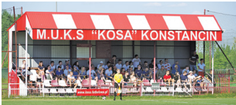
Trybuna stadionu przy ulicy Bielawskiej wypełniła się kibicami

cały mecz. Swoje ostatnie ligowe starcie Mirków rozegrał w 2013 roku, przed utworzeniem KS Konstancin, więc fani z pewnością czuli ogromny głód piłki. Zawodnicy obu klubów idealnie wpaso-