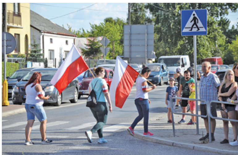
Gmina nie wywiesiła flag na ulicach, ale uroczystości nie zabrakło

Inne osoby z kolei skomentowały, iż krytyka jest przesadzona, ponieważ gmina uczciła pamięć poległych uro-