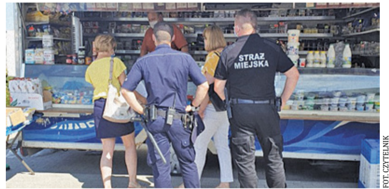
Sanepid poprosił policję i straż miejską o asystę podczas kontroli