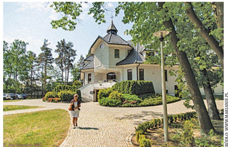
Kościół ze względów bezpieczeństwa został zdezynfekowany

We wtorek 18 sierpnia testom poddano również mieszkańców domu za-