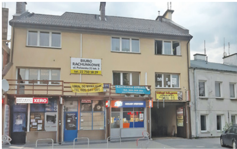
Wszystko wskazuje na to, że chaos reklamowy w ścisłym centrum jeszcze trochę potrwa

Podczas wizji lokalnej przeprowadzonej przez urzędników Mazowieckiego Wojewódzkiego Konserwatora Zabytków w związku z prowadzoną procedurą przygotowawczą mającą na celu wpisanie do rejestru zabytków historycznego układu urbanistycznego, zapytaliśmy o reklamy i szyldy.