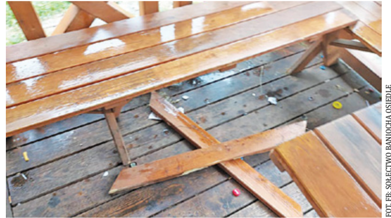
Chuligani zdewastowali altanę w Baniosze

– Nasza młodzież za dużo sobie pozwala, wszystko na co natrafia, a jest