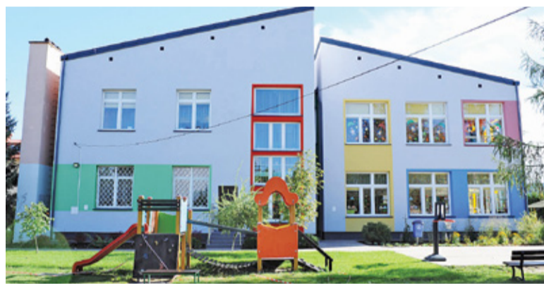
Budynek przedszkola nr 11