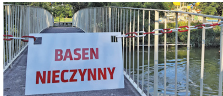
Aquapark wystartował zaledwie cztery tygodnie przed groźnym zajściem

Straż pożarna, która dotarła na miejsce jako pierwsza, nakazała zamknięcie dużego basenu. Policja na miejscu sprawdziła trzeźwość ratowników i matki chłopca. Dziecko, które według informacji straży pożarnej przebywało pod wodą około 3 minut, udało się przywrócić przytomność jeszcze przed przyjazdem karetki. 11-letni chłopiec trafił do jednego z warszawskich szpitali. Jak się dowiedzieliśmy