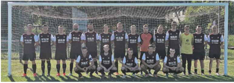
W A-klasie bardzo dobre występy notuje UKS Tarczyn