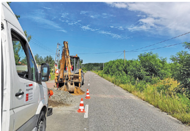
Budowa drogi w Krępie

Podobnie jak mieszkańcy, powiat musiał szybko odnaleźć się w nowej sytuacji, wynikającej z epidemii, która jeszcze pół roku temu wydawała się zupełnie nierealna. Mimo spadku dochodu