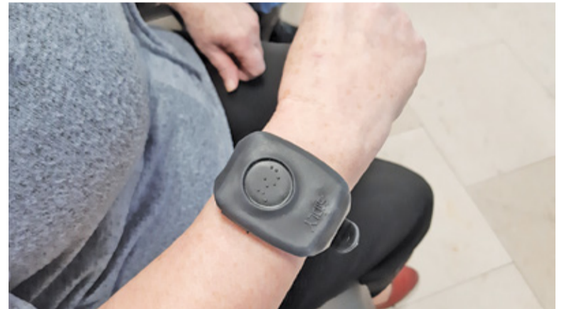
Z opaski można korzystać w całej Polsce. Dzięki lokalizatorowi GPS służby ratunkowe w razie potrzeby zlokalizują osobę, która potrzebuje pomocy

– Warunkiem otrzymania opaski będzie także złożenie deklaracji członkowskiej i wniosku do operatora