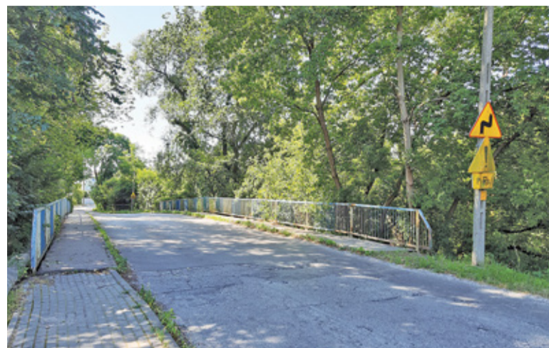
Most w ciągu ulicy Dworskiej ma być całkowicie rozebrany i zastąpiony nowym

Zaplanowana na ten rok inwestycja polegająca na przebudowie ulicy oraz całkowitym rozebraniu istniejącego mostu i budowie nowego, była zagrożona ze względu na epidemię. Prognozowany spadek dochodów do budżetu skłonił starostę do wstrzymania wszelkich nowych inwestycji. Ze względu jednak na korzystne obecnie ceny na rynku budowlanym władze powiatu uznały, że warto rozpocząć zaplanowane inwestycje. Zarząd chciał jednak mieć zabezpieczone środki na realizację