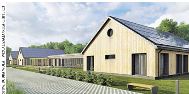
Nowoczesne osiedle ma zapewnić osobom niepełnosprawnym bezpieczeństwo, odpowiednią opiekę i możliwość podjęcia pracy

– Pieniądze na fundamenty mamy dzięki wieloletniej działalności stowarzyszenia i wpłatom od darczyńców – mówi Zalewski. – Szacowany koszt