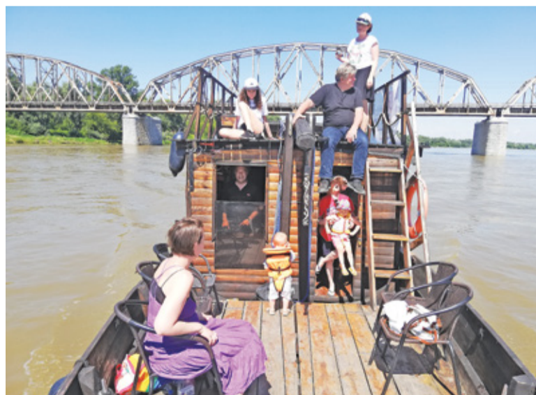
Rejsy zabytkową sztuką po Wiśle

która będzie obejmować rozbiórkę mostu i budowę nowego. Ta inwestycja zakończyć się ma we wrześniu przyszłego roku.