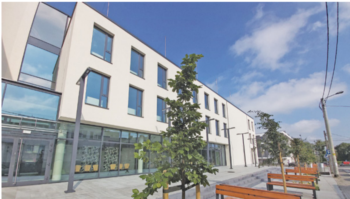
Nowa siedziba Powiatowego Urzędu Pracy

Do 1 lipca br. wpłynęły 16.692 wnioski do PUP w związku z Tarczą