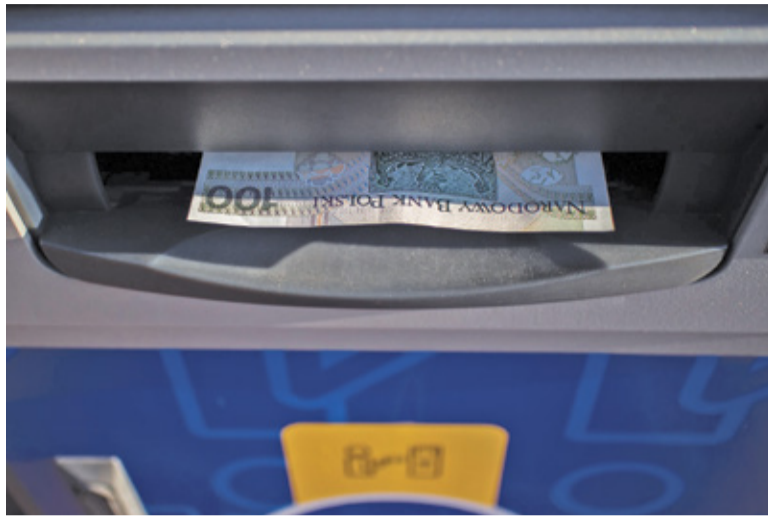
Obecnie jedyną możliwością wypłacenia pieniędzy w Zalesiu Górnym jest poczta przy ul. Wiekowej Sosny 60, nieczynna w weekendy