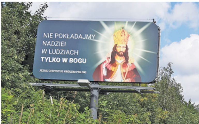
Baner eksponuje religijny światopogląd w przestrzeni publicznej