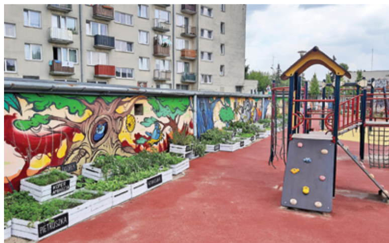
Skrzynki umieszczone wzdłuż muralu budzą spore zainteresowanie nie tylko dzieci

– Podleujemy inne rośliny, zadbamy też o te na placu zabaw. Miejmy nadzieję, że będzie co podlewać, bo dwie skrzynki podobno już zdążyły zniknąć, a ogródek stoi dopiero od dwóch dni –