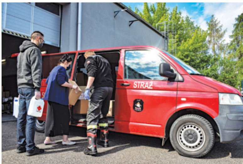
Dystrybucja środków ochrony

udało się zakończyć trwające projekty, rozpocząć te wcześniej zaplanowane, dostosowując je do nowej rzeczywistości, a także zapewnić bezpieczeństwo podopiecznych powiatowych placówek.