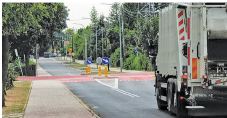
Czy jadąca ulicą Szkolną śmieciarka jest w stanie przejechać bez wjeżdżania na chodnik?

W jednym z ostatnich numerów Przeglądu Piaseczyńskiego pisaliśmy o nowych skrzyżowaniach powstałych w ramach przebudowy ulicy Szkolnej w Baniosze. To pierwsze w gminie skrzyżowania z wyniesioną powierzchnią. Krzyżówka przyciąga uwagę, ponieważ jej nawierzchnia została pokryta czerwonym kolorem. Po