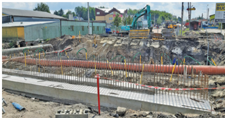
Najważniejszą częścią modernizacji jest przebudowa mostu nad Perelką

W tej sytuacji gmina zastanawia się, czy wraz z otwarciem skrzyżowania przywrócić na tę trasę od razu linie autobusowe. W momencie kładzenia ostatniej warstwy ścieralnej