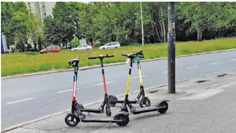
Elektryczne hulajnogi w krótkim czasie opanowały miejskie osiedla

Co dokładnie może się zmienić? Po pierwsze projekt ma wprowadzić do prawa pojęcie UTO. Związane są z tym konkretne wymogi – takie urządzenie musi mieć szerokość nieprzekraczającą w ruchu 0,9 metra oraz długość nie większą niż 1,25 metra. Konstrukcyjnie ma być przeznaczony do poruszania się wyłącznie przez kierującego, a ponadto musi być wyposażony w napęd elektryczny i oświetlenie. Konstrukcja urządzenia ma ograniczać prędkość jazdy do 25 km/h (wyjątkiem jest wózek inwalidzki). Za używanie pojazdów niespełniających tych wymogów grozić będzie do 5 tysięcy złotych grzywny.