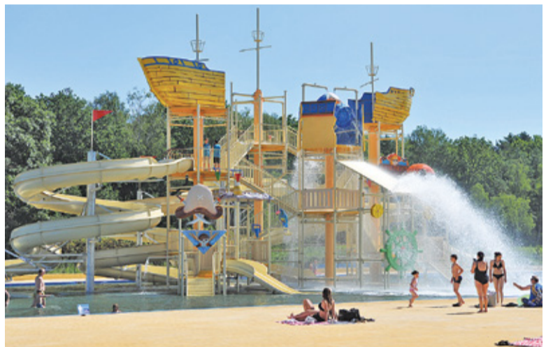
Dramat rozegrał się w basenie pływackim. Noga chłopca utknęła w jednym z odpływów

W parku wodnym w Zalesiu Górnym w sobotę 22 sierpnia po południu rozegrała się dramatyczna walka z czasem. Około godziny 16.00 jedenastoletni chłopiec utknął pod wodą w dużym basenie o głębokości 1,4 m. Z relacji świadków wynika, że alarm wszczęła matka dziecka. Na ratunek rzuciło się kilku znajdujących się w pobliżu mężczyzn. Okazało się, że noga chłopca utknęła w jednej z rur odpły-