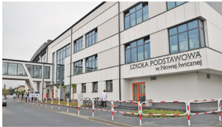
Z nowego do starego budynku można się dostać łącznikiem nad ulicą Szkolną

– dodajemy środki własne. Obecnie jest to już około 50% kwoty wydawanej na edukację.