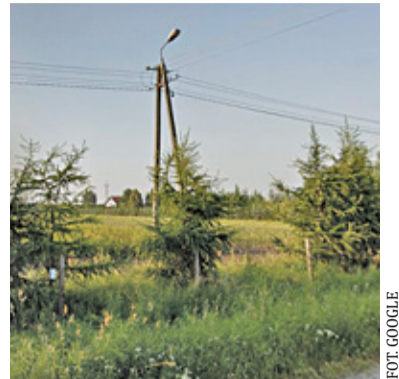
W dzień czy w nocy... Latarnie nie świecą

– Na podstawie zawartej z firmą ENERGO-SPEC z Czachówka umowy gmina Tarczyn zleciła wymianę wszystkich czujników zmierzchowych i zegarów zamontowanych na terenie Gminy na zegary astronomiczne. Zamontowano 104 szt. zegarów, których działanie jest ściśle związane z cyklem wschodów i zachodów słońca. Zegar na