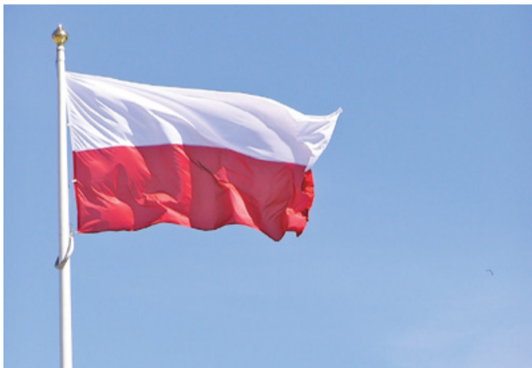
Rząd może postawić nawet 2477 masztów z biało-czerwoną flagą

ry zachęcił nas do oddania głosu. Cała procedura nie jest zbyt skomplikowana, a liczba głosów potrzebnych do wygra-