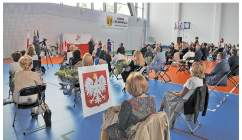
Rodzice podarowali szkole godło