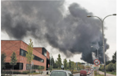
Chmura dymu sięgała co najmniej kilku kilometrów

Chmura czarnego dymu unoszącego się nad Konstancinem-Jeziorną była