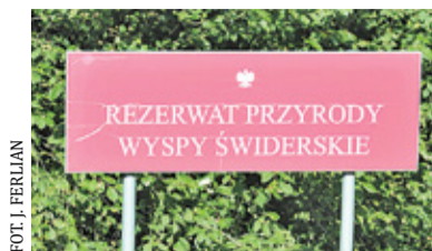
Tablice informujące o terenie rezerwatu znajdują się przy zejściach na plażę

– W trosce o mieszkańców Ciszycy i ogólnie porządek w tym miejscu, raz w tygodniu, w poniedziałki służby komunalne sprzątają zostawione przy skrzyżowaniu śmieci – poinformował nas w