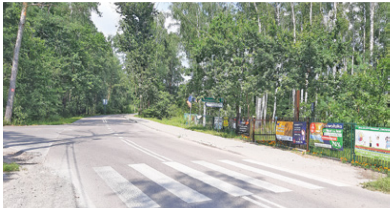
W miejscu skrzyżowania ulic Masztowej, Gościniec i Wojska Polskiego ma powstać rondo