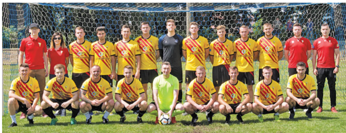
Korona Góra Kalwaria zagrała świetny mecz przeciwko KS SEMP Warszawa