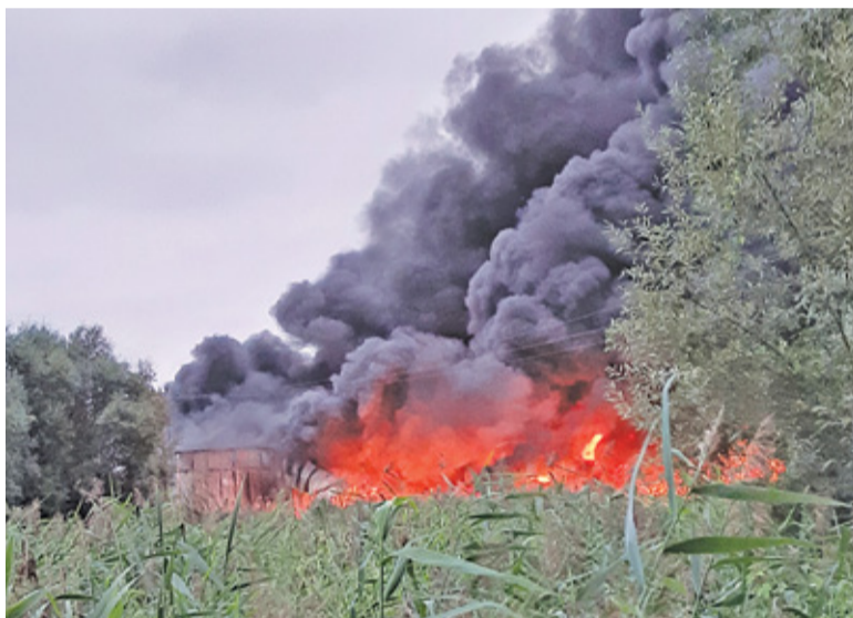
Opanowanie ognia stanowiło ogromne wyzwanie dla strażaków