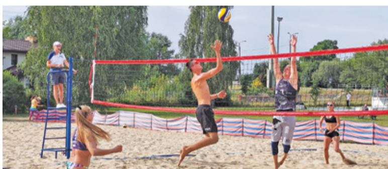
Siatkarskie mistrzostwa w Górze Kalwarii

„mixtach”, czyli parach mieszanych. Była to impreza kończąca sezon plażowy w mieście.