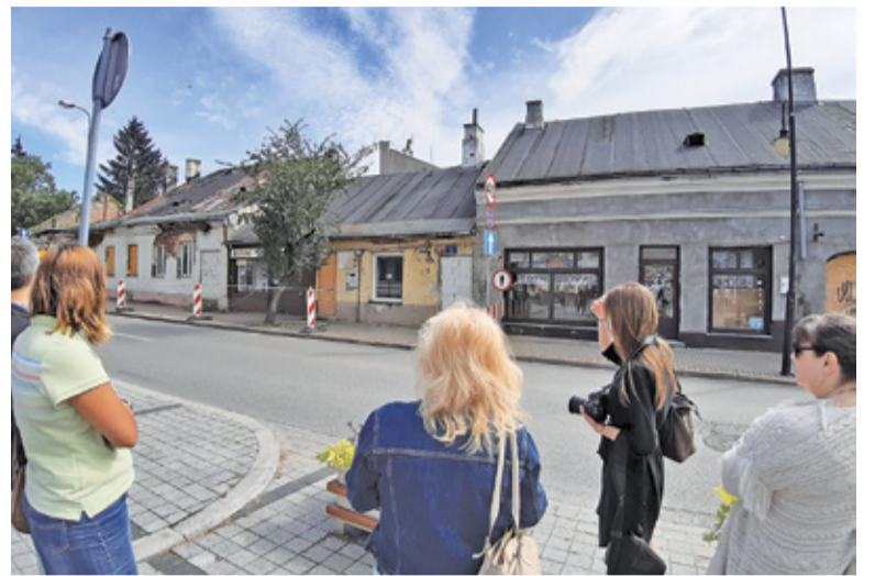
Wizja lokalna urzędników konserwatora zaczęła się od rozmowy o budynkach przy ul. Warszawskiej

Gmina już w sierpniu ubiegłego roku złożyła do konserwatora wnioski o rozbiórkę należących do niej kamienic pod numerami 2, 3 i 4. Konserwator odmówił uzgodnienia rozbiórki, w związku z tym gmina Piaseczno złożyła w październiku ur. zażalenie na postanowienie konserwatora do ministra kultury i dziedzictwa narodowego. Ministerstwo 13 stycznia br. wydało decyzję uchylającą postanowienie MWKZ i nakazało ponowne rozpatrzenie sprawy. Gmina posiada również opinię PINB oraz ekspertyzę techniczną nakazującą rozbiórkę budynku. Tymczasem pod koniec czerwca konserwator zaskoczył władze Piaseczna informacją o wszczęciu procedury wpisania do rejestru zabytków historycznego układu miasta. Oznacza to z automatu wstrzymanie wszelkich działań, które mogłyby zmienić zabytek. Ulica Warszawska oczywiście mieści się w obszarze, który podlega procedurze. Teoretycznie urzędnicy MWKZ zadeklarowali podjęcie decyzji o wpisie do rejestru najpóźniej wczesną