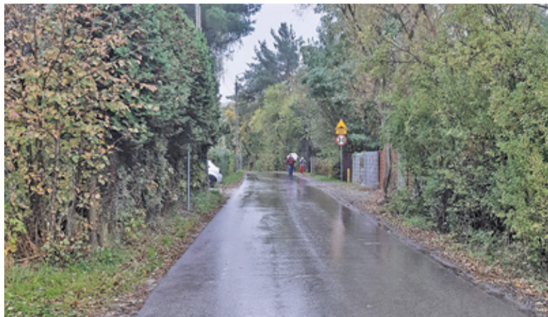
Mieszkańcy chcieliby poprawy jakości drogi, ale bez zmiany jej kategorii na drogę lokalną o szerokości 12 metrów

Podczas sesji radni mają uchwalić plan zagospodarowania dla niewielkiego obszaru Skolimowa. Dotyczy on również fragmentu ulicy Kołobrzeskiej i zakłada jej poszerzenie do 12 metrów. Przeciwno temu rozwiązaniu od wielu lat protestują mieszkańcy ulicy.