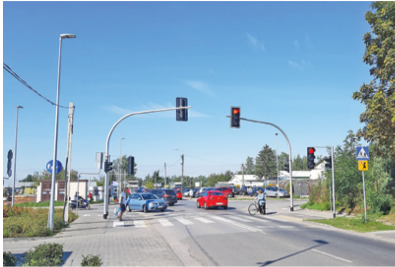
Najwięcej problemów na skrzyżowaniu jest codziennie rano. Zwłaszcza w dni handlu na targowisku

Kierowcy narzekają na organizację ruchu na skrzyżowaniu ulic Żytniej i Jana Pawła II. Odkąd uczniowie wrócili do szkoły, światła dla pieszych wprowadzają sporo zamieszania i łatwo w tym miejscu o kolizję. Przede wszystkim jednak sygnalizacja nie spełnia wymogów prawa.