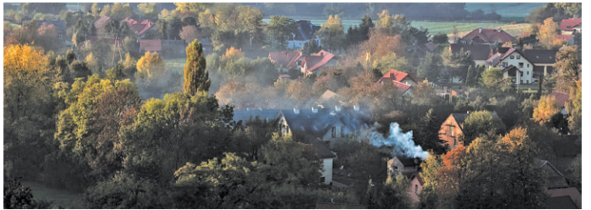
Dym ze spalania drewna zawiera duże ilości pyłów zawieszonych i rakotwórczy benzo(a)piren

Zakaz palenia w kominkach to element większej strategii opracowanej przez władze województwa. Program Ochrony Powietrza dla Mazowsza zakłada także inwentaryzację źródeł ciepła (samorządy mają na jej przeprowadzenie czas do końca 2021 r.), wymianę starych kotłów grzewczych, zwiększenie ilości nasadzeń zieleni, wdrożenie czyszczenia ulic na mokro i wprowadzenie