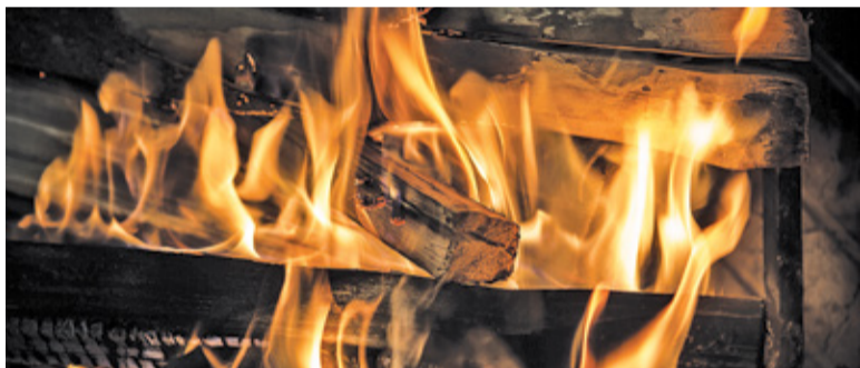
Nowe przepisy mają wejść w życie już za kilka tygodni

alarmowego. Mieszkańcy będą informowani za pośrednictwem SMS (alert RCB).