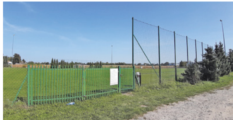
Magazyny muzealne miałyby powstać w sąsiedztwie boiska przy ul. Topolowej