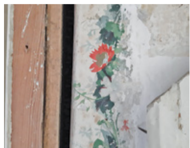
Na ścianach znaleziono m.in. tapetę z florystycznym wzorem

około 15 gości. W drugim pomieszczeniu urządzona zostanie sala muzealna dotycząca czasów saskich. Znajdujące się w obu pomieszczeniach piece kaflowe zostaną odnowione. W pomieszczeniu przeznaczonym na muzeum odkryto stare tapety. Przynajmniej część ścian będzie więc pokryta tapetą nawiązującą