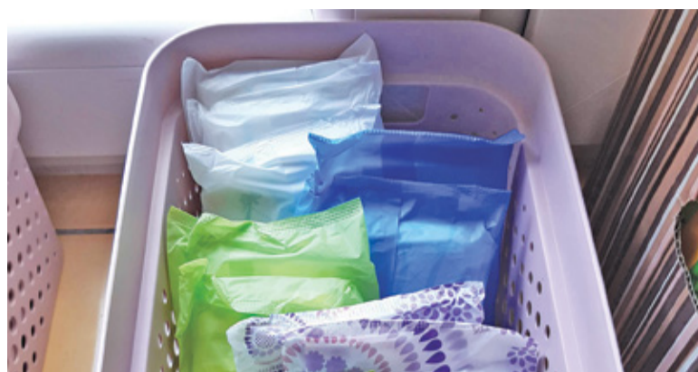
Koszyczki czekają już na uczennice w toaletach

W piaseczyńskiej Krauzówce pomysł koszyczka ratunkowego dla potrzebujących uczennic realizuje mama dwojga uczniów Olga Śmietanowska.