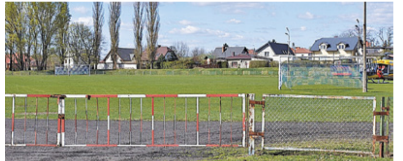
Aktualnie stadion przy ulicy Wojska Polskiego może pomieścić 2000 kibiców

– Włodarze rozważali budowę nowego obiektu sportowego, aby zapewnić nowoczesną bazę dla miejscowych klubów i sekcji sportowych oraz stworzyć miejsce treningowe w pobliżu du-