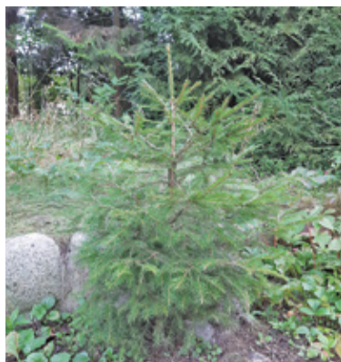
Ważne, by środowisko zyskało kolejne drzewo

– Dla wszystkich chętnych przygotowaliśmy łącznie aż milion sadzonek – informują Lasy Państwowe. – Lasy i drzewa zapewniają nam tlen, oczysz-