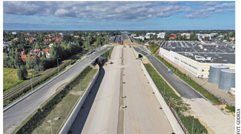
Zamknięcie zawrotki jest niezbędne do ostatecznego połączenia nowego odcinka S2 z już istniejącym

W ramach prowadzonych obecnie prac, mających na celu połączenie istniejącego odcinka Południowej Obwodnicy Warszawy (POW) z nowym przebiegiem drogi, przedłużono mur oporowy po północnej stronie wiaduktu. Rozpoczęto też odtwarzanie warstw nawierzchni jezdni.