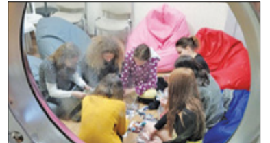
|| Konstancin-Jeziorna - Na pomoc nastolatkom s. 6