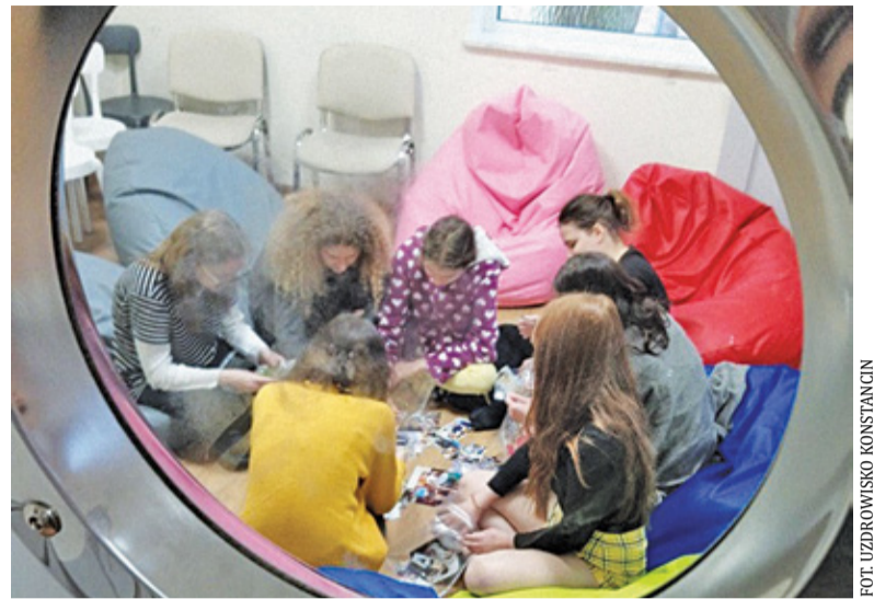
W ramach terapii odbywają się zarówno zajęcia grupowe, jak i indywidualne