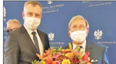
|| Góra Kalwaria - Odznaczony Złotym Krzyżem s. 4