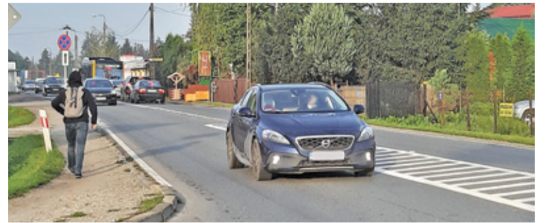
Nowy odcinek drogi wojewódzkiej 721 miałby przejąć ruch z wiecznie zakorkowanych ul. Słonecznej i Nowej