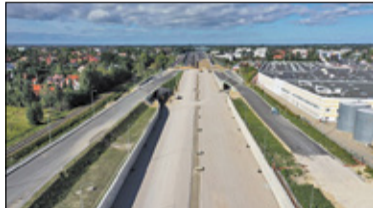
|| Warszawa - Cały ruch pod wiaduktem s. 2

PIASECZNO || GÓRA KALWARIA || KONSTANCIN-JEZIORNA || LESZNOWOLA || PRAŻMÓW || TARCZYN