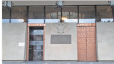
|| Lesznowola - Wójt stanęła przed sadem s. 4