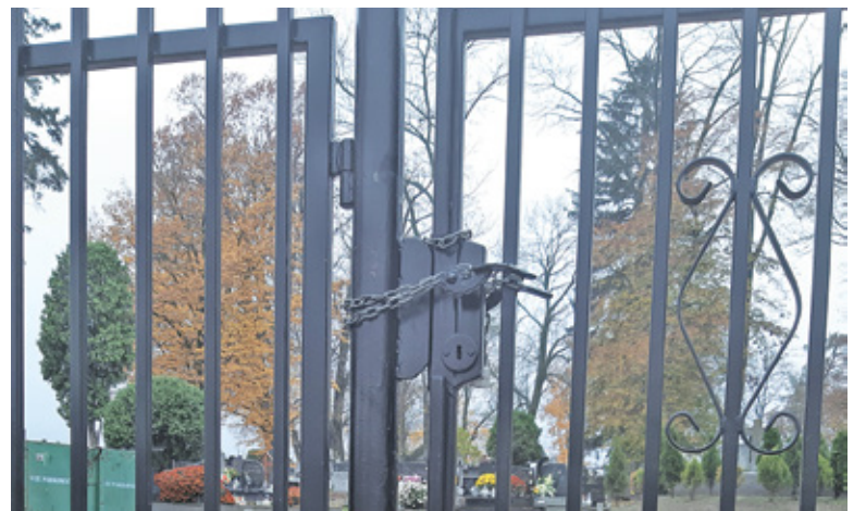
Zamknięcie cmentarnych bram zachęciło niektórych do zniszczenia zabezpieczeń

W niedzielę 1 listopada po południu policja zatrzymała trzech mężczyzn w wieku 31,32 i 37 lat oraz 28-letnią ko-