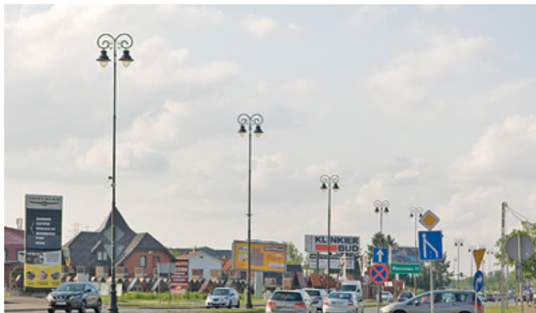
Wszelkie reklamy mają zniknąć z przestrzeni publicznej uzdrowiska

Wielkość szyldów informujących o prowadzonej na terenie danej nieruchomości działalności nie może przekraczać 3 m 2 w strefie A ochrony