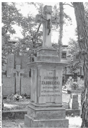
Pomnik Aleksandra Żaboklickiego przed renowacją lata 70.