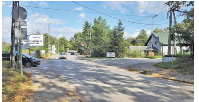
W internetowej ankiecie na lokalnym forum większość mieszkańców opowiedziała się za rondem

Zgodnie z deklaracją starosty, na nitce ul. Millennium biegnącej od strony Bogatek zostało już wykonane dodatkowe oznakowanie poziome i pionowe, zwracające uwagę na niebezpieczne skrzyżowanie. Poza tym zamontowano