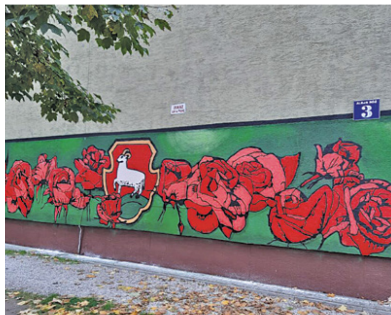
Różany mural zdobi budynek przy Alei Róż