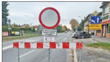
|| Piaseczno - Sprzedający narzekają na remont s. 4