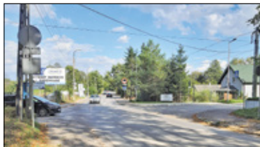
|| Głusków - Będzie rondo s. 2

PIASECZNO || GÓRA KALWARIA || KONSTANCIN-JEZIORNA || LESZNOWOLA || PRAŻMÓW || TARCZYN