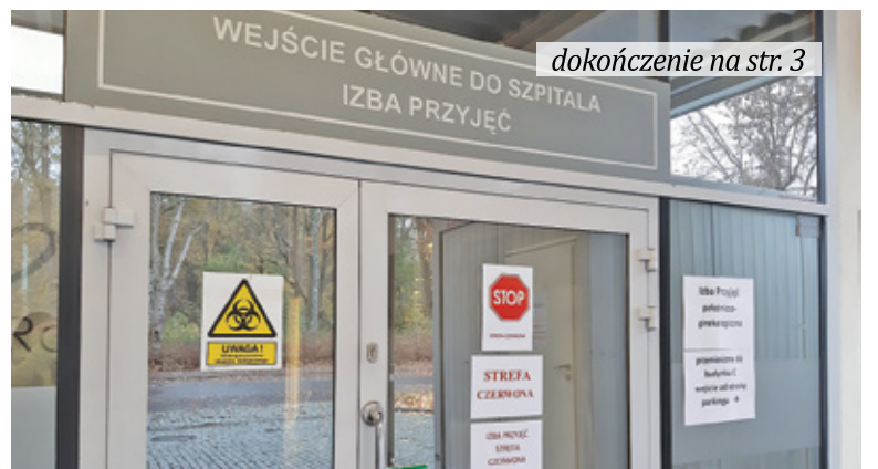
dokończenie na str. 3

- Taką informację przekazał zarządowi szpitala wojewoda mazowiecki. Oznacza to, że wszystkie 139 łóżek, którymi dysponujemy, będzie przeznaczony tylko dla pacjentów z pozytywnym wynikiem testu na SARS-CoV-2 - mówi Lidia Albrechowicz, dyrektor piaseczyń-