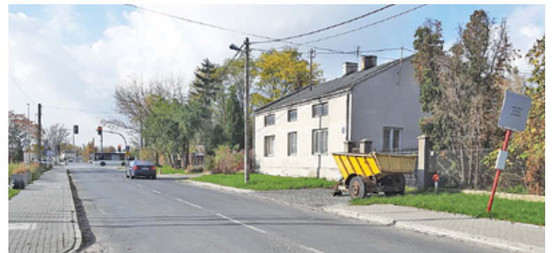
W ramach inwestycji m.in. zostanie przedłużony do ulicy Żytniej chodnik