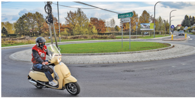
Rondo na skrzyżowaniu Żwirowej i Mazowieckiej w Bobrowcu

Ronda to najbezpieczniejsza forma skrzyżowań, jest to także sposób na spowolnienie ruchu na drogach, na których kierowcy rozwijają duże prędkości. Dodatkowo na ruchliwych skrzyżowaniach ograniczają korki na podporządkowanych ulicach – mówi starosta Ksawery Gut. – Dlatego od kilku lat staramy się je projektować tam gdzie się da.