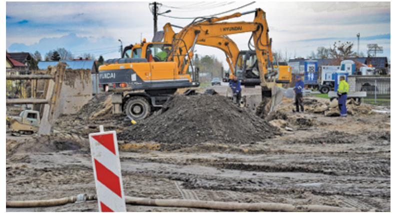
Budowa ronda w Krupiej Wólce

– To są skrzyżowania, na których dochodziło do wypadku za wypadkiem, zwłaszcza w Krupiej Wólce. Oczywiście