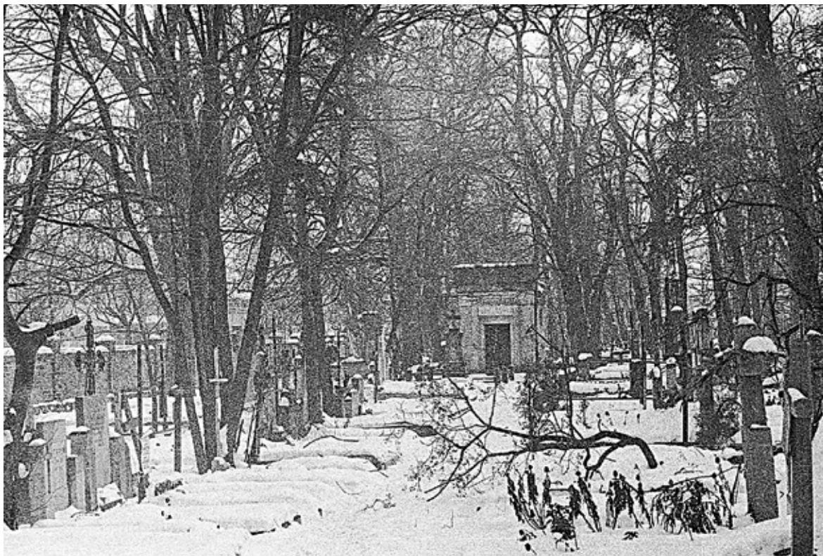
Piaseczno cmentarz parafialny lata wczesne 70.