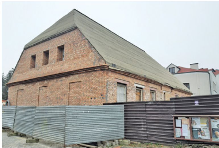
Budynek czeka na dalsze prace od wczesniej wiosny

Przebudowa Starej Plebani to chyba najbardziej niefortowna inwestycja piaseczyńskiego samorządu. Rozpoczęta trzy lata temu (pierwsze problemy pojawiły się już w momencie ogłoszenia przetargu), pierwotnie miała się zakończyć w 2018 roku. Najpierw znaleziono ludzkie szczątki, co na szczęście nie wstrzymało prac budowlanych, potem odkryto atrakcyjne piwnice, a przy okazji okazało się, że stan budynku jest gorszy niż zakładano. Projekt musiał ulec zmianie, co z kolei wymagało uzgodnień z konserwatorem i czasu na przeprowadzenie niezbędnych procedur. Szkielec odkryty brezentem stał miesiącami i straszyl w samym centrum miasta, między Ratuszem a zażytkowym kościołem św. Anny. Prace udało się wznowić dopiero w ubiegłym roku. Rosnące mury, a w końcu dach budynku, cieszyły oko mieszkańców, choć budziły i szereg wątpliwości co do zmian jakie zaszły w stosunku do pierwotnego projektu. I nagle wiosną prace stanęły w miejscu. Wykonawca tłumaczył się epidemią, ale ostatecznie latem gmina rozwiązała z nim umowę i zdecydowała o podzieleniu dalszych prac na etapy i samodzielne szukanie wykonawców.