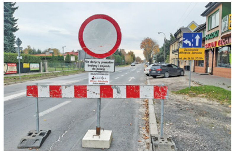
Informacja pod znakiem zakazu ruchu dopuszcza dojazd do posesji

wać dalej i prędzej czy później klienci wszystkich sklepów zostaną odcięci