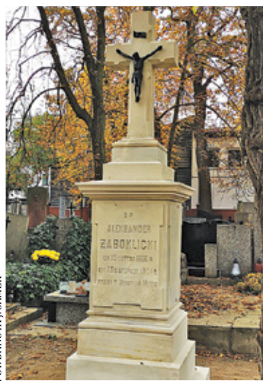
Pomnik Aleksandra Żaboklickiego po renowacji

staurował dwa interesujące mnie pomniki i przygotowuje następne do renowacji. Spróbowałam odszukać trochę informacji na temat osób związanych z jednym z tych starych grobów.