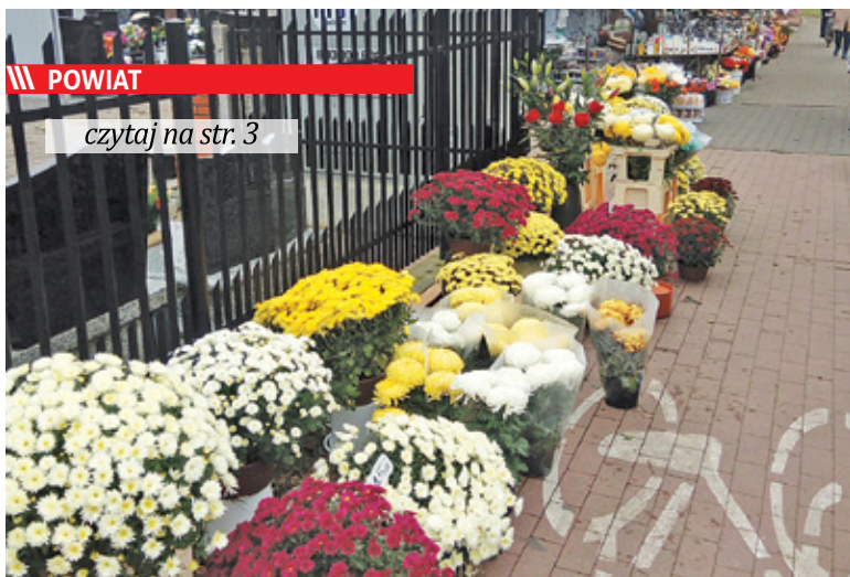
|| POWIAT czytaj na str. 3

Mieszkańcy szybko wykupili chryzantemy, z którymi sprzedawcy pojawili się pod zamkniętymi cmentarzami