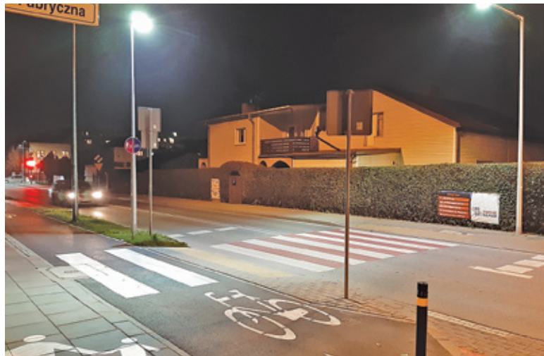
W mieście doświetlone jest już między innymi przejście przy ul. Powstańców Warszawy

punktach gminy. W mieście doświetlone zostaną przejścia na ul. Wojska Polskiego przy torach wąskotorówki