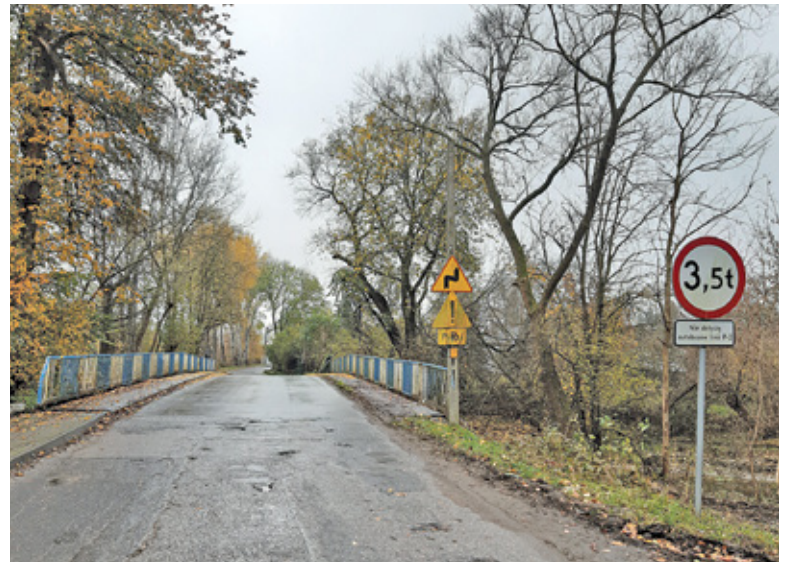
Modernizacja obejmie odcinek ulicy Dworskiej między ulicami Nadrzeczną a Wschodnią

– Trwają roboty przygotowawcze związane z zabezpieczeniem sieci na obiekcie mostowym – poinformował nas starosta Ksawery Gut. – Do połowy listopada zamkniemy możliwość przejazdu ulicą na cały okres budowy