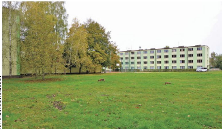
Stara sala i internat

Ostatnim elementem prac będzie malowanie elewacji całego komple-