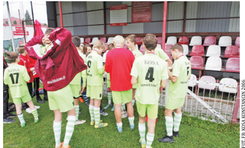
FOT. FB: KOSA KONSTANCIN 2006

– Cele i marzenia są po to, aby je realizować. W dniu dzisiejszym Kosa