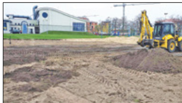
|| Góra Kalwaria - Lodowisko obok basenu s. 5