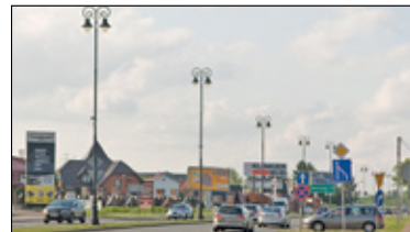
|| Konstancin-Jeziorna - Reklama tylko na rowerach s. 6