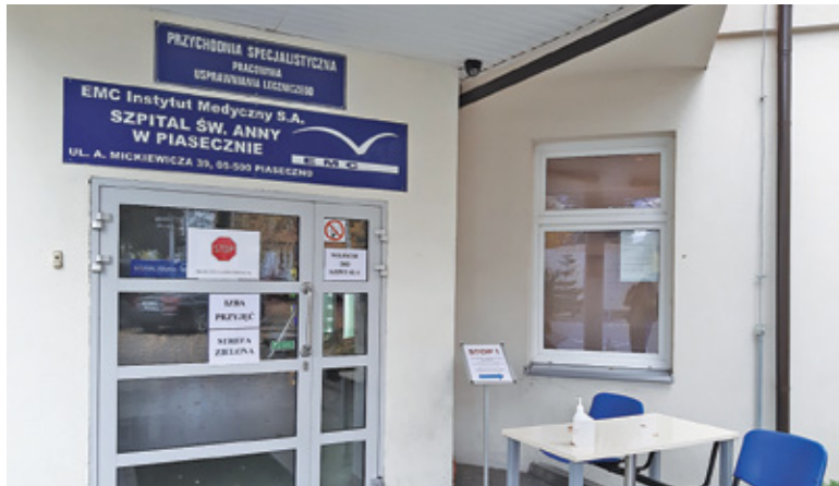
Wejście do przychodni oraz izba przyjęć szpitala zlokalizowane są z boku budynku

– Logistycznie jest to niewykonalne. Podobnie jak zbudowanie instalacji, której koszt to około 350-500 tys. zł, ale większym problemem jest to, że nie ma firm, które mogłyby ją wykonać – mówi. – Rozumiemy tę sytuację i nie uchylamy się od pomocy. Pracujemy z pacjentami covidowymi już od jakiegoś czasu, ale nie z tak wieloma.