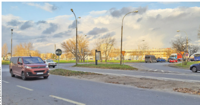
Skrzyżowanie zyska sygnalizację i wlot łącznika od ul. Puławskiej

Opracowana przez gminę koncepcja przewiduje dobudowanie łącznika, który pozwoli dostać się z ul. Puławskiej bezpośrednio do skrzyżowania z ul. Wojska Polskiego. Na ul. Wojska Polskiego i Okulickiego pojawią się dodatkowe pasy do skrętów, a skrzyżowanie objęte zostanie sygnalizacją świetlną zsynchronizowaną z tą na skrzyżowaniu z ul. Puławską. Przewidziano też wytyczenie przejścia dla pieszych na wysokości skateparku. Pojawia