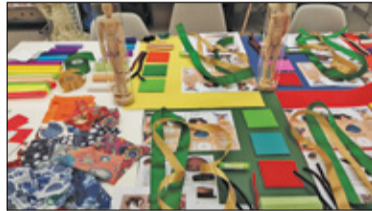
|| Kultura - Kultura żywa s. 2