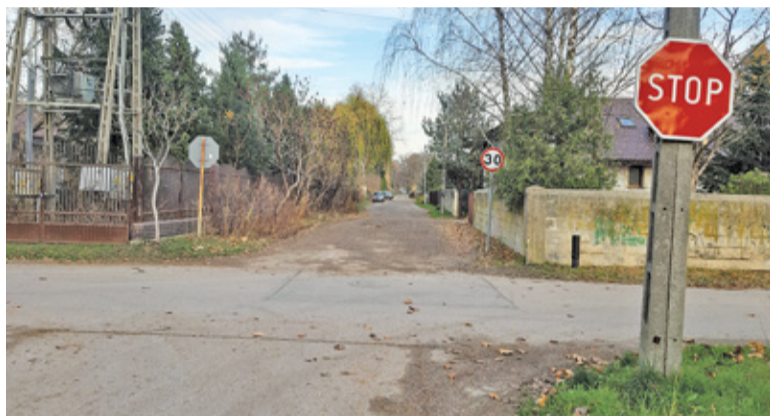
W 2021 roku ma się rozpocząć między innymi przebudowa ul. 11 Listopada

Ogółem na inwestycje w przyszłym roku gmina chce wydać ponad 124 mln złotych. Ponad połowa tej kwoty przeznaczona będzie na inwestycje drogowe. Wśród tych najdroższych znalazła się budowa ul. 11 Listopada, 10 KDL między Kierszkiem a Józefostawem oraz Cyraneczki w Julianowie. Aż 10 mln złotych miałyby zostać zainwestowanych w przebudowę ulic Geodetów, Rubinowej i Granitowej.