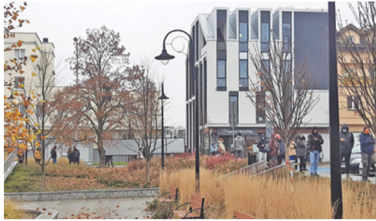
Chętnych do oddania krwi było znacznie więcej, niż mogli obsłużyć pracownicy stacji krwiodawstwa

N a środę 18 listopada zapowiedziano zbiórkę krwi w Piasecznie. Wprawdzie nigdy nie brakuje chętnych do podarowania innym tego cennego daru, ale tym razem frekwencja przeszła najsmielsze oczekiwania. Mimo deszczu i chłodu, kolejka do mobilnego laboratorium rozciągała się wokół Skweru Kisiela nawet na kilkadziesiąt metrów.