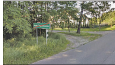
|| Góra Kalwaria - Zdania podzielone s. 5