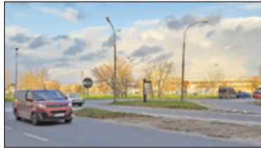
|| Piaseczno - Przebudują skrzyżowanie przy Laminie s. 4