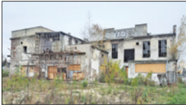
|| Piaseczno - Nowe drogi, Stara Mleczarnia s. 2