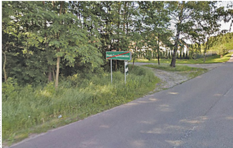
Większość głosujących z Krzaków Czaplinskowskich była przeciwna zmianie granic

W dniach 23 września – 21 października zapytano mieszkańców, co sądzą na temat zmiany granic miasta Góry Kalwarii. W konsultacjach mogli wziąć udział mieszkańcy sołectw Moczydłów,