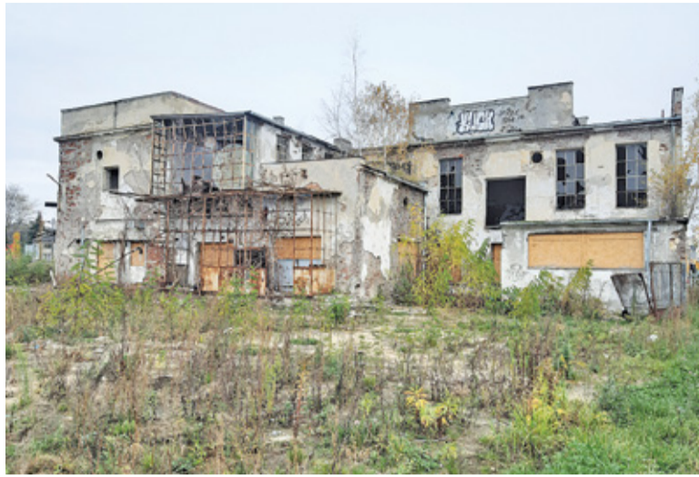
Radni zaproponowali, aby budynek zakryć siatką

Najbliższe otoczenie Starej Mleczarni zyskało nową jakość. Pytanie brzmi: co dalej ze szpecącą ruiną na rogu ulic Jana Pawła II i Dworcowej?