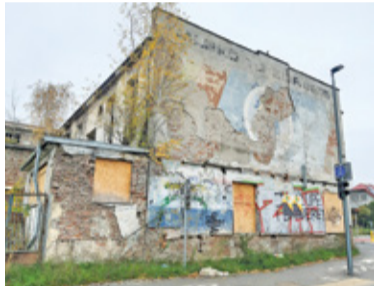
Budynek straszy na rogu ulic Dworcowej i Jana Pawła II od co najmniej dwóch dekad

Zgodnie z zapowiedziami gminy i powiatu, do końca listopada powinny zostać otwarte drogi, które spotykają się obok Starej Mleczarni. Teraz, kiedy cała okolica zyskała już nowe oblicze, niszczyjący od wielu lat budynek jeszcze bardziej kłuje w oczy. Zmodernizowane ulice, Centrum Edukacyjno-Multimedialne wraz z zapleczem sportowym z jednej strony oraz skwerem i placem zabaw z drugiej, to teraz najbliższe sąsiedztwo wpisanego do Gminnej Ewidencji Zabytków dawnego Domu Ludowego.