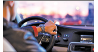
|| Kraj - Prawo jazdy może zostać w domu s. 5