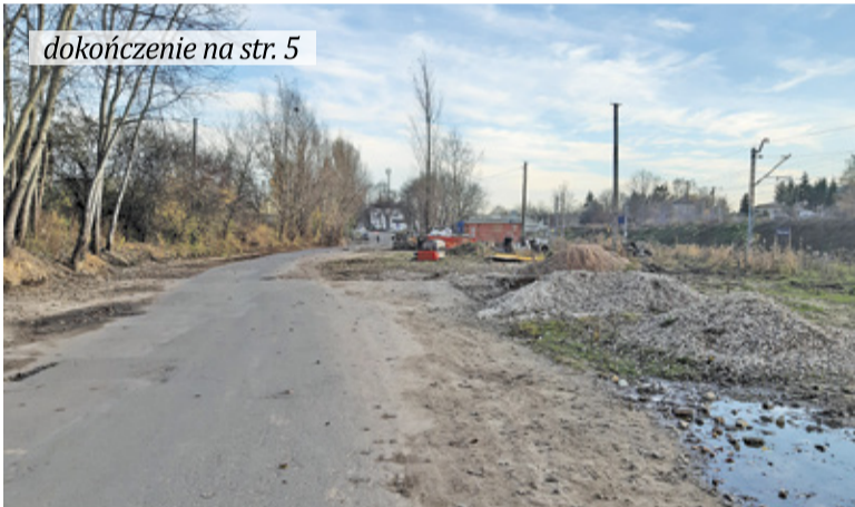
dokończenie na str. 5

Ulica Towarowa miała zostać utwardzona, zyskać ciąg pieszo-rowerowy i ponad 200 miejsc parkingowych