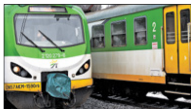
|| Powiat - Zmiany w rozkładach