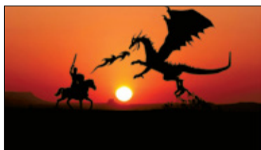
|| Żabieniec - Walczył ze smokiem