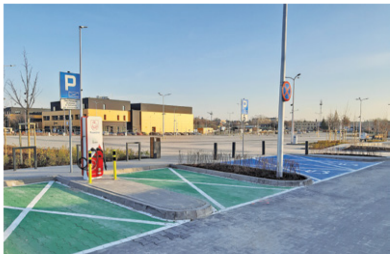
Po zachodniej stronie powstała nowa droga dojazdowa z miejscami parkingowymi

– Nawiązaliśmy współpracę z organizatorami wyprzedaży garażowych organizowanych przy ul. Dworskiej („Z Bagażnika”) i zachęcamy osoby, które