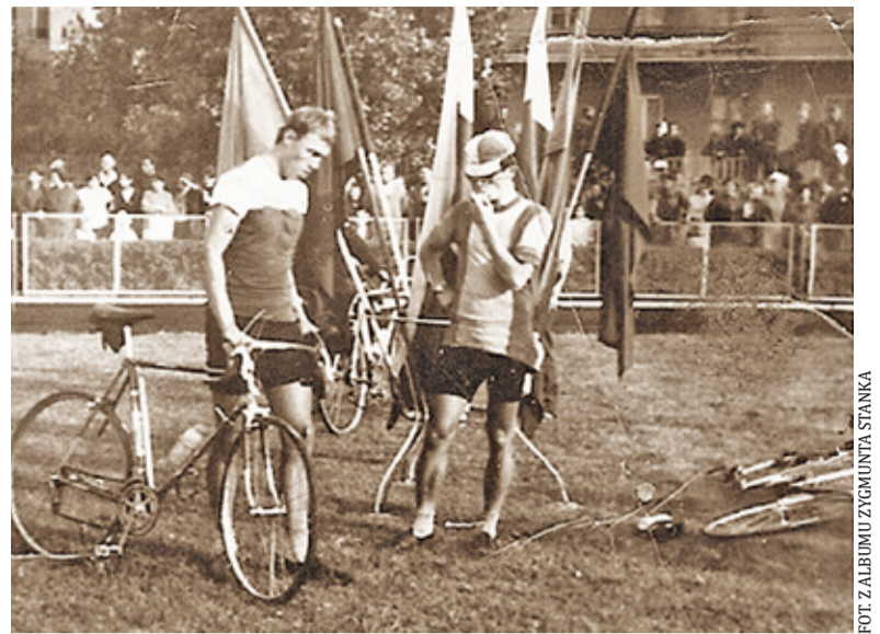
Wyścig dokoła Mazowsza 1969 r., kanapka po mecie w Płońsku

aury, pewnie – jak sam sądził – ważne było to, że ważył 65 kg, był szczupły i zwinny. Upał nie dawał mu się tak bardzo we znaki, co dawało mu przewagę nad innymi. Uwierzył w siebie i – jak to mówią po kolarstwie: wsadził łeb w kierownik, gryzł przedni widelec roweru i uciekał co sił w nogach, i wygrał Lotny Fisz w Opolu Lubelskim. Dalej jechał sam, już pojawiły się drogowaskazy mó-