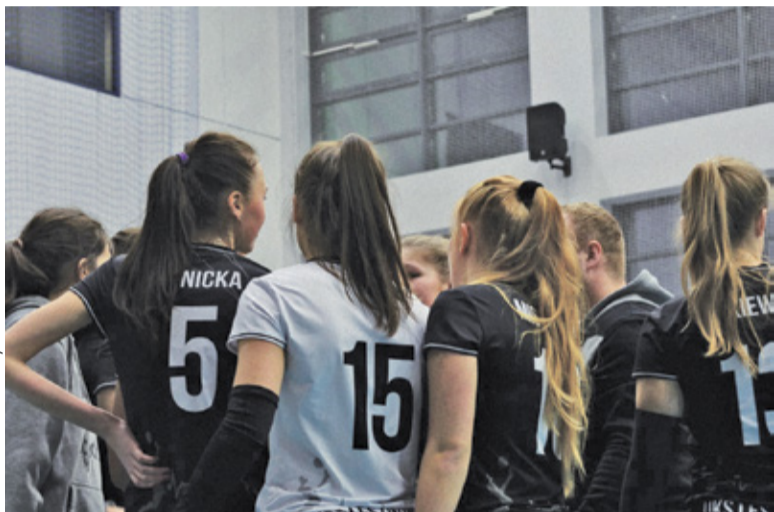
UKS Lesznów przegrał spotkanie po emocjonującym tie-breaku

UKS Lesznów zajmuje obecnie 8. miejsce w ligowej tabeli. Kolejna szansa na zdobycie punktów już w tę niedzielę – siatkarki trenowane przez