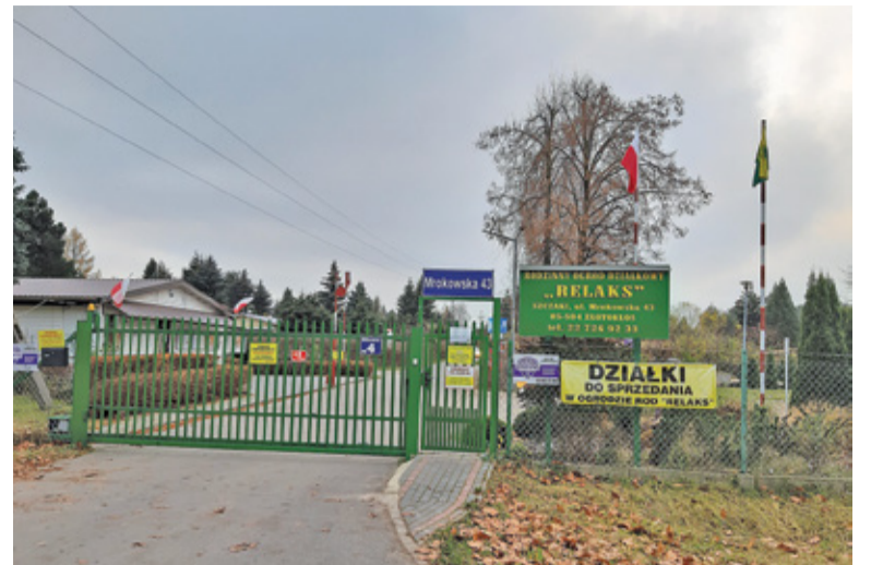
Ogródki działkowe po obu stronach ul. Mrokowskiej zajmują w sumie obszar 200 ha

– Te gigantyczne kompleksy działkowe stanowią zielone płuca dla całej zamieszkałej okolicy, pochłaniając CO2 – argumentują protestujący. Ma to tym większe znaczenie, że w okolicy, nieco na wschód od ogrodów działkowych, przebiegać będzie już trasa S7. Jeśli dodatkowo OAW powstałaby w przebiegu północnym na terenie powiatu piaseczyńskiego, okoliczni mieszkańcy mieliby kumulację związanych z tym uciążliwości.