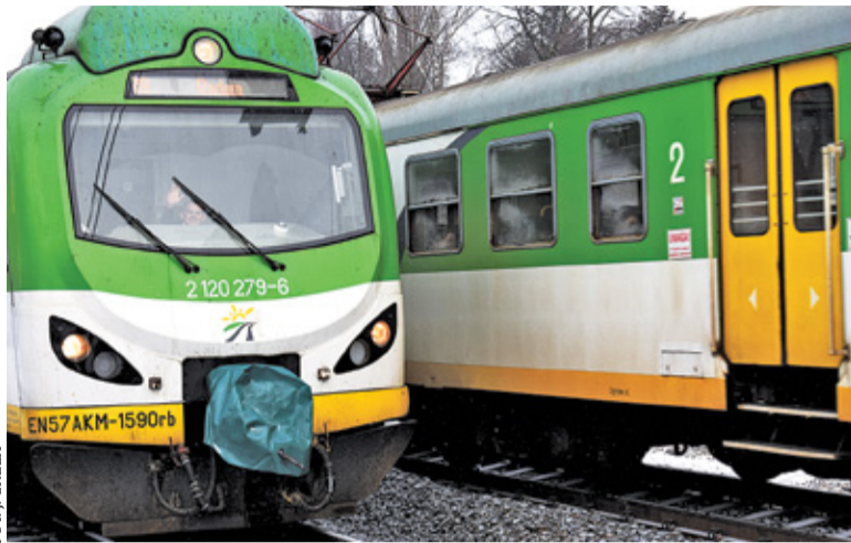
Nowe rozkłady mają obowiązywać do marca przyszłego roku

Modernizacja stacji rozpoczęła się już miesiąc temu, teraz jednak prace wchodzi w etap, w którym konieczne będzie wstrzymanie ruchu kolejowego. Część połączeń zostanie odwołana, a