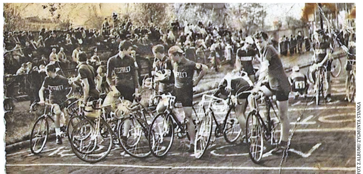
Start do III etapu Małego Wyścigu Pokoju, 1965 r., ulica Wolska, Stadion Sarmata

więcej o zbliżającej się mecie w Lublinie. Przed nim był przejazd kolejowy. Przed przejazdem wyprzedził go samochód