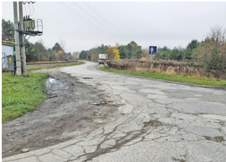
Stan ul. Działkowej jest wręcz legendarny. A dziurawe pobocze łatanie jest co chwilę

Tym razem podobno są już duże szanse na sukces. Jeśli uda się ostatecznie podpisać porozumienie między samorządami Piaseczna i Konstancina-Jeziorny, w 2021 roku miałyby się wreszcie rozpocząć projektowanie zarówno ul. Działkowej, jak i 10KDL i 4KL.