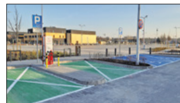
|| Piaseczno - Targowisko również w sobotę