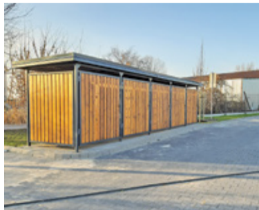
Kontenery na śmieci mają być ukryte w estetycznej altance

Zakończyły się prace modernizacyjne północnej części miejskiego targowiska w Piasecznie. Na placu zlokalizowanym między ulicami Nadarzyńską, Żytnią i Jana Pawła II pojawi się jeszcze niewielki kontenerowy budynek administracyjny. Oprócz utwardzonych alejek, na placu pojawiły się też pasy zieleni, ławki, oświetlenie, kosze na