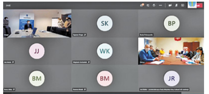
Przybyli do urzędu nauczyciele nie ukrywali sporych emocji w związku z zamieszaniem i brakiem terminowych wypłat

Na sesji Rady Gminy Góra Kalwaria, która po przerwie była kontynuowana w środę 2 grudnia, pojawili się przedstawiciele związków zawodowych pracowników oświaty. Miało to związek z opóźnieniem wypłaty pensji, o czym pisaliśmy w ubiegłym tygodniu. Nauczyciele podkreślili, że nie interesują ich wewnętrzne utarczki w Radzie i oczekują wypłaty wynagrodzenia w terminie. Zwrócili uwagę, że wbrew twier-