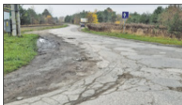
|| Kierszek, Józefosław - Działkowa. Kolejne podejście