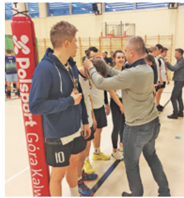
Nagrody dla zawodników mikołajkowego turnieju

W turnieju wzięło udział 16 drużyn. W sobotę 5 grudnia rozegrano eliminacje, które wyłoniły najlepsze zespoły. Rywalizacja zwycięzców eliminacji miała miejsce dzień później. Każdy da-