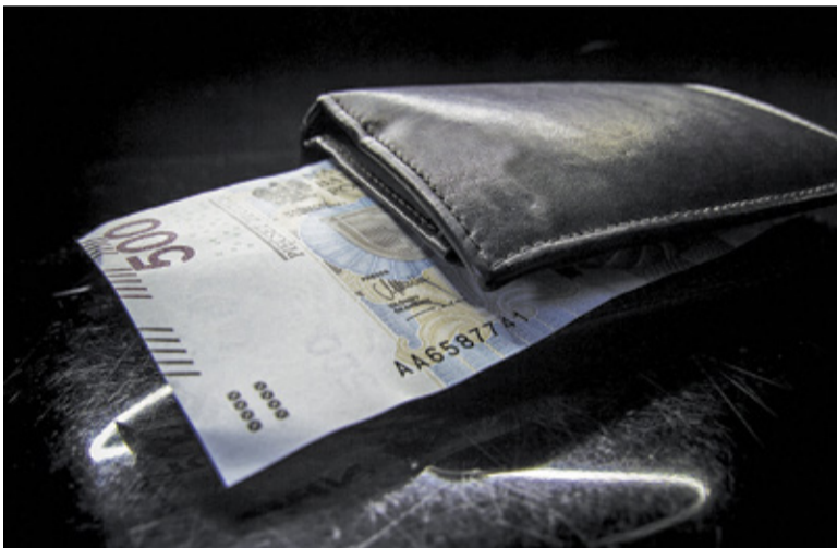
Jeśli nie złożymy wniosku w terminie, grozi nam utrata świadczenia

Tegoroczne świadczenia w ramach 500+ przez długi czas stały pod znakiem zapytania. Od czasu do czasu pojawiały się doniesienia o możliwym zawieszeniu programu lub zmianie formy świadczenia – zamiast gotówki rodziny rzekomo miałyby otrzymywać bony. Takie rozwiązanie sugerowała m.in. była minister rozwoju Jadwiga Emilewicz.