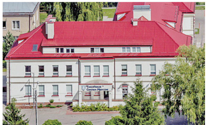
Lockdown źle wpływa na psychikę dzieci i młodzieży

Realizując zintegrowany projekt „Deinstytucjonalizacja szansą na dobrą zmianę” Tarczyńskie Centrum Medyczne ma na celu pomoc młodym osobom doświadczającym kryzysu psychicznego w miejscu zamieszkania, w szkole, w najbliższym dziecku środowisku, czyli w formule innej niż tradycyjna pomoc ambulatoryjna. W system pomocy zaangażowani więc będą również pedagodzy i psychologowie szkolni, asystenci rodzin w systemie pracy Ośrodków Pomocy Społecznej i inne podmioty