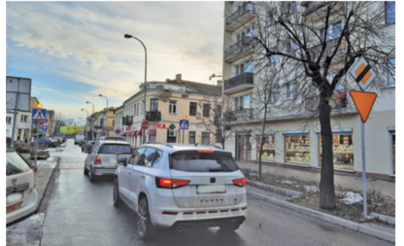
Kierowcy narzekają przede wszystkim na korki na ul. Kościuszki

– Ulice Puławska i Kościuszki powinny stać się „salonem” naszego miasta i powodem dumy jego mieszkańców, a nie być jedynie „główną arterią miasta”. Opieranie przyszłości i aktywności gospodarczej centrum miasta jedynie na ruchu tranzytowym może się okazać krótkowzroczne szczególnie w kontek-