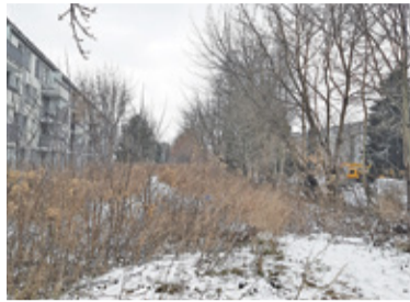
Gmina zamierza kupić pas działki na przedłużeniu ul. Jasińskiego

Mieszkańcy osiedli zlokalizowanych między ulicami Bema i Poniatowskiego z entuzjazmem przyjęli informację o planie utworzenia przez gminę terenu zielonego przy ul. Jasińskiego.