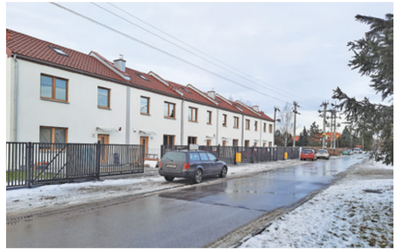
Zdaniem mieszkańców niektóre budynki trudno uznać za zabudowę jednorodziną czy nawet bliźniaczą

Burmistrz przyjrzał się planom i realiom i zaproponował doprecyzowanie zapisów mpzp tak, by uniemożliwić dowolną interpretację pojęcia „zabudowa bliźniacza”. Po podjęciu uchwały w sprawie przystąpienia do zmiany