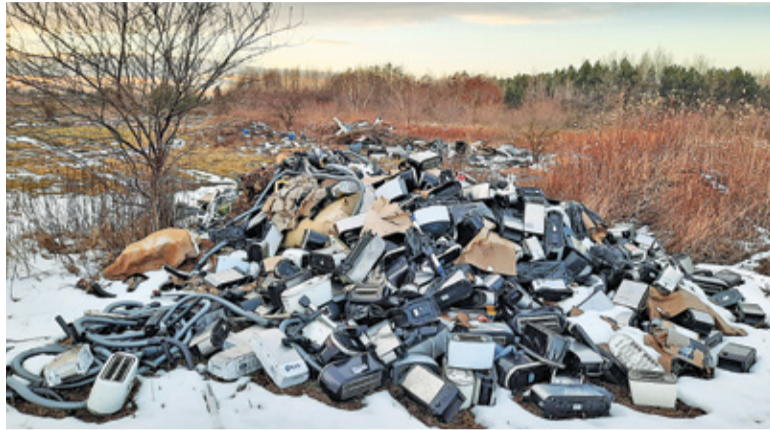
Najnowsza górka śmieci to głównie tostery jednej firmy

Policja potwierdza przyjęcie zgłoszenia od właściciela terenu 19 stycznia. Jak twierdzą okoliczni mieszkańcy, śmieci na tym terenie wyrzucane są od co najmniej 3 do 5 lat. Stopień rozkładu niektórych śmieci czy porośnięcie