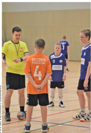
Z Victorii do Kadry

Pierwszego dnia imprezy swoje mecze rozgrywały dzieci z rocznika