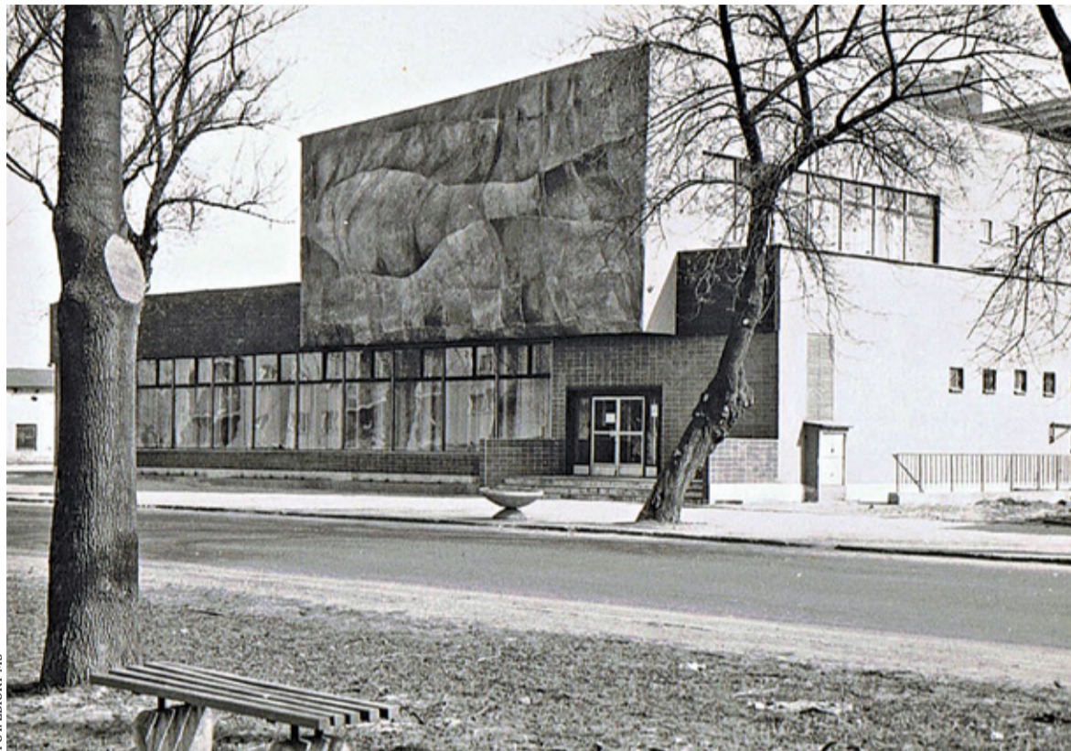
Piaseczno, restauracja Panorama przy ul. Puławskiej

Wspominamy restaurację ze strip-tizem, papierosami z Pewexu od szatniarza, charyzmatycznego mistrza olimpijskiego, co został kabareciarzem i galerię o tajemniczej nazwie Mukine.