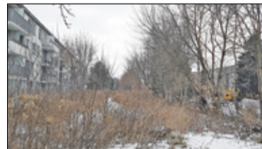
|| Piaseczno - Pas zieleni między blokami s. 5