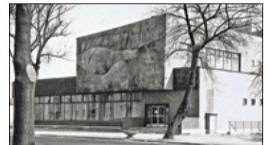
|| Historia - Tu zaszła zmiana: Panorama s. 8