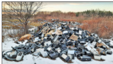
|| Łązy - Góra śmieci leży na polu s. 4