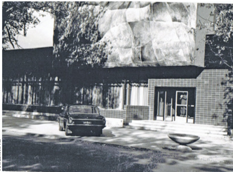
Restauracja Panorama w 1981 r.

napisz do autorki m.szturowska@przekladpiaseczynski.pl