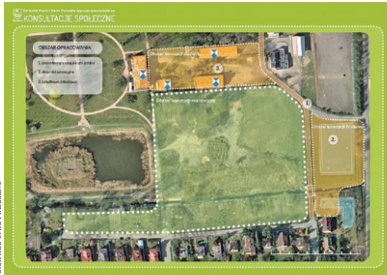
Konsultacje dotyczą południowo-wschodniej części parku miejskiego

Gmina postanowiła zapytać mieszkańców o to, czego im najbardziej brakuje w parku i jak chcieliby zagospodarować rekreacyjny teren w centrum miasta. Konsultacje w sprawie zago-