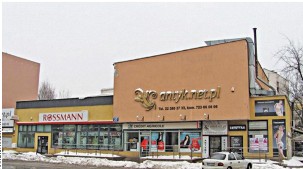
Zdjęcie budynku z 2014 r.

na było zjeść obiad, kolację, pośmiać się w czasie występu kabaretowego lub zobaczyć striptiz. I oczywiście potaćczyć