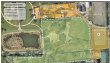
|| Piaseczno - Mieszkańcy mają głos s. 2