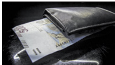
|| Kraj - Zmiany w 500+ s. 3