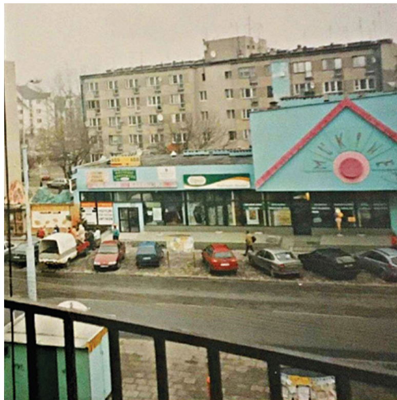
Galeria Handlowa Mukine

Kilka lat później powstało w budynku centrum handlowe pod nazwą Mukine, prekursor hipermarketów. Sala została podzielona na moduły, zorganizowano tu sklepiki z ubraniami, gazeta-