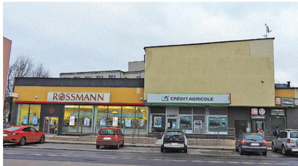
Zdjęcie budynku z 2021 r.